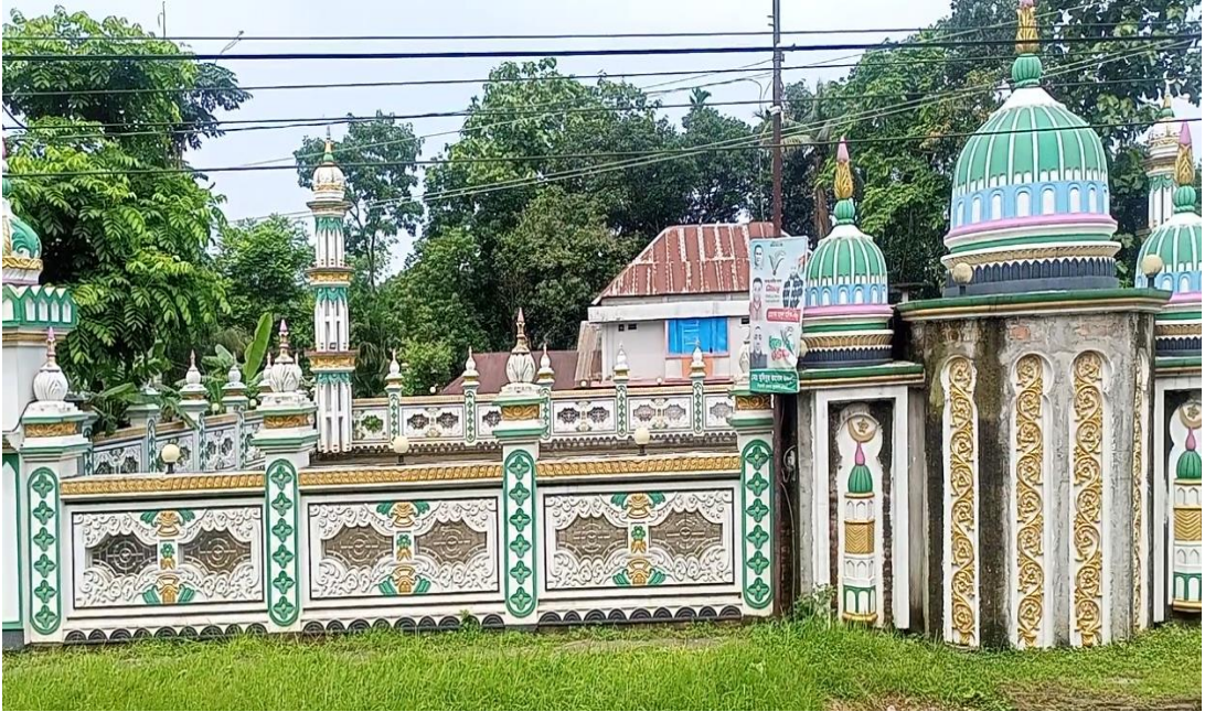
ওয়াক্ফ প্রশাসক কর্তৃক হযরত শাহ তৈয়ব হৈলানী (রহ.) মাজার ওয়াক্ফ এস্টেট পরিদর্শন