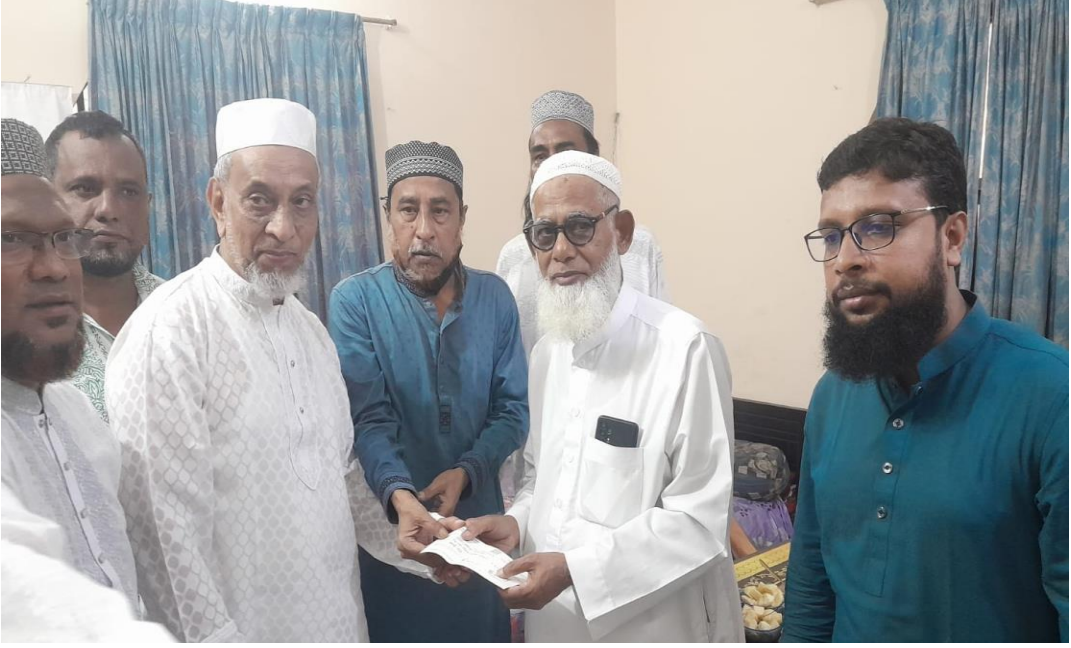
হযরত শাহ পরান (রহ:) এর মাজার ওয়াকফ এন্স্টেটের মোতাওয়ালী কর্তৃক ওয়াকফ কম্বিবিউশনের চেক হস্তান্তর