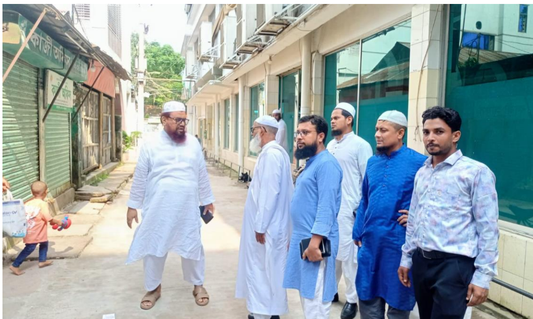
এস্টেটের মোতাওয়াল্লী কর্তৃক ওয়াক্ফ প্রশাসককে এস্টেটের বিভিন্ন স্থাপনা সম্পর্কে ব্রিফিং প্রদান