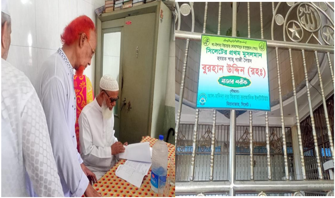
হযরত শাহ্ গাজী সৈয়দ বুরহান উদ্দিন (রহ:) মাজার ওয়াক্ফ এন্ডেট পরিদর্শন