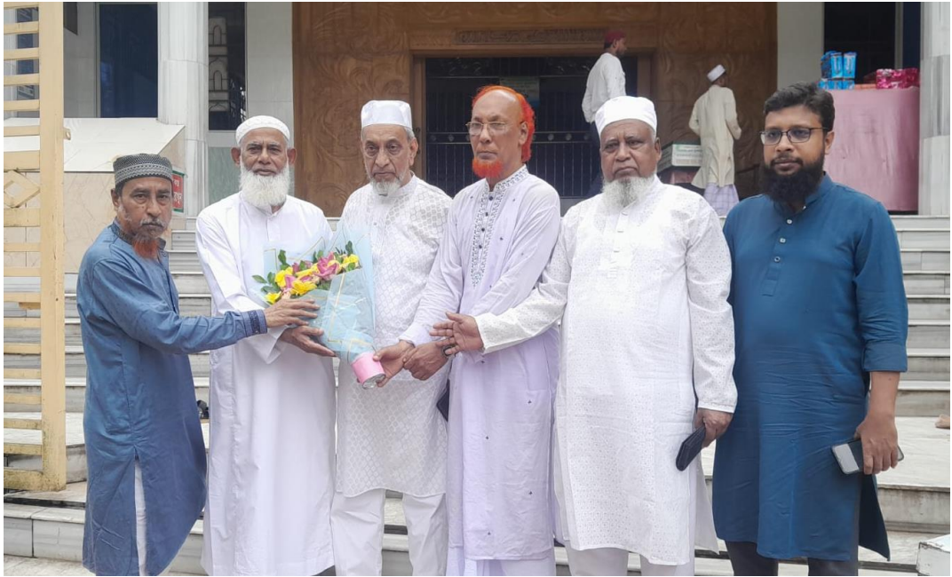
সিলেটের প্রথম মুসলমান হযরত শাহ্ গাজী সৈয়দ বুরহান উদ্দিন (রহ:) মাজার ওয়াকফ এন্স্টেটের মোতাওয়ালী ওয়াকফ প্রশাসক স্যারকে ফুলেল শুভেচ্ছা প্রদান করেন