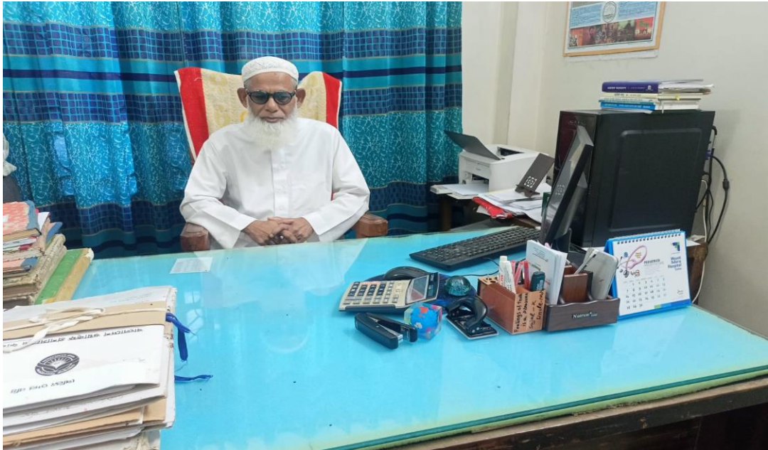
ওয়াক্ফ প্রশাসক কর্তৃক ওয়াক্ফ পরিদর্শকের কার্যালয়, সিলেট পরিদর্শন