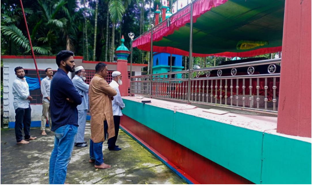
ওয়াক্ফ প্রশাসক কর্তৃক হযরত শাহ তৈয়ব হৈলানী (রহ.) মাজার ওয়াক্ফ এস্টেট পরিদর্শন

ওয়াক্ফ প্রশাসক সিলেট জেলার দক্ষিণ সুরমা উপজেলাধীন হযরত শাহ তৈয়ব হৈলানী (রহ.) মজার ওয়াক্ফ এস্টেট পরিদর্শন করেন। এসময় ওয়াক্ফ প্রশাসক হযরত শাহ তৈয়ব হৈলানী (রহ.) মাজার জিয়ারত করেন এবং উপস্থিত স্থানীয় ব্যক্তিবর্গ, মোতাওয়াল্লী ও কমিটির সদস্যগণকে নিজেদের মধ্যে বিরাজমান দ্বন্দ্ব নিরসন করে সকলে সম্মিলিত ভাবে ওয়াক্ফ এস্টেট পরিচালনার জন্য এবং এস্টেটের আয় বৃদ্ধির নিমিত্ত উন্নয়নমূলক কার্যক্রম গ্রহণের পরামর্শ প্রদান করেন এবং ওয়াক্ফ হিসাব নিরীক্ষককে এস্টেটটি দ্রুত অডিট করার নির্দেশ প্রদান করেন।