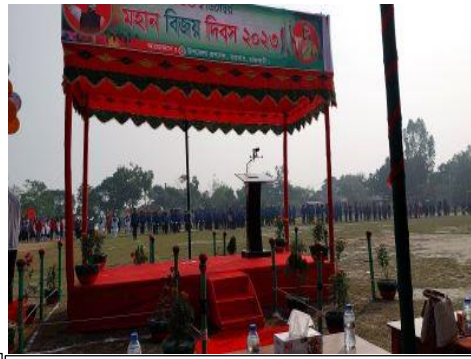
[২.৩.১] কর্মকর্তা, শিক্ষক এবং শিক্ষার্থীদের সৃজনশীল প্রতিভা বিকাশে বিভিন্ন দিবস উদযাপন