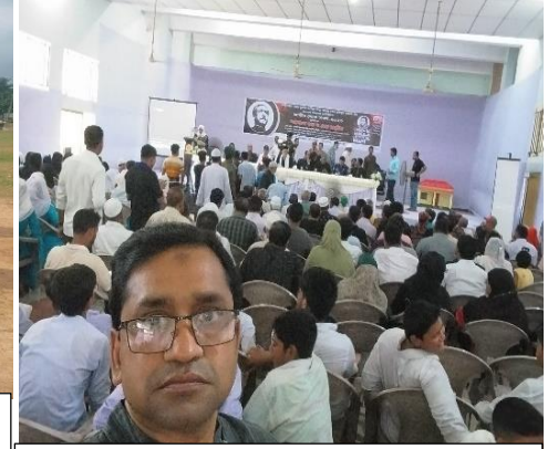
বিভিন্ন দিবস উদযাপন