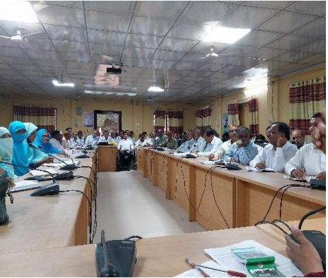
[৩.২.১] প্রতিমাসে প্রধান শিক্ষকদের মাসিক সমন্বয়সভায় অংশগ্রহণ