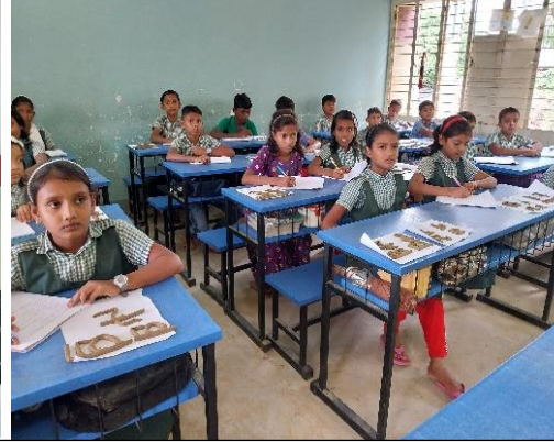
[৩.৩.১] ল্যাপটপ ও মাল্টিমিডিয়া প্রাপ্ত বিদ্যালয়ে ল্যাপটপ ব্যবহার পরিবীক্ষণকৃত