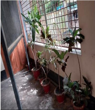
[৩.৪.১] নির্ধারিত সময়ের মধ্যে ফুলের বাগান/ফুলের টব দিয়ে ইউআরসি/টিআরসি সজ্জিতকরণ