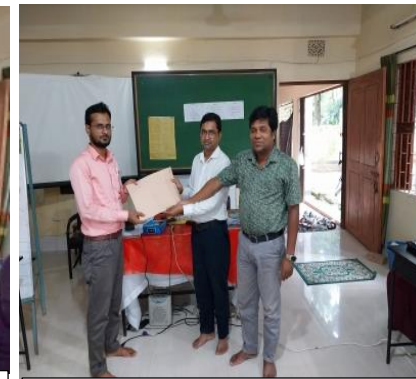
[১.১.২] নির্ধারিত সময়ের মধ্যে নৈতিকতা ও সততার দৃষ্টান্তস্বরূপ ২ (দুই) জন প্রশিক্ষার্থীকে পুরস্কৃতকরণ