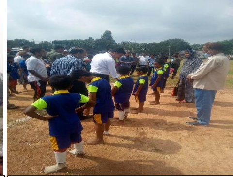
[২.৩.১] কর্মকর্তা, শিক্ষক এবং শিক্ষার্থীদের সৃজনশীল প্রতিভা বিকাশে বিভিন্ন দিবস উদযাপন