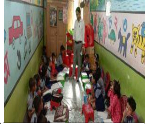
প্রাক-প্রাথমিক শ্রেণিপাঠদান পর্যবেক্ষণ