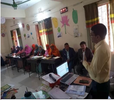
[১.১.৩] নৈতিকতা ও শুদ্ধাচার বিষয়ে অনুষ্ঠিত মতবিনিময় সভা