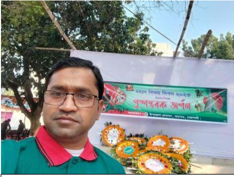
[২.৩.১] কর্মকর্তা, শিক্ষক এবং শিক্ষার্থীদের সৃজনশীল প্রতিভা বিকাশে বিভিন্ন দিবস উদযাপন ও উৎসবে প্রকাশিত দেয়াল পত্রিকা