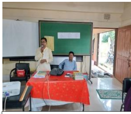
[১.১.১] প্রশিক্ষণ সূচীতে অন্তর্ভুক্ত নৈতিকতা বিষয়ে অনুষ্ঠিত আলোচনা