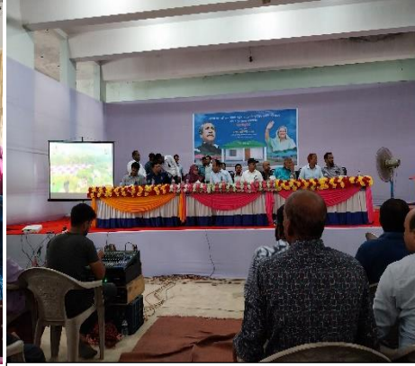
সমস্বয় সভায় যোগদান