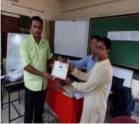
প্রশিক্ষণে অংশগ্রহণকারীদের মাঝে সনদ প্রদান