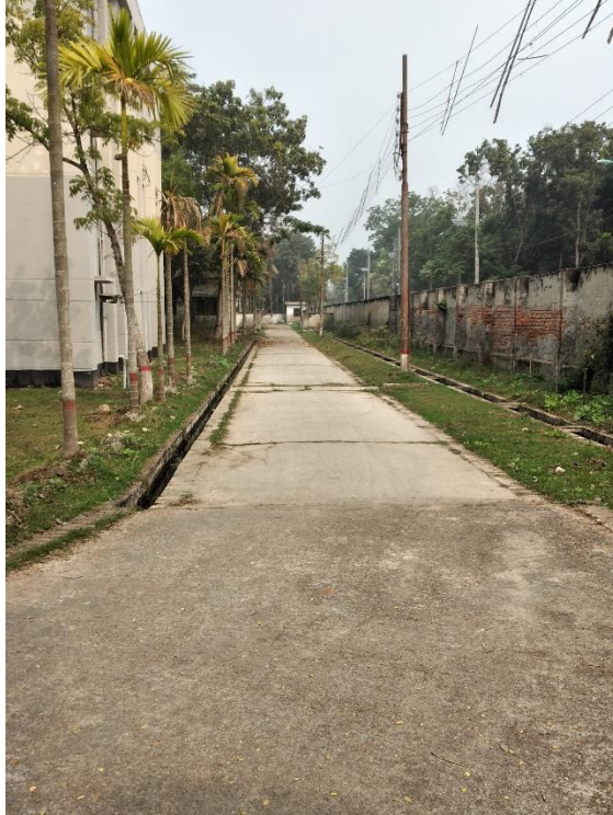
চিত্র ৯: কলেজের অভ্যন্তরীণ ড্রেন ও সীমানা প্রাচীর