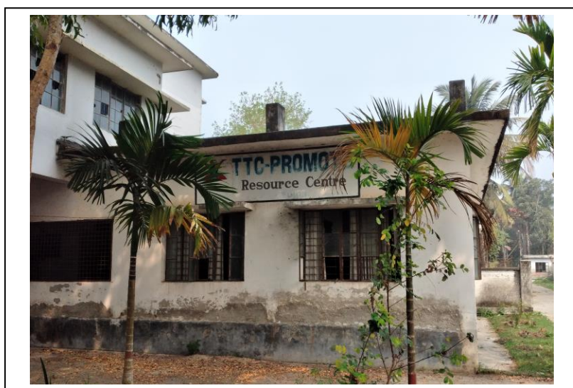
চিত্র ১৩: কলেজ ক্যাম্পাসে অবস্থিত প্রমোট রিসোর্স সেন্টার