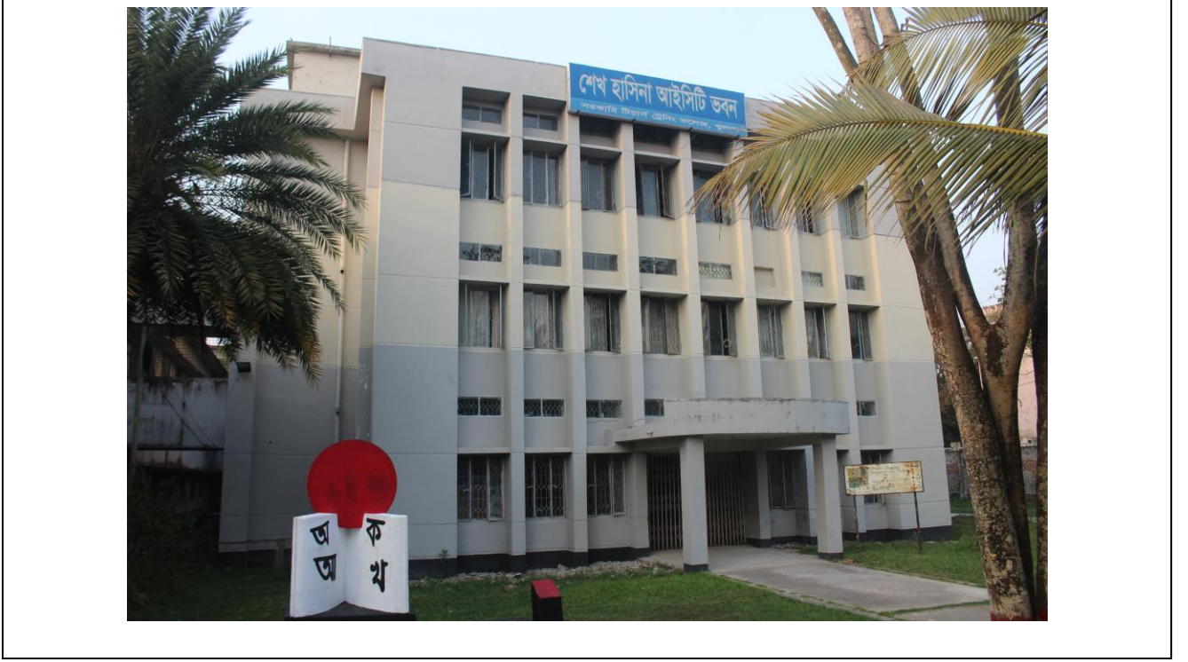
চিত্র ২: শেখ হাসিনা আইসিটি ভবন