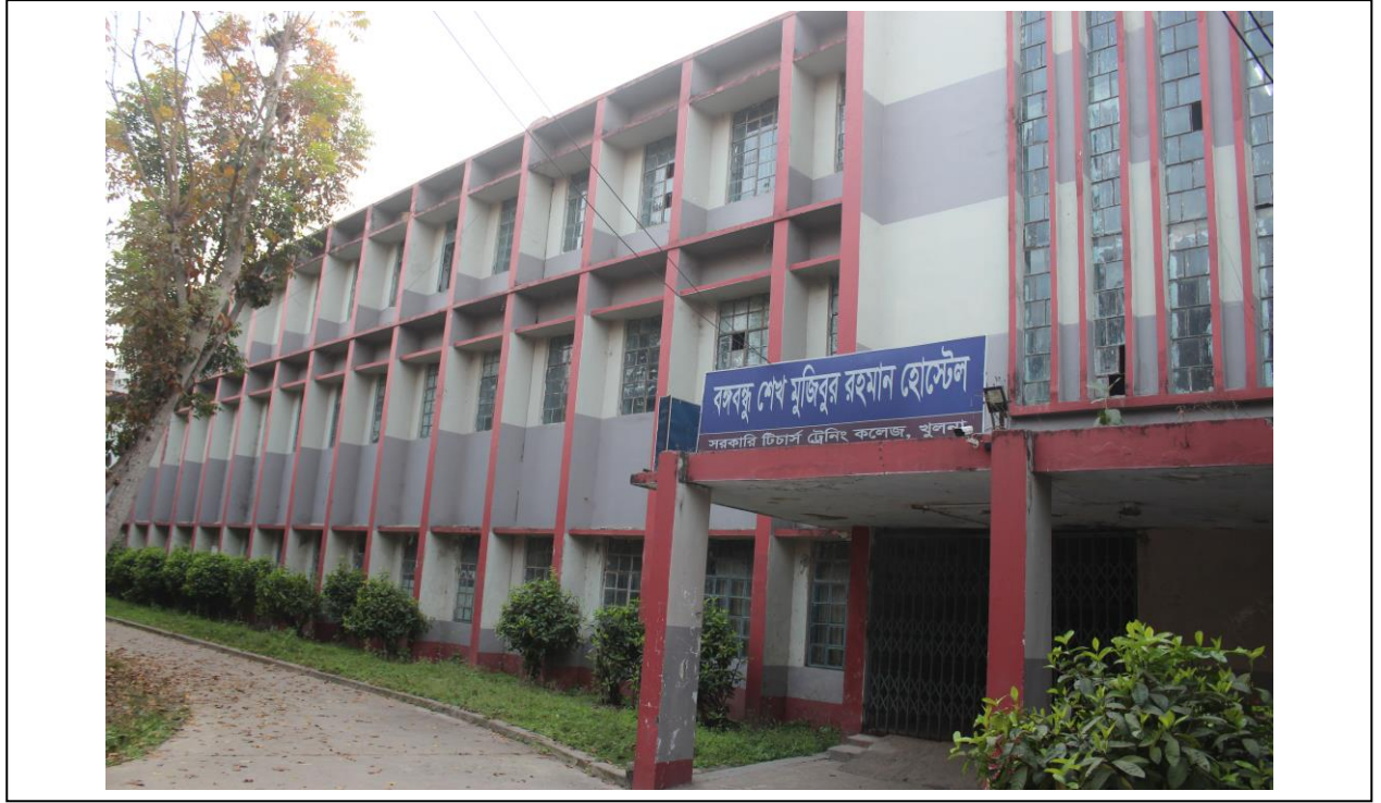
চিত্র ৩: বঙ্গবন্ধু শেখ মুজিবুর রহমান হোস্টেল ভবন