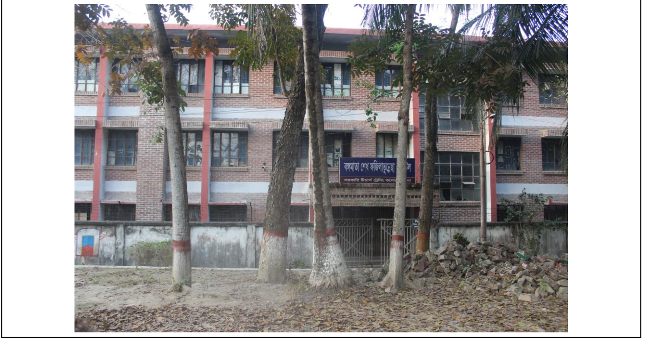
চিত্র ৪: বঙ্গমাতা শেখ ফজিলাতুন্নেছা হোস্টেল ভবন