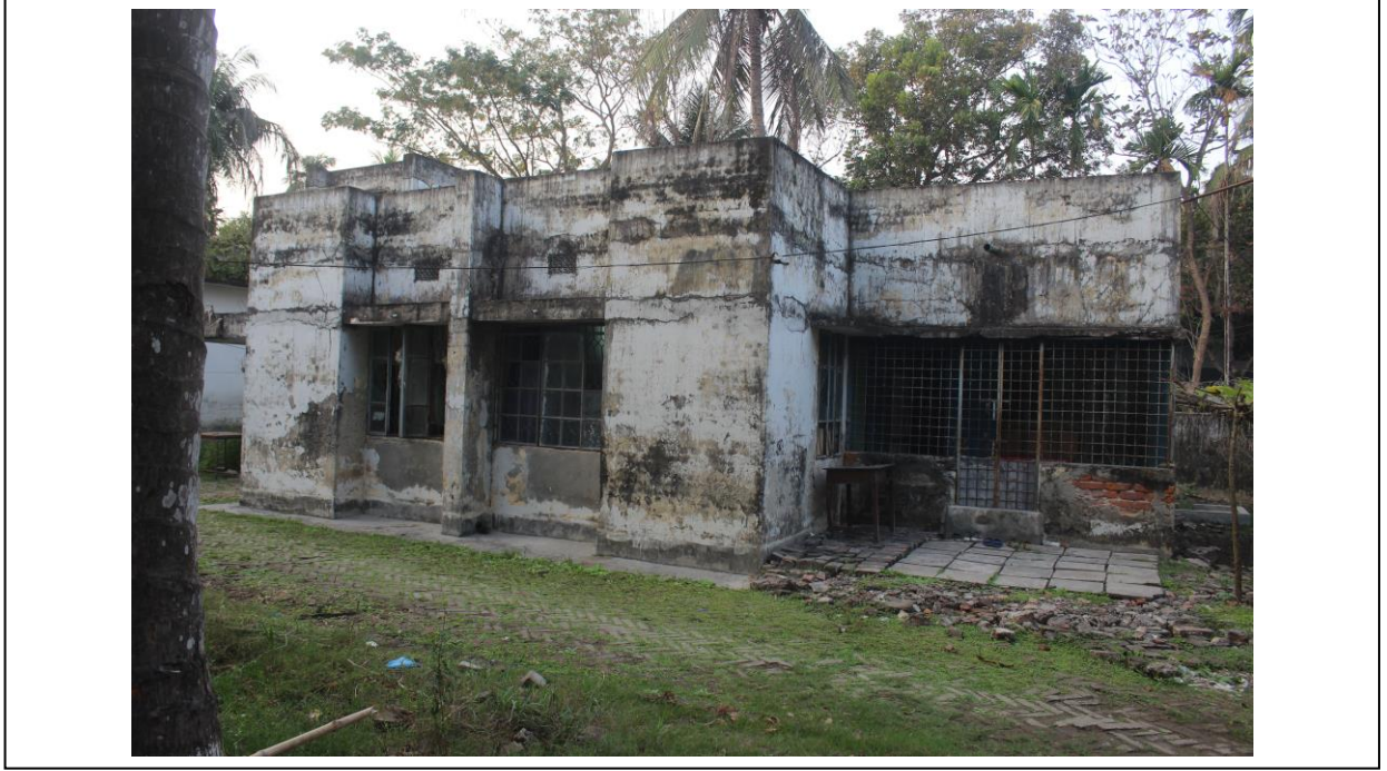
চিত্র ৬: ডি ডি কোয়ার্টার