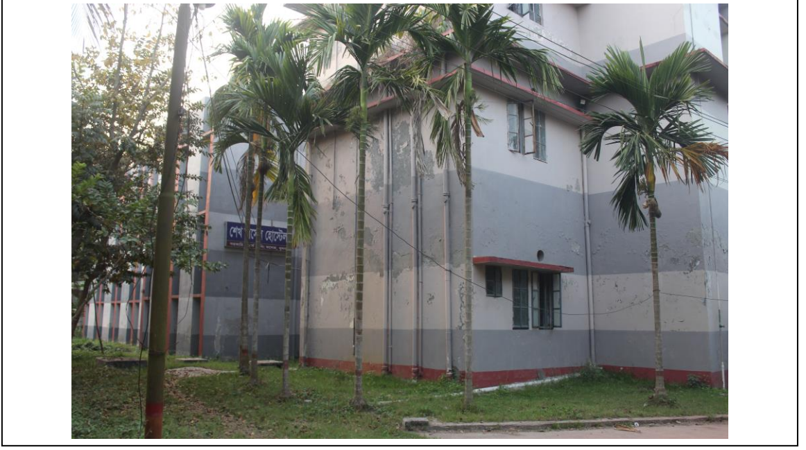
চিত্র ৫: শেখ রাসেল হোস্টেল ভবন