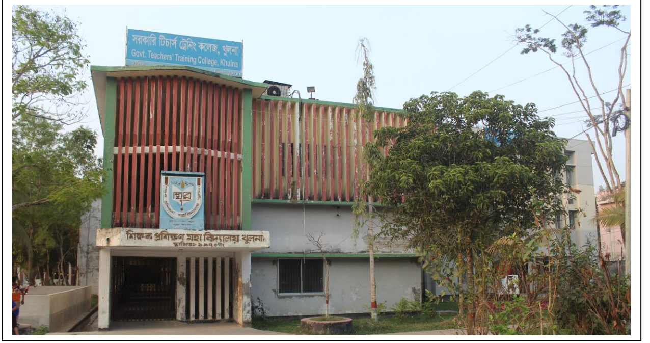
চিত্র ১: একাডেমিক ভবন