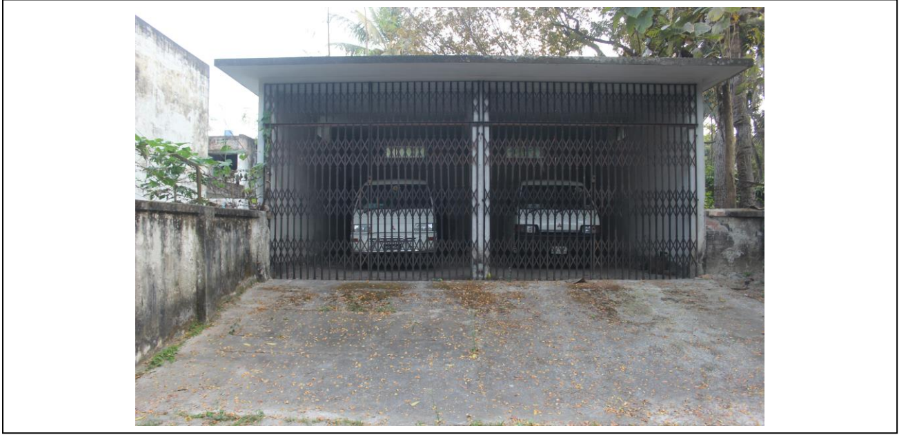
চিত্র ৮: গাড়ির গ্যারেজ