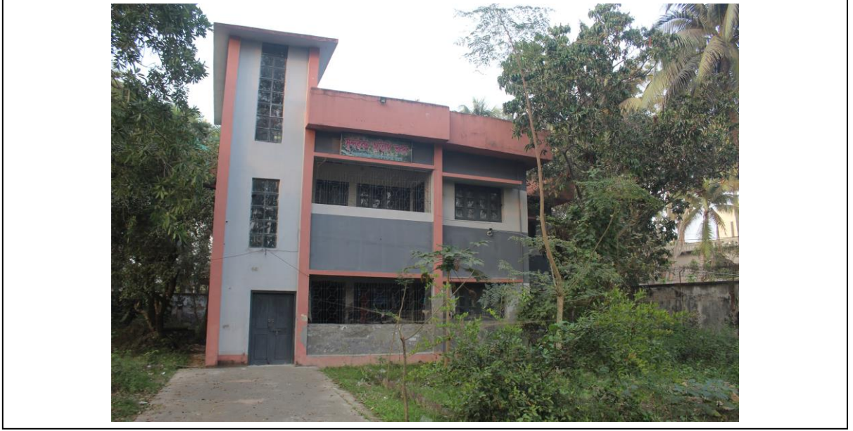
চিত্র ৫: সুন্দরবন অতিথি ভবন