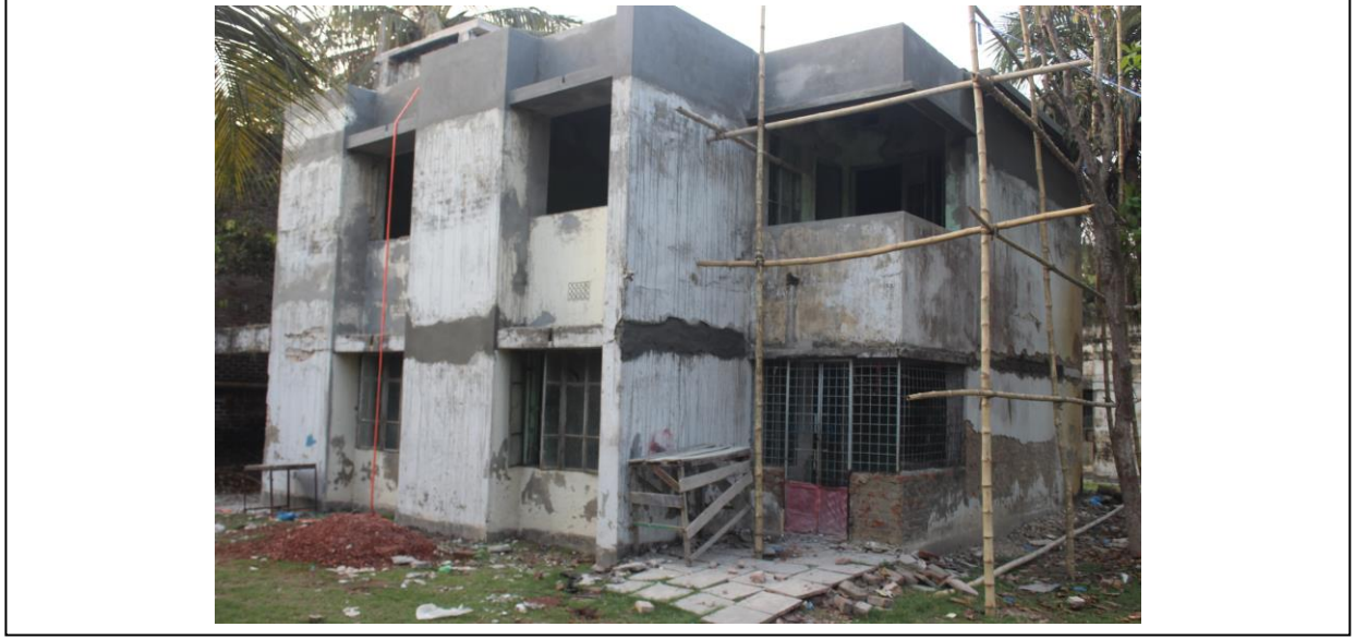
চিত্র ৭: সুপার কোয়ার্টার-২