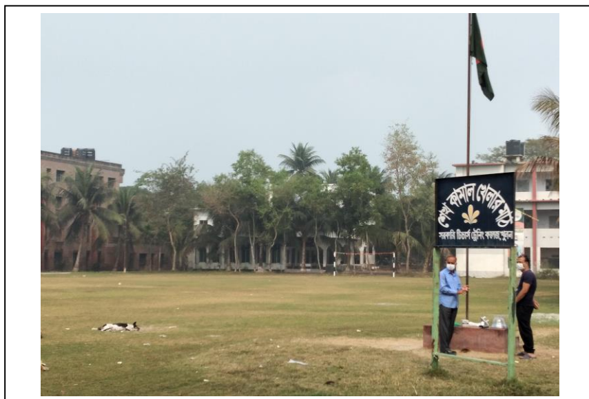
চিত্র ১২: কলেজ ক্যাম্পাসে অবস্থিত শেখ কামাল খেলার মাঠ