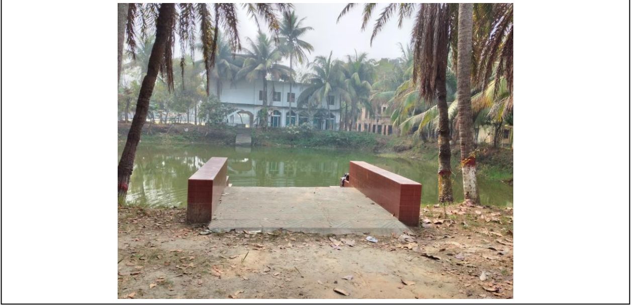
চিত্র ১৪: কলেজ ক্যাম্পাসে অবস্থিত পুকুর