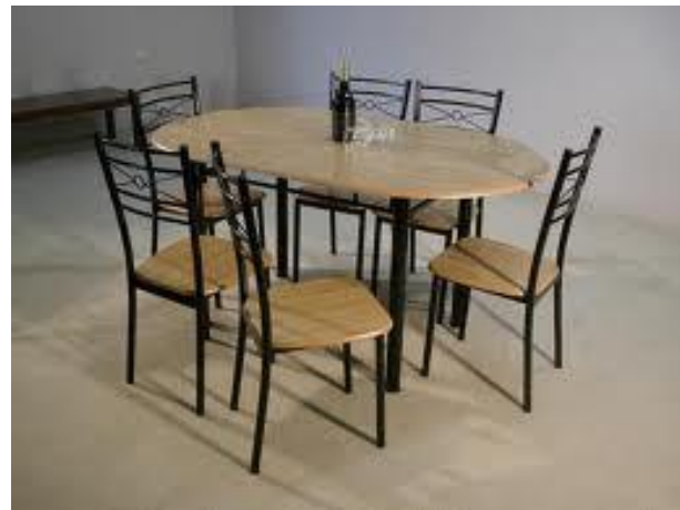
টেবিল চেয়ার সেট