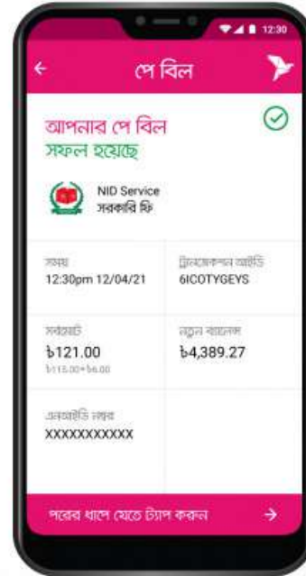
পে বিল সফলভাবে সম্পন্ন হলে কনফার্মেশন পাবেন