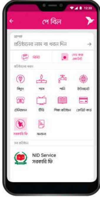
এরপর সরকারি ফি ট্যাপ করে NID Service সিলেক্ট করুন