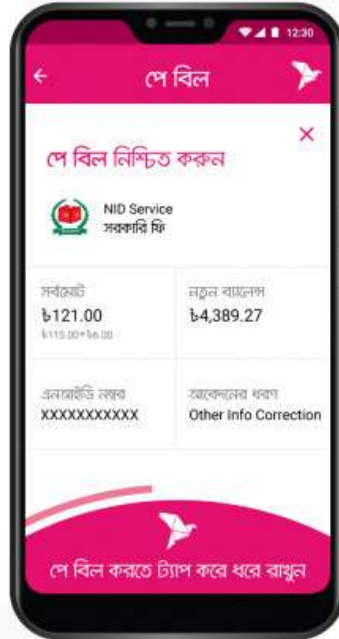
'পে বিল' সম্পন্ন করতে স্ক্রিনের নিচের অংশ ট্যাপ করে ধরে রাখুন