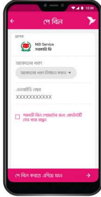
আবেদনের ধরণ নির্বাচন করে এনআইডি নতুন দিন। পরবর্তীতে সেবা গ্রহণের জন্য একাউন্টটি সেভ করে রাখতে পারেন।