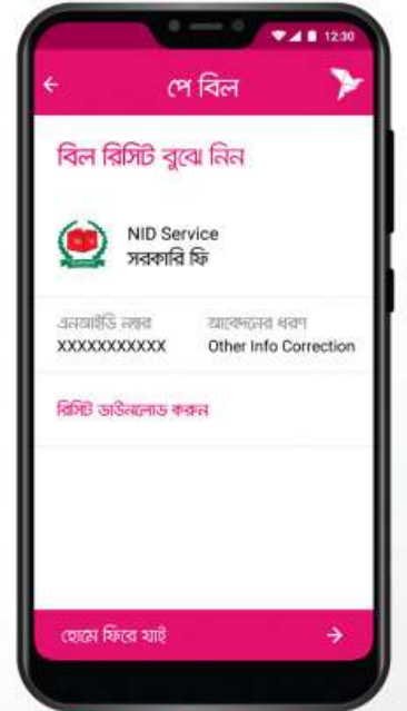
রিসিট ডাউনলোড করুন এ ট্যাপ করে বিল রিসিট ডাউনলোড করতে পারবেন