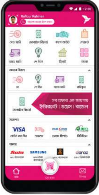
বিকাশ অ্যাপের হোম স্ক্রিন থেকে পে বিল সিলেক্ট করুন

▶ তথ্য উপাত্ত সংশোধন ▶ হারিয়ে/নষ্ট হয়ে গেলে নতুন এনআইডি আবেদন