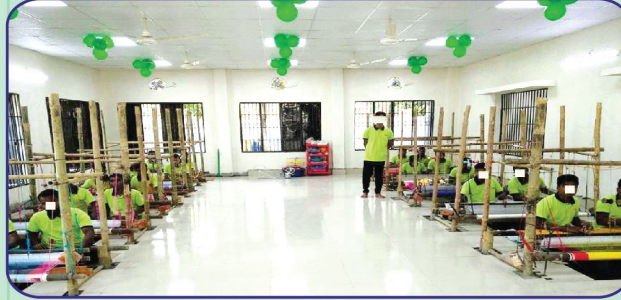
ঐতিহ্যবাহী জামদানি শাড়ি তৈরিতে কর্মরত বন্দিগণ