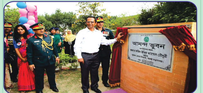
কারাবন্দি মায়েদের সাথে অবস্থানরত শিশুদের জন্য আনন্দ ভুবন উদ্বোধন