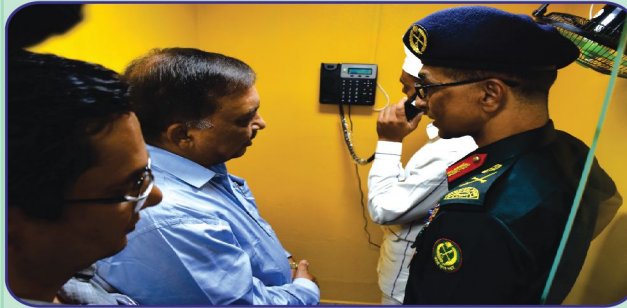
টাঙ্গাইল জেলা কারাগারে বন্দিদের টেলিফোন বুথ (স্বজন) উদ্বোধন