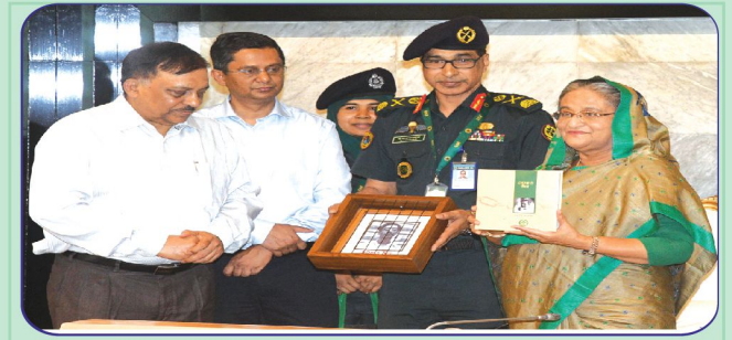
বঙ্গবন্ধুর কারাজীবন নিয়ে রচিত বই '৩০৫৩' এর মোড়ক উন্মোচন