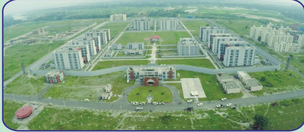
ঢাকা কেন্দ্রীয় কারাগার, কেরাণীগঞ্জ

মাননীয় প্রধানমন্ত্রী গত ১০ এপ্রিল ২০১৬ তারিখে ৪,৫৯০ জন বন্দি ধারণ ক্ষমতা সম্পন্ন নবনির্মিত ঢাকা কেন্দ্রীয় কারাগার (কেরাণীগঞ্জ) উদ্বোধন করেন।