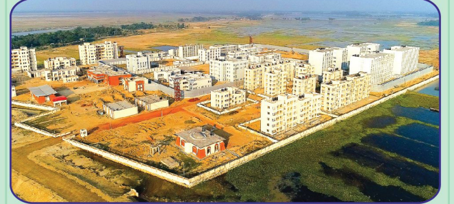
নবনির্মিত সিলেট কেন্দ্রীয় কারাগার