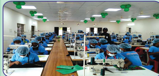
কারা গার্মেন্টসে কর্মরত বন্দিগণ