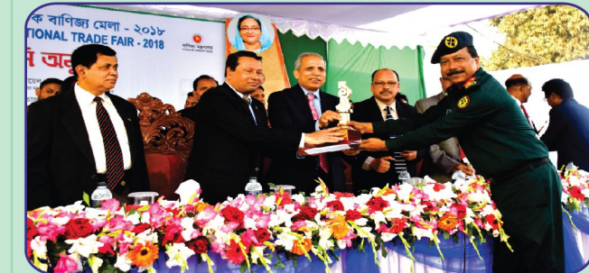
আন্তর্জাতিক বাণিজ্য মেলা-২০১৮ এ মিনি প্যাভিলিয়ন ক্যাটাগরিতে ১ম স্থান অর্জন