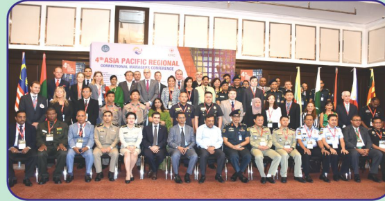
৪র্থ এশিয়া প্যাসিফিক রিজিওনাল কারেকশনাল কনফারেন্স, ঢাকা (মে, ২০১৭)