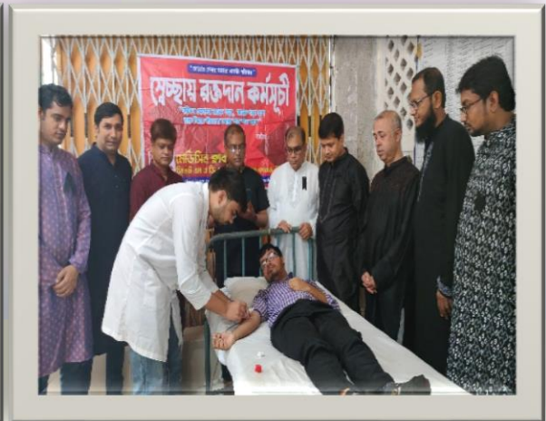
Voluntary Blood Donation Programme