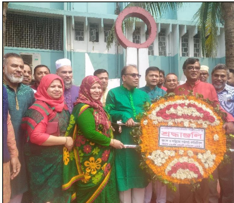
Tributes on Independence Day