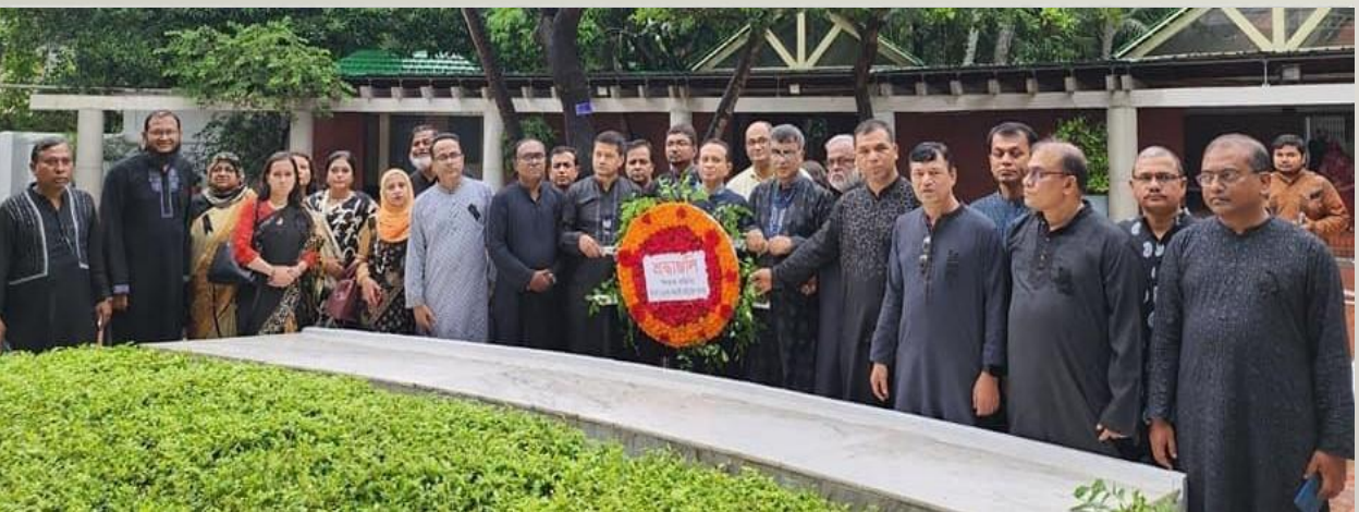
Wreath laying at the grave of Bangabandhu in Tungipara