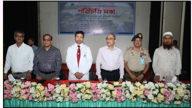
BDS Orientation Program 2023