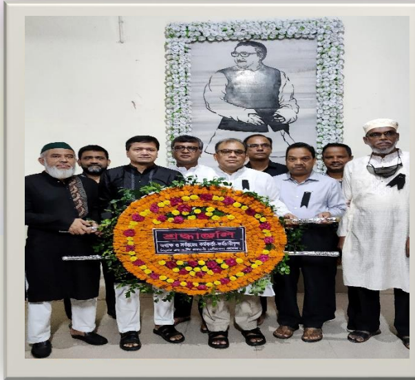
Tribute on National Mourning Day 2023