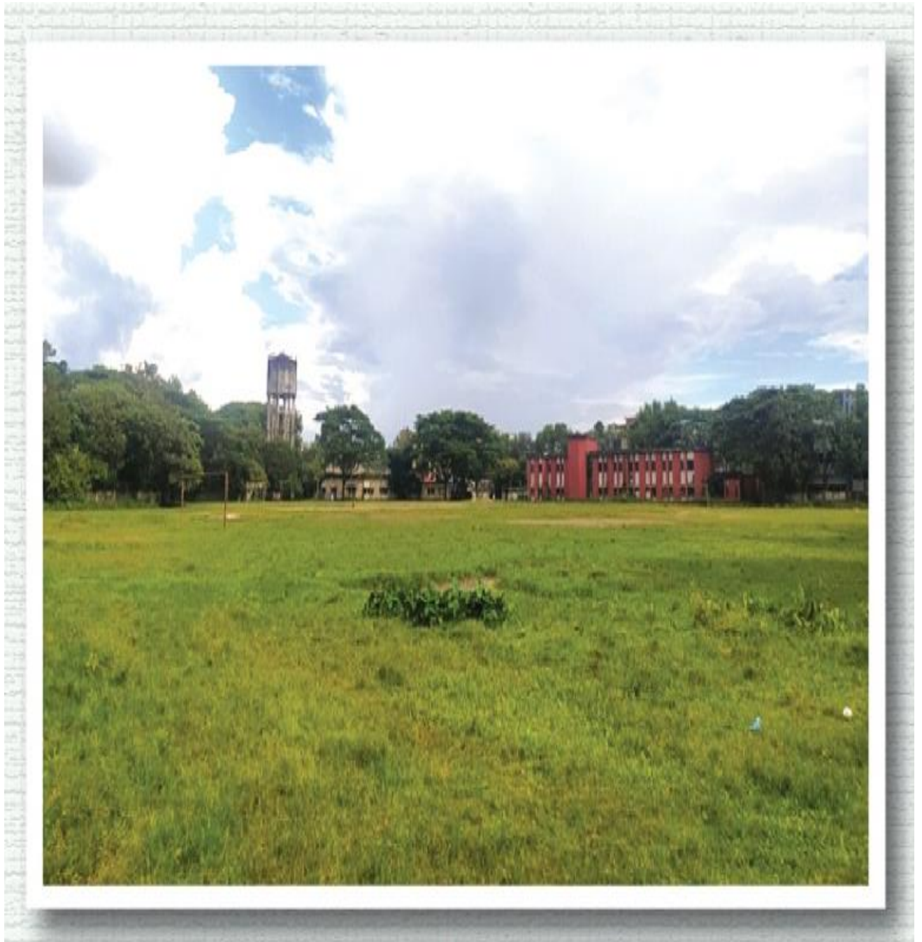
Sylhet MAG Osmani Medical College, Sylhet