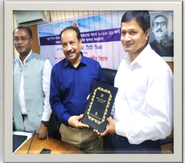
Annual Performance Agreement