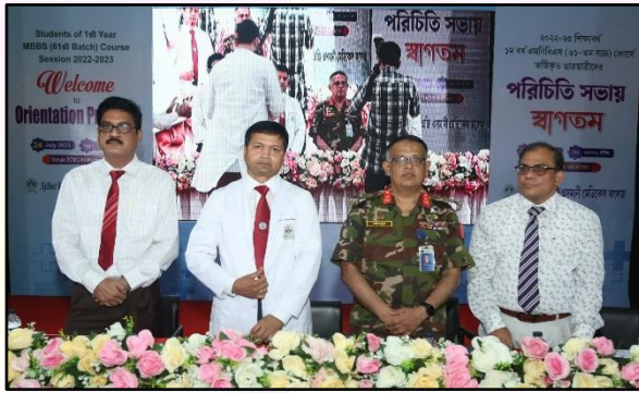
MBBS Orientation Program 2023