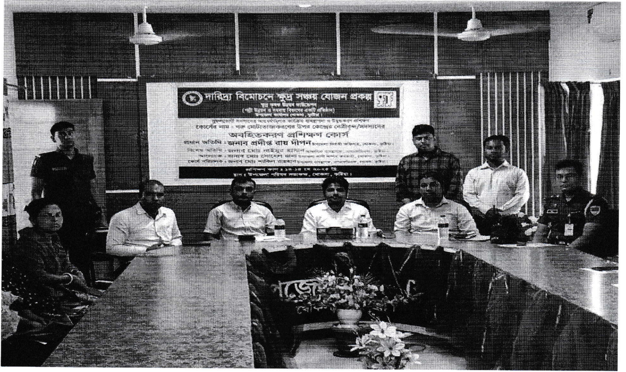
চিত্র: শোকসা, কুষ্টিয়া উপজেলার নির্বাহী অফিসারের উপস্থিতিতে সুফলভোগী সদস্যদেরকে গুরু মোটাতাজাকরণ বিষয়ে অবহিতকরণ প্রশিক্ষণ কার্যক্রমের চিত্র।