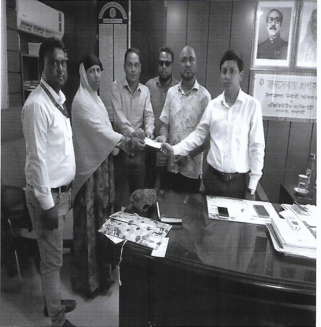
চিত্র-৫: উপজেলার নির্বাহী অফিসারের উপস্থিতিতে সদস্যদের মাঝে ক্ষুদ্র উদ্যোক্তা ঋণের চেক প্রদান, নাটোর সদর উপজেলা, নাটোর।