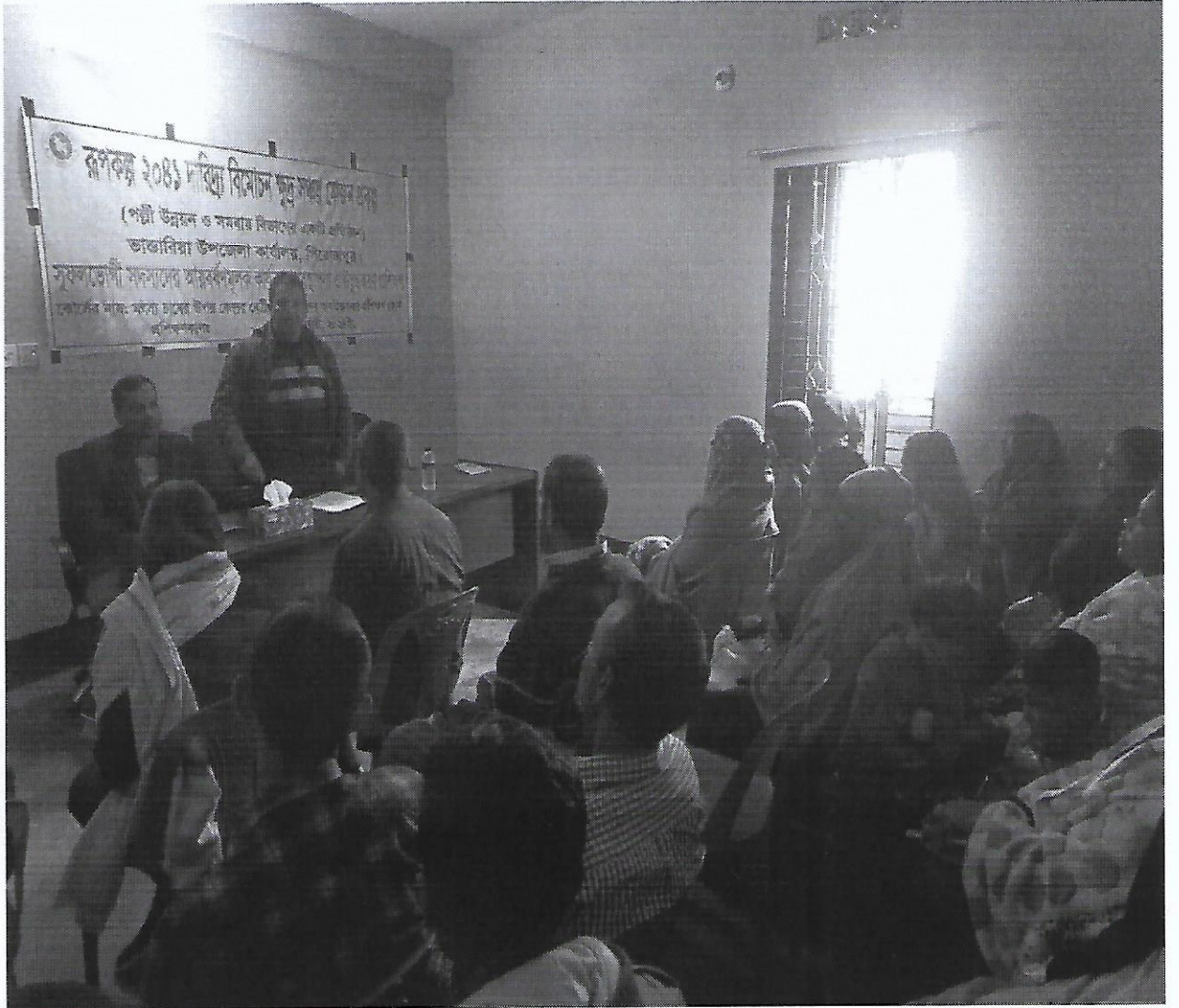
চিত্র-১০: সুলফভোগী সদস্যদের আয়বর্ধনমূলক প্রশিক্ষণ ভান্ডারিয়া উপজেলা কার্যালয়, পিরোজপুর।