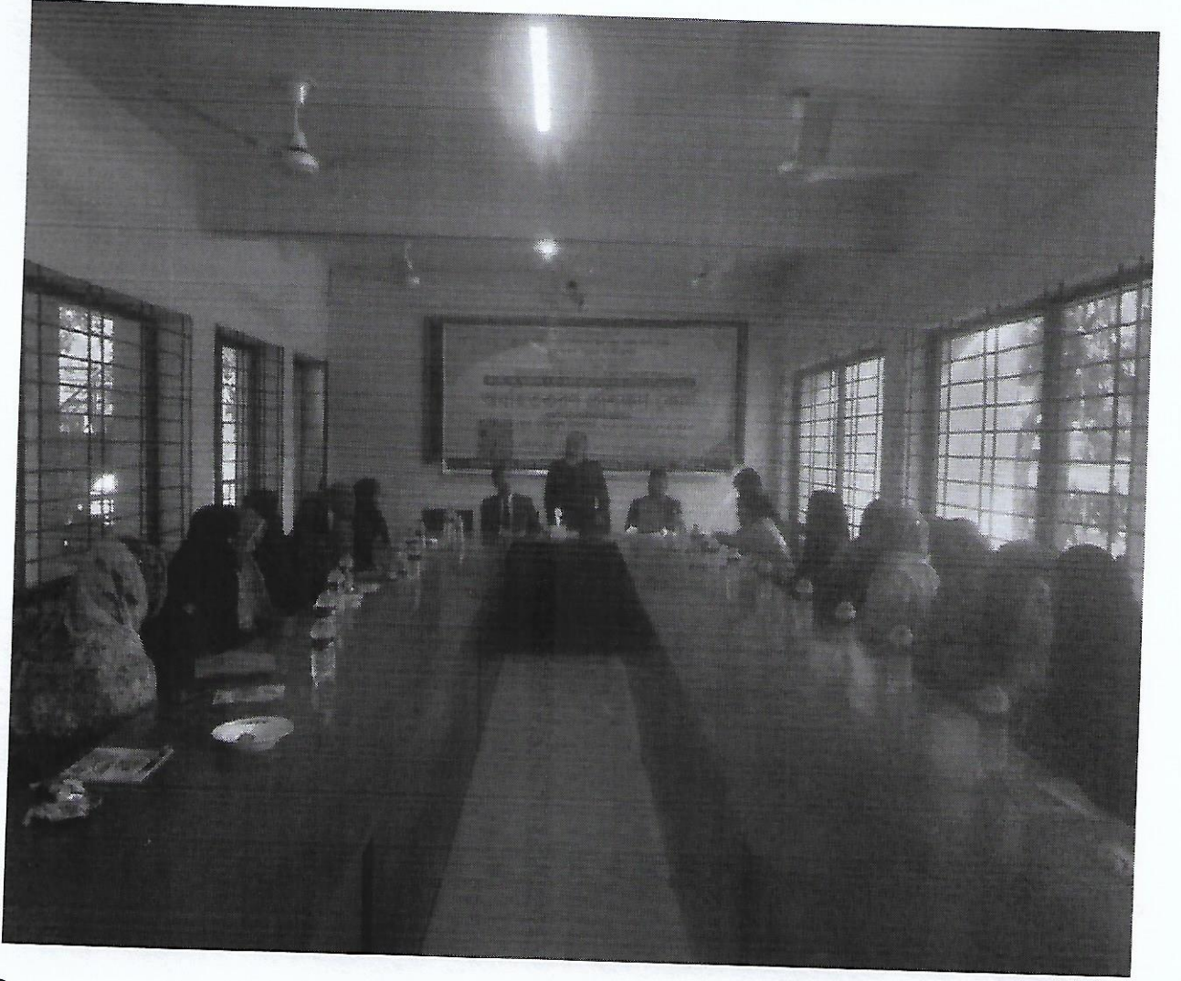
চিত্র-৯: সুলফভোগীদের আয়বর্ধনমূলক প্রশিক্ষণ ভেদরগঞ্জ উপজেলা কার্যালয়, শরীয়তপুর।