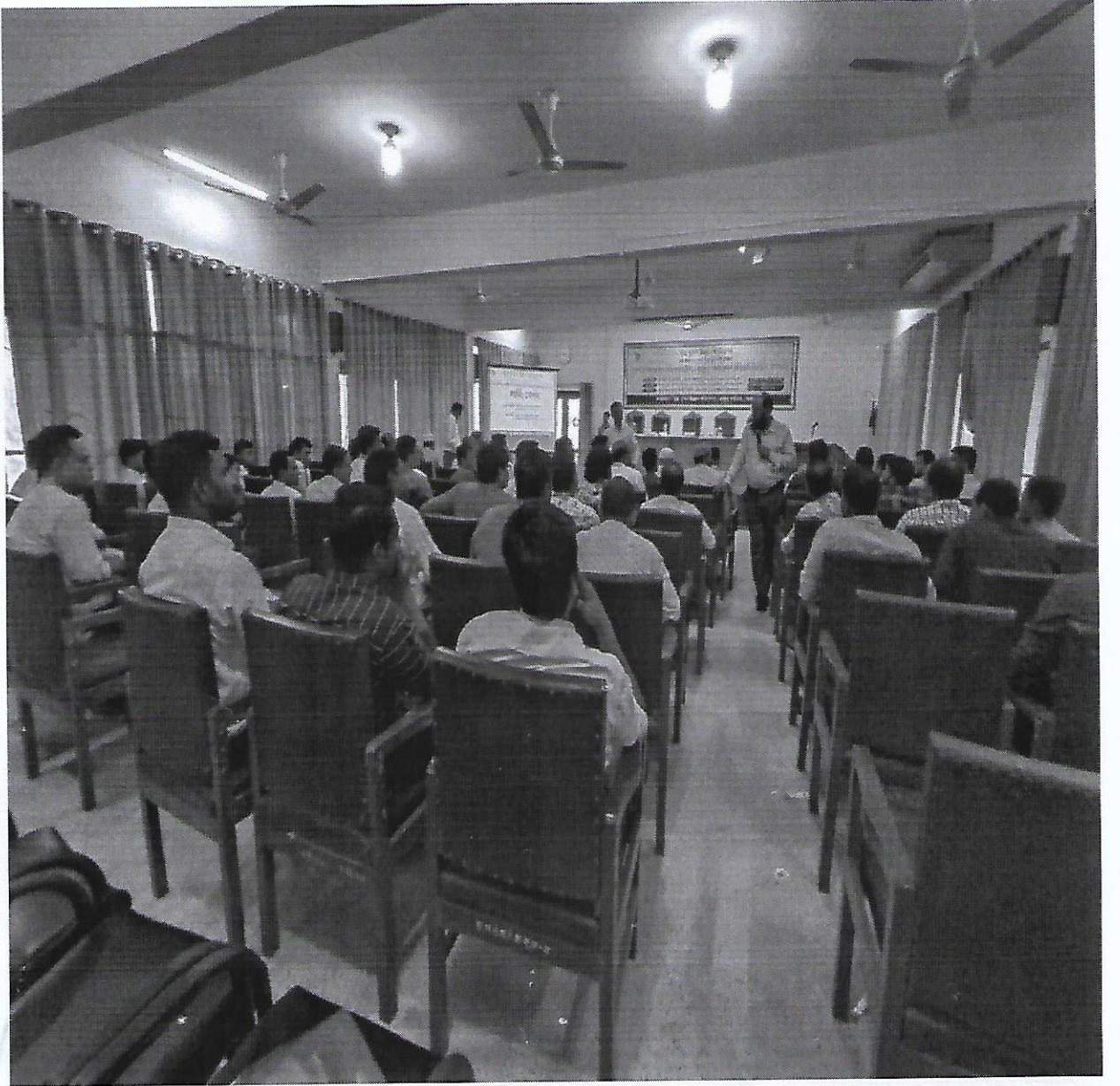
চিত্র-১: ফাউন্ডেশনের সিলেট বিভাগের মাঠ পর্যায়ের কর্মকর্তা/কর্মচারীদের নিয়ে "সেবা প্রদান প্রতিশ্রুতি বিষয়ক" কর্মশালার স্থির চিত্র।

২০২৩-২৪ অর্থবছরের উল্লেখযোগ্য কিছু স্থির চিত্র: