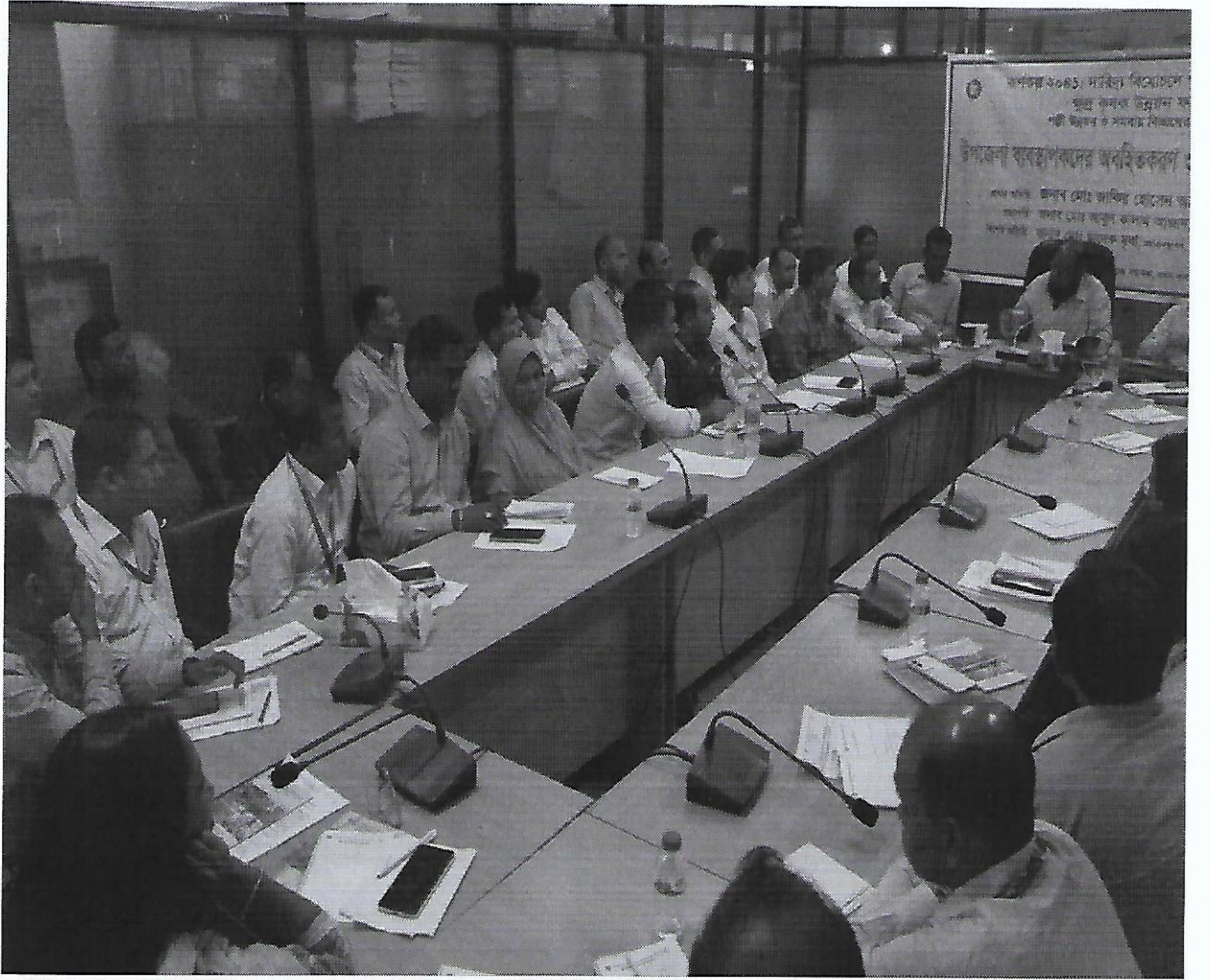
চিত্র-৬: মাঠ পর্যায়ে উপজেলা ব্যবস্থাপকদের অবহিতিকরণ প্রশিক্ষণ কোর্সের স্থির চিত্র।