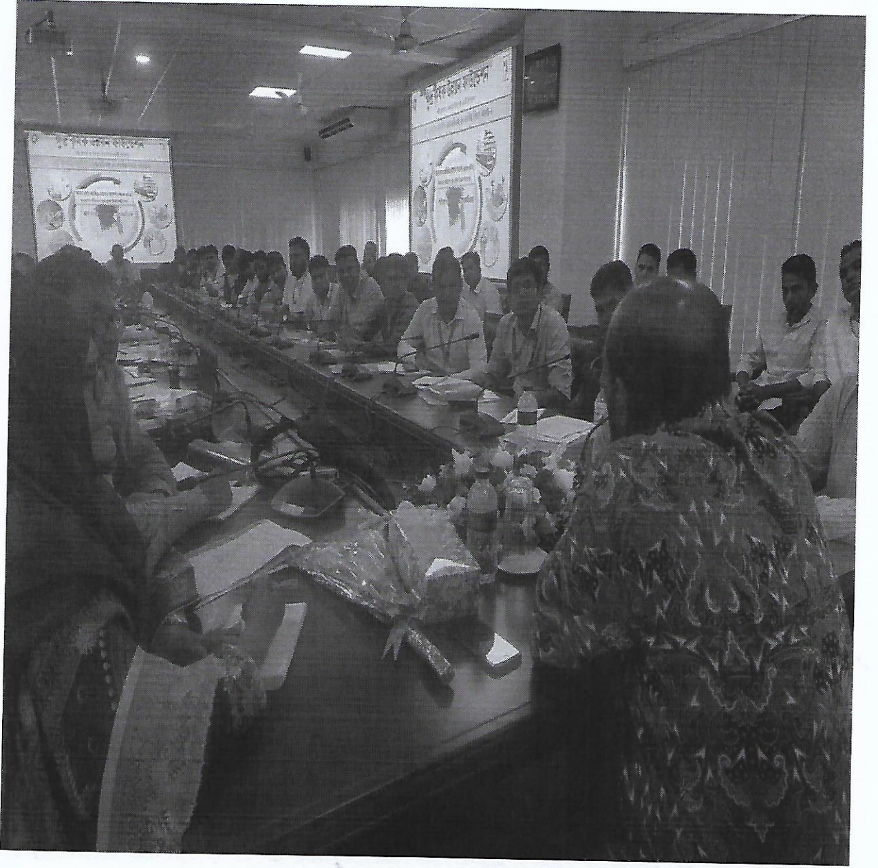
চিত্র-২: পিরোজপুর ও ফরিদপুর অঞ্চলের কর্মকর্তা ও কর্মচারীদের নিয়ে "স্মার্ট বাংলাদেশ বিনির্মাণে এসএফডিএফ" শীর্ষক একটি কর্মশালার স্থির চিত্র।