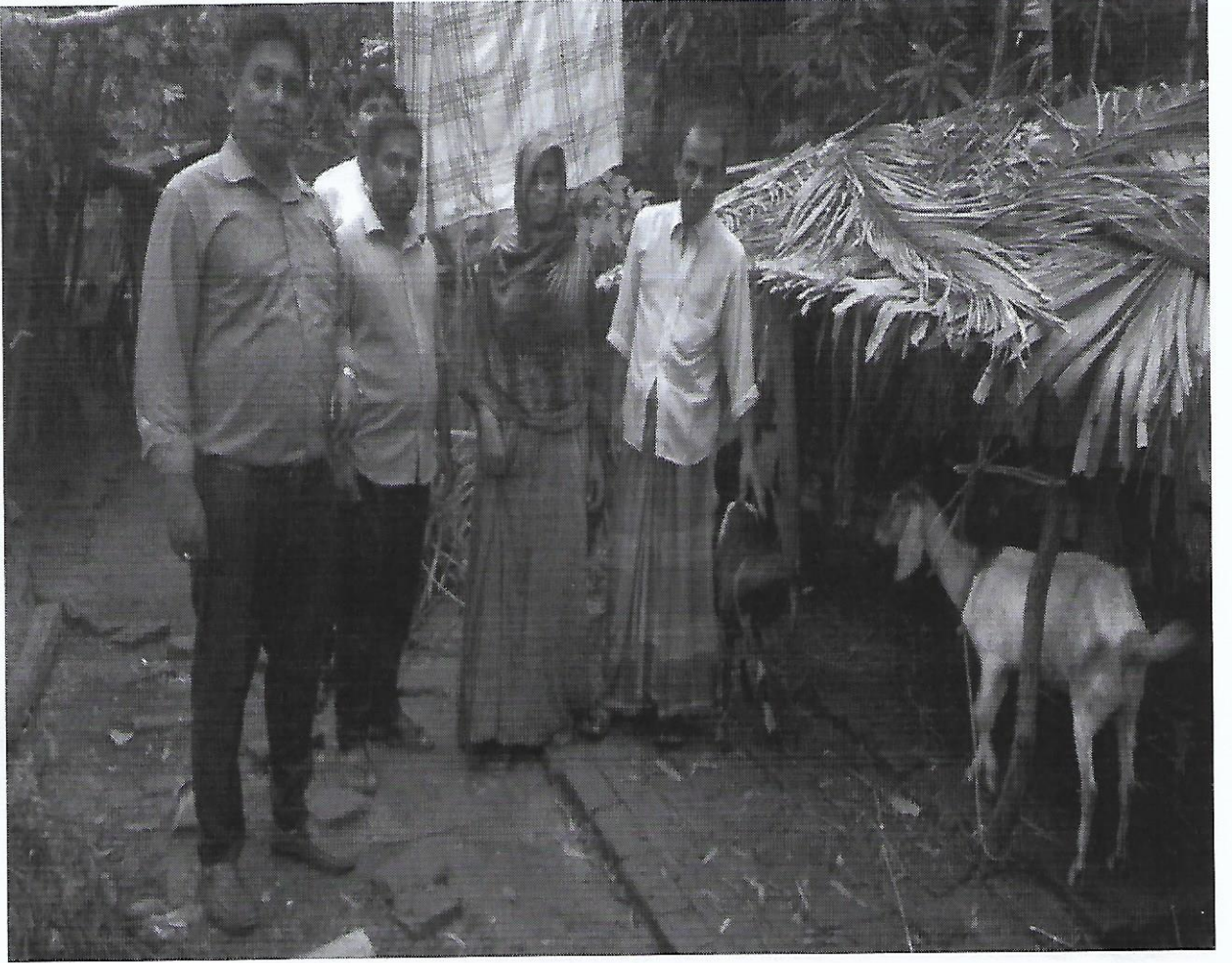
চিত্র-১২: এসএফডিএফ হতে ঋণ গ্রহণ করে ছাগল পালন করে সফল উদ্যোক্তা, মিরপুর উপজেলা কার্যালয়, কুষ্টিয়া।