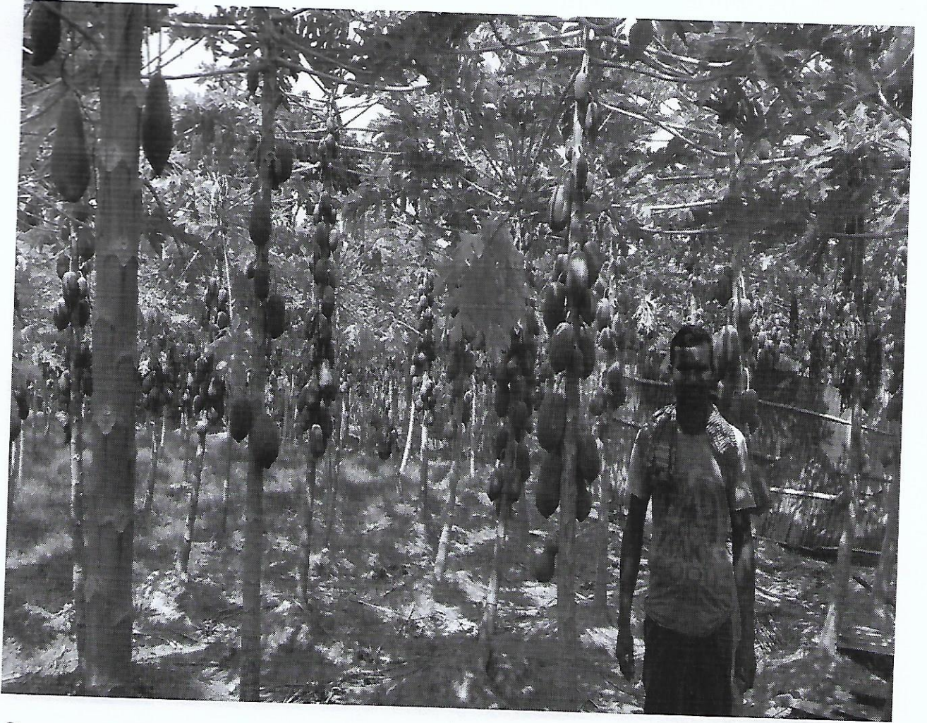
চিত্র-১১: এসএফডিএফ হতে ঋণ গ্রহণ করে পেঁপে চাষে সফল উদ্যোক্তা, দামুরহুদা উপজেলা কার্যালয়, চুয়াডাঙ্গা।