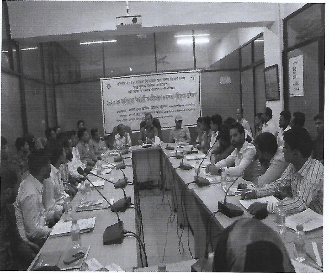
চিত্র-৮: মাঠ পর্যায়ের কর্মচারীদের অবহিতকরণ ও দক্ষতা বৃদ্ধিমূলক প্রশিক্ষণ এর স্থির চিত্র।