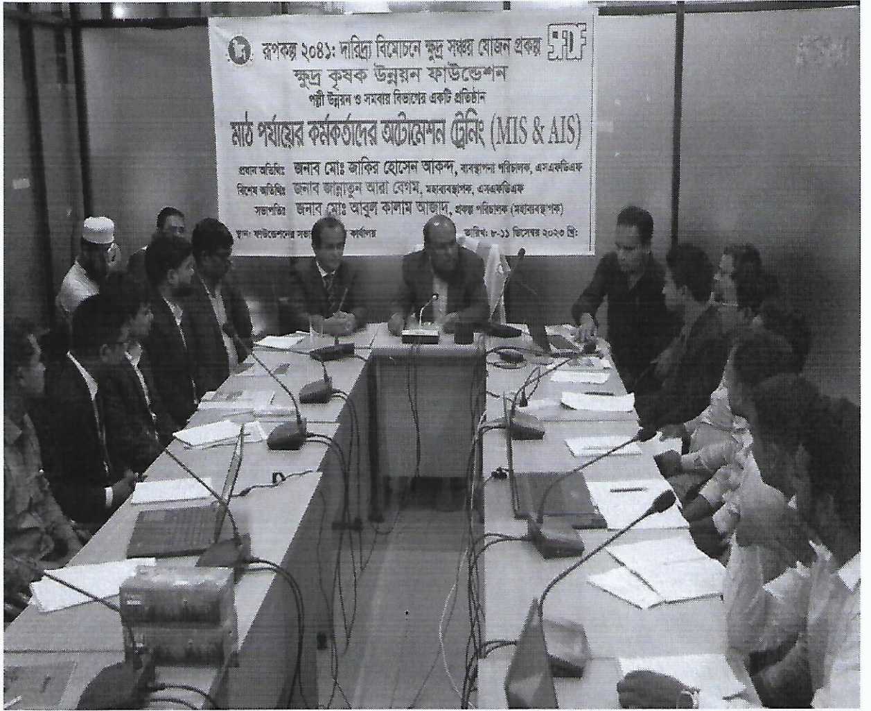
চিত্র-৭: মাঠ পর্যায়ে কর্মকর্তাদের অটোমেশন ট্রেনিং এর স্থির চিত্র।