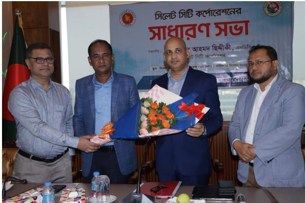
সিসিক সাধারণ সভা (০১/১২/২০২৪)