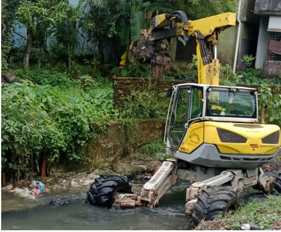
বর্জ্য ব্যবস্থাপনা বিভাগের ছড়ায় মেশিন দ্বারা কাজ (১৯/০৪/২০২৫)