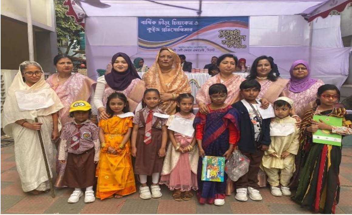
সিসিকের মজলিশ আমিন চারাদিঘিরপার বেবী কেয়ার একাডেমীতে বার্ষিক ক্রীড়া, চিত্রাঙ্কন ও কুইজ প্রতিযোগিতা আয়োজন করা হয়। (০৭/০৪/২০২৫)