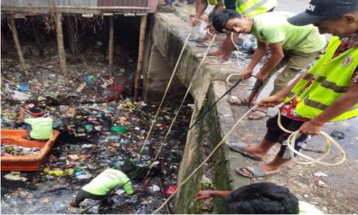
সিসিকের বর্জ্য ব্যবস্থাপনা বিভাগের পরিষ্করকর্মী দিয়ে ছড়া পরিষ্কার (২৯/০৫/২০২৫)