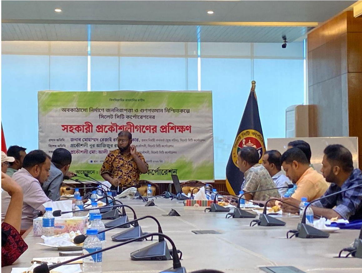
সিসিকের সহকারী প্রকৌশলীগণের প্রশিক্ষণ কার্যক্রম (২৬/০৩/২০২৫)