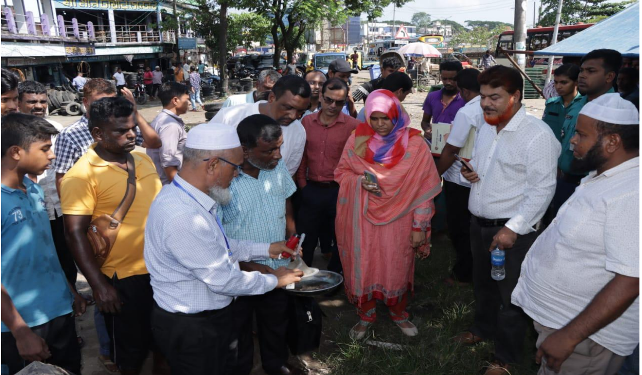
ডেঙ্গু রোগবাহী মশার বিস্তার নিয়ন্ত্রণে অভিযান, দক্ষিণ সুরমা, সিলেট। (১৭/১০/২০২৪)