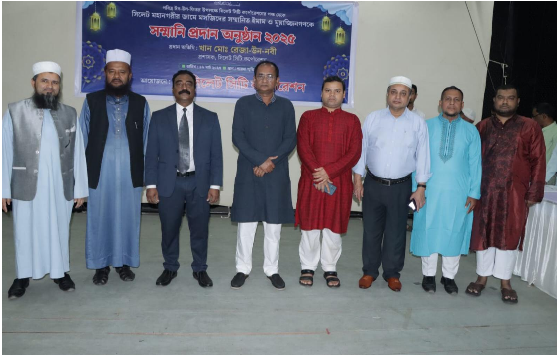
সিলেট মহানগরীর জামে মসজিদের ইমাম ও মুয়াজ্জিনগণকে সম্মানী প্রদান অনুষ্ঠান (২৬/০৩/২০২৫)