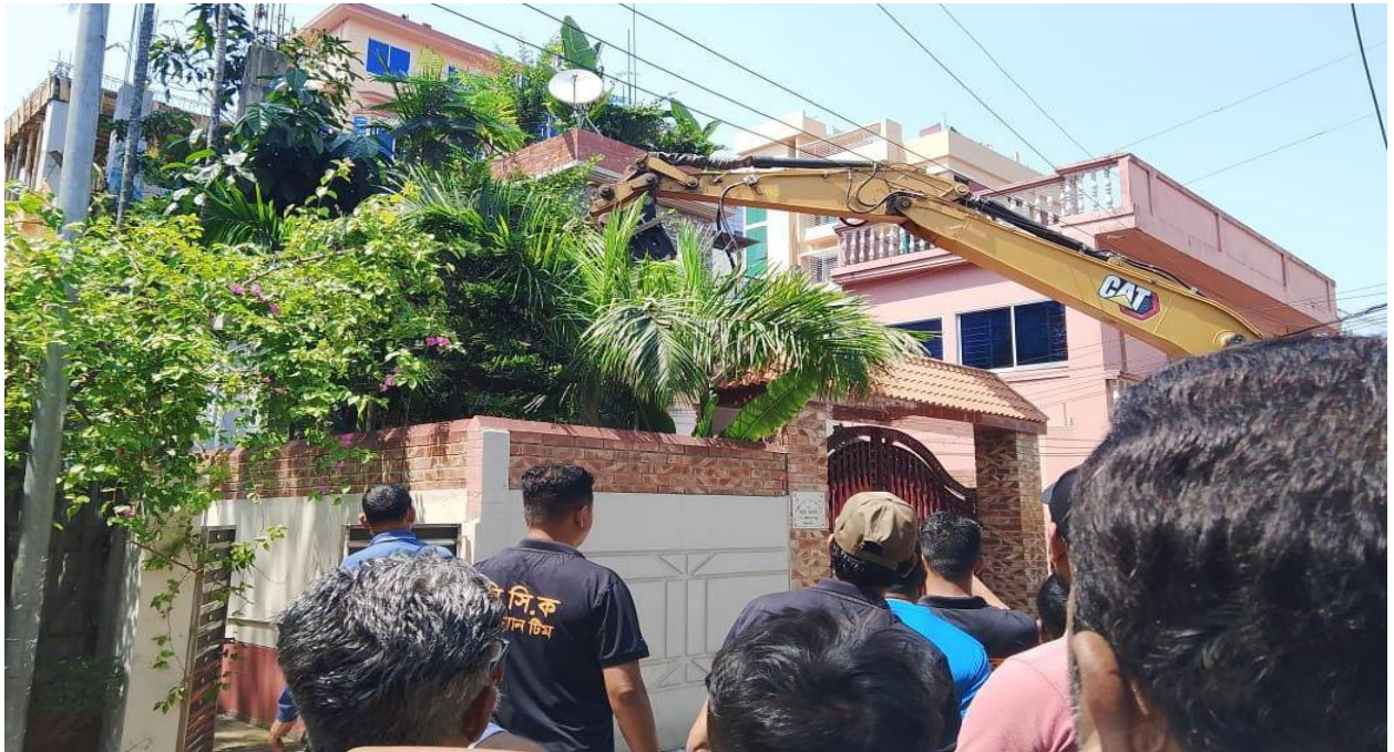
এক্সিকিউটিভ ম্যাজিস্ট্রেট এর নেতৃত্বে বিধিবহির্ভূত ভবন উচ্ছেদ অভিযান, জল্লারপাড়া। (২৭/০৩/২০২৫)