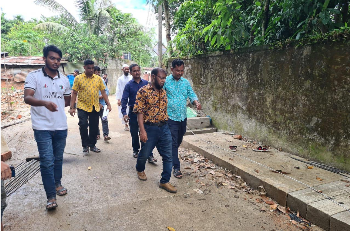
২৯নং ওয়ার্ডের উন্নয়নমূলক কাজ পরিদর্শন করেন পূর্ত শাখার তত্ত্বাবধায়ক প্রকৌশলী ও সহকারী প্রকৌশলীগণ (১৯/৬/২০২৪)