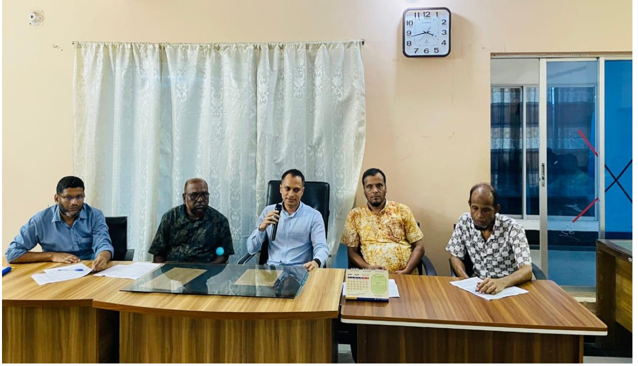
রাজস্ব আয় বৃদ্ধির লক্ষ্যে আলোচনা সভা। (১৯/০২/২০২৫)