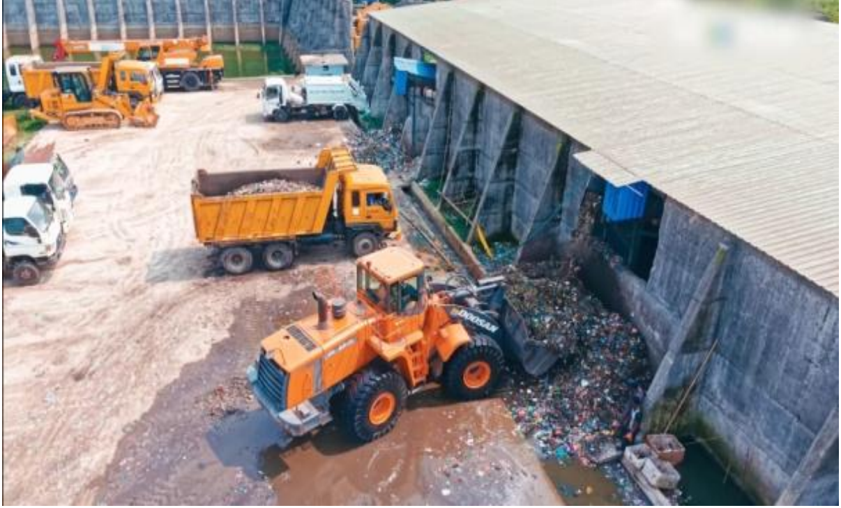
সিসিকের বর্জ্য ব্যবস্থাপনা বিভাগের এম আর প্লান্ট (১২/১০/২০২৪)