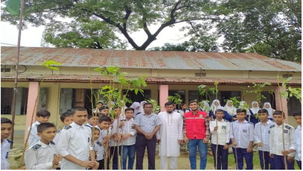
সিসিকের সমাজকল্যাণ, শিক্ষা ও সংস্কৃতি বিভাগের অধীনে বীরেশ চন্দ্র উচ্চ বিদ্যালয়ে বৃক্ষরোপণ কর্মসূচি আয়োজন করা হয়। (২৫/০৬/২০২৫)