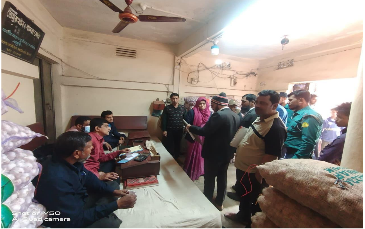
কৃষি পণ্যের অবৈধ মজুতদারী নিরোধ ও ট্রেড লাইসেন্স পরিদর্শন অভিযান, কালীঘাট। (০৫/০২/২০২৫)