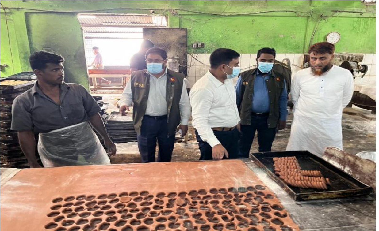
খাদ্যের গুণগত মান যাচাই করার আলোকচিত্র (০৯/০৪/২০২৫)