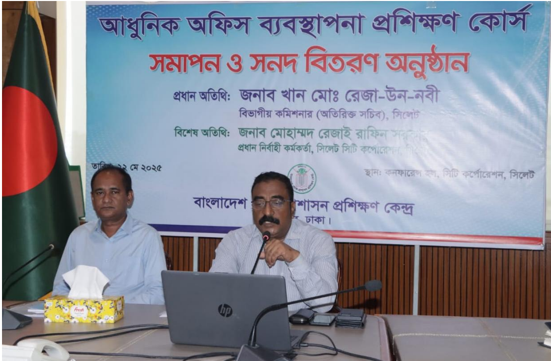
আধুনিক অফিস ব্যবস্থাপনা প্রশিক্ষণ কোর্স সমাপন ও সনদ বিতরণ অনুষ্ঠান ( ২২/০৫/২০২৫ )