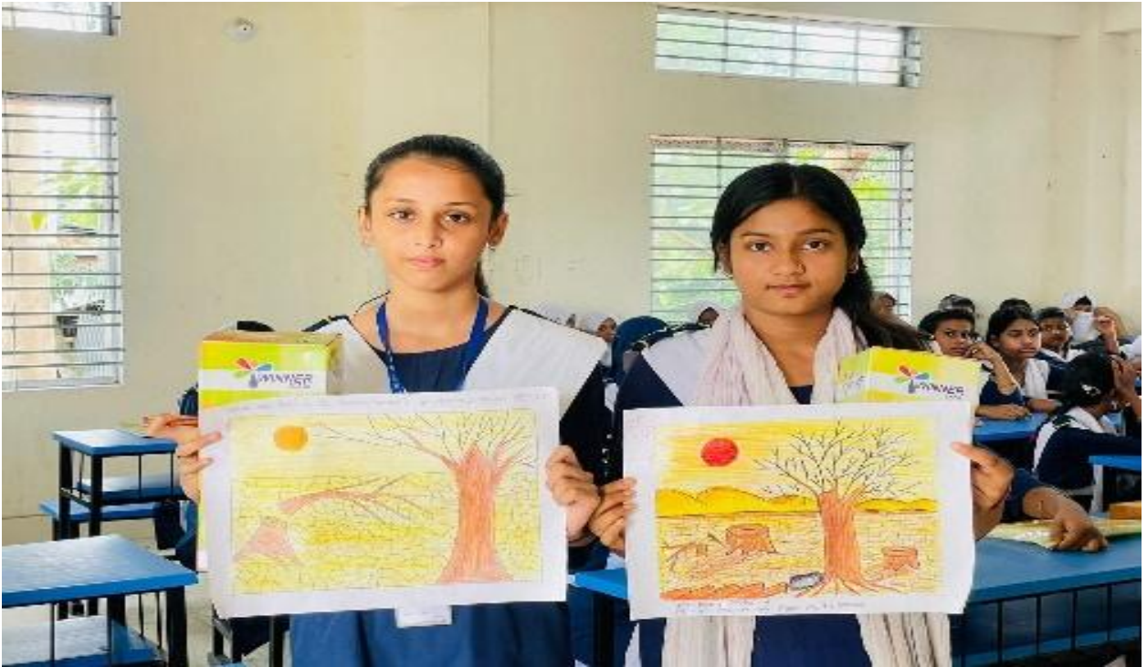
সিসিকের বীরেশ চন্দ্র উচ্চ বিদ্যালয়ে চিত্রাঙ্কন প্রতিযোগিতা অনুষ্ঠিত হয়। (১৬/১২/২০২৪)