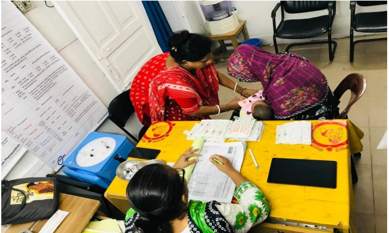
রুটিন ইপিআই টিকাদান কর্মসূচী (১৬/০২/২০২৫)