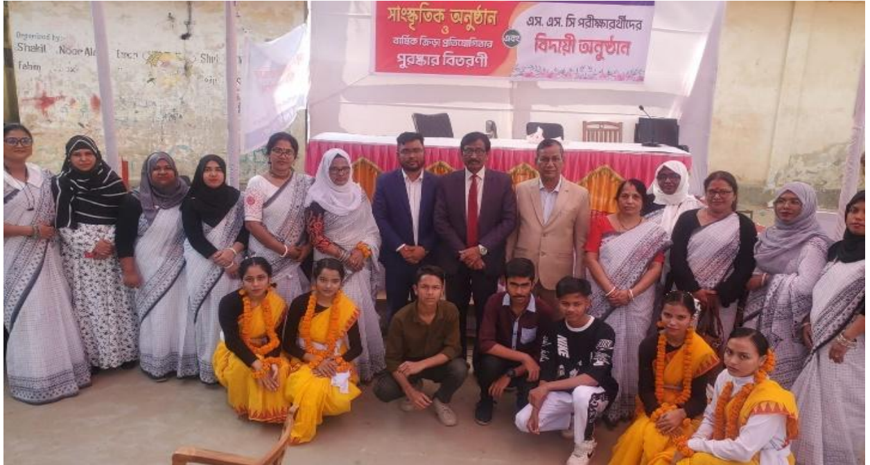
সিসিকের বর্গমালা সিটি একাডেমীতে সাংস্কৃতিক অনুষ্ঠান ও বার্ষিক ক্রীড়া প্রতিযোগিতা আয়োজন করা হয়। (০৯/১২/২০২৪)