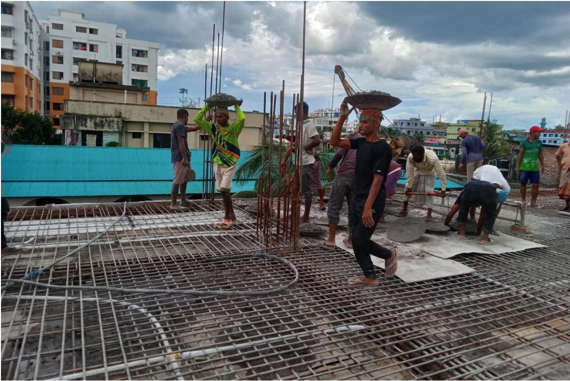
হযরত শাহজালাল (র:) দরগা মাদ্রাসা ছাত্রাবাস এর ৪র্থ তলা ছাদ ঢালাই এর চলমান কাজ । (২৮-০৫-২৫)