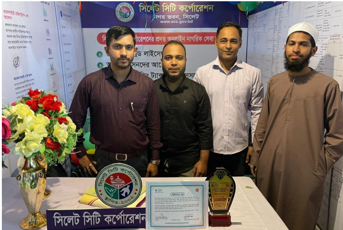
জেলা প্রশাসন কর্তৃক আয়োজিত তথ্যমেলা ২০২৪ এ সিসিক ২য় স্থান অর্জন করে। (১৯/১১/২০২৪)