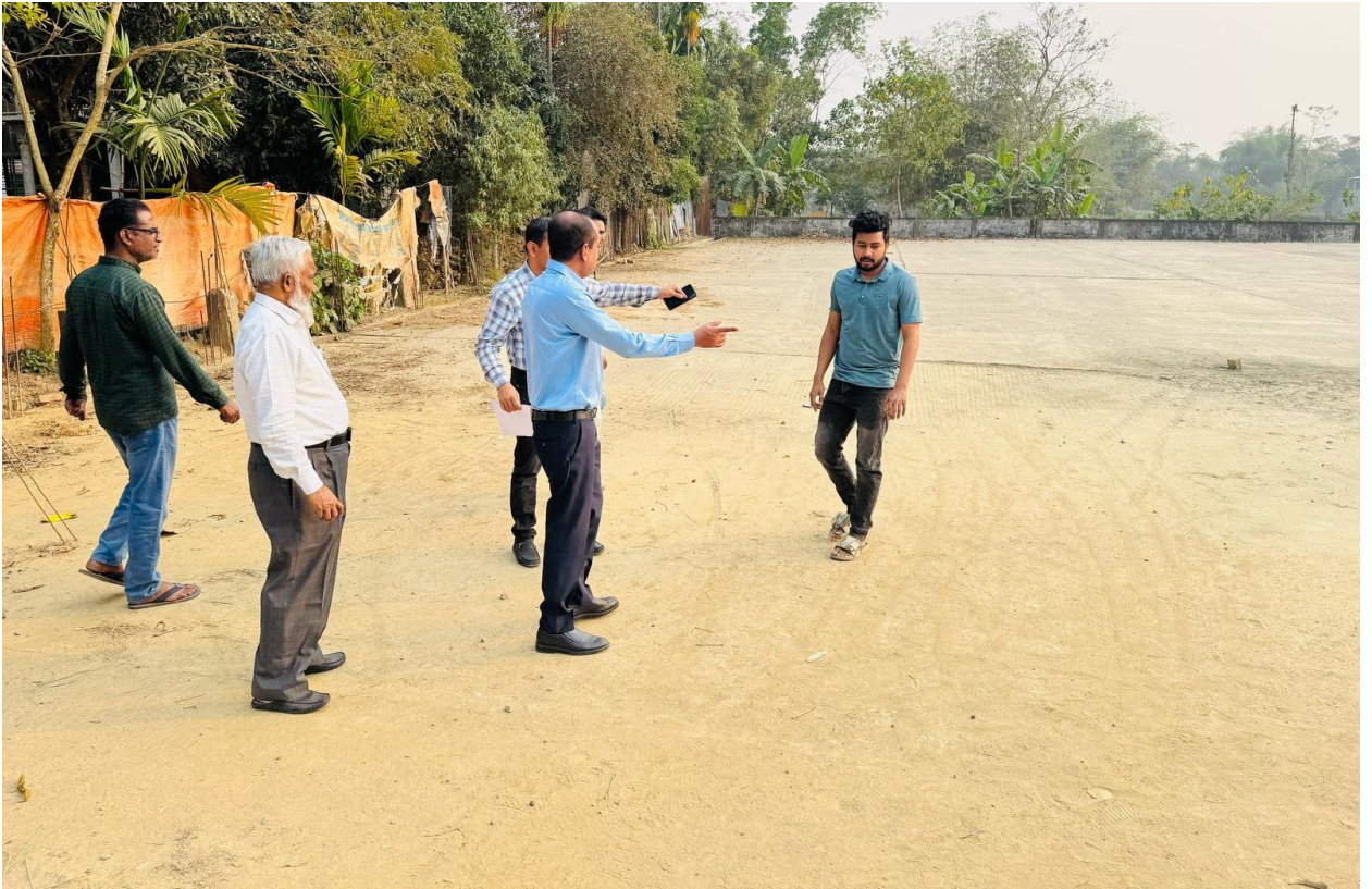
৪২ নং ওয়ার্ডে বিভিন্ন সাইট পরিদর্শন করেন সিসিকের প্রধান নির্বাহী কর্মকর্তা এবং নির্বাহী প্রকৌশলীগণ। ( ১২/০৩/২০২৫ )