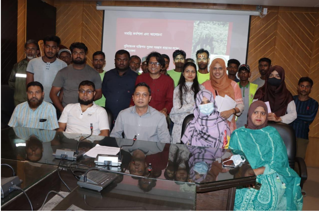
সিসিকের বর্জ্য ব্যবস্থাপনা বিভাগের কর্মশালা (১২/০২/২০২৫)