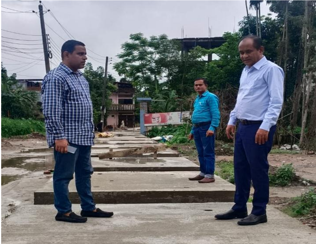
২৯ নং ওয়ার্ডের উন্নয়ন মূলক কাজ পরিদর্শন করেন সিসিকের প্রধান নির্বাহী কর্মকর্তা ও নিবাহী প্রকৌশলী