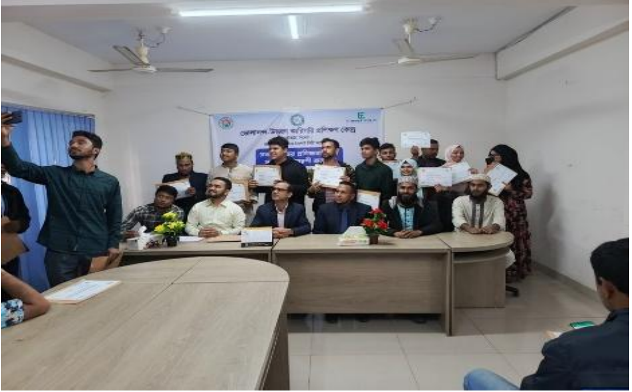
সিসিকের ভোলানন্দ উত্তরণ কারিগরি প্রশিক্ষণ কেন্দ্রে প্রশিক্ষণ শেষে সনদপত্র বিতরণ করা হয়। (১৫/০৫/২০২৫)