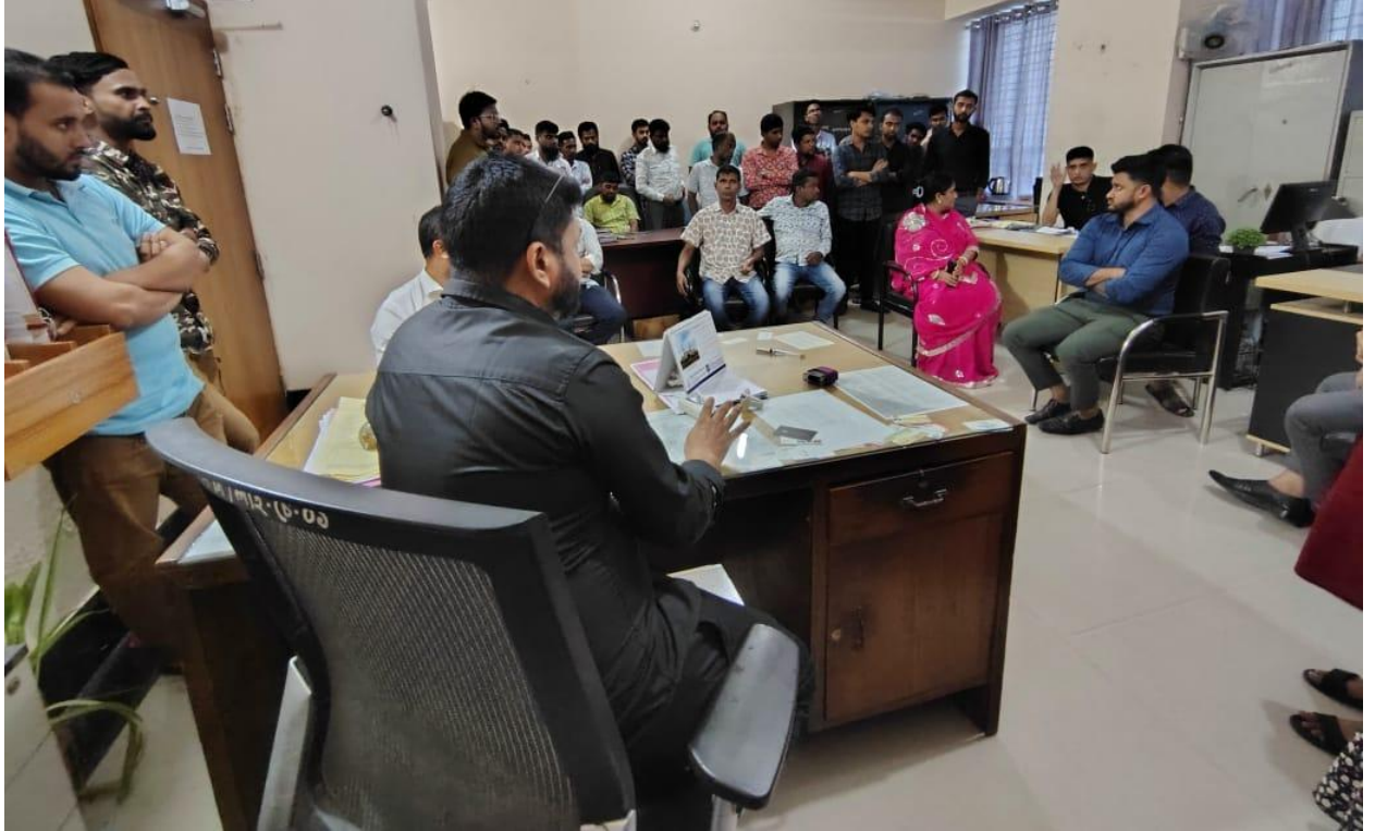
লাইসেন্স আদায়কারীদের সাথে আলোচনা সভা। (২০/১১/২০২৫)