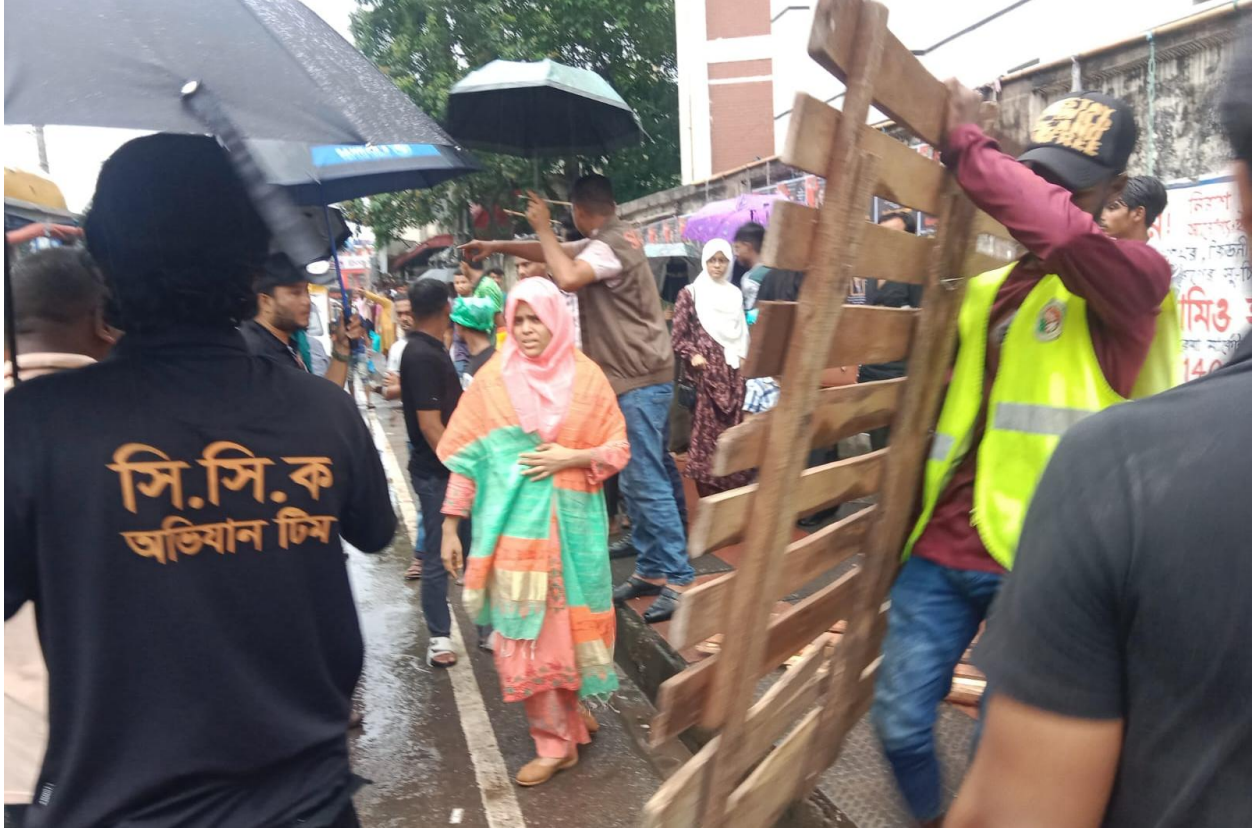
ফুটপাথে অবৈধ দখল বিরোধী অভিযান। (২৩/০৪/২০২৫)