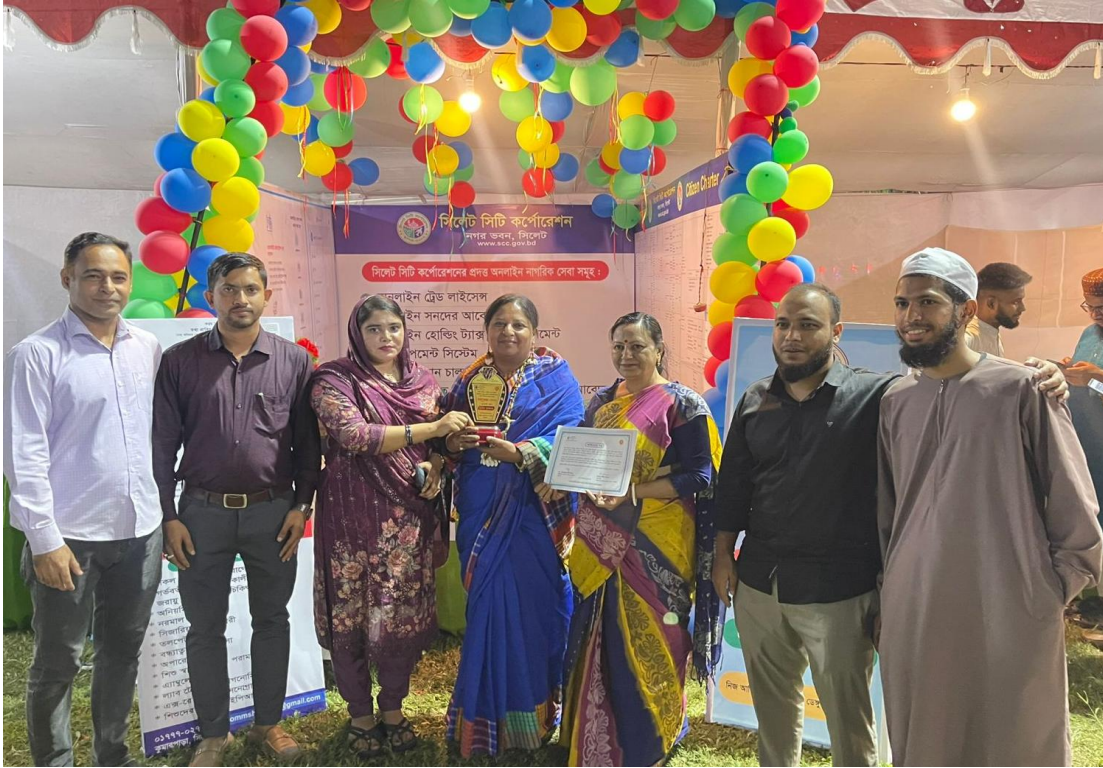
জেলা প্রশাসন কর্তৃক আয়োজিত তথ্যমেলা ২০২৪ এ সিসিক ২য় স্থান অর্জন করে। (১৯/১১/২০২৪)