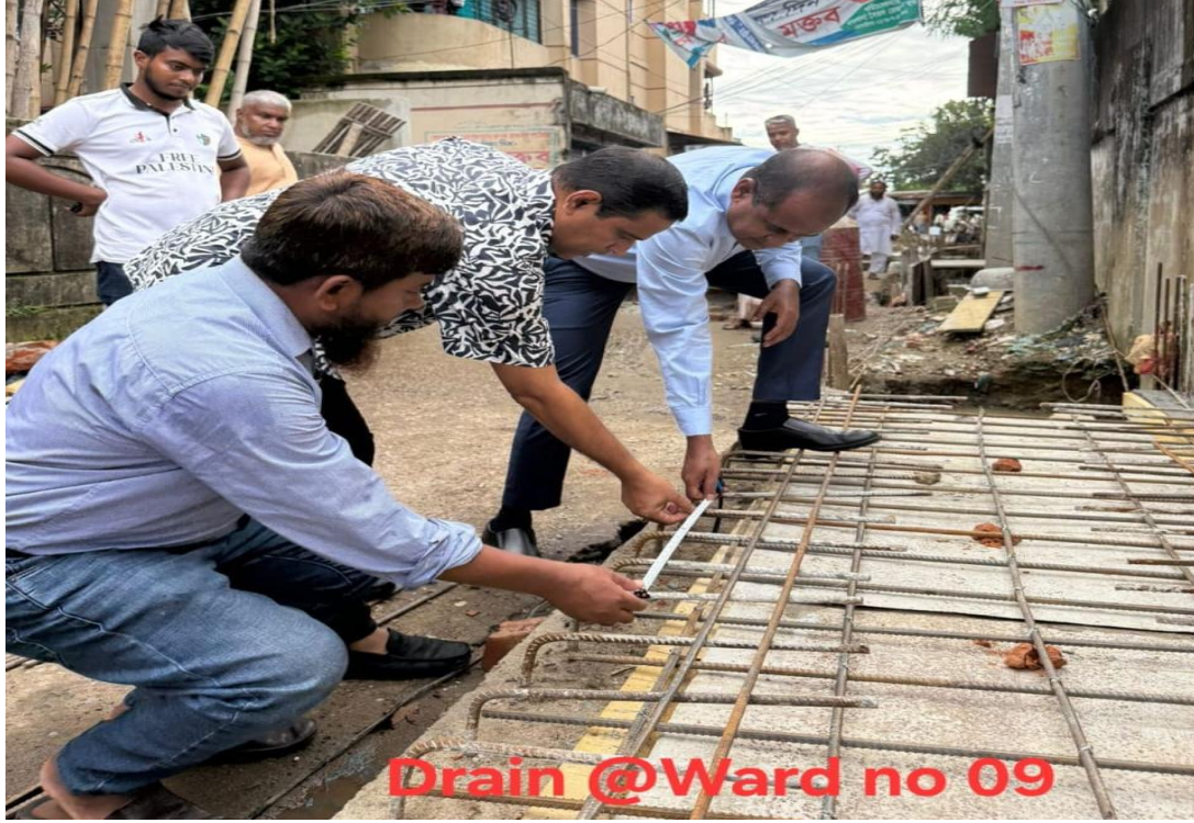
৯ নং ওয়ার্ডের ড্রেনের কাজ পরিদর্শনকালে সিসিকের প্রধান নির্বাহী কর্মকর্তা ও পূর্ত শাখার প্রকৌশলীবৃন্দ (০২/০৬/২০২৫)