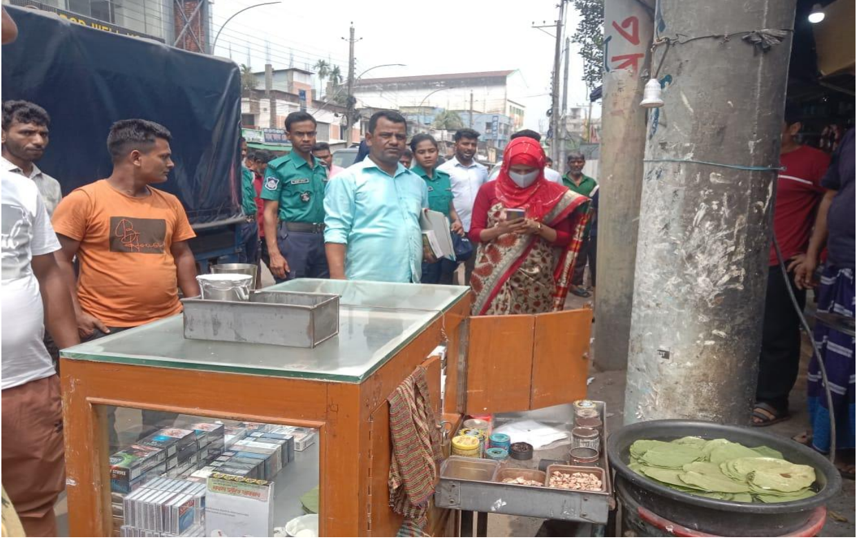
ফুটপাতে অবৈধ দোকান উচ্ছেদ অভিযান, তালতলা, সিলেট। (০৯/০৭/২০২৫)