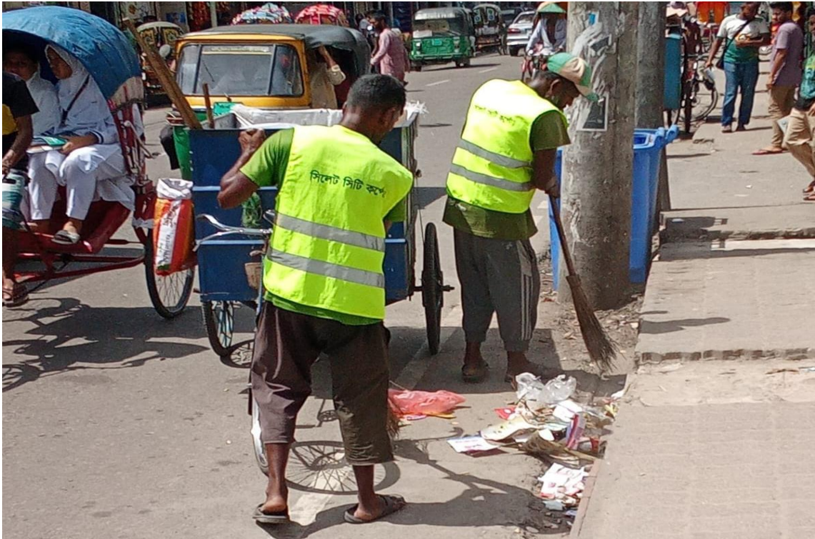
সিসিকের বর্জ্য ব্যবস্থাপনা বিভাগের রাস্তার কাজের দৃশ্য (১২/০৯/২০২৪)