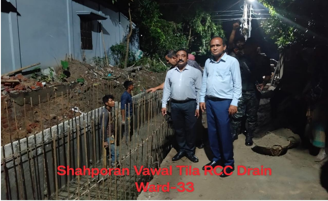
৩৩ নং ওয়ার্ড শাহপরাণ ড্রেনের কাজ পরিদর্শনকালে সিসিকের প্রশাসক ও প্রধান নির্বাহী কর্মকর্তা (২৮/০৫/২০২৫)