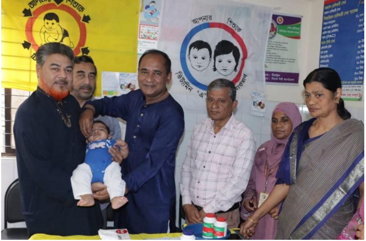
ভিটামিন এ প্লাস ক্যাম্পেইন পালন (১৫/০৩/২০২৫)