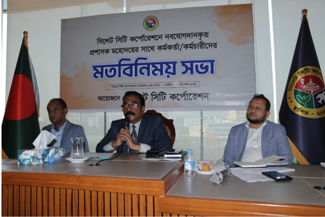
প্রশাসক মহোদয়ের সাথে কর্মকর্তা / কর্মচারীদের মতবিনিময় সভা (০৪/১২/২০২৪)