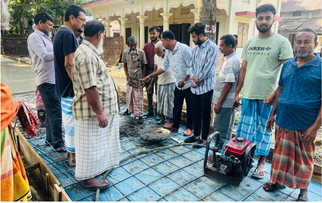
৪২ নং ওয়ার্ড শ্রীরামপুর শিকদার পাড়া রাস্তার চলমান কাজ পরিদর্শন করেন সিসিকের সহকারী ও উপ-সহকারী প্রকৌশলীগণ