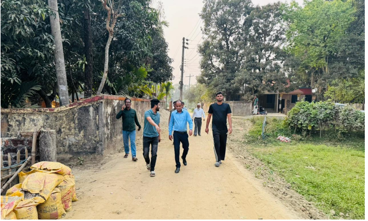
৪২ নং ওয়ার্ডে বিভিন্ন সাইট পরিদর্শন করেন সিসিকের প্রধান নির্বাহী কর্মকর্তা এবং নির্বাহী প্রকৌশলীগণ। ( ১২/০৩/২০২৫ )