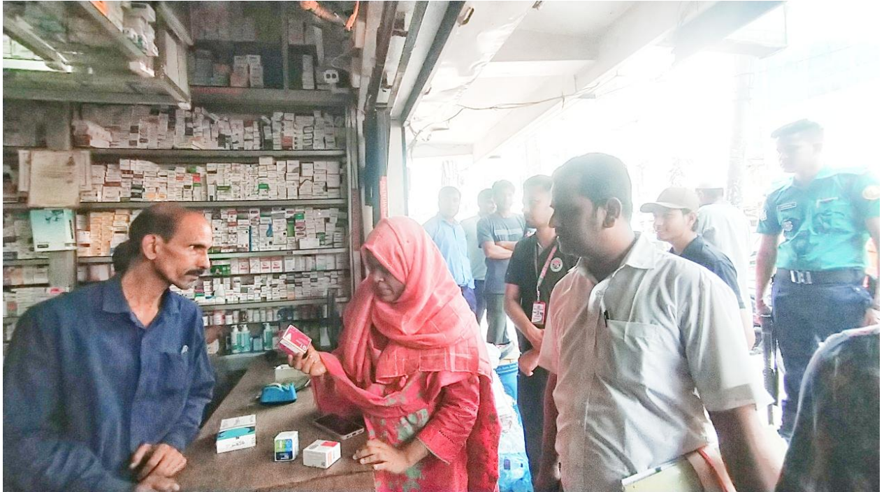
লাইসেন্সবিহীন, ভেজাল ও মানহীন ঔষধ বিক্রি নিয়ন্ত্রণ অভিযান, মেডিক্যাল রোড। (২৪/০৩/২০২৫)