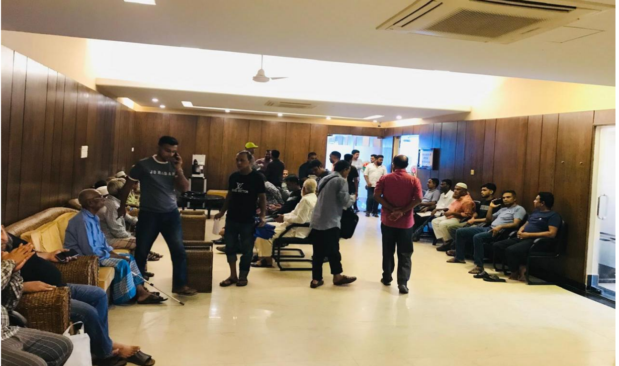
রিভিউ বোর্ডে উপস্থিত সম্মানিত করদাতা ব্যক্তিবৃন্দ। (২৩/০৪/২০২৫)