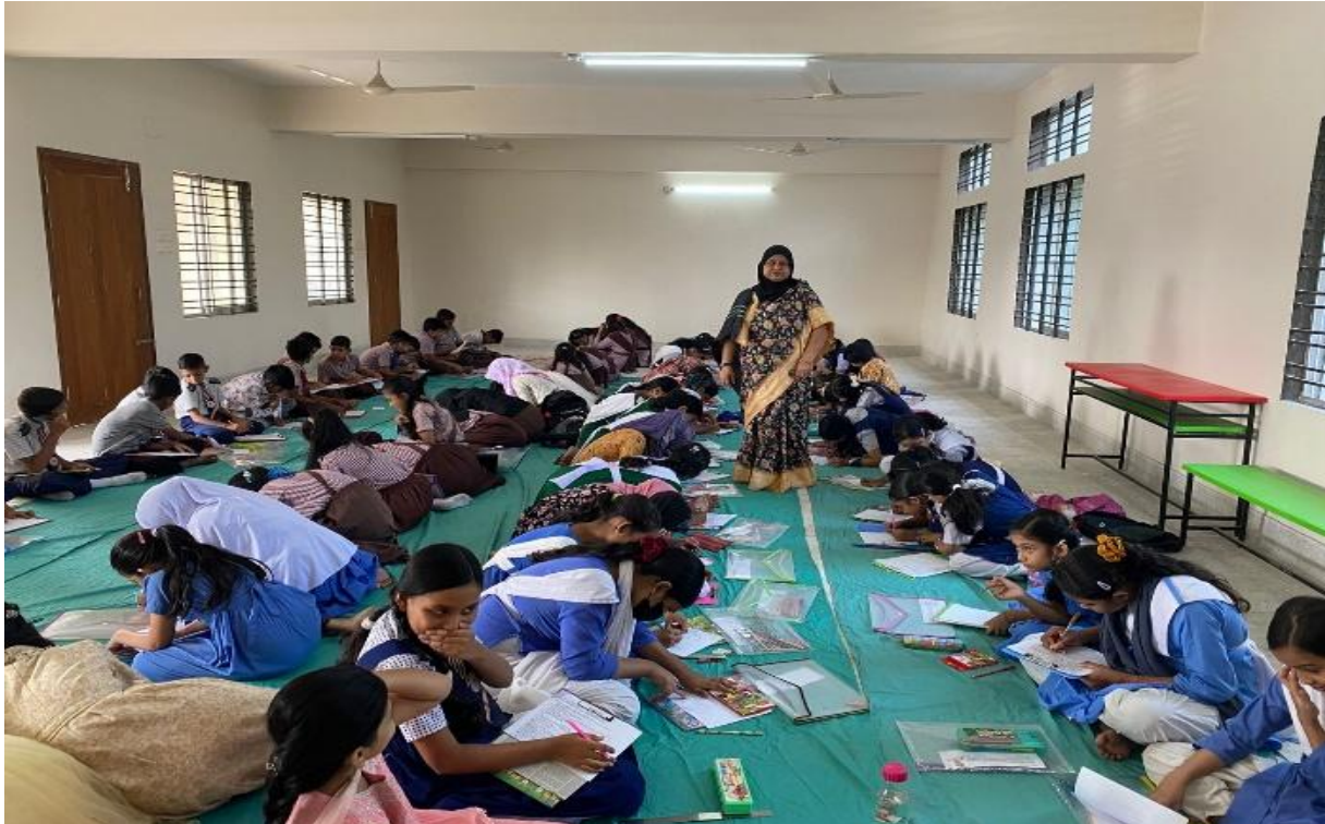
মেধা বিকাশের জন্য মজলিশ আমিন চারাদিঘিরপার বেবী কেয়ার একাডেমীতে চিত্রাঙ্কন প্রতিযোগিতা আয়োজন করা হয়। (২১/০২/২০২৫)