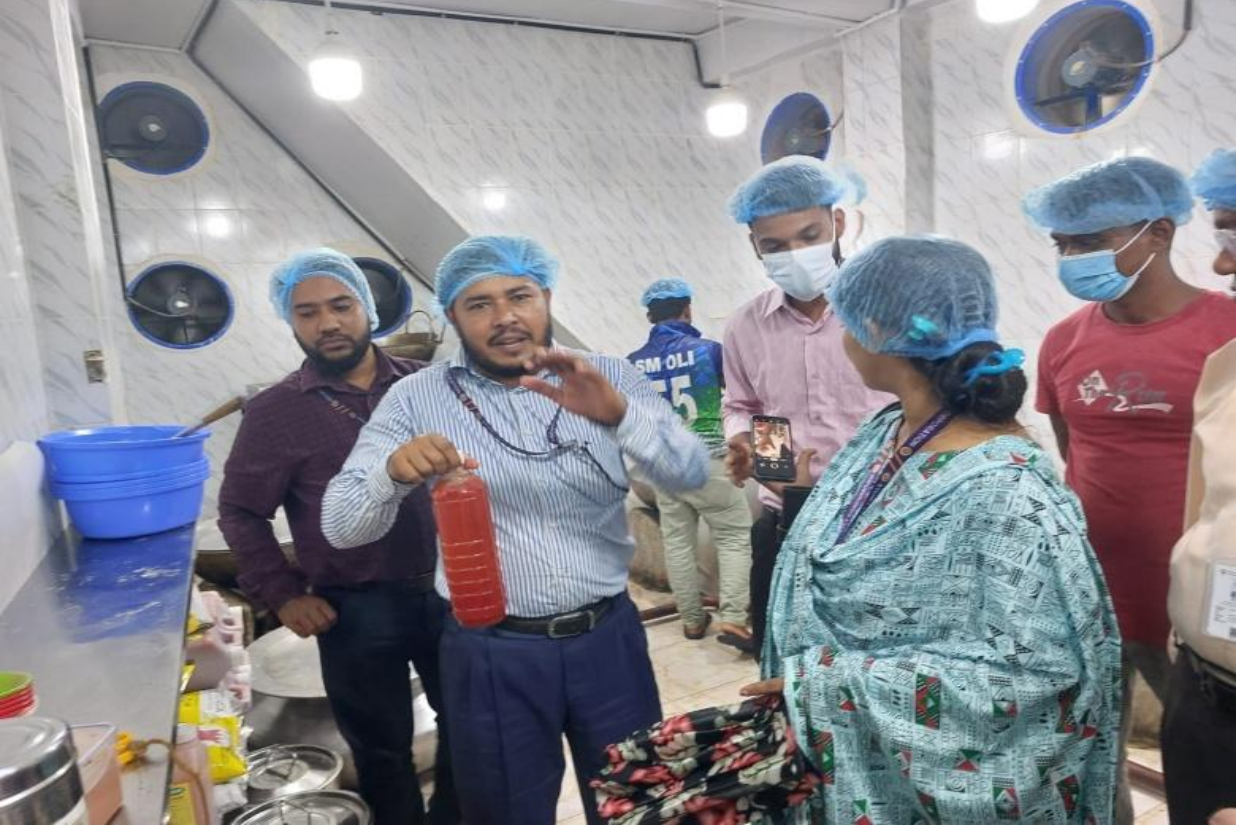
বাজার পরিদর্শনে কার্যক্রমের আলোকচিত্র (১০/০৩/২০২৫)