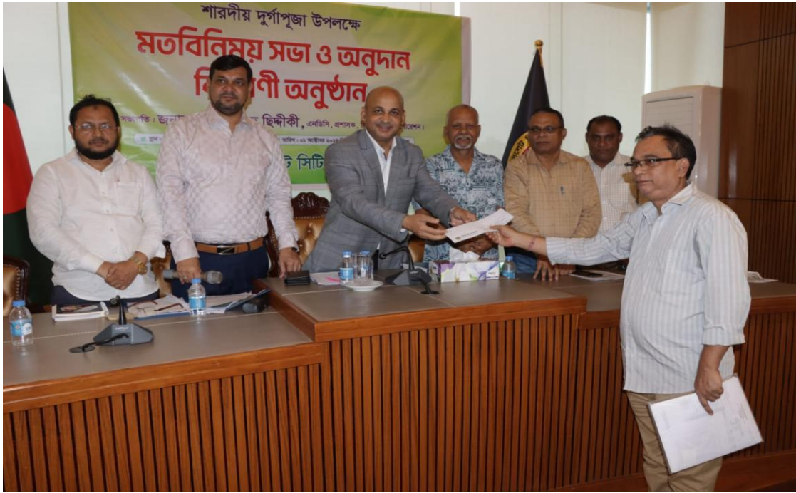
দুর্গাপূজা উপলক্ষে মতবিনিময় সভা ও অনুদান বিতরণী অনুষ্ঠান (০১/১০/২০২৪)