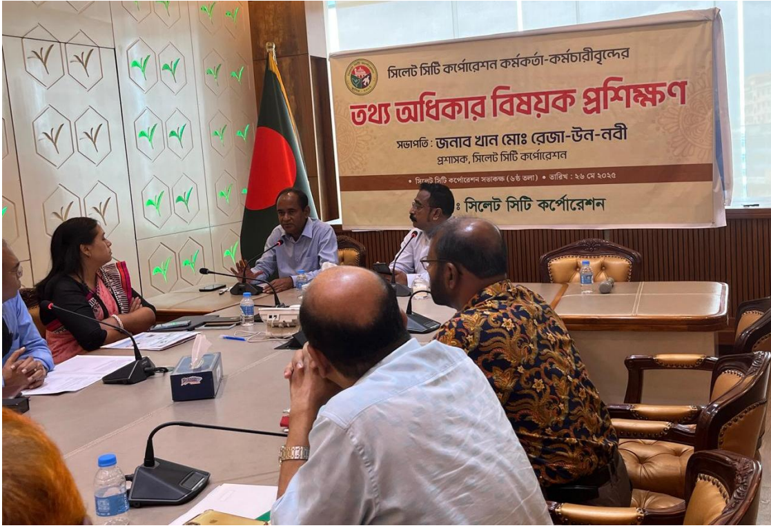
তথ্য অধিকার বিষয়ক প্রশিক্ষণ (২৯/০৫/২০২৫)