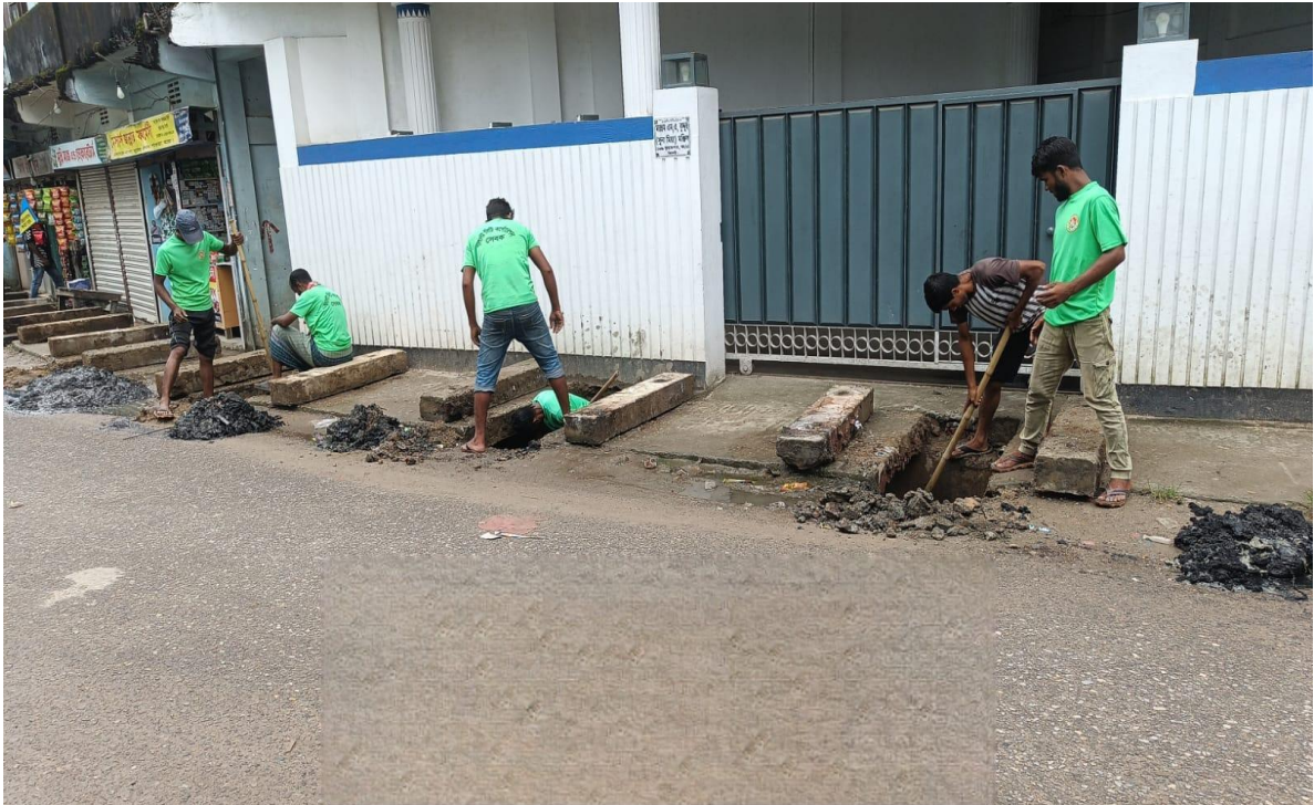
বর্জ্য ব্যবস্থাপনা বিভাগের রাস্তার কাজের দৃশ্য (২৫/০৯/২০২৪)