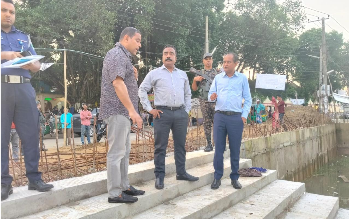
৩৩ নং ওয়ার্ড শাহপরাণ পুকুরের কাজ পরিদর্শনকালে সিসিকের প্রশাসক ও প্রধান নির্বাহী কর্মকর্তা (২৮/০৫/২০২৫)