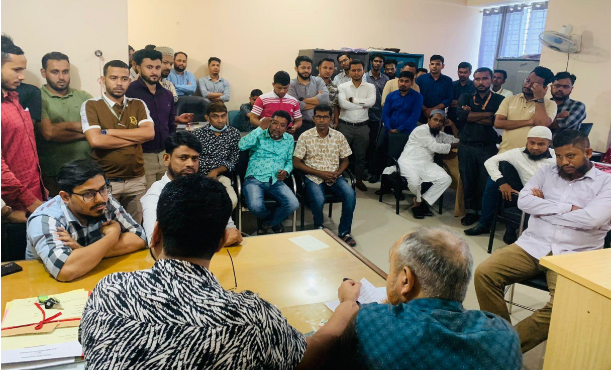
লাইসেন্স আদায়কারীদের সাথে আলোচনা সভা। (০৫/০৫/২০২৫)