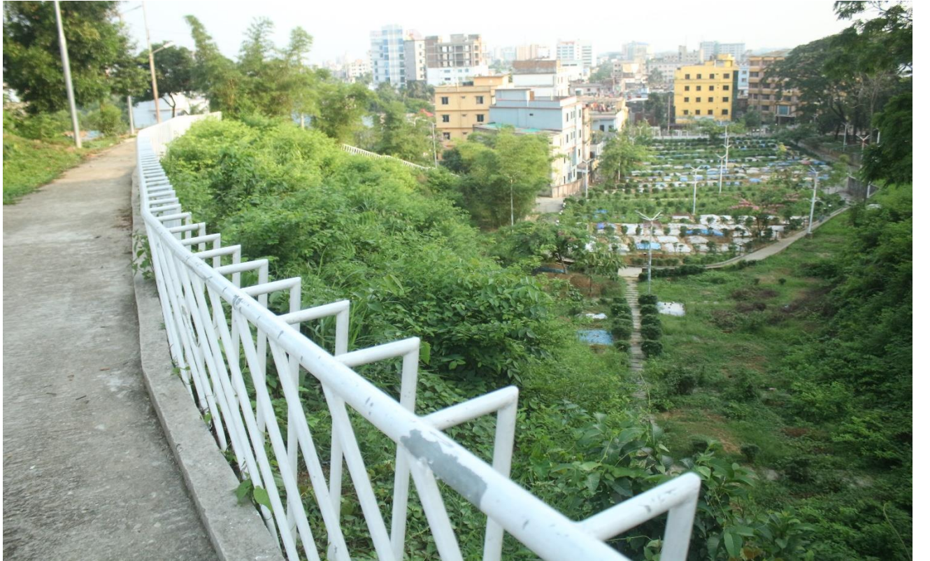
মানিক পীর টিলা কবরস্থান