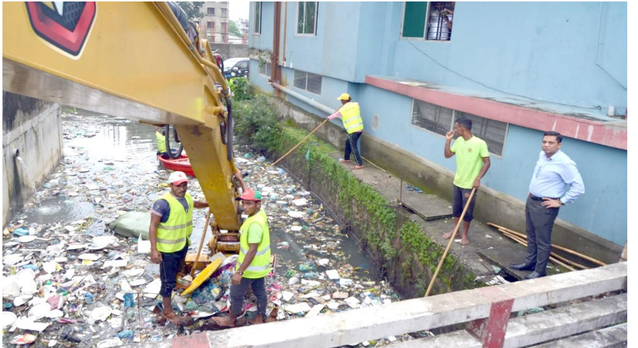
নগরীর তালতলা বৈঠাখালে আটকে থাকা আবর্জনা পরিষ্কার করতে অভিযান করেছে সিসিক।