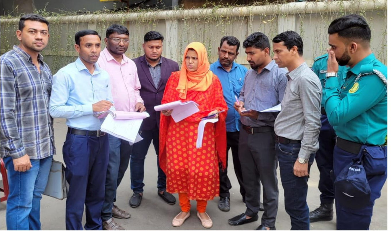
পানির অবৈধ সংযোগ বিচ্ছিন্নকরণ ও বকেয়া বিল আদায়ে সিসিকের অভিযান।