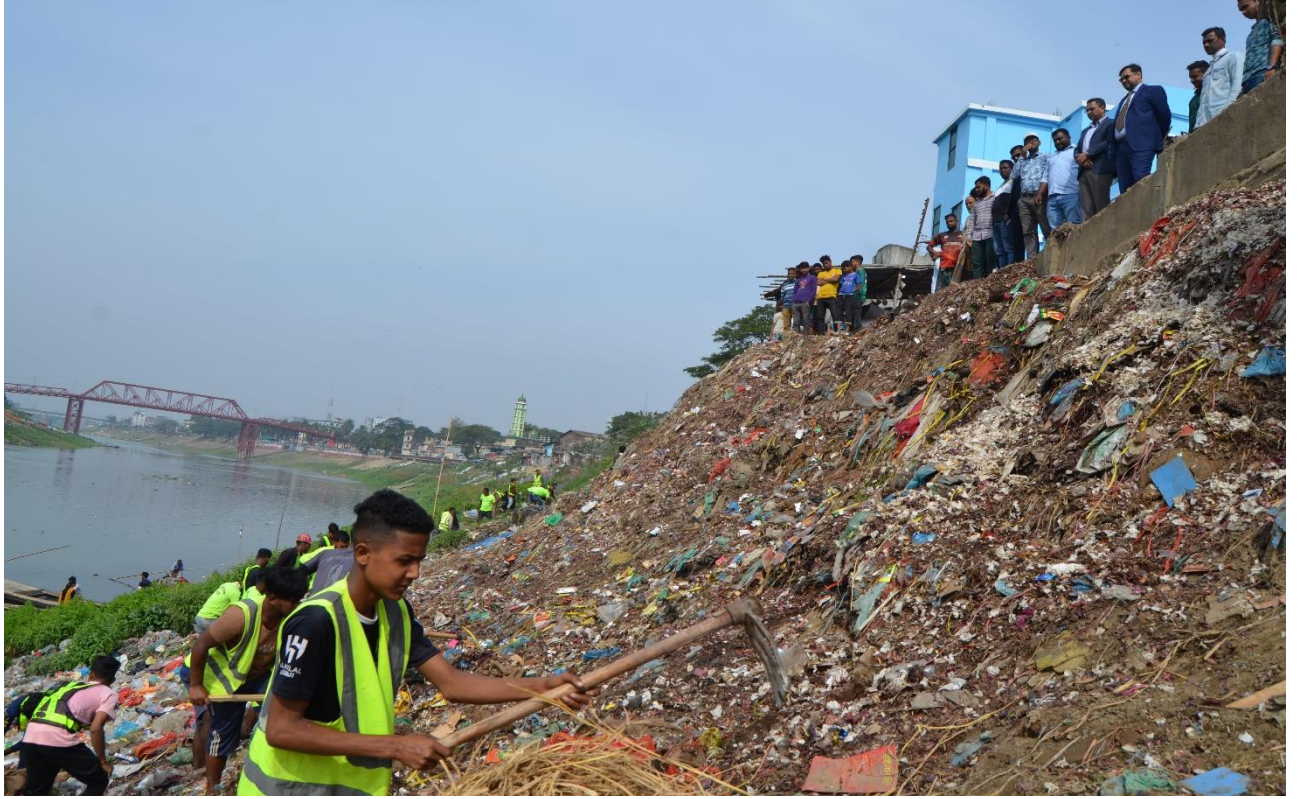
সুরমা নদীর পাড়ের পরিষ্কার পরিচ্ছন্নতা কার্যক্রম পরিদর্শন।