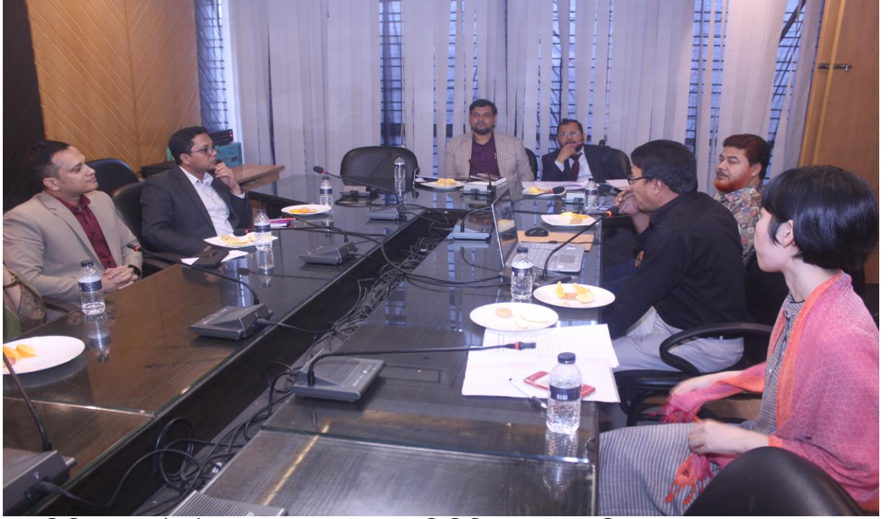
সিসিকের কর্মকর্তা বৃন্দের সাথে জাইকার প্রতিনিধিদের C4C বিষয়ক আলোচনা সভা।