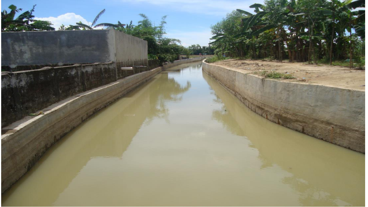
হলদিছড়ায় ইউ-টাইপ ড্রেন নির্মাণ