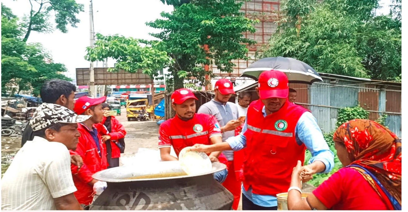
বন্যাতর্কদের মাঝে ত্রাণ সহায়তা করছে সিলেট সিটি কর্পোরেশনের জরুরি সভা অনুষ্ঠিত।