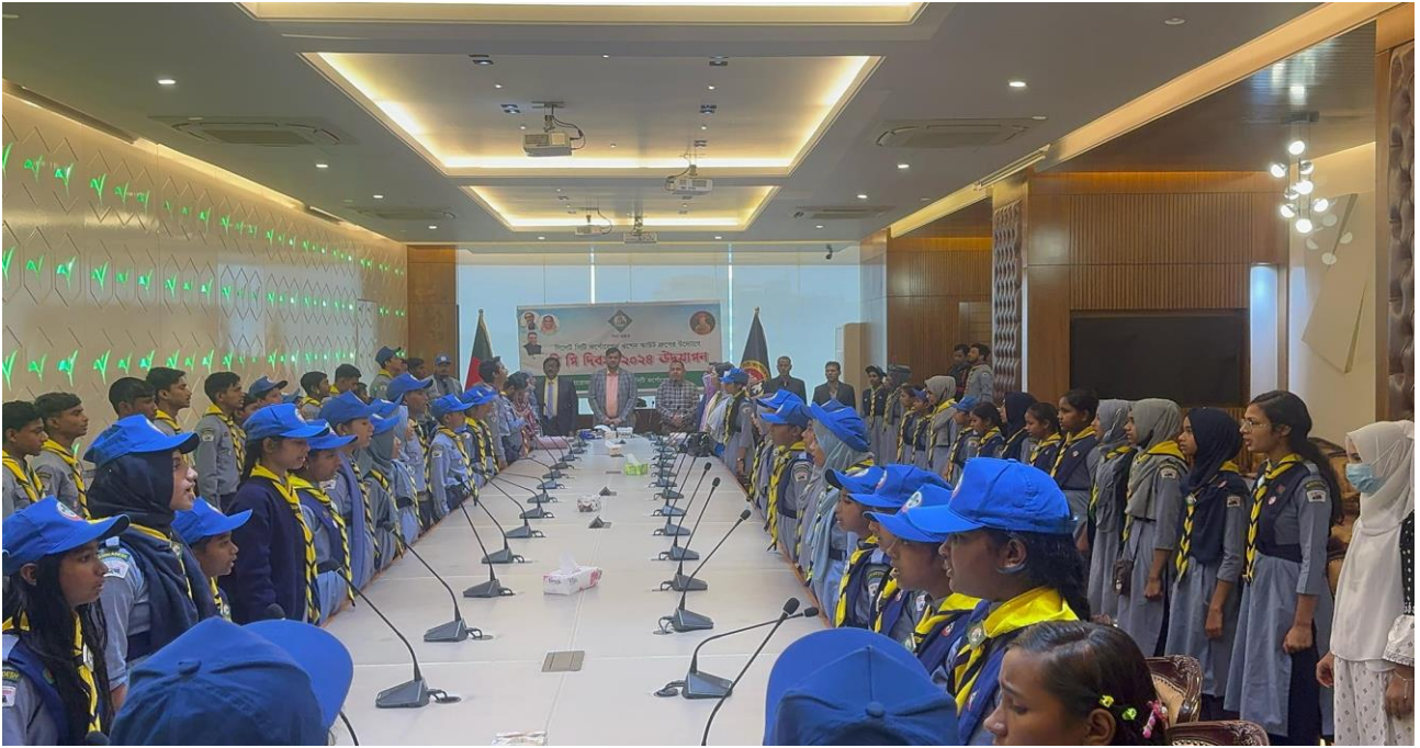
স্কাউট ডিভিশন ২০২৪