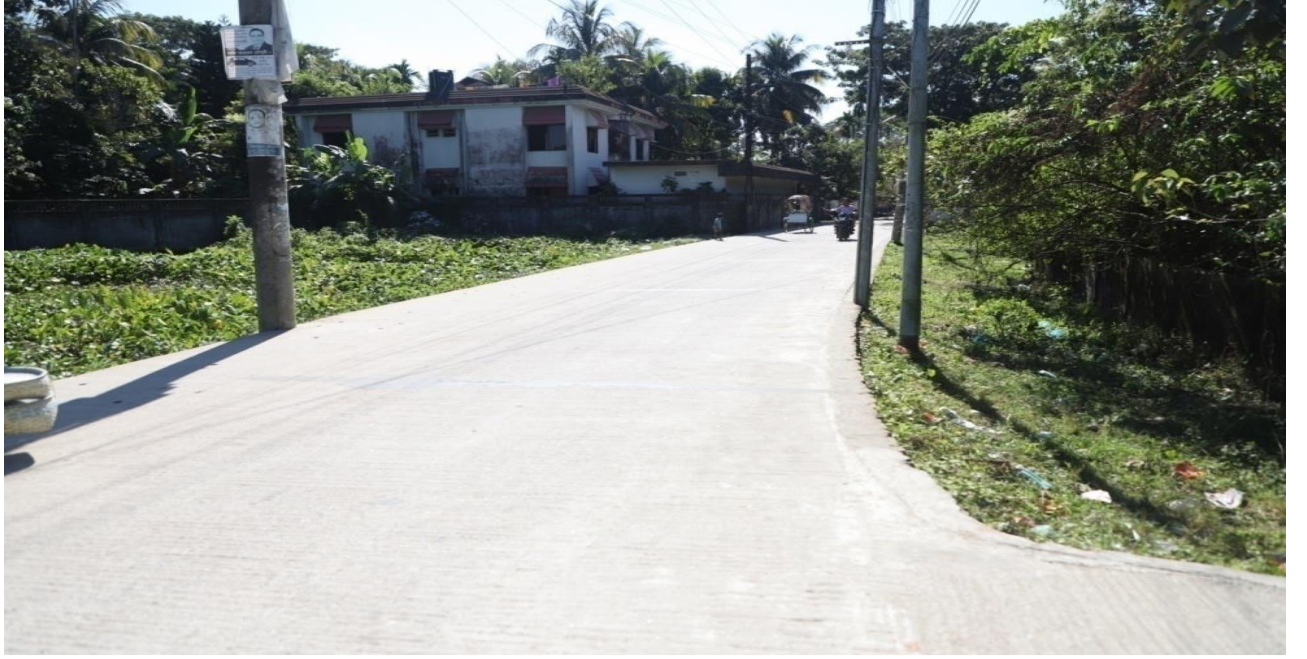
বরইকান্দি গালিমপুর রাস্তা আরসিসি দ্বারা উন্নয়ন