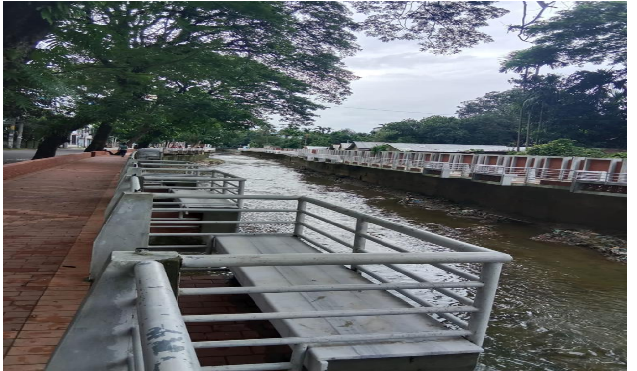
দৃষ্টিনন্দন সাগরদিঘীরপাড় ওয়াকওয়ে