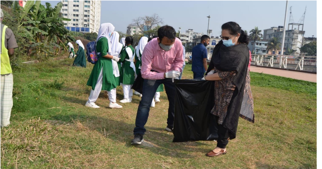
ভারতীয় সহকারী হাই কমিশন এবং সিসিকের যৌথ উদ্যোগে পরিষ্কার-পরিচ্ছন্নতা বিষয়ক সচেতনতামূলক ক্যাম্পেইন অনুষ্ঠিত।