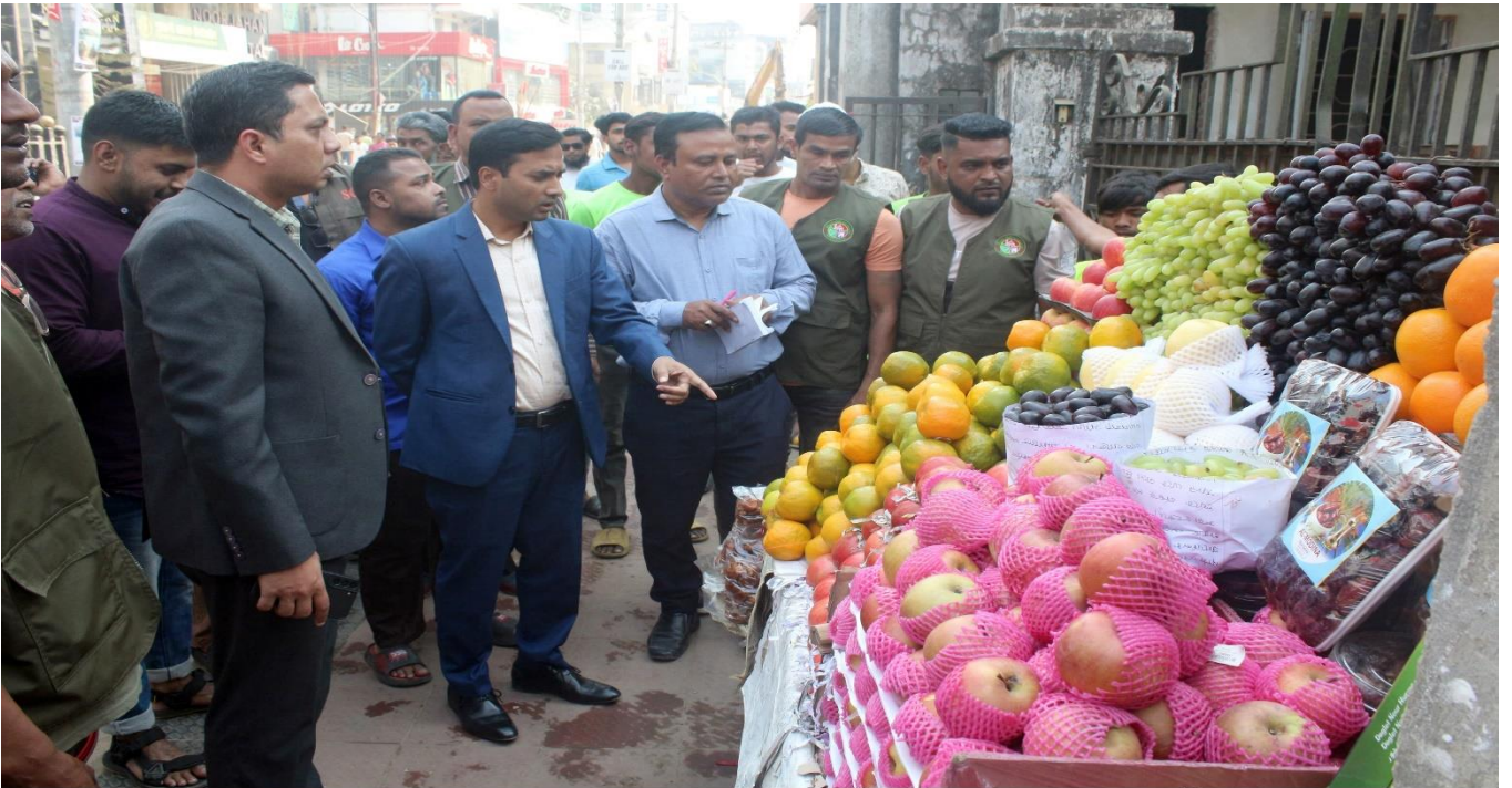
ফুটপাথ দখলমুক্ত করতে সিসিকের অভিযান।