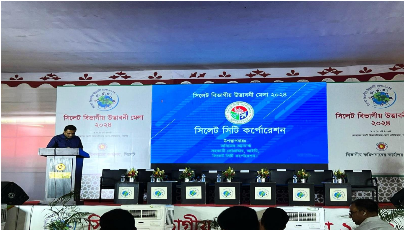
সিলেট বিভাগীয় উদ্ভাবনী মেলা-২০২৪ এ সিলেট সিটি কর্পোরেশন এর উপস্থাপনা।