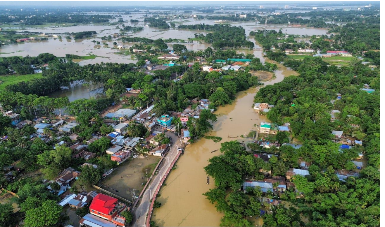
পাখির চোখে সিলেটে বন্যায় প্রাণিত এলাকার দৃশ্য।