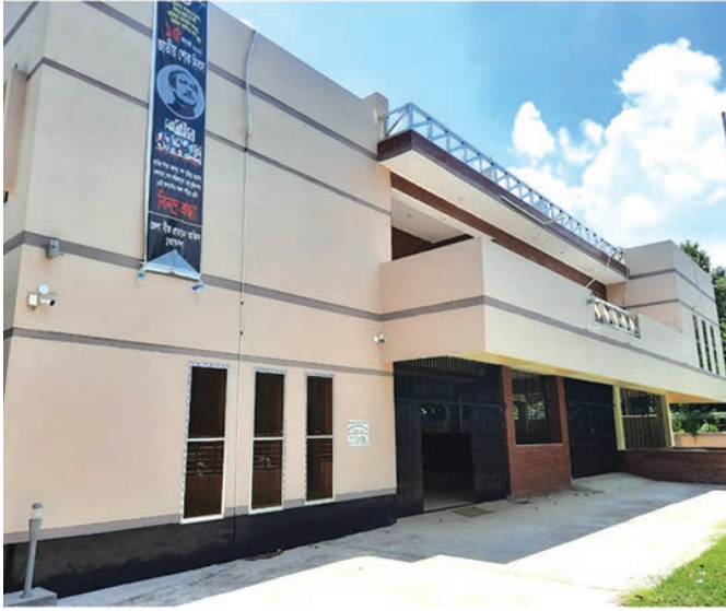
জেলা বীজ প্রত্যয়ন অফিস, নীলফামারী