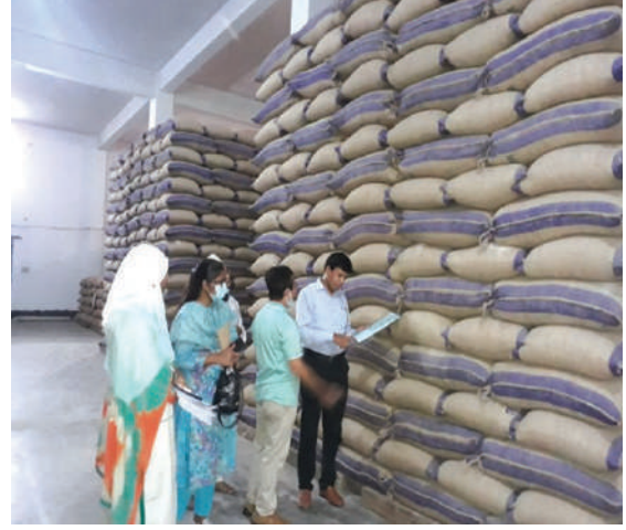
চলছে নমুনা সংগ্রহের কাজ