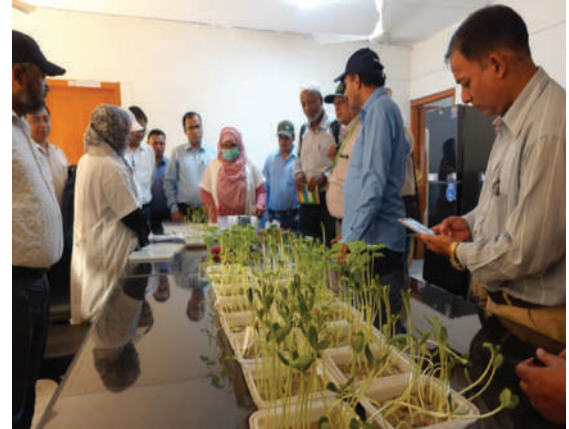
প্রশিক্ষার্থীদের বীজের অঙ্কুরোদগম পরীক্ষা দেখানো