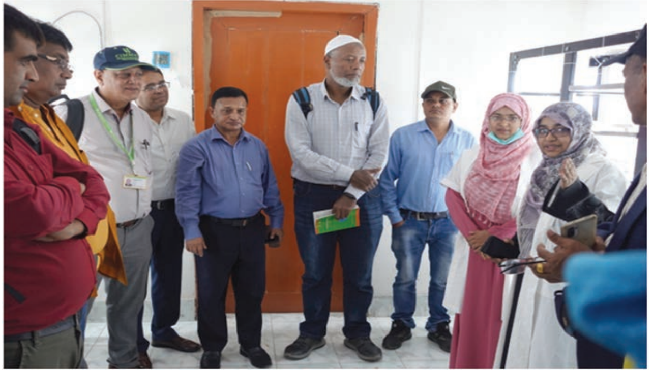
CIMMYT টিম কর্তৃক কেন্দ্রীয় বীজ পরীক্ষাগার পরিদর্শন