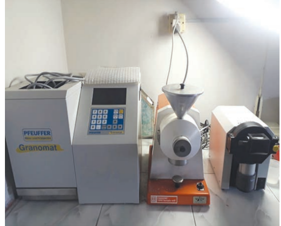
বীজের আর্দ্রতা পরিমাপক যন্ত্র