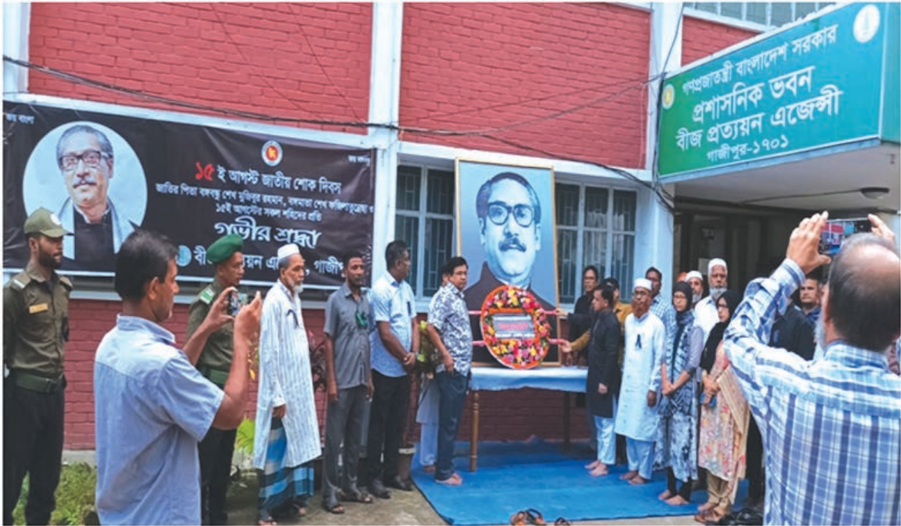
১৫ ই আগস্ট জাতীয় শোক দিবসে জাতির পিতা সহ সকল শহিদের প্রতি শ্রদ্ধা নিবেদন