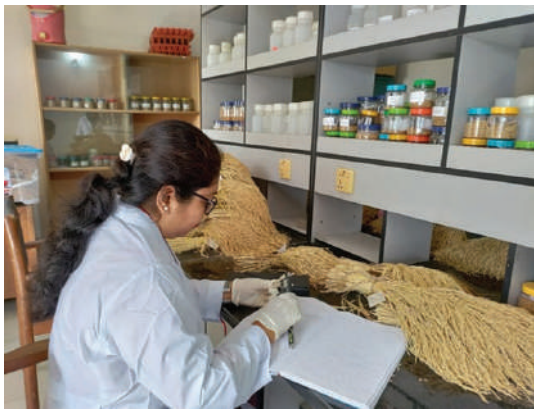
ল্যাবে ধান ফসলের গ্রো-আউট টেস্ট এর তথ্য সংগ্রহ