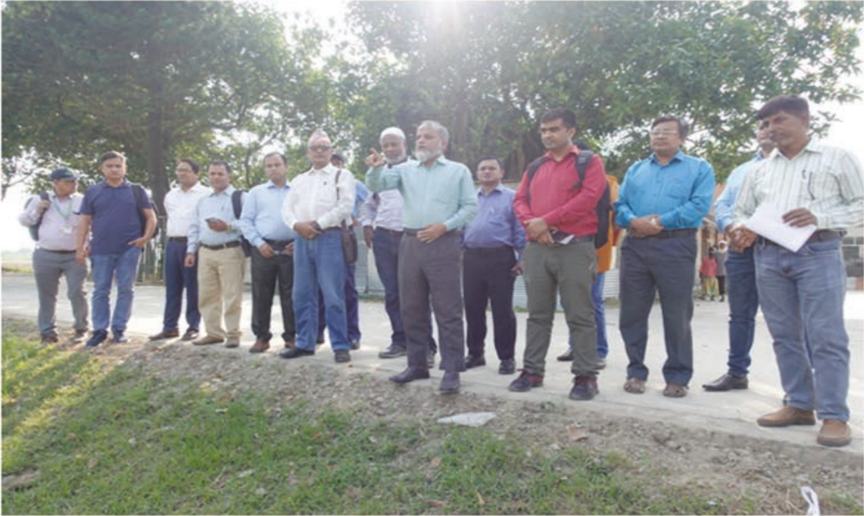
CIMMYT টিম কর্তৃক কন্ট্রোল ফার্ম পরিদর্শন