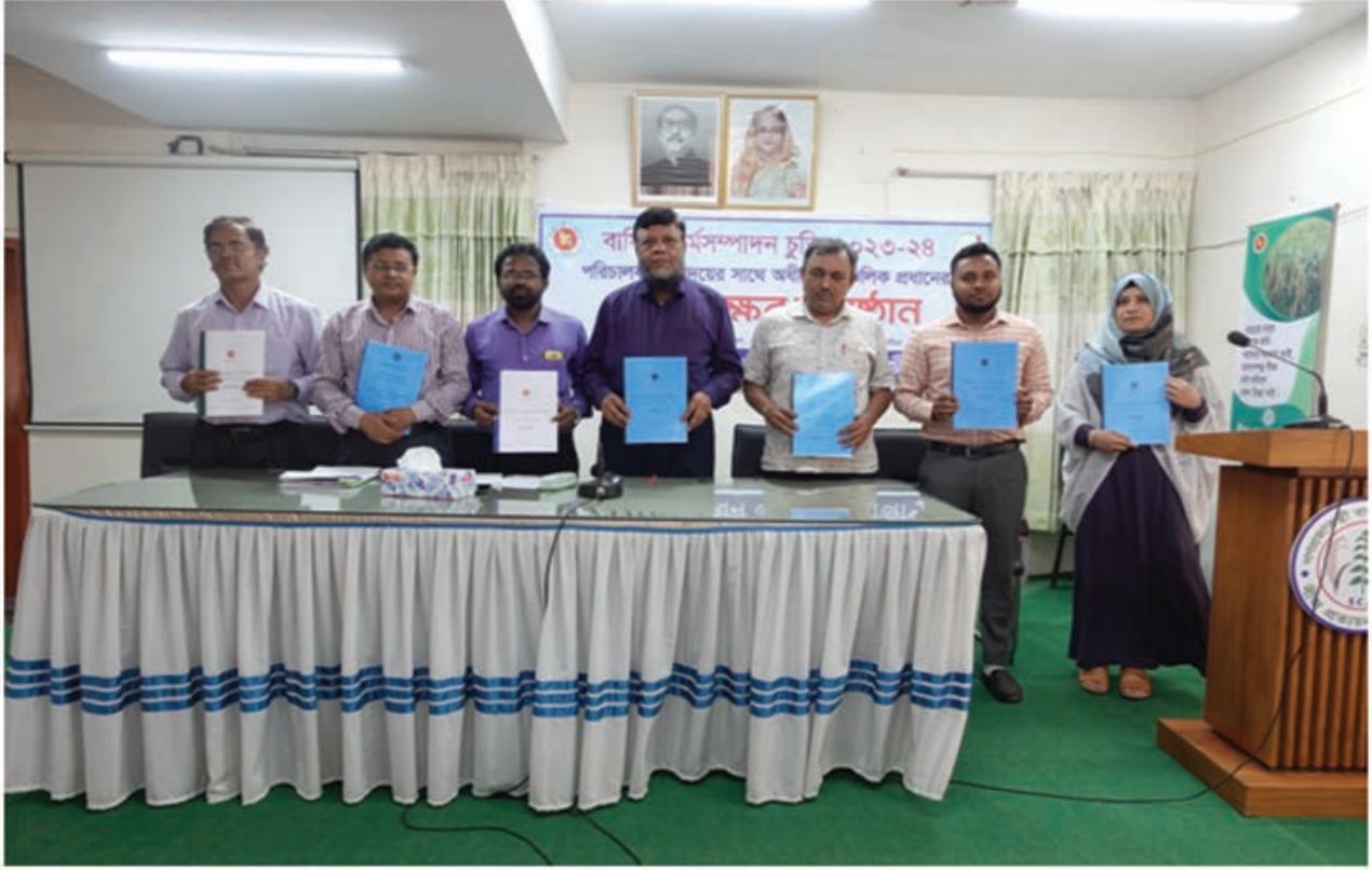
বার্ষিক কর্মসম্পাদন চুক্তি স্বাক্ষর অনুষ্ঠান