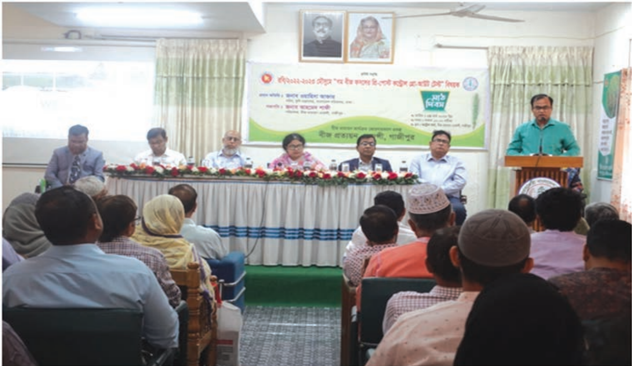
“বোরো বীজ ফসলের প্রি-পোস্ট কন্ট্রোল থ্রো-আউট টেস্ট” বিষয়ক মাঠ দিবস