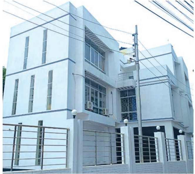
জেলা বীজ প্রত্যয়ন অফিস, রাজবাড়ি