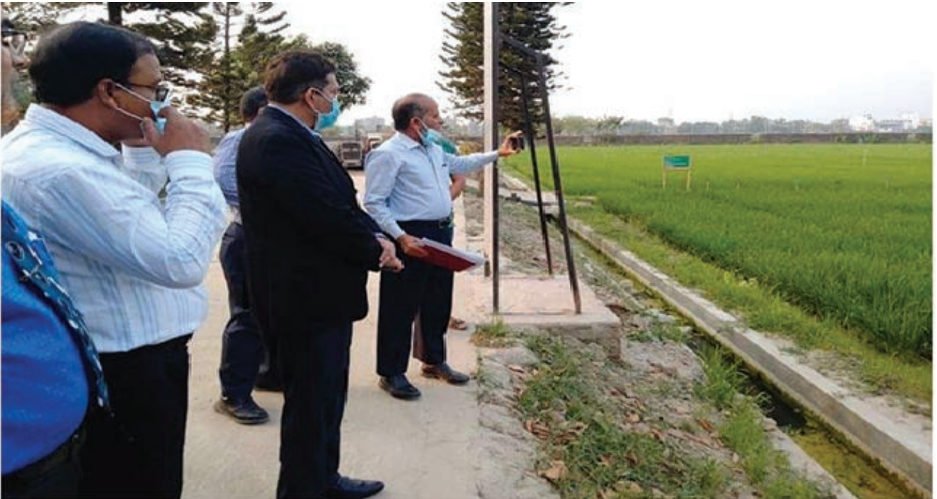
কৃষি মন্ত্রণালয়ের প্রতিনিধির কন্ট্রোল ফার্ম পরিদর্শন