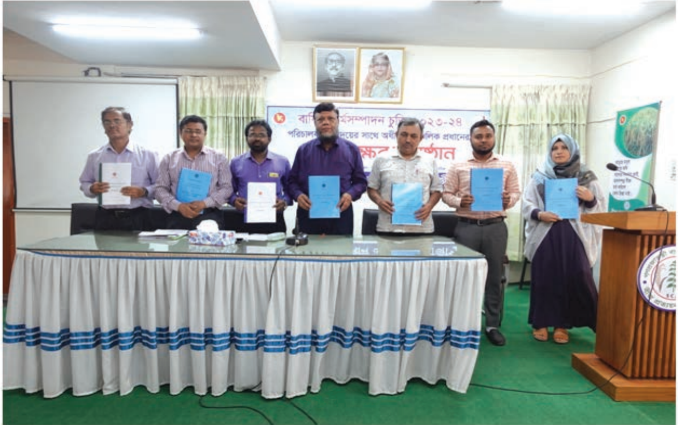
বার্ষিক কর্মসম্পাদন চুক্তি ২০২৩-২৪ স্বাক্ষর অনুষ্ঠানে আঞ্চলিক প্রধানগণ