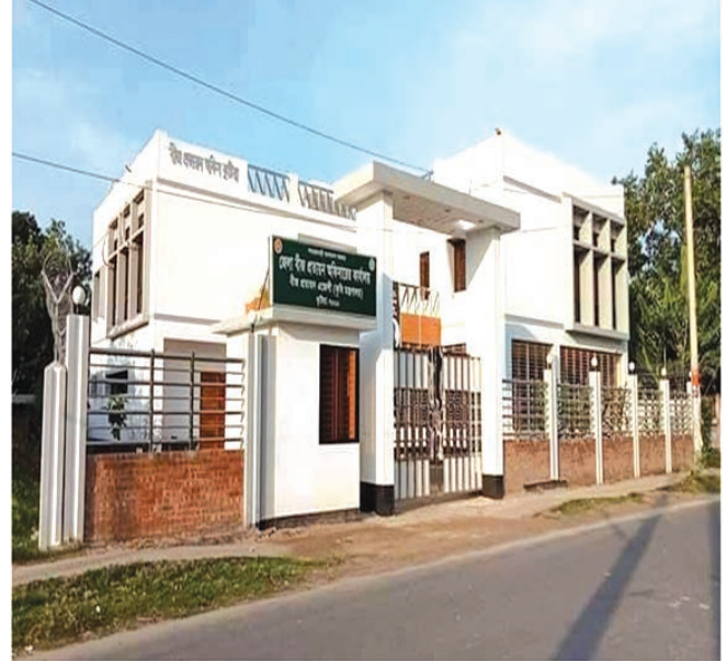
জেলা বীজ প্রত্যয়ন অফিস, কুষ্টিয়া