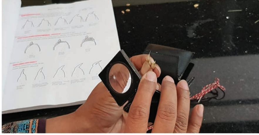
জাত পরীক্ষা ল্যাব এ গমের বীজ পর্যবেক্ষণ