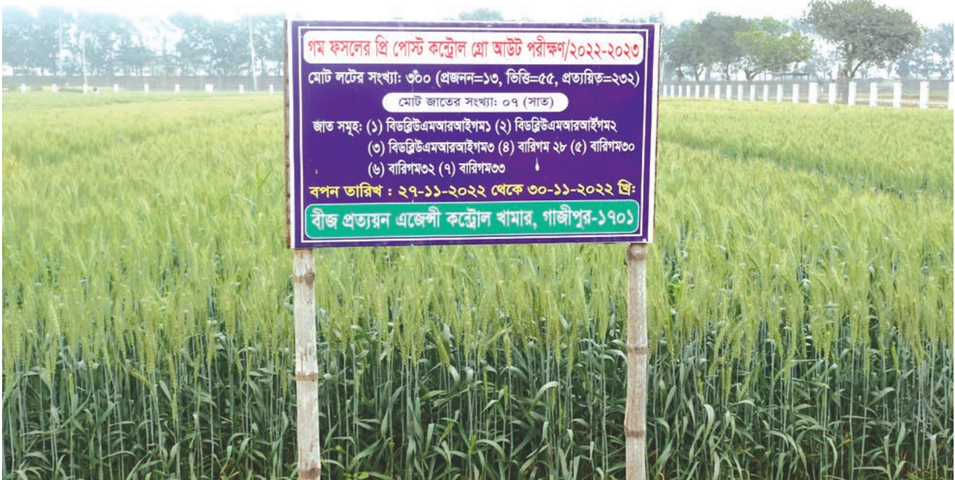
গম ফসলের প্রি পোস্ট কন্ট্রোল গ্রো আউট পরীক্ষা