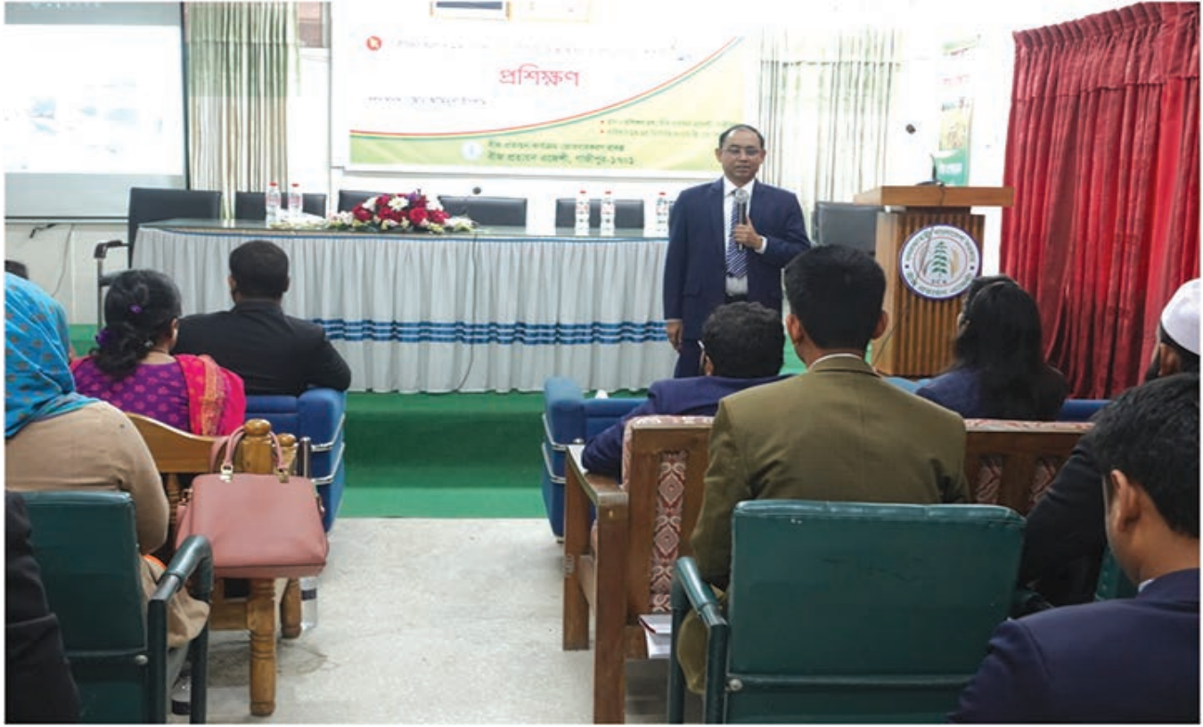
বীজের গুণমান নিয়ন্ত্রণ এবং বীজ আইন ও বিধি বিষয়ক প্রশিক্ষণ