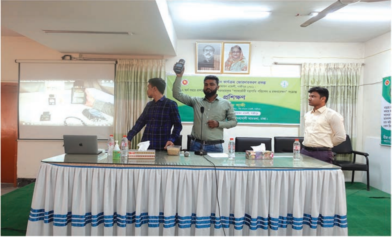
ল্যাবরেটরি যন্ত্রপাতি পরিচালন ও রক্ষণাবেক্ষন সংক্রান্ত প্রশিক্ষণ