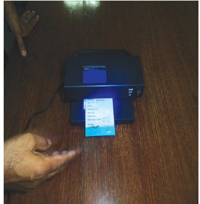
জাল ট্যাগ চিহ্নিত করার মেশিন