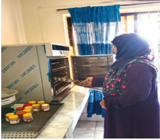
বীজের আর্দ্রতা পরীক্ষা করা হচ্ছে