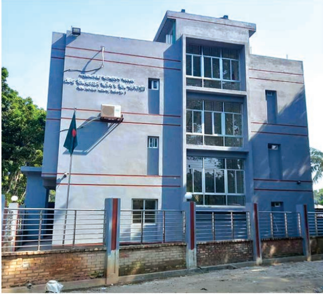
জেলা বীজ প্রত্যয়ন অফিস, ফরিদপুর