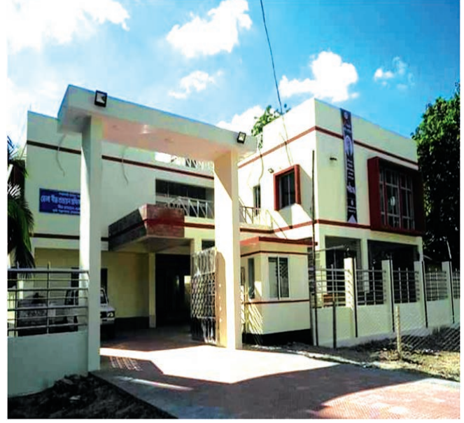
জেলা বীজ প্রত্যয়ন অফিস, মেহেরপুর