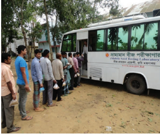
প্রাপ্তিক পর্যায়ে বীজ পরীক্ষার জন্য ড্রাম্যমান বীজ পরীক্ষাগার