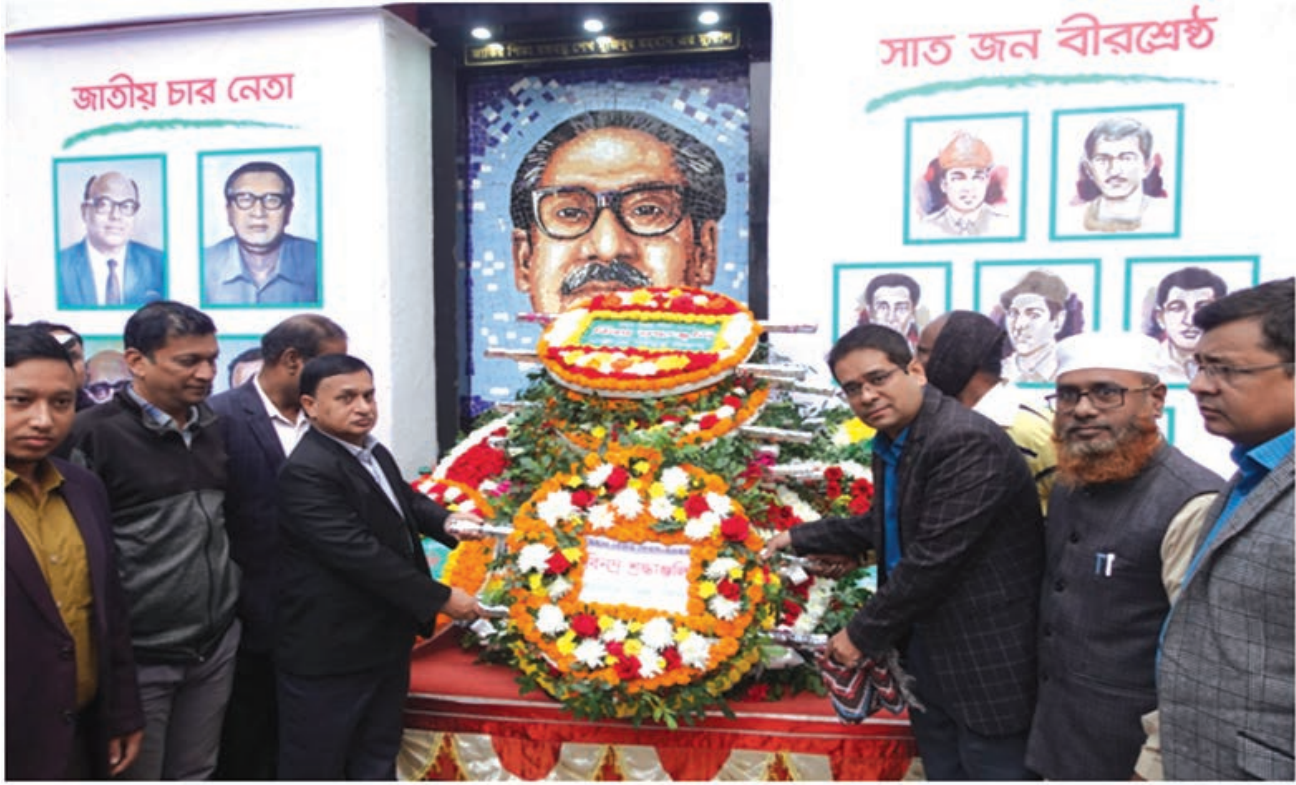
মহান বিজয় উপলক্ষে বীজ প্রত্যয়ন এজেন্সী হতে পুষ্প স্তবক অর্পণ