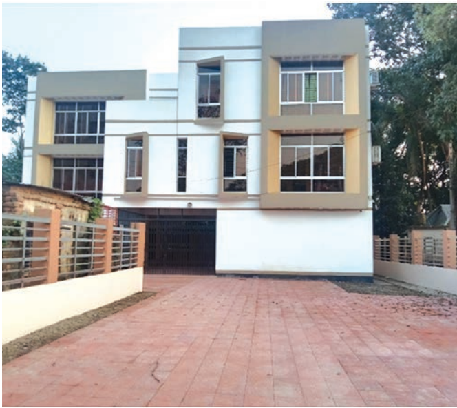
জেলা বীজ প্রত্যয়ন অফিস, ব্রাহ্মনবাড়িয়া