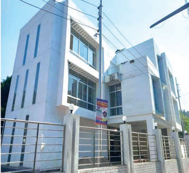
জেলা বীজ প্রত্যয়ন অফিস, রাজবাড়ি