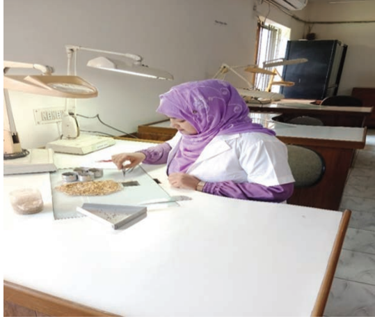
বীজ বিশ্লেষক কর্তৃক বীজের বিশুদ্ধতা পরীক্ষা