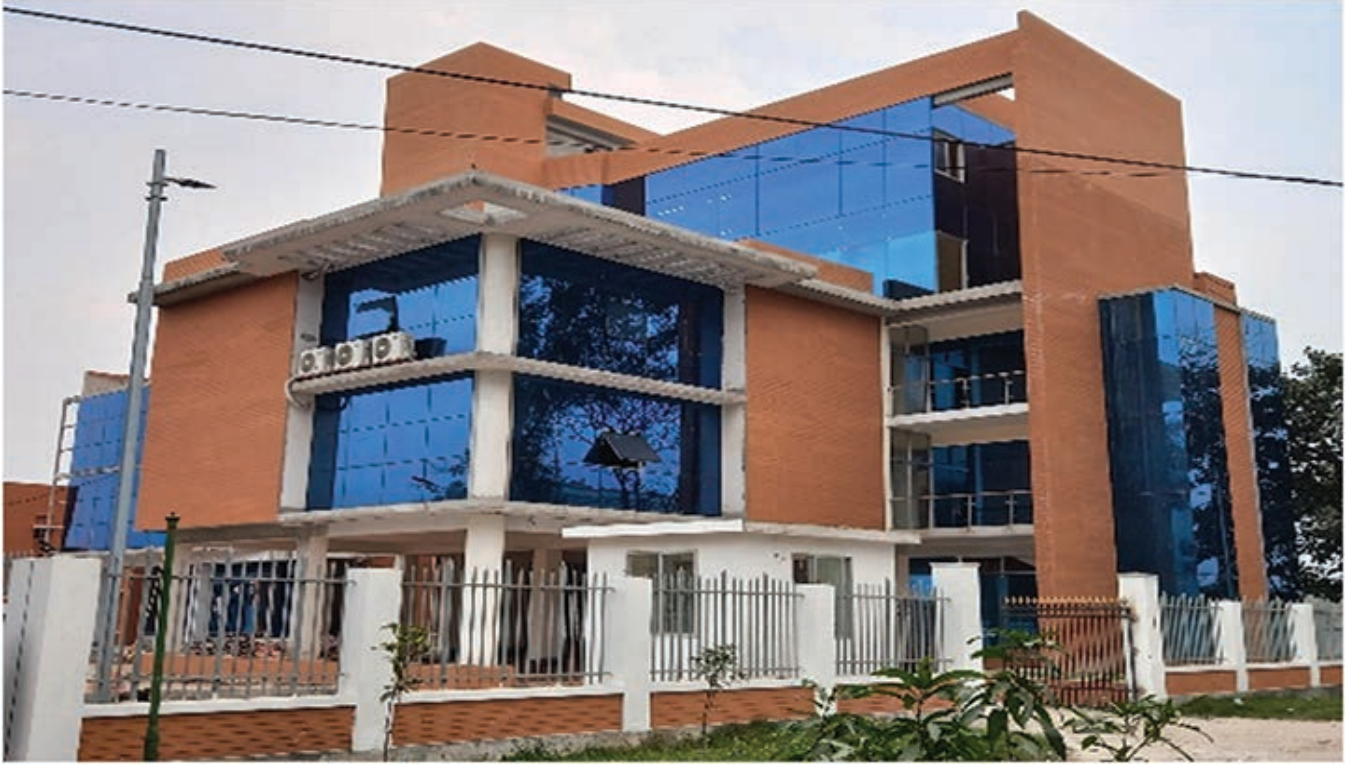
নির্মাণাধীন নতুন প্রশাসনিক ভবন, এমসিএ সদর দপ্তর