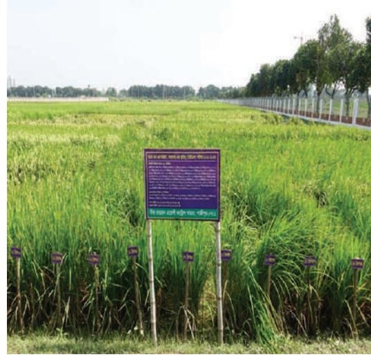
আমন ধান এর স্বতন্ত্রতা, সমরূপতা এবং স্থায়িত্ব (ডিইউএস) পরীক্ষা প্লট