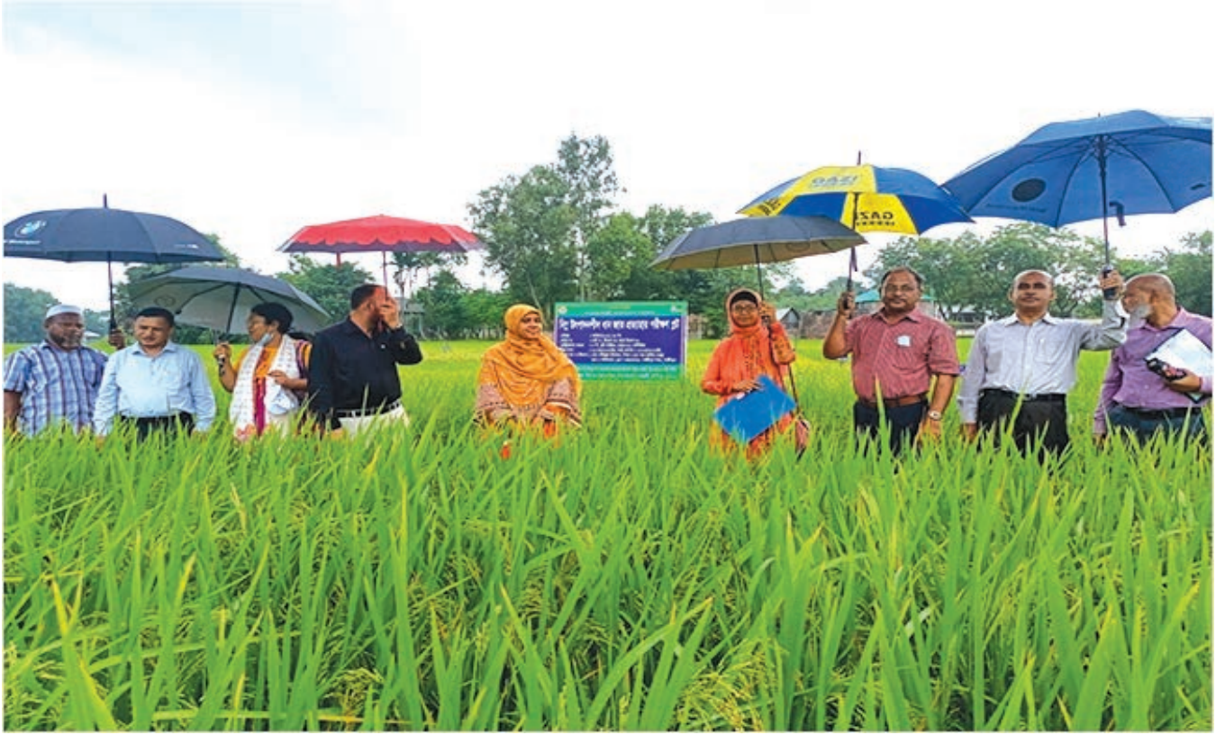
নিম্ন উৎপাদনশীল ধানের জাত প্রত্যাহার পরীক্ষা প্লট পর্যবেক্ষণে পরিচালক সহ অন্যান্য কর্মকর্তা