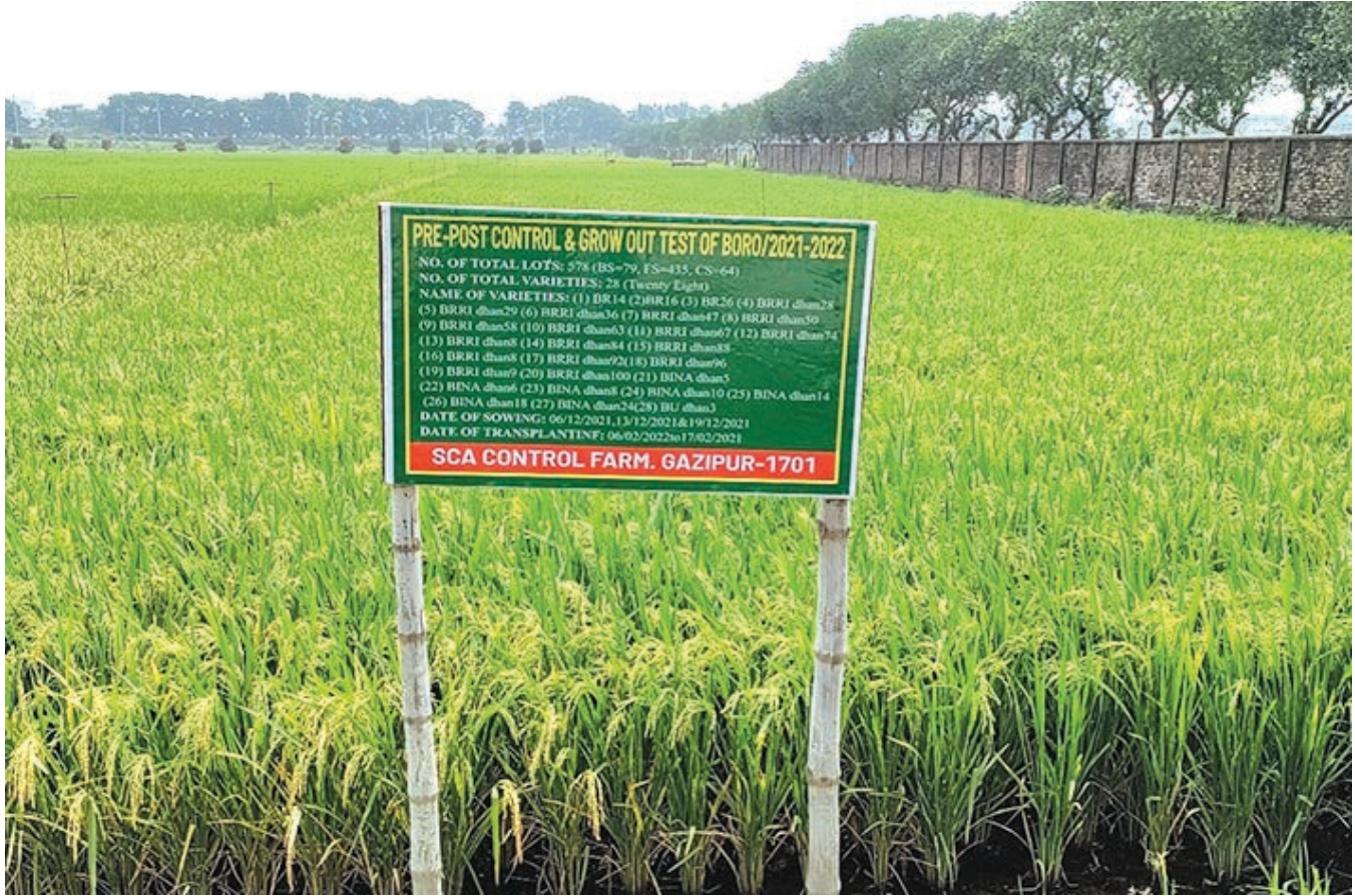
ধানের গ্রো-আউট টেস্ট প্লট