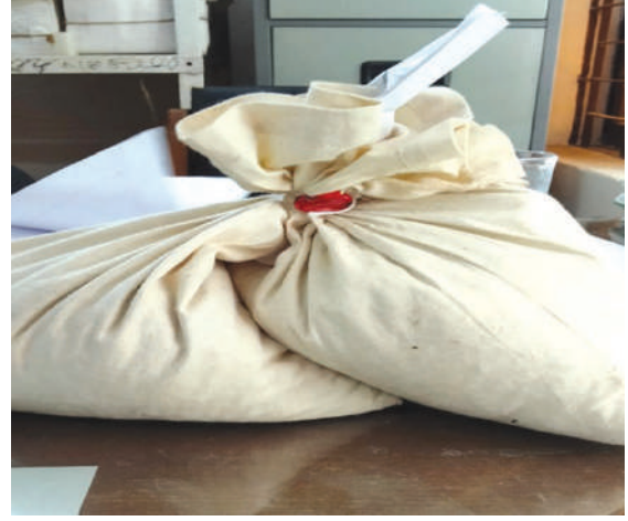
পরীক্ষাগারে বীজ নমুনা পাঠানোর পদ্ধতি