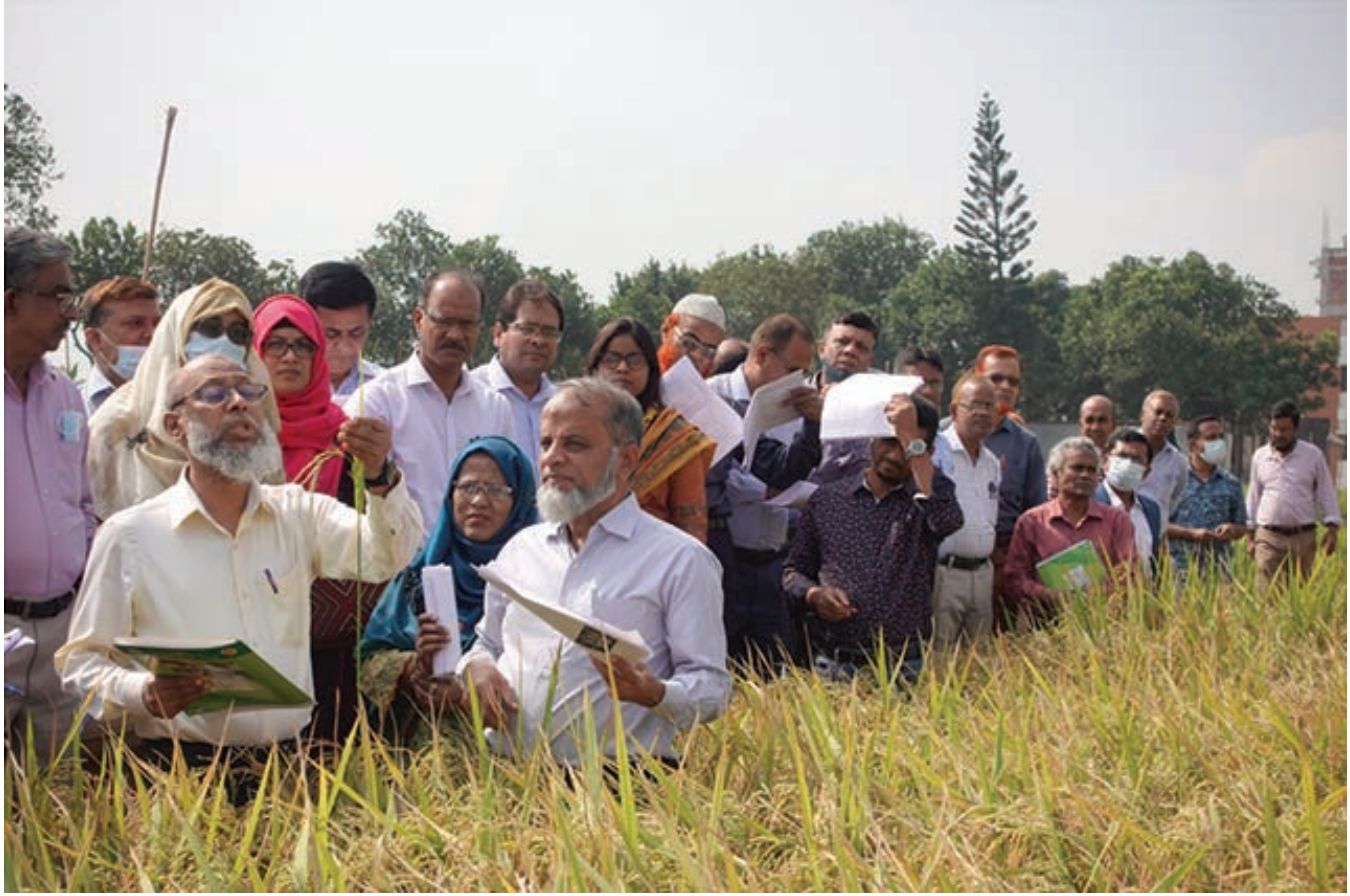
আমন বীজ ফসলের প্রি পোস্ট কন্ট্রোল গ্রো আউট টেস্ট এর মাঠ দিবসে বিভিন্ন স্তরের প্রতিনিধি নিয়ে মাঠ পর্যবেক্ষণ