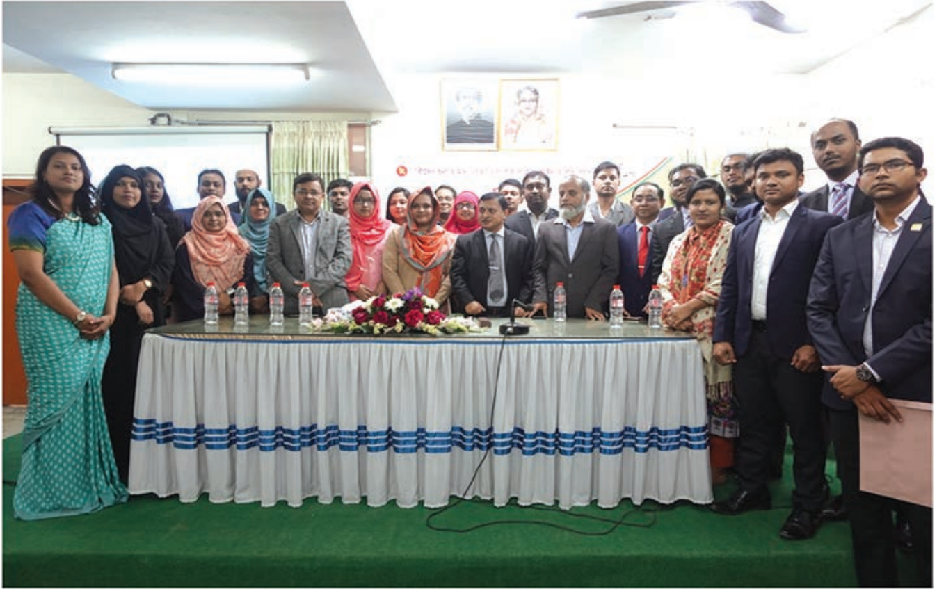
নব যোগদানকৃত ক্যাডার অফিসারদের সাথে এসসিএ এর উর্ধ্বতন কর্মকর্তা