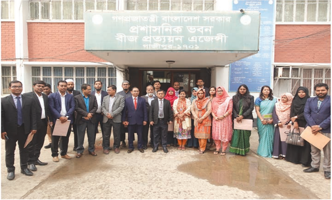
নব যোগদানকৃত ক্যাডার অফিসারদের সাথে এসসিএ এর উর্ধ্বতন কর্মকর্তা