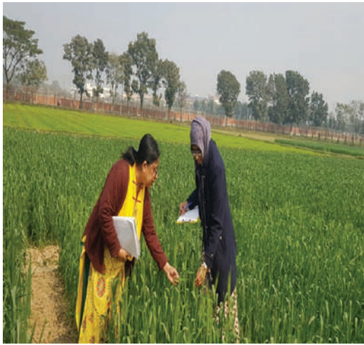
গমের ডিইউএস এর ডাটা সংগ্রহ