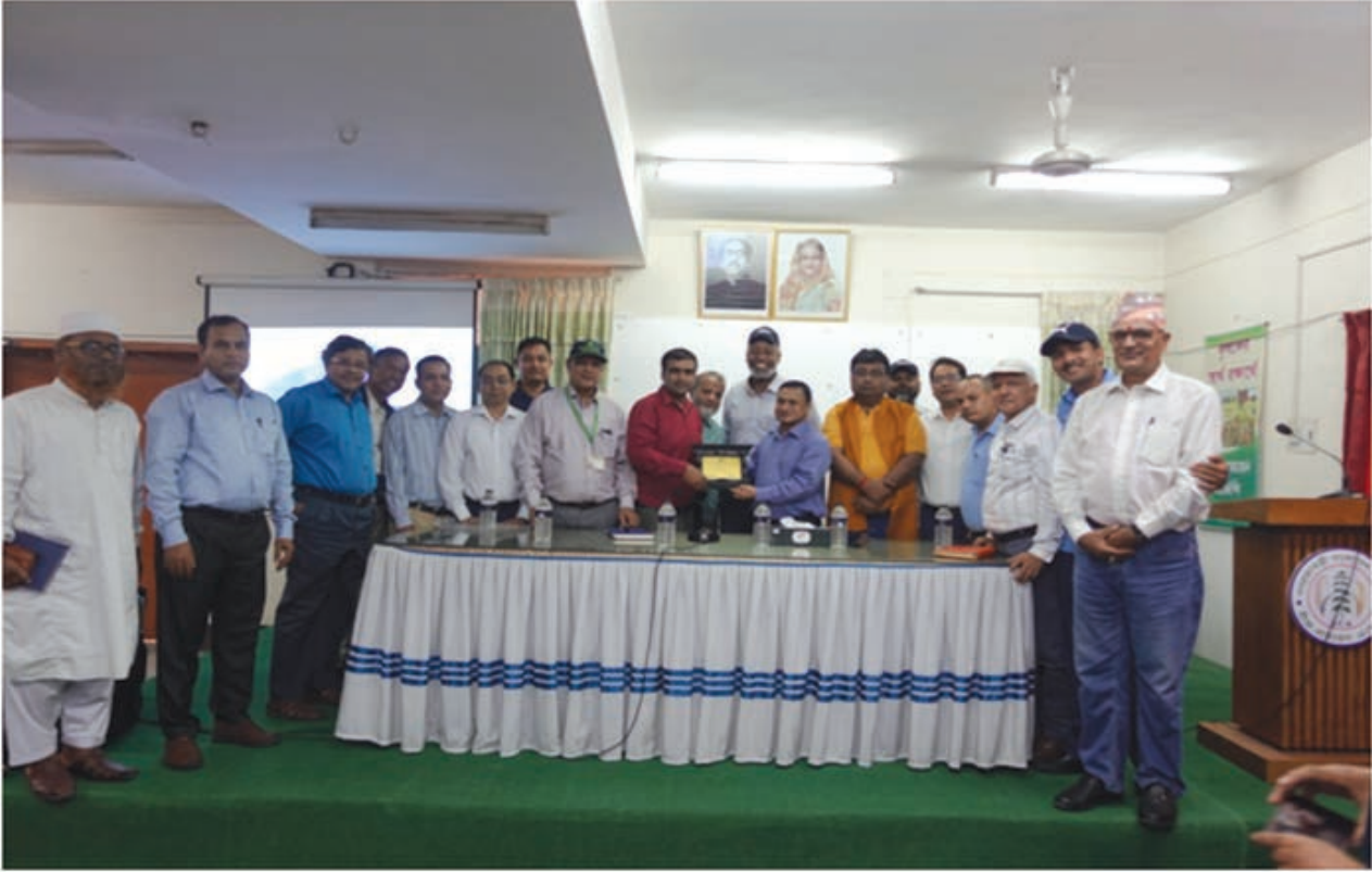
CIMMYT টিম এর সাথে বীজ প্রত্যয়ন এজেন্সীর কর্মকর্তাগণ