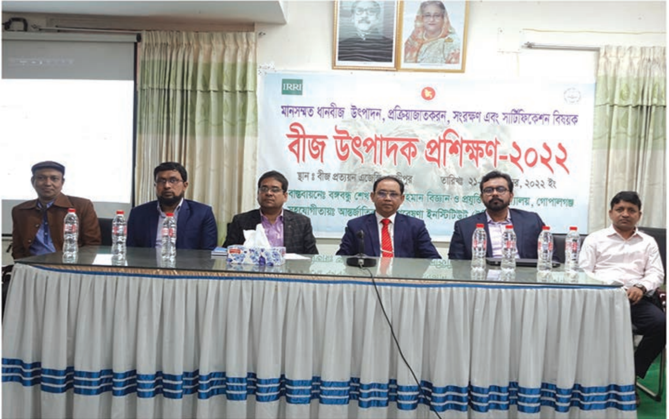
আন্তর্জাতিক ধান গবেষণা ইনস্টিটিউট এর সহযোগীতায় বীজ উৎপাদক প্রশিক্ষণ-২০২২