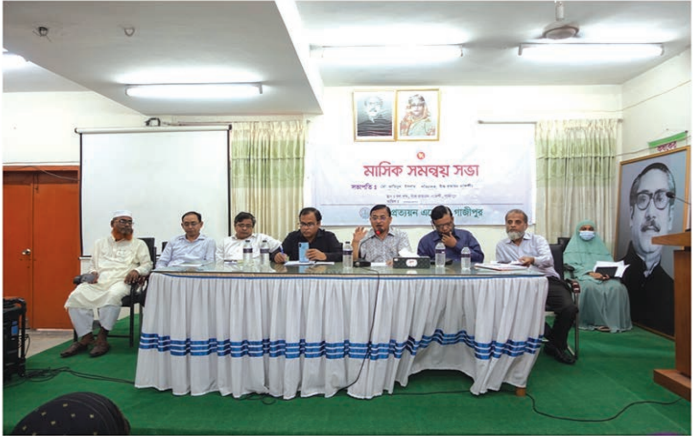
সদর দপ্তরে মাসিক সমন্বয় সভায় এসসিএ এর বিভিন্ন বিষয়ে আলোচনার মাধ্যমে সিদ্ধান্ত গ্রহণ