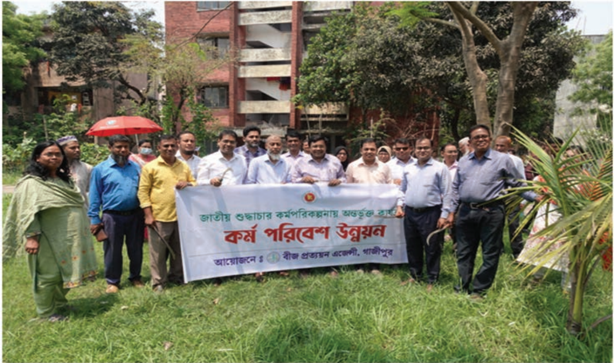
জাতীয় শুদ্ধাচার কর্মপরিকল্পনার অংশ হিসেবে কর্ম পরিবেশ উন্নয়ন কার্যক্রম