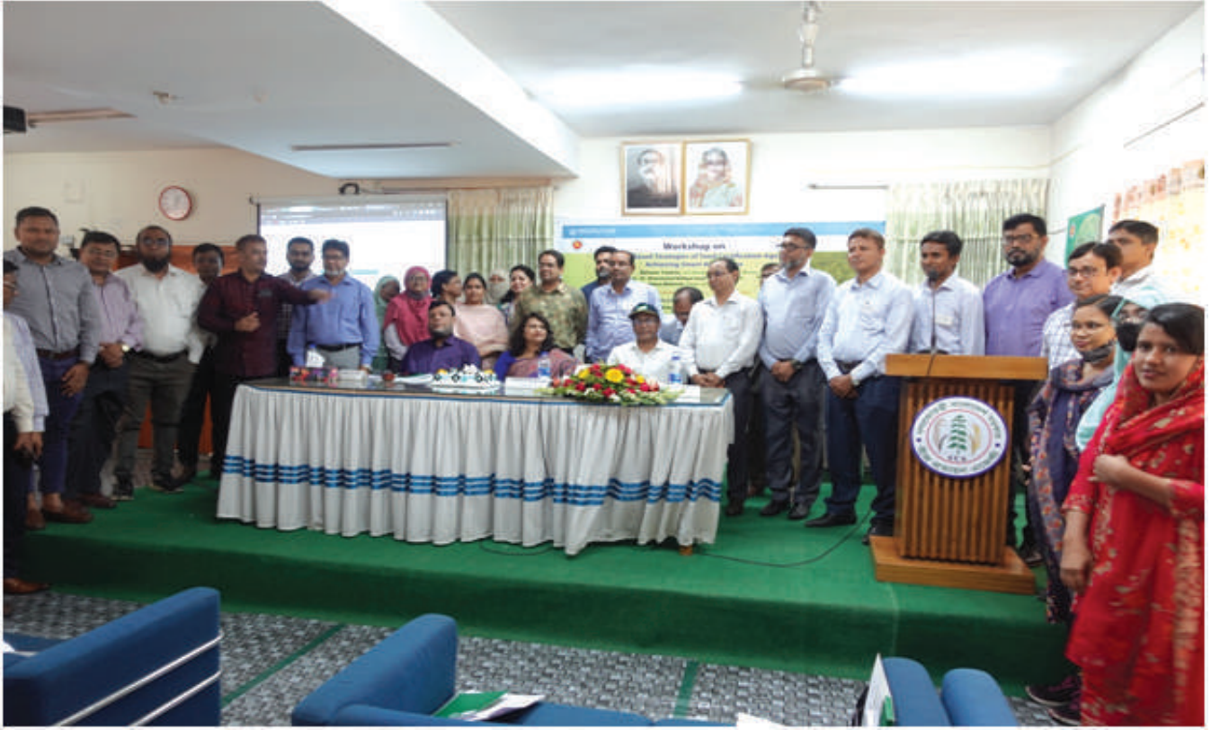
স্মার্ট কৃষি অর্জনে বীজ প্রত্যয়ন এজেন্সীর কৌশল শীর্ষক কর্মশালায় আমন্ত্রিত অতিথিবৃন্দ