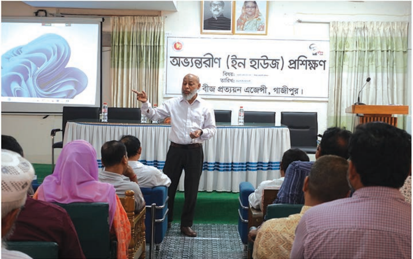
কর্মকর্তা ও কর্মচারীদেও অভ্যন্তরীণ (ইন-হাউজ) প্রশিক্ষণ প্রদান