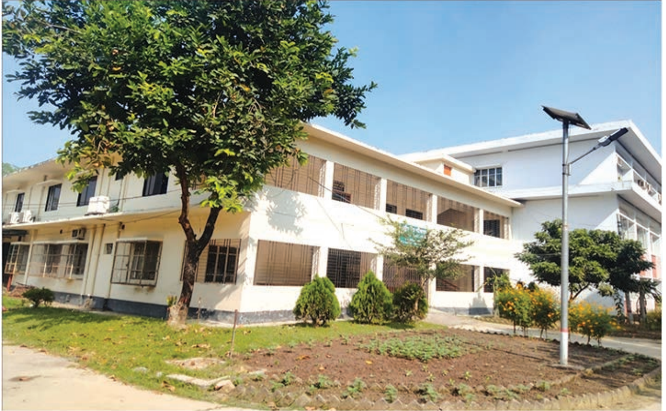
কেন্দ্রীয় বীজ পরিক্ষাগার, এমসিএ