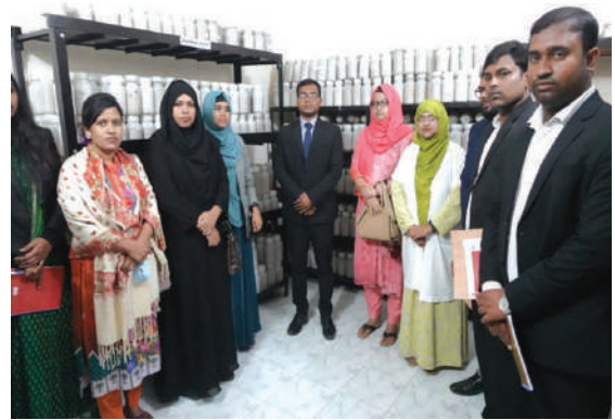
শীতাতপ নিয়ন্ত্রিত বীজ সংরক্ষণাগারে নব যোগদানকৃত ক্যাডার অফিসারগণ