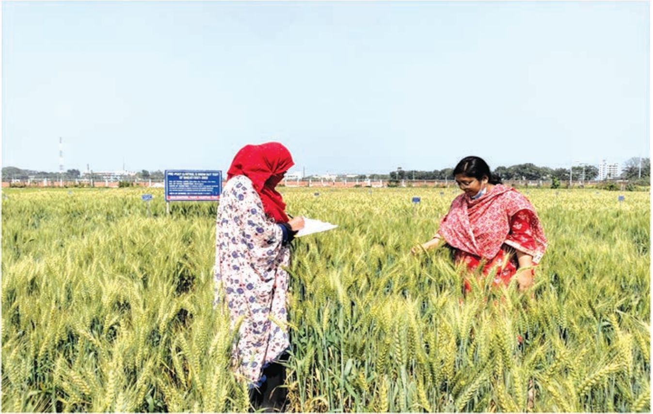
গমের জাত পরীক্ষা সংক্রান্ত তথ্য সংগ্রহ