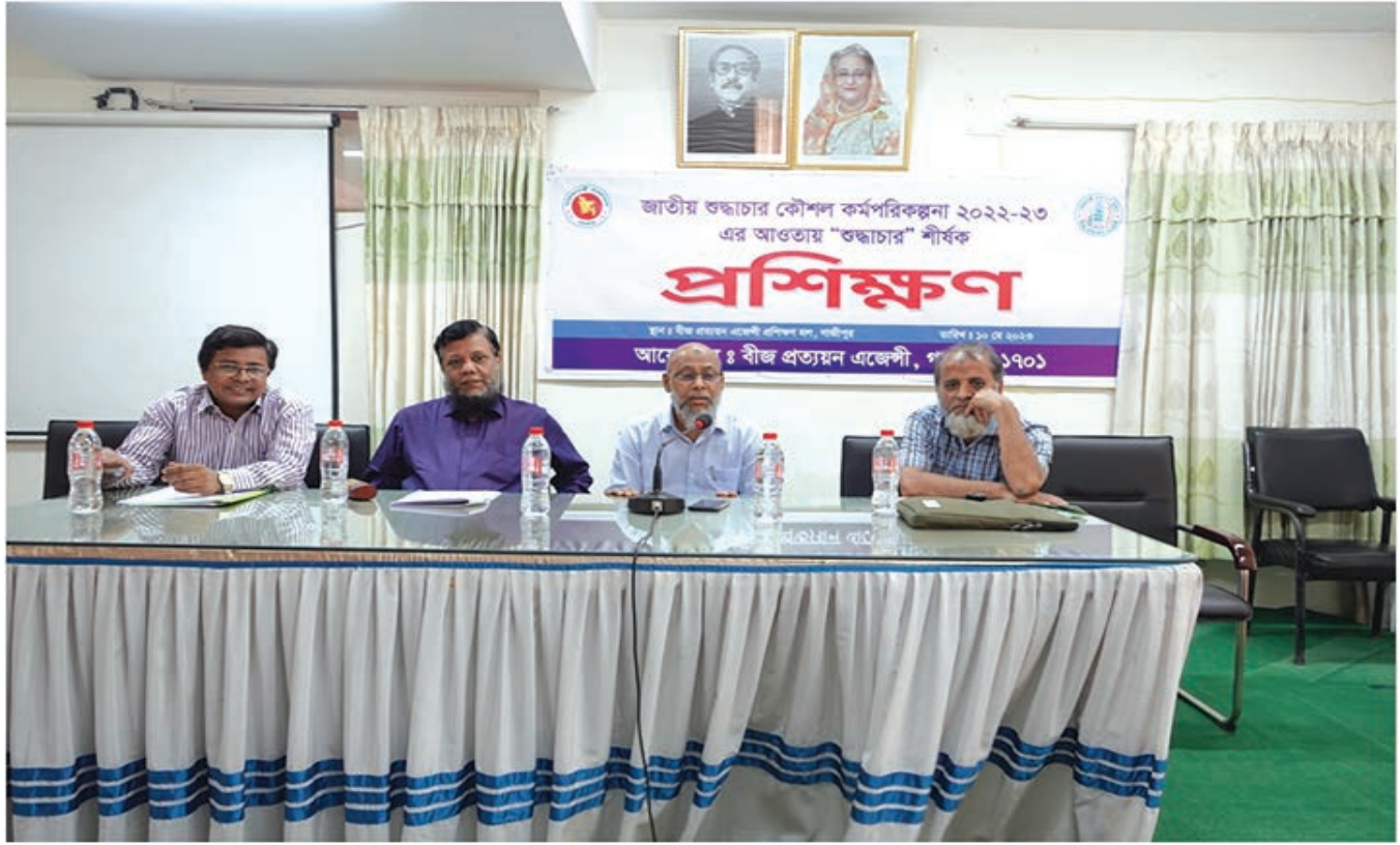
শুদ্ধাচার শীর্ষক প্রশিক্ষণে আলোচকগণ