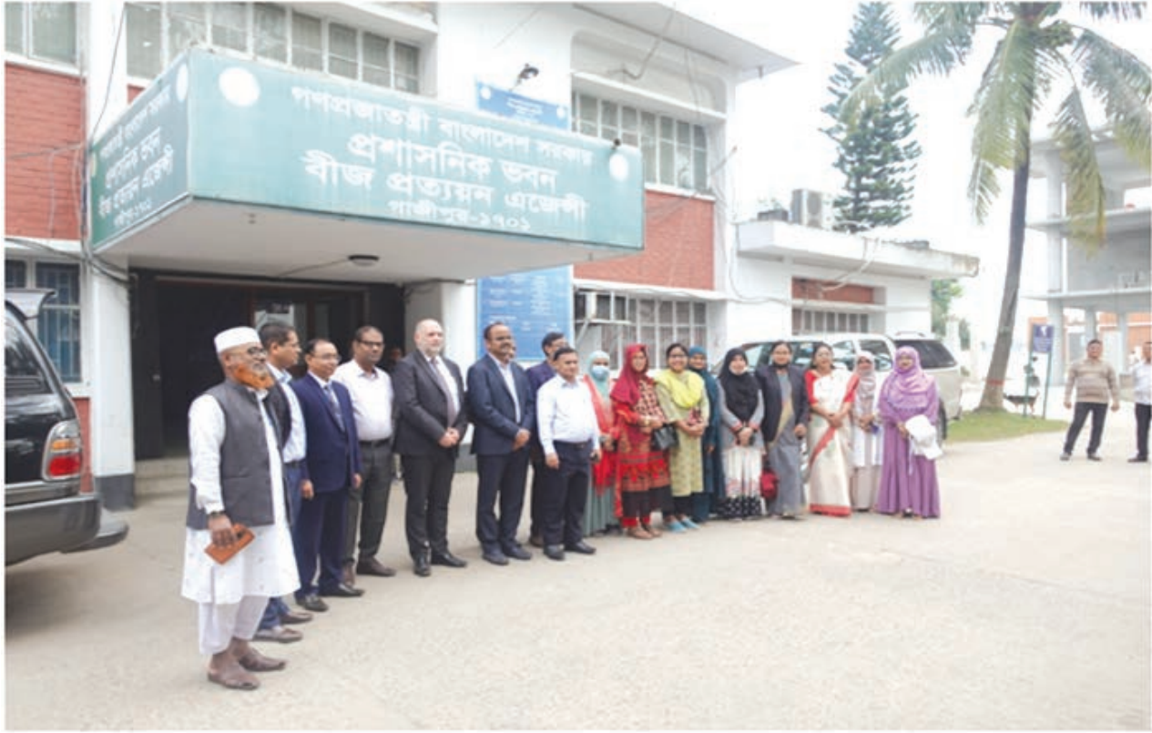
ইস্টা (ISTA) প্রেসিডেন্ট ও মহাসচিব কর্তৃক বীজ প্রত্যয়ন এজেন্সী গাজীপুর পরিদর্শন