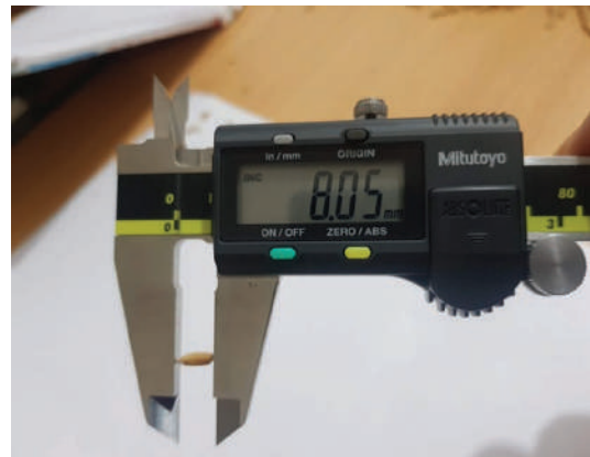
ডিইউএস টেস্ট এর জন্য বীজের দৈর্ঘ্য নির্ণয়