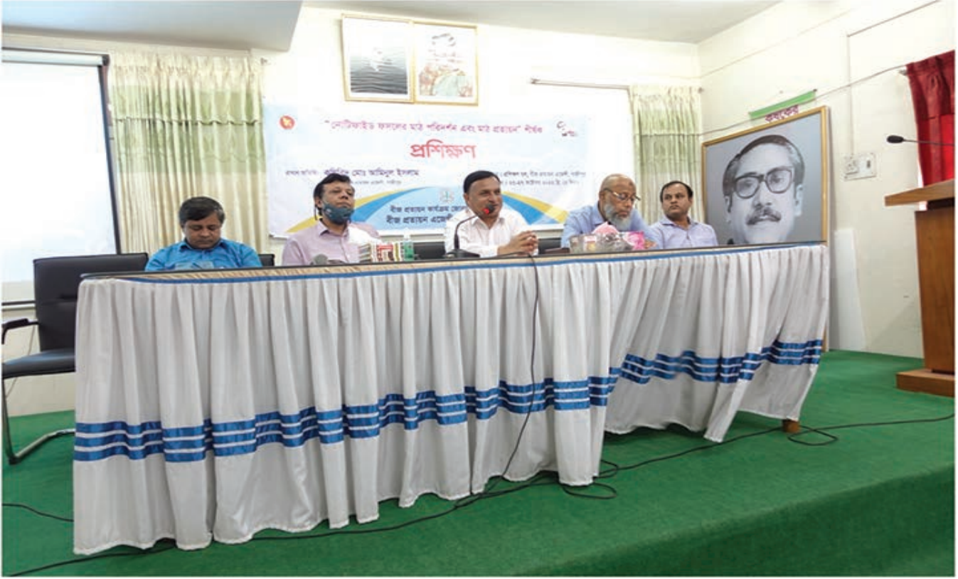
নোটিফাইড ফসলের মাঠ পরিদর্শন ও মাঠ প্রত্যয়ন শীর্ষক প্রশিক্ষণে আলোচকগণ