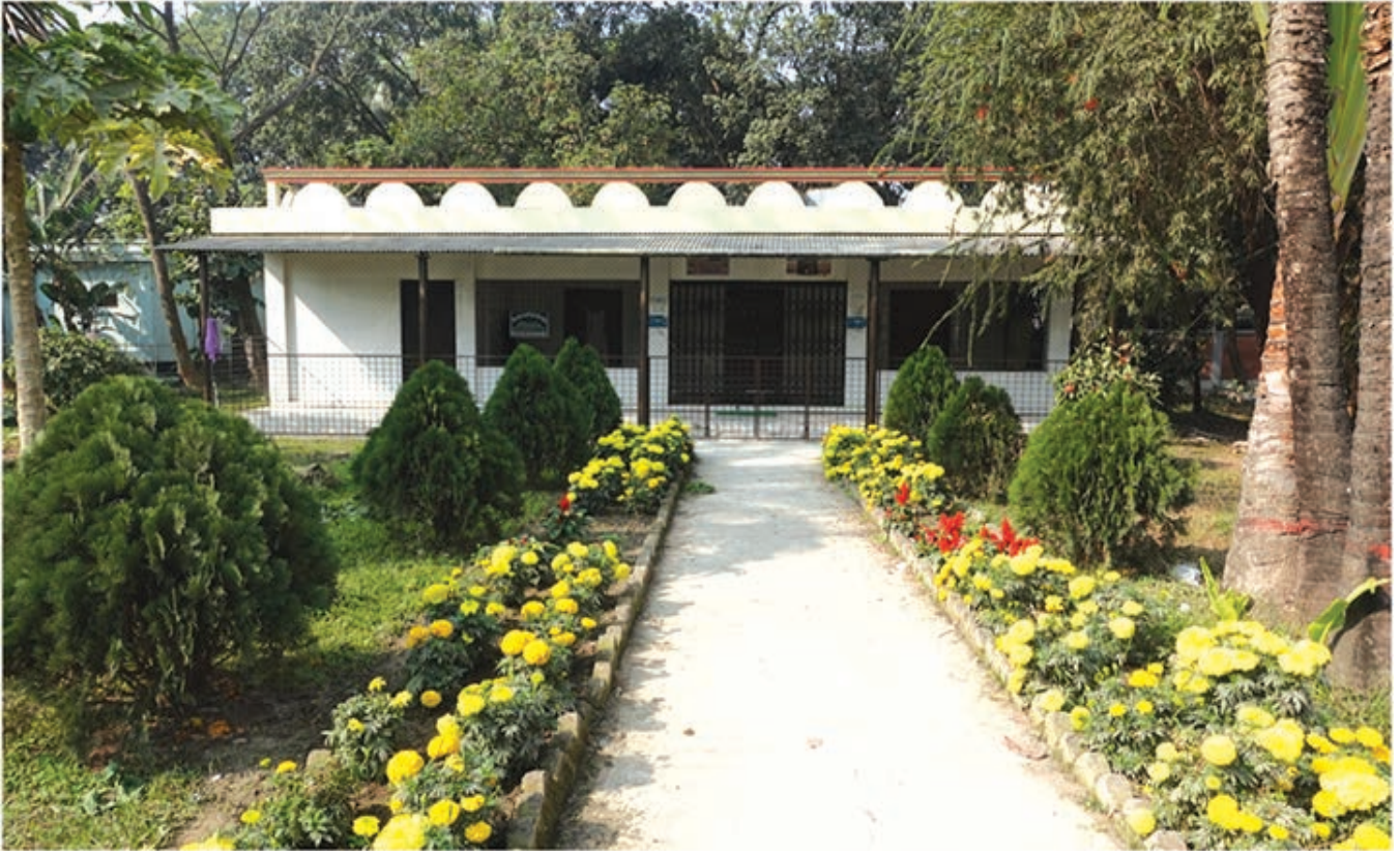
বীজ প্রত্যয়ন এজেসীর জামে মসজিদ