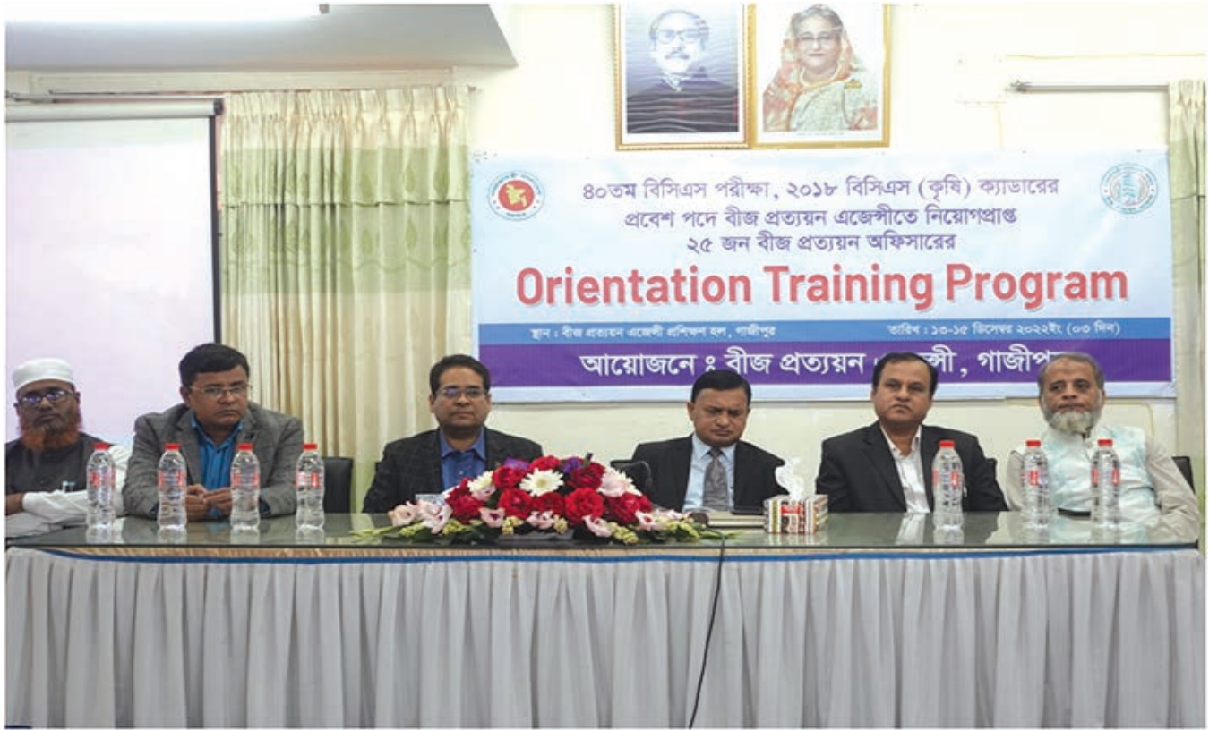
নব যোগদানকৃত ২৫ জন ক্যাডার অফিসারের ওরিয়েন্টেশন ট্রেনিং প্রোগ্রাম