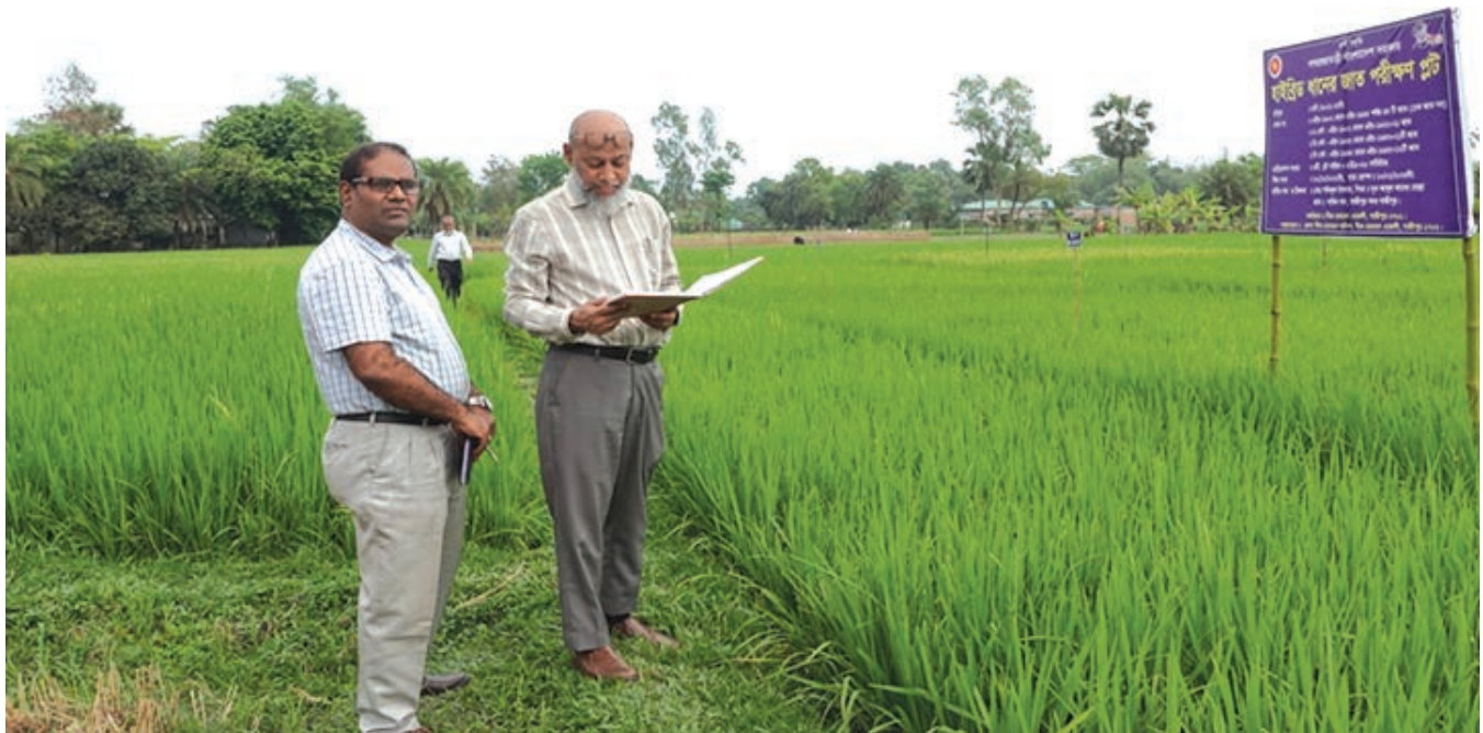
পরিচালক কর্তৃক হাইব্রিড ধানের জাত পরীক্ষা প্লট পরিদর্শন