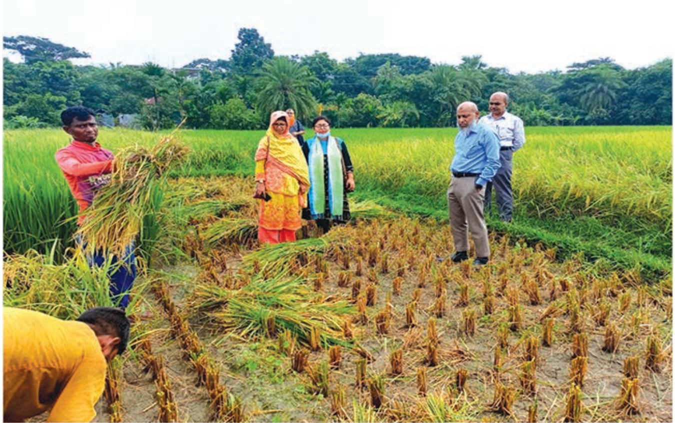
নিম্ন উৎপাদনশীল ধানের জাত প্রত্যাহার কর্মসূচির আওতায় ধান কর্তন কার্যক্রম