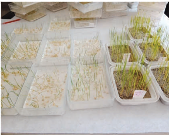
বীজের অঙ্কুরোদগম পরীক্ষা