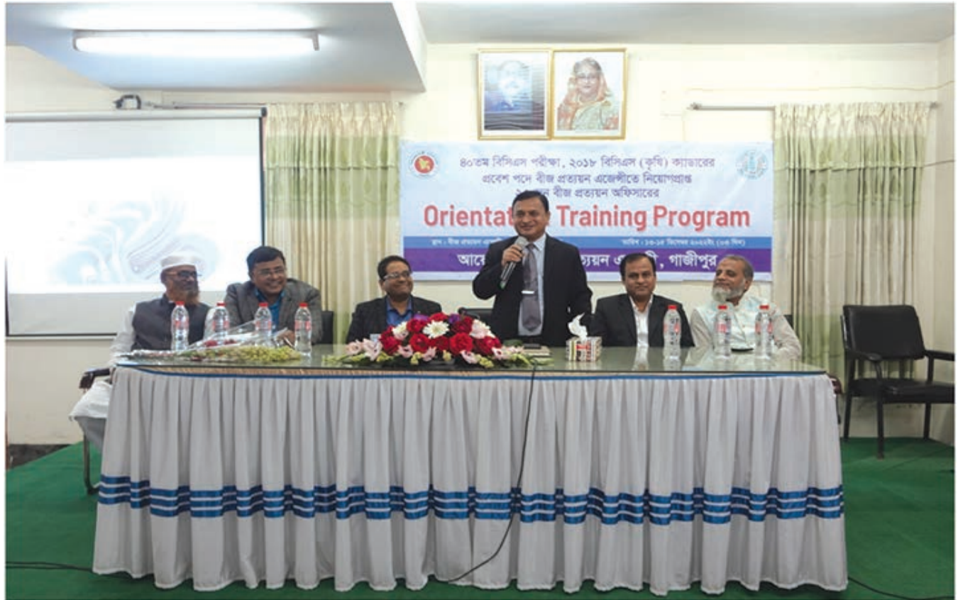
৪০ তম বিসিএস যোগদানকৃত ক্যাডার অফিসারদেও অরিয়েন্টেশন প্রোগ্রাম