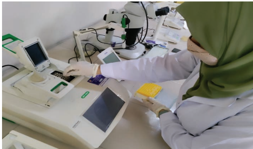
জাত পরীক্ষাগারে ডিএনএ ফিঙ্গার প্রিন্টিং কার্যক্রম