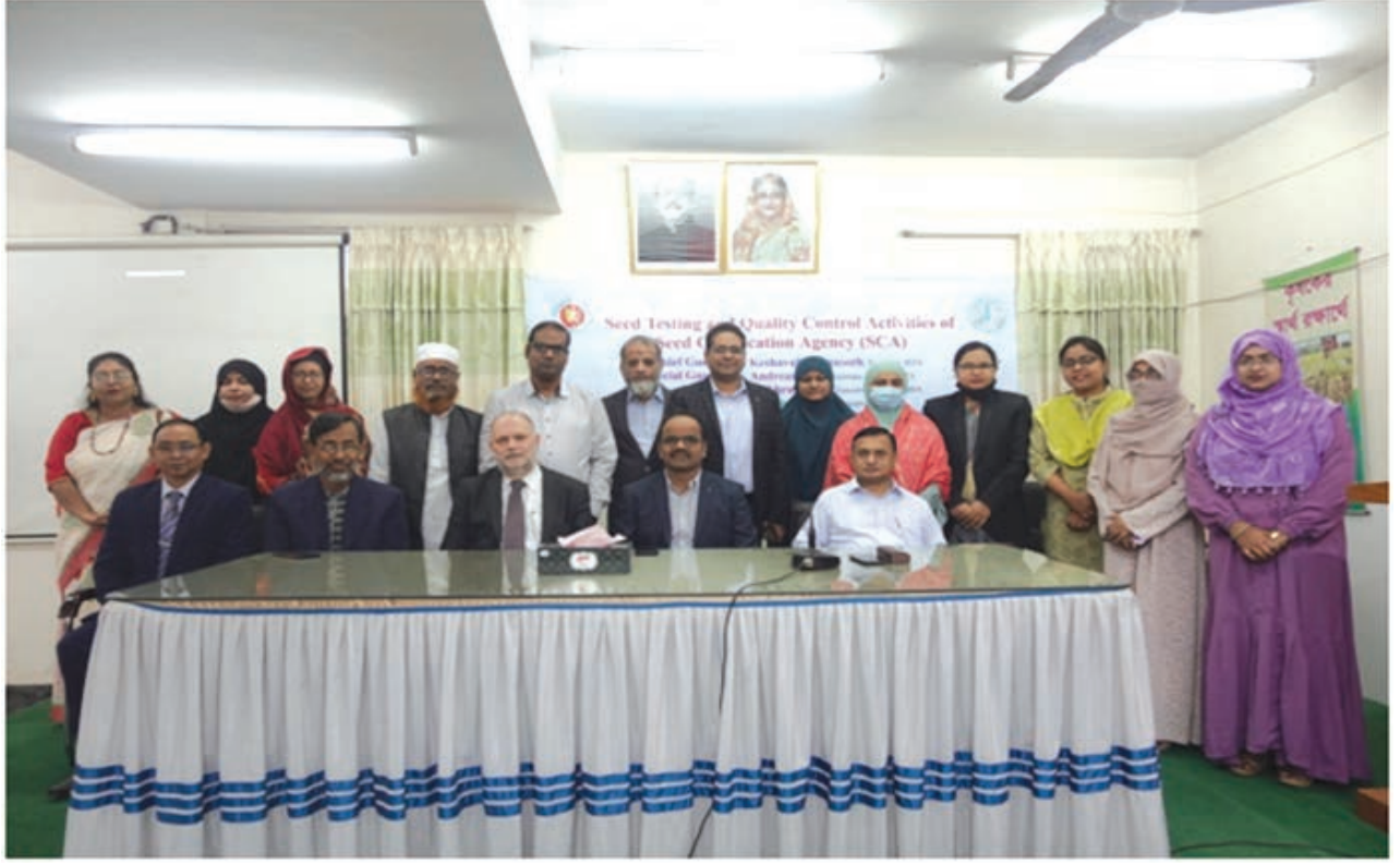
ইস্টা (ISTA) প্রেসিডেন্ট ও মহা-সচিব সাথে বীজ প্রত্যয়ন এজেন্সীর কর্মকর্তাদের একাংশ