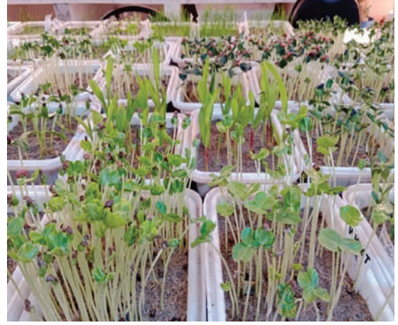
বীজের অঙ্কুরোদগম পরীক্ষা