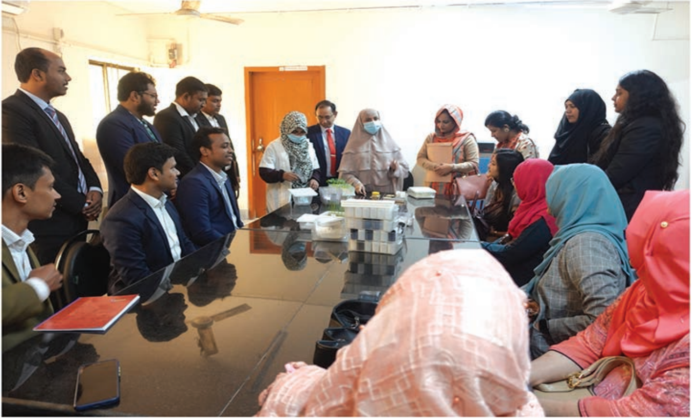
নব যোগদানকৃত ক্যাডার অফিসারদের হাতে কলমে প্রশিক্ষণ