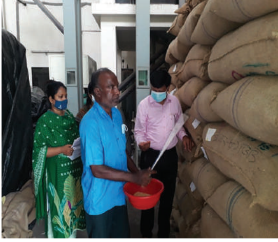
বীজের নমুনা সংগ্রহ