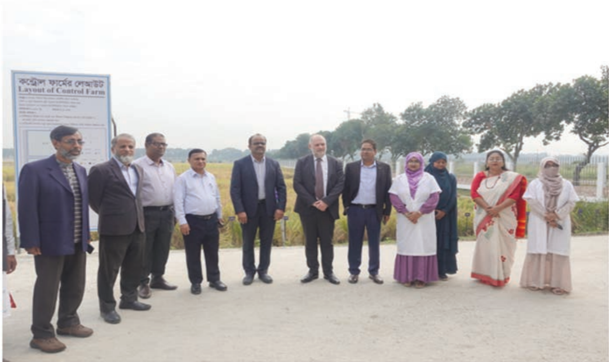
ইস্টা প্রেসিডেন্ট ও মহাসচিব কর্তৃক কন্ট্রোল ফার্ম পরিদর্শন