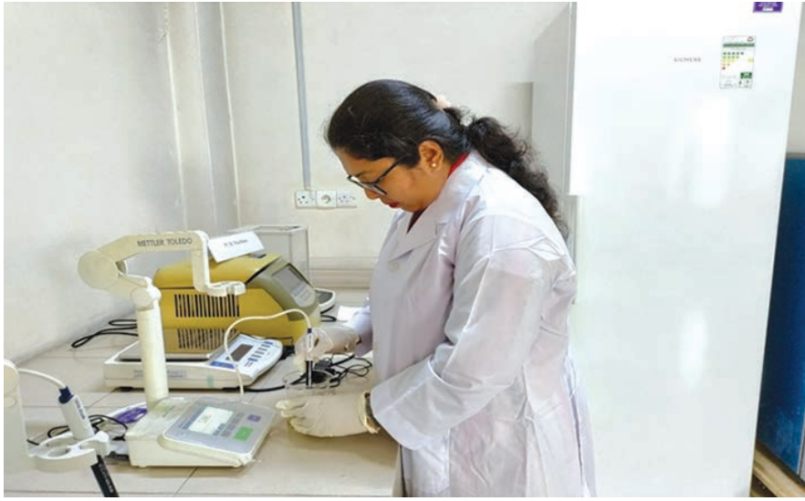
ল্যাবে পিসিআর টেস্ট কার্যক্রম