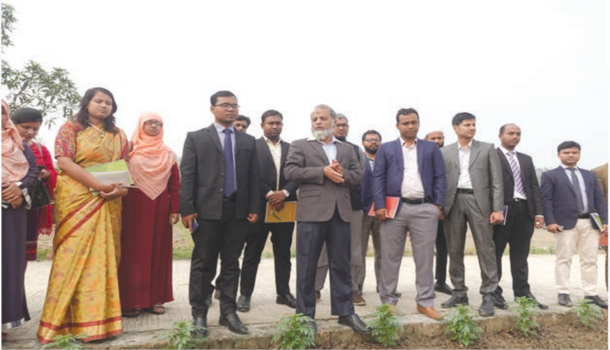
৪০ তম বিসিএস (কৃষি) ক্যাডারে যোগদানকৃত অফিসারদের কন্ট্রোল ফার্ম এর সামগ্রিক কর্মকাণ্ডের তথ্য প্রদান