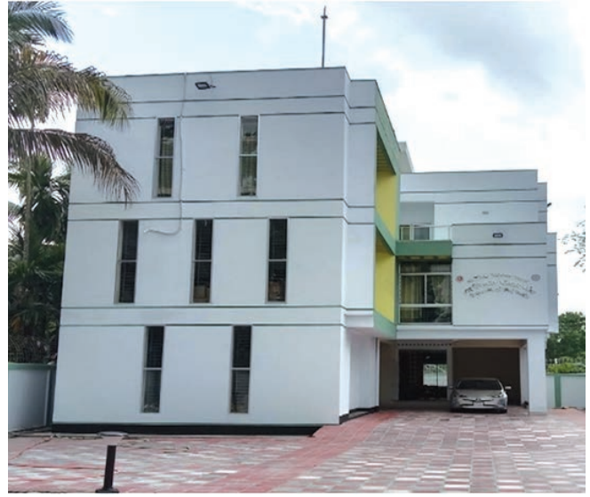
জেলা বীজ প্রত্যয়ন অফিস, চুয়াডাঙ্গা