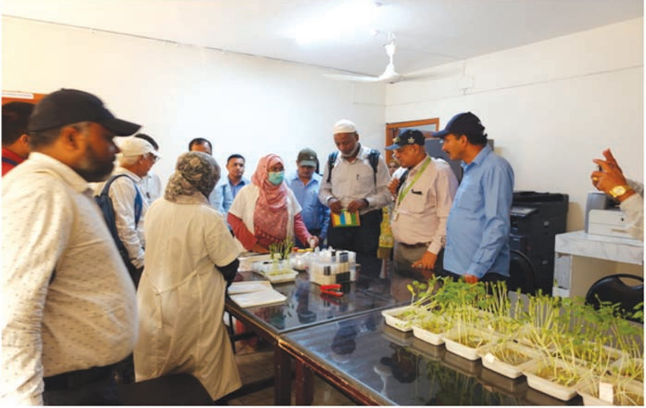
CIMMYT টিম কর্তৃক কেন্দ্রীয় বীজ পরীক্ষাগার এর কার্যক্রম প্রত্যক্ষণ