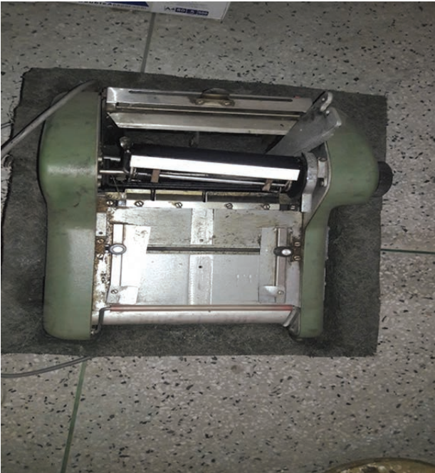
বীজ প্রত্যয়ন এজেন্সীর প্রথম ট্যাগ মুদ্রণ মেশিন