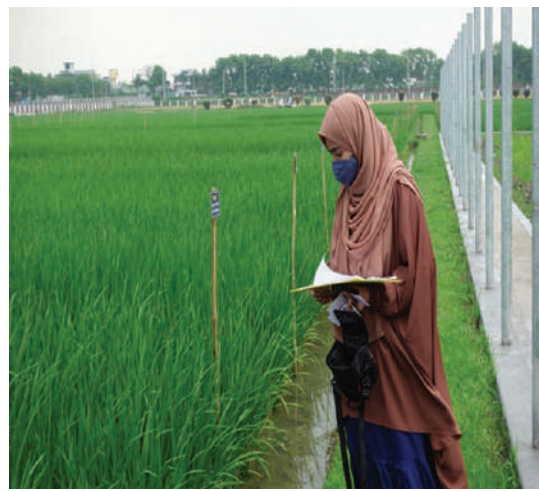
ধানের ডিইউএস এর ডাটা সংগ্রহ