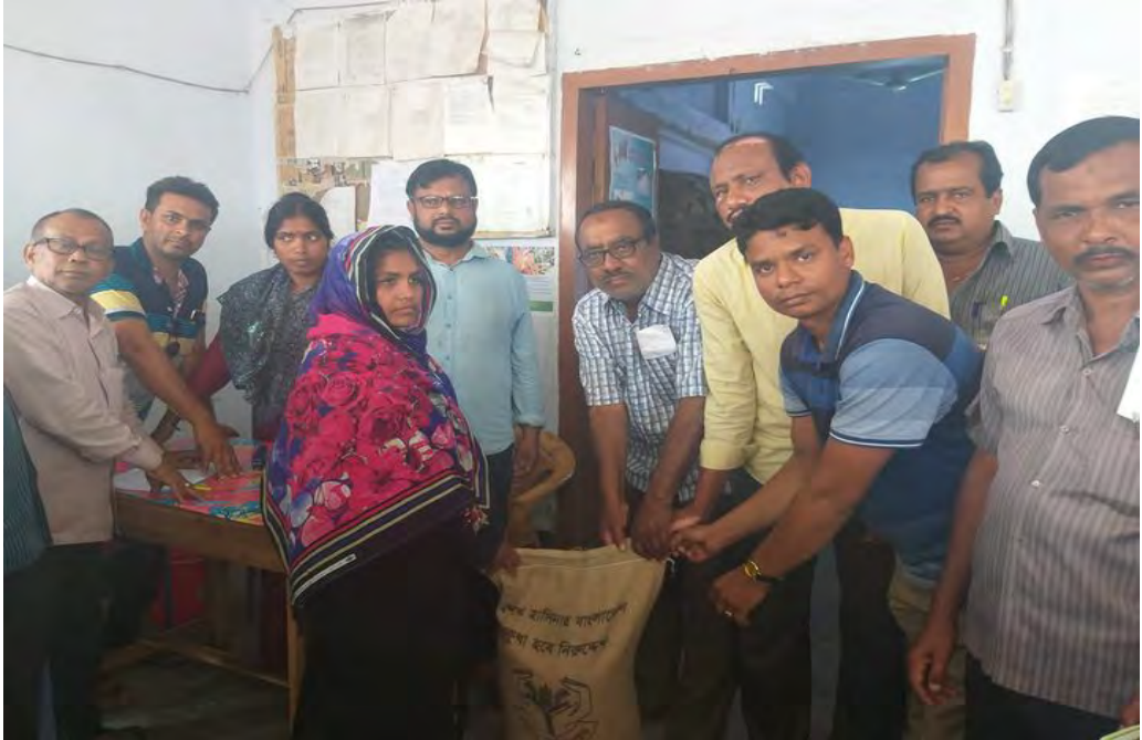
২নং রঘুনাথপুর ইউনিয়নের ভিজিডির উপকার ভোগীর মধ্য চাউল বিতরণ।