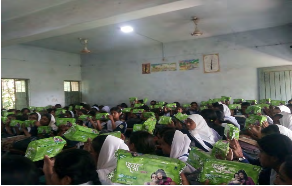
স্কুল ছাত্রীদের জন্য ন্যাপকিন সরবরাহ।