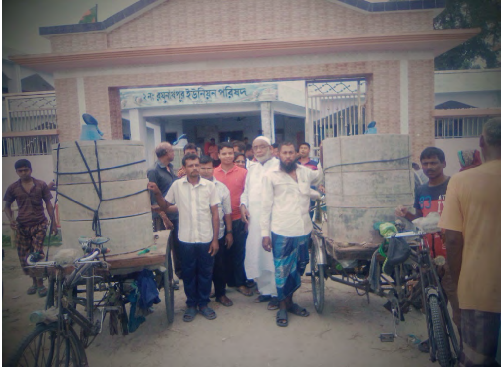
২নং রঘুনাথপুর ইউনিয়নের দরিদ্র মহিলাদের কর্মমুখী করার জন্য সেলাই মেশিন বিতরণ।