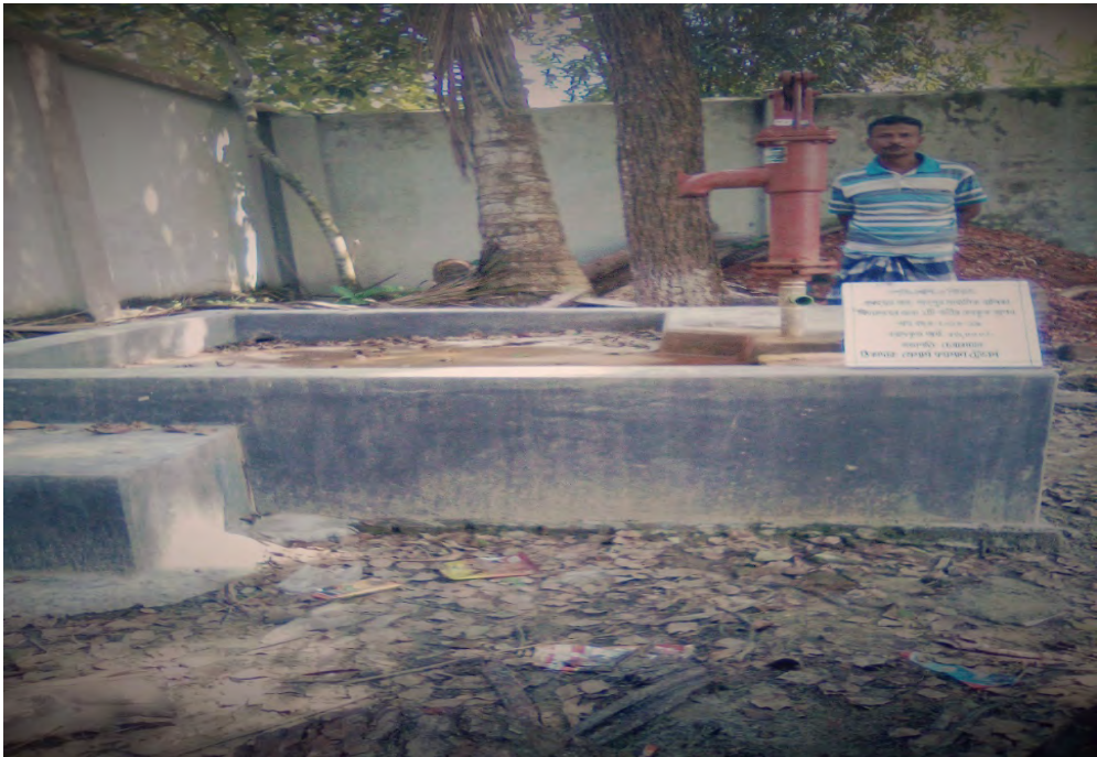
শাহপুর ম্যাধ্যমিক বালিকা বিদ্যালয়ের জন্য একটি গভীর নলকূপ স্থাপন।