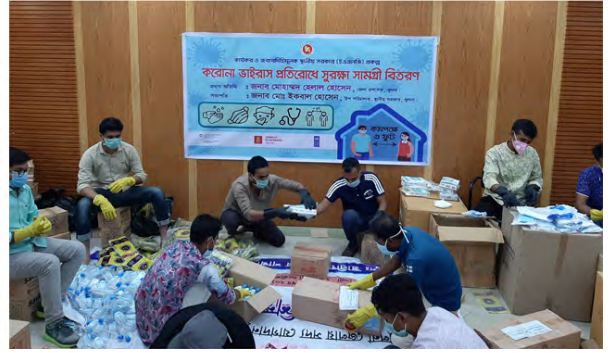
জেলা প্রশাসন, উপজেলা প্রশাসন ও ইউনিয়ন পর্যায়ে ৬০০০ জনকে কোভিড ১৯ নিয়ন্ত্রনের জন্য সুরক্ষা সামগ্রী দেয়া হয়েছে