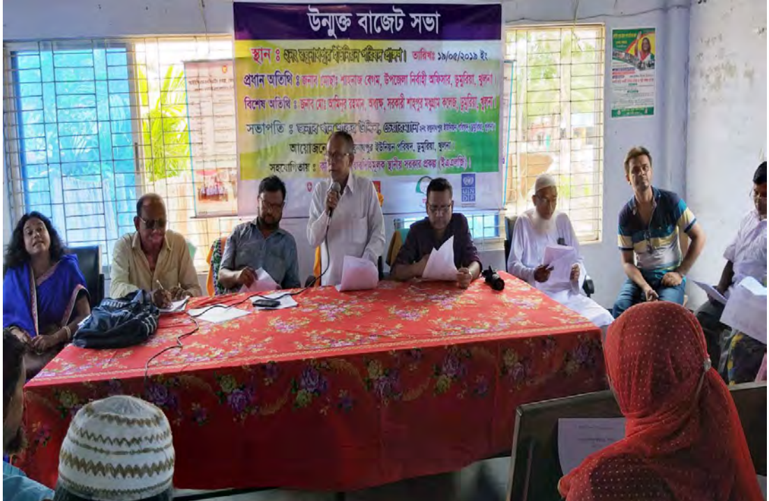
ইএএলজি কর্মসূচির অর্থায়েনে ইউনিয়ন পরিষদের সদস্যদের মাঝে করোনা ভাইরাস প্রতিরোধ সামগ্রী বিতরণ।