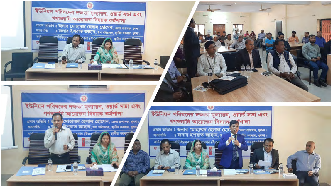
সুশাসন নিশ্চিত করার জন্য প্রকল্পের পক্ষ থেকে ওয়ার্ড সভা কার্যকর করার জন্য কর্মশালার আয়োজন করা হয়েছে।