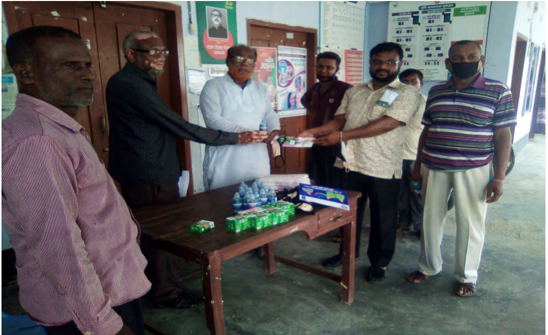
ইএএলজি কর্মসূচির অর্থায়নে ইউনিয়ন পরিষদের সদস্যদের মাঝে করোনা ভাইরাস প্রতিরোধ সামগ্রী বিতরণ।