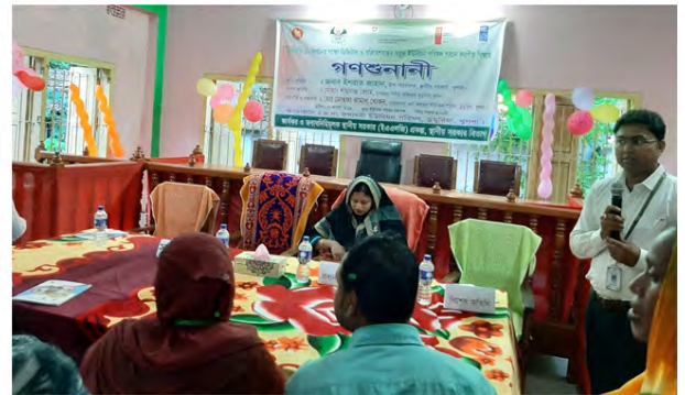
কার্যকর ও জবাবদিহিমূলক ইউনিয়ন পরিষদ গঠনে গণশুনানী অত্যন্ত কার্যকর। প্রকল্প থেকে প্রথম ইউনিয়ন পর্যায়ে গণশুনানীর আয়োজন করা হয়েছে।