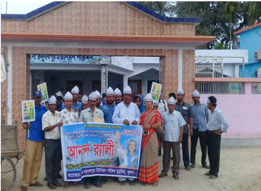
ইউনিয়ন পর্ষদ কর্তৃক আয়োজিত আনন্দ র্যালি