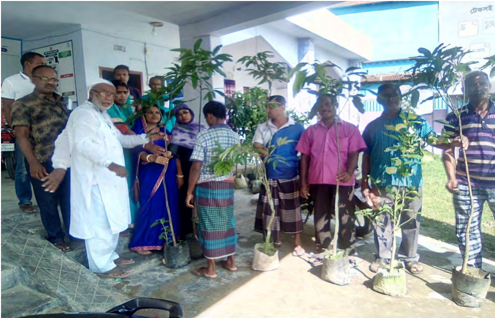
রঘুনাথপুর ইউনিয়নের বিভিন্ন প্রতিষ্ঠানে ও রাস্তার পার্শ্বে বৃক্ষের চারা রোপন।