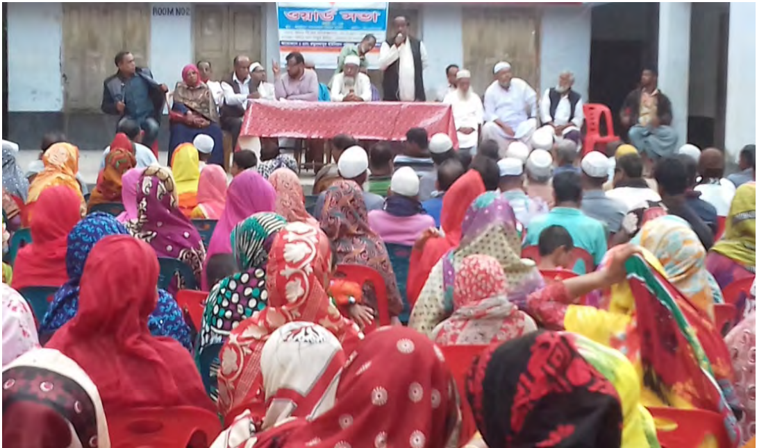
২নং রঘুনাথপুর ইউনিয়নের ৯নং ওয়ার্ডের ওয়ার্ড সভা।