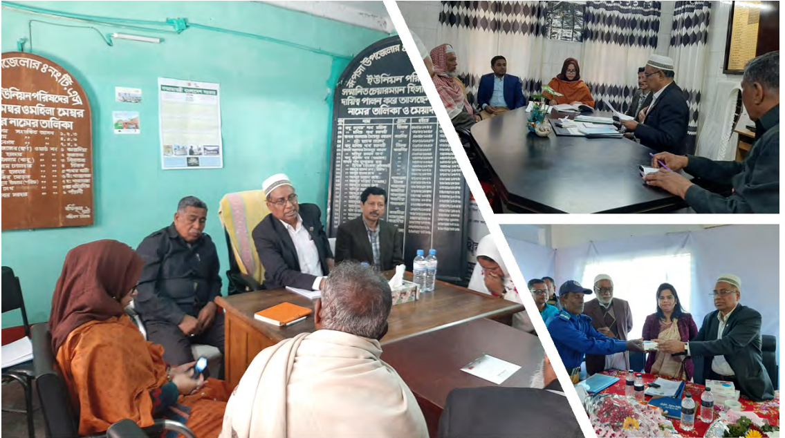
কার্যকর এবং জবাবদিহিমূলক উপজেলা পরিষদ ও ইউনিয়ন পরিষদ গঠনের লক্ষ্যে নিজস্ব আয় বৃদ্ধি বিষয়ে তথ্য উপাত্ত সংগ্রহের মাধ্যমে গবেষণা কার্যক্রম পরিচালনা করা হয়েছে।