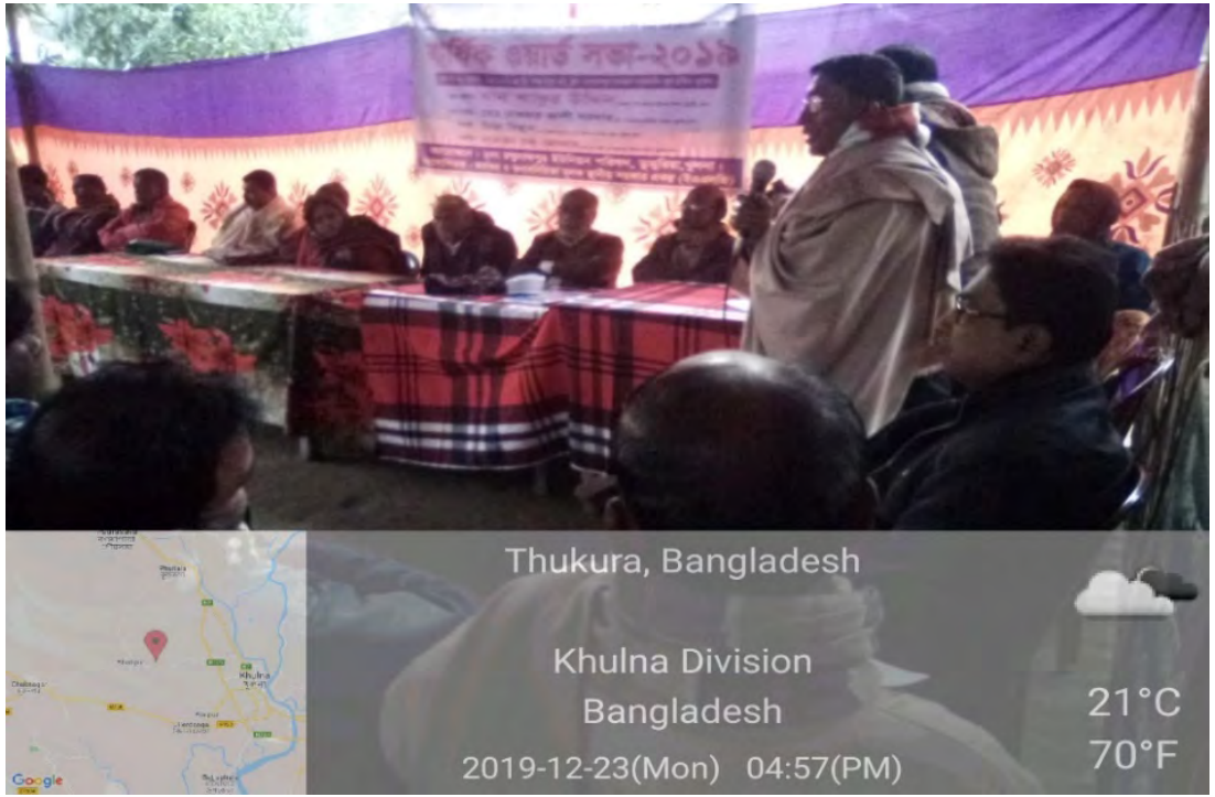
ইএএলজি কর্মসূচির অর্থায়েনে ওয়ার্ড সভা হতে জনগনের চাহিদা ভিত্তিক প্রকল্প গ্রহণ করা হয়।