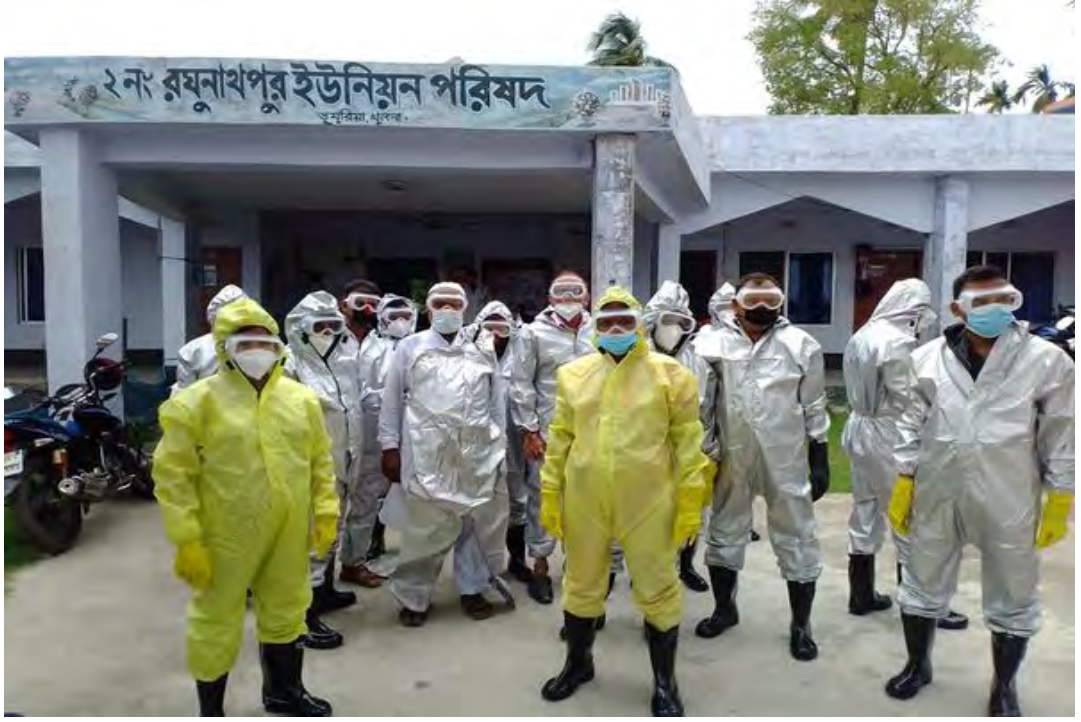
ইএএলজি কর্মসূচির অর্থায়নে ২নং রঘুনাথপুর ইউনিয়ন পরিষদের কর্মকর্তা, কর্মচারীদের মাঝে করোনা ভাইরাস প্রতিরোধ পিপিই বিতরণ।