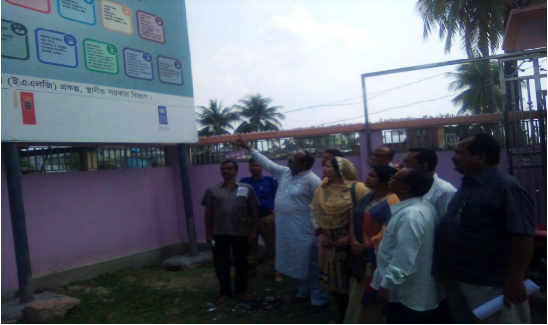
ডিডিএলজি, খুলনা, ২নং রঘুনাথপুর ইউনিয়ন পরিষদ পরিদর্শন।