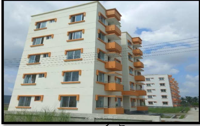
৬০০ বর্গফুট বাসা