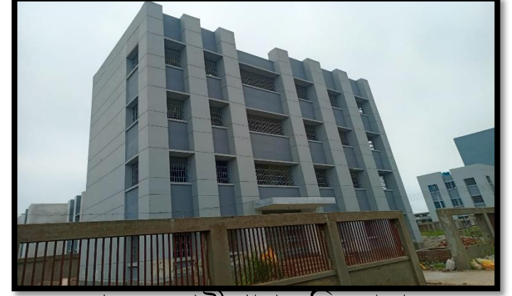
পুরুষ শ্রেণীপ্রাপ্ত বন্দিব্যারাক ভবন