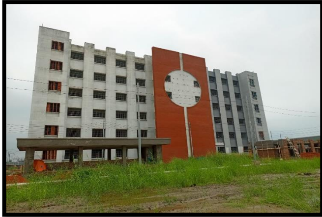
পুরুষ বিচারাধীন বন্দিব্যারাক-৩ ভবন