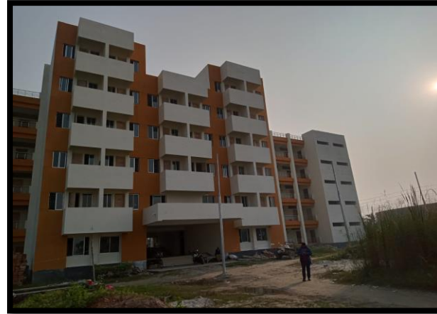
১২০০ বর্গফুট বাসা