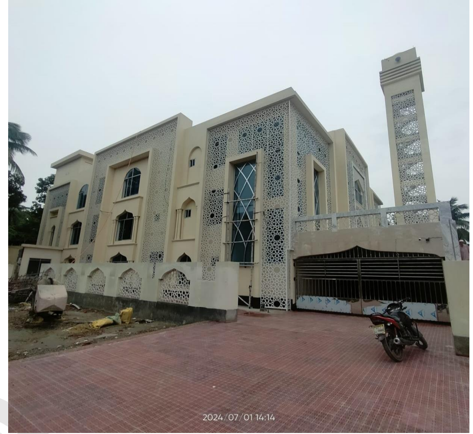
পাইকগাছা উপজেলা মডেল মসজিদ, খুলনা।