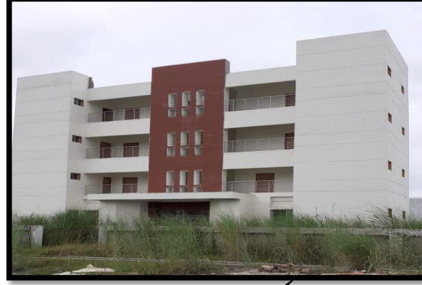
৩০ জনের ওয়ার্ডেন ব্যারাক ভবন