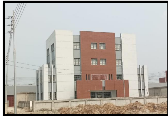
মাদার ডে কেয়ার