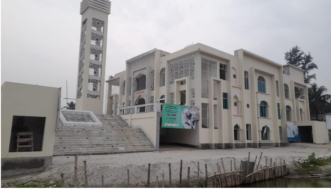
ডুমুরিয়া উপজেলা মডেল মসজিদ, খুলনা।