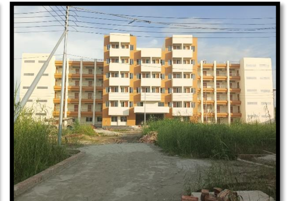
৩০০ জনের ওর্ডেন ব্যারাক