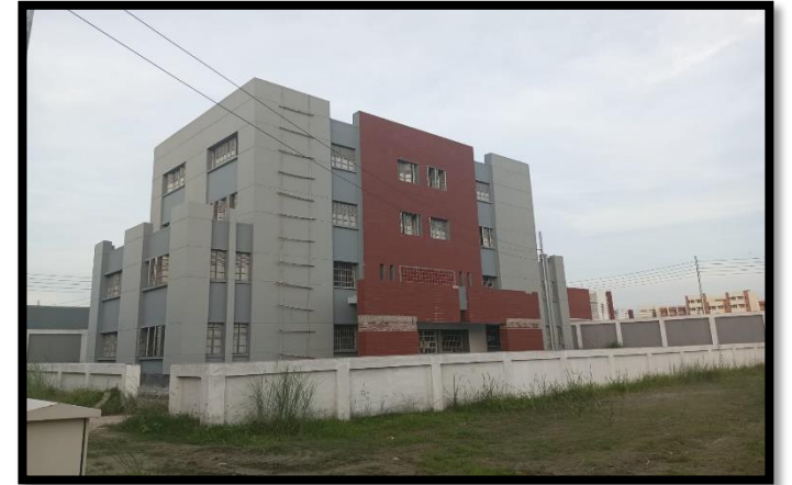
এম আই ইউনিট ভবন