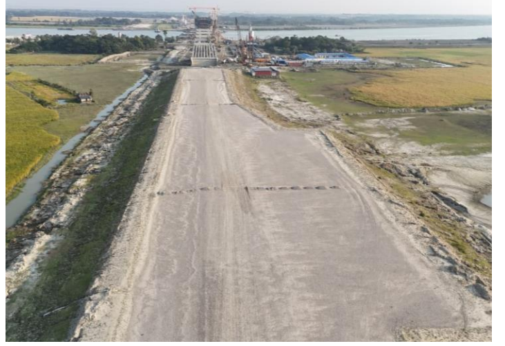
সংযোগ সড়ক (৪+২ লেন) নির্মাণ