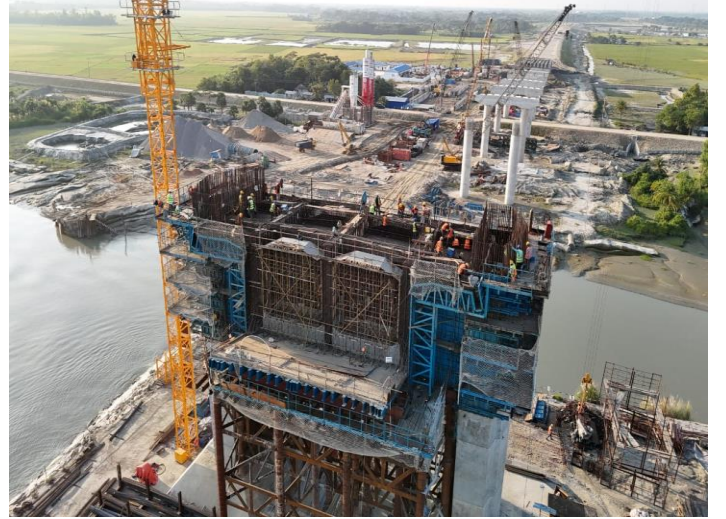
আন্দারমানিক নদীর উপর ব্রীজ নির্মাণ