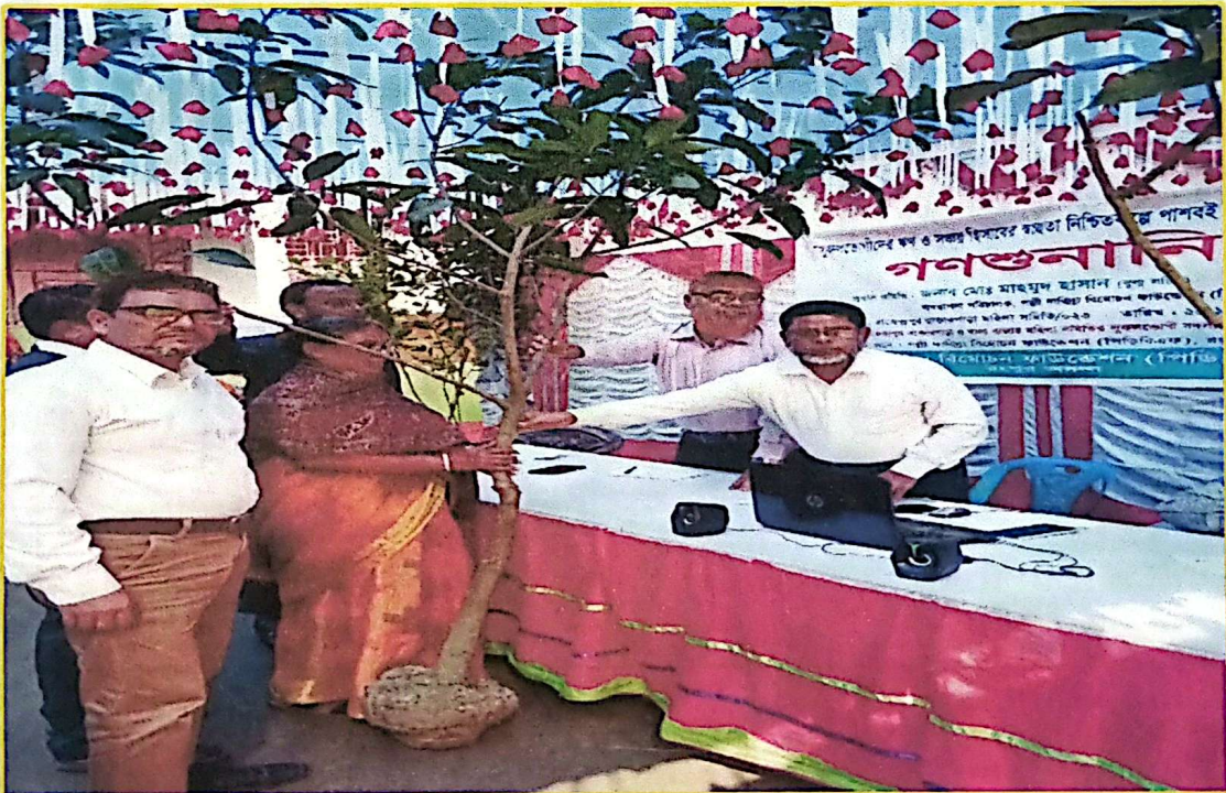
গত ১৫ নভেম্বর, ১০১৪ তারিখে পিডিবিএফ রংপুর অঞ্চলাধীন রংপুর সদর কার্যালয়ে অনতিত গণশুনানী জনষ্ঠানে সমিতির শ্রেষ্ঠ সদস্য/উদ্যোক্তাদের সঙ্গে সুলভার বিতরণ করা হয়।