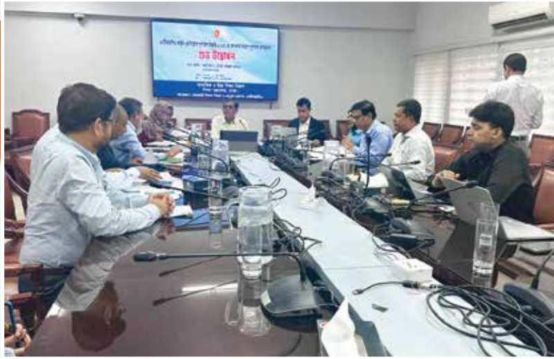
এনটিআরসিএ কর্তৃক ৬ষ্ঠ নিয়োগ সুপারিশ বিজ্ঞপ্তি-২০২৫ এর আওতায় নিয়োগ সুপারিশ কার্যক্রমের শুভ উদ্বোধন