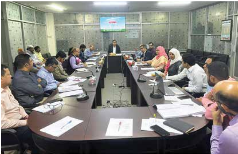
সরকারি ক্রয় ব্যবস্থাপনা সংক্রান্ত প্রশিক্ষণ