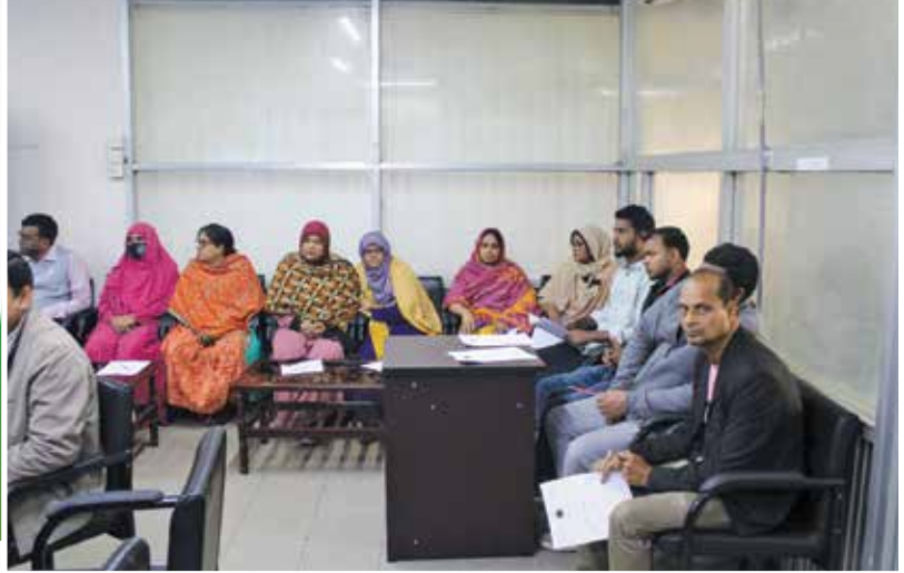
“বার্ষিক গোপনীয় অনুবেদন (এসিআর)” বিষয়ক প্রশিক্ষণ