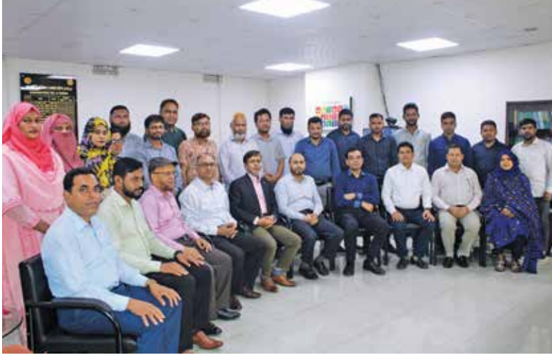
প্রশাসন ও অর্থ অনুবিভাগের কর্মকর্তা-কর্মচারীবৃন্দ