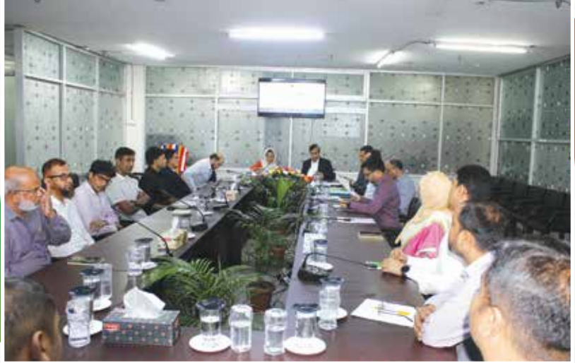
এনটিআরসিএ-এর সার্বিক কার্যক্রম সংক্রান্ত মতবিনিময় সভা