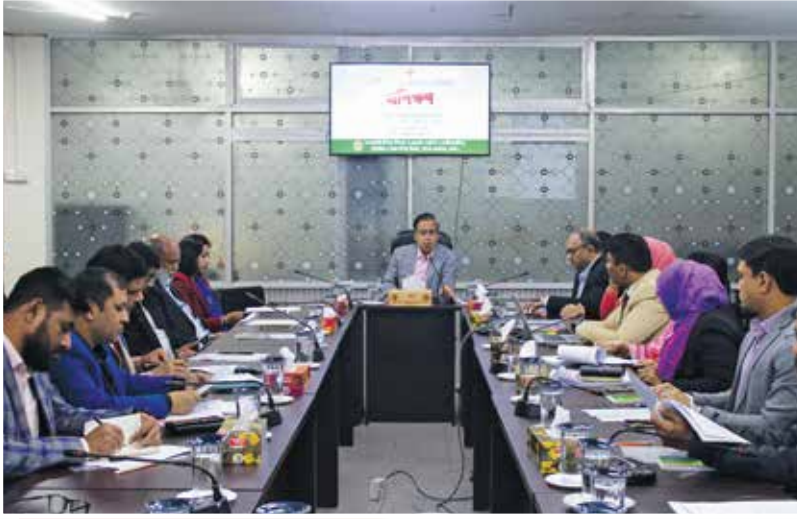
“বার্ষিক গোপনীয় অনুবেদন (এসিআর)” বিষয়ক প্রশিক্ষণ