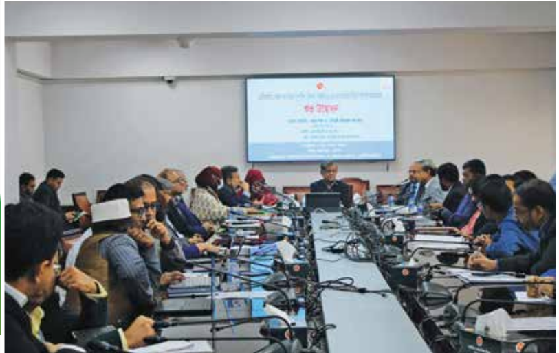
এনটিআরসিএ কর্তৃক ৭ম নিয়োগ সুপারিশ (বিশেষ) বিজ্ঞপ্তি-২০২৬ এর আওতায় নিয়োগ সুপারিশ কার্যক্রমের উদ্বোধন