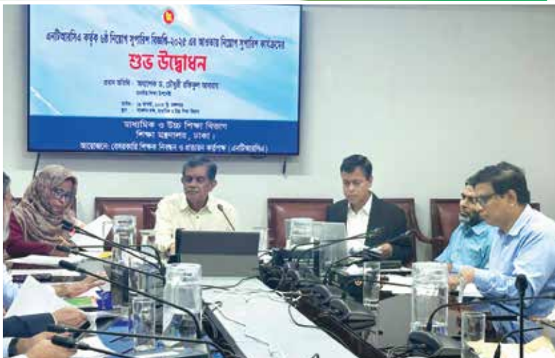
এনটিআরসিএ কর্তৃক ৬ষ্ঠ নিয়োগ সুপারিশ বিজ্ঞপ্তি-২০২৫ এর আওতায় নিয়োগ সুপারিশ কার্যক্রমের উদ্বোধন