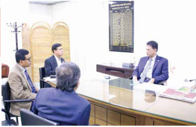
মাননীয় শিক্ষামন্ত্রী কর্তৃক এনটিআরসিএ-এর কার্যালয় পরিদর্শন