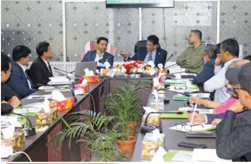
মাননীয় শিক্ষামন্ত্রী, প্রতিমন্ত্রী ও উপদেষ্টার সাথে এনটিআরসিএ-এর কর্মকর্তাদের মতবিনিময় সভা