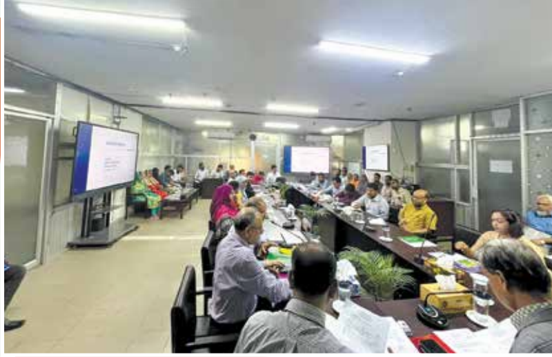
আয়কর রিটার্ন /ই-রিটার্ন বিষয়ক প্রশিক্ষণ