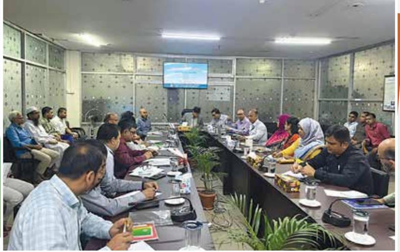
IBAS++ প্রশিক্ষণ ২০২৫