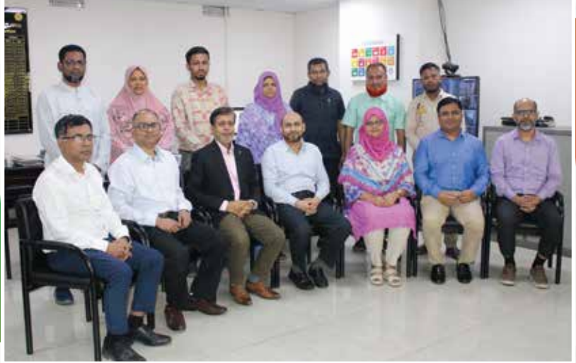
শিক্ষাতত্ত্ব ও শিক্ষামান অনুবিভাগের কর্মকর্তা-কর্মচারীবৃন্দ