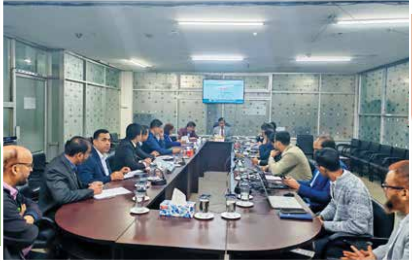
৭ম নিয়োগ সুপারিশ (বিশেষ)-২০২৬ এর ফলাফল প্রসেসিং কার্যক্রম সরেজমিনে পর্যবেক্ষণের নিমিত্তে এনটিআরসিএ-এর কার্যালয়ে অনুষ্ঠিত সভা