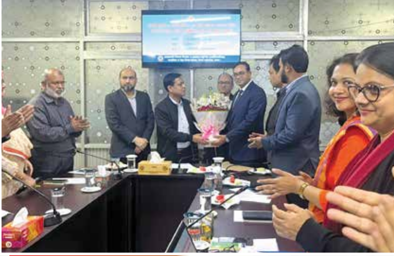
এনটিআরসিএ-এর স্থায়ী কার্যালয় স্থাপনের নিমিত্ত রাজধানী উন্নয়ন কর্তৃপক্ষ (রাজউক) কর্তৃক প্লট হস্তান্তর অনুষ্ঠান