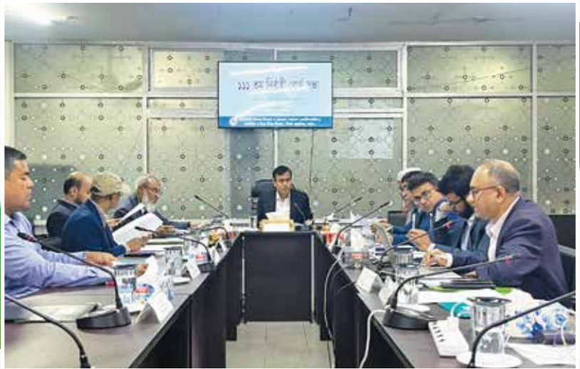
৭ ডিসেম্বর ২০২৫ খ্রি. তারিখে এনটিআরসিএ-এর ১১১তম নির্বাহী বোর্ড সভা