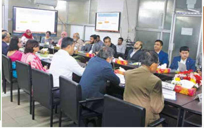
মাননীয় শিক্ষামন্ত্রী, প্রতিমন্ত্রী ও উপদেষ্টার সাথে এনটিআরসিএ-এর কর্মকর্তাদের মতবিনিময় সভা