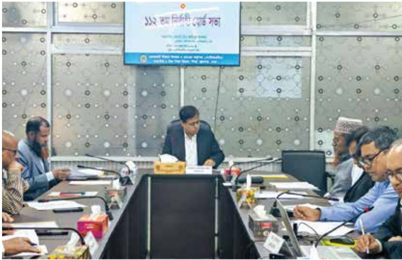
২৩ ফেব্রুয়ারি ২০২৬ খ্রি. তারিখে এনটিআরসিএ-এর ১১২তম নির্বাহী বোর্ড সভা