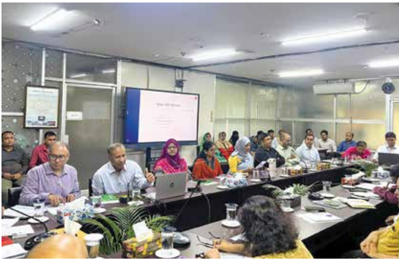
আয়কর রিটার্ন /ই-রিটার্ন বিষয়ক প্রশিক্ষণ