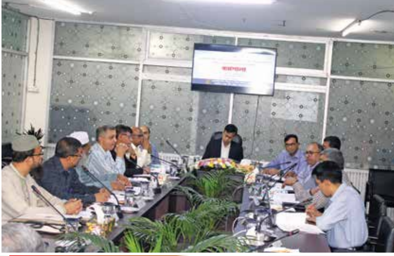
“এনটিআরসিএ-এর পরীক্ষা পদ্ধতি যুগোপযোগীকরণ এবং বিদ্যমান চ্যালেঞ্জসমূহ মোকাবেলায় করণীয় নির্ধারণ” শীর্ষক কর্মশালা