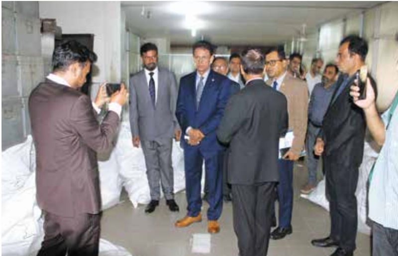
মাননীয় শিক্ষামন্ত্রী কর্তৃক এনটিআরসিএ-এর কার্যালয় পরিদর্শন