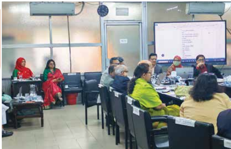
সিলেবাস চূড়ান্তকরণ কর্মশালা-২০২৫