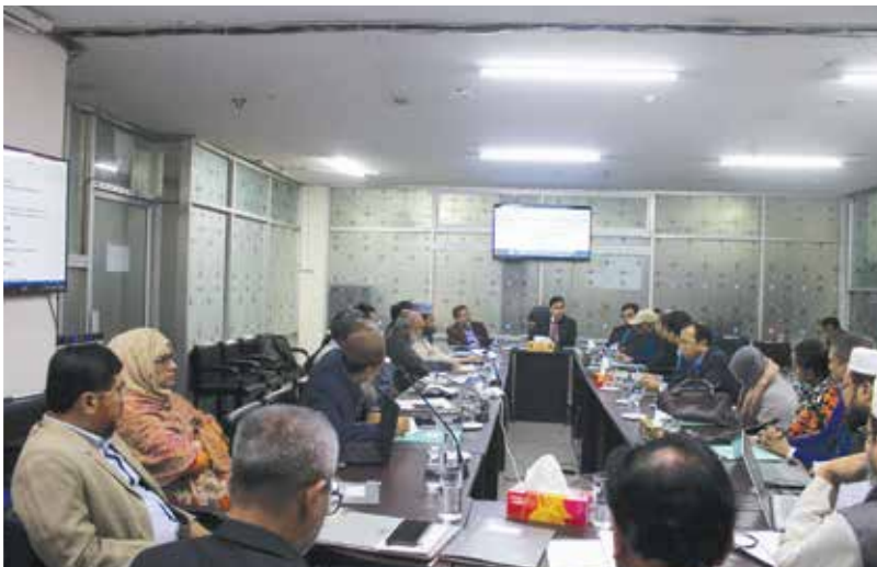
প্রতিষ্ঠান প্রধান ও সহকারী প্রধান পদে সিলেবাস প্রণয়নের নিমিত্তে কর্মশালা