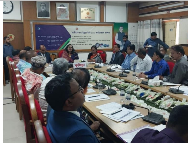
কুমিল্লা জেলায় অনুষ্ঠিত কর্মশালা

নিম্নোক্ত জেলা/বিভাগে কর্মশালার আয়োজন করা হয়: