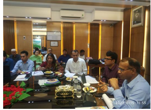
মাগুরা জেলায় অনুষ্ঠিত কর্মশালা