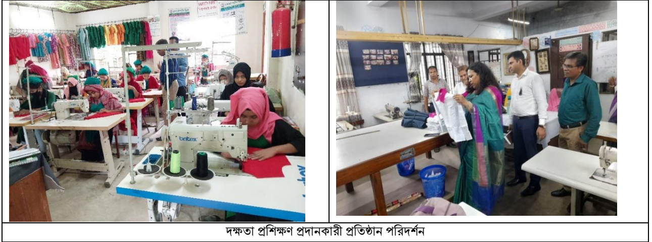
দক্ষতা প্রশিক্ষণ প্রদানকারী প্রতিষ্ঠান পরিদর্শন

জাতীয় দক্ষতা উন্নয়ন কর্তৃপক্ষ আইন, ২০১৮-এর ১৬(১) ধারা অনুযায়ী দক্ষতা উন্নয়ন প্রশিক্ষণ প্রদান ও জাতীয় পর্যায়ে সনদ প্রদানে আগ্রহী দক্ষতা প্রশিক্ষণ প্রদানকারী প্রতিষ্ঠানকে (এসটিপি) কর্তৃপক্ষ কর্তৃক নিবন্ধিত হতে হবে। এই লক্ষ্যে সারাদেশে বিস্তৃত বিভিন্ন দক্ষতা প্রশিক্ষণ প্রদানকারী প্রতিষ্ঠানকে এনএসডিএ-এর আওতায় নিবন্ধিত করার নিমিত্ত বিজ্ঞপ্তি প্রকাশ করা হয়।