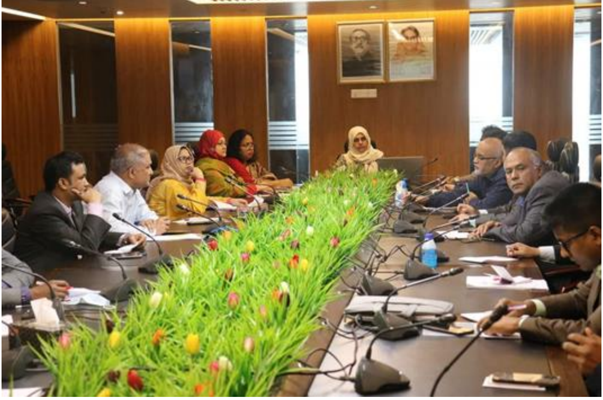
ন্যাশনাল স্কিলস পোর্টাল সম্পর্কে মতবিনিময় সভা