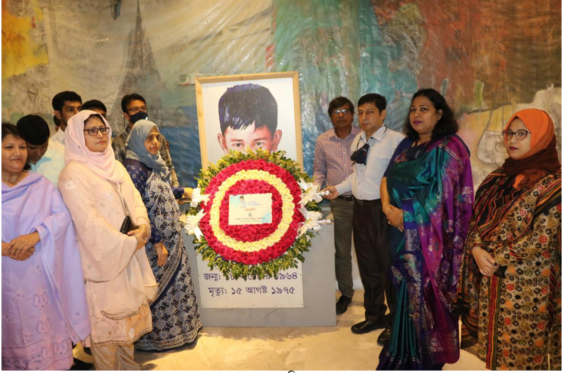
শেখ রাসেলের জন্মদিনে শ্রদ্ধাঞ্জলিপন