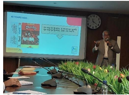
লজিস্টিক সেক্টর আইএসসি গঠনের মত বিনিময় সভা