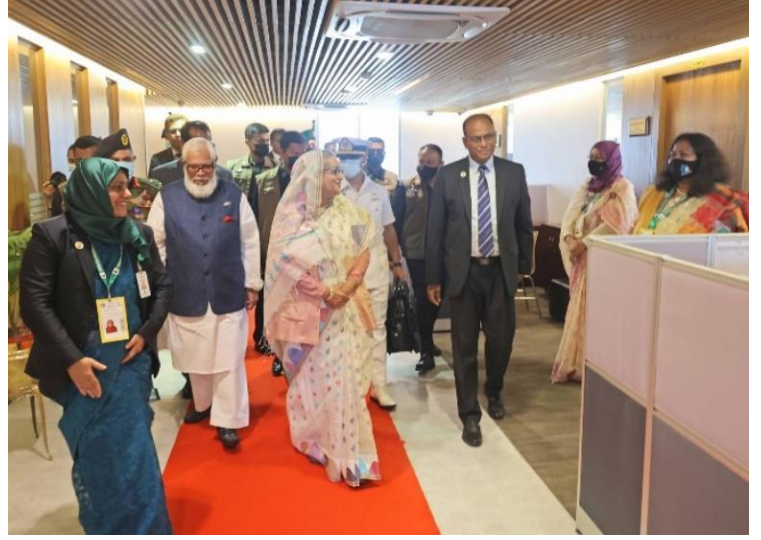
এনএসডিএ-এর অফিসে মাননীয় প্রধানমন্ত্রী শেখ হাসিনা এবং অন্যান্য অতিথিবৃন্দ