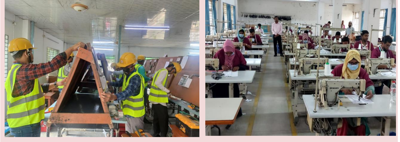
প্রশিক্ষণার্থী অ্যাসেসমেন্ট কার্যক্রম

এনএসডিএ-এর কোর্স অ্যাক্রিডিটেশন ডকুমেন্ট (সিএডি) ও কারিকুলাম অনুসরণ করে ইতোমধ্যে দক্ষতা প্রশিক্ষণ প্রদানকারী প্রতিষ্ঠানগুলো অ্যাসেসমেন্ট কার্যক্রম শুরু করেছে। এনএসডিএ নিবন্ধিত দেশের বিভিন্ন দক্ষতা প্রদানকারী প্রতিষ্ঠান থেকে ৬০১২ জন প্রশিক্ষণার্থীকে এনএসডিএ-এর পুলভুক্ত অ্যাসেসরদের দ্বারা অ্যাসেস করা হয়েছে। এর মধ্যে ৩৬টি অকুপেশনে ৪৮৩৪ জন প্রশিক্ষণার্থী কম্পিটেন্ট হয়েছেন। অ্যাসেসমেন্ট কার্যক্রমে এনএসডিএ-এর কর্মকর্তাগণ উপস্থিত থেকে পুরো অ্যাসেসমেন্ট প্রক্রিয়া তদারকি করেন।