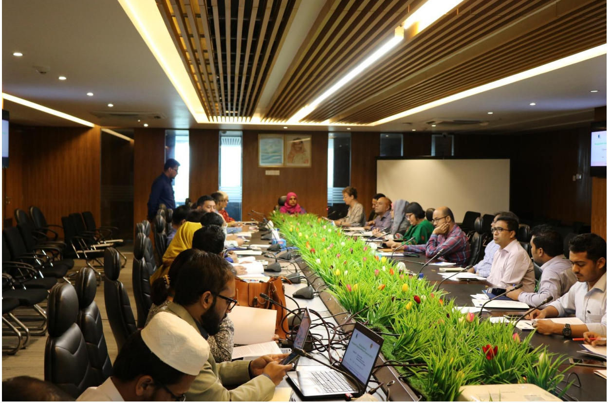
আইএলও প্রতিনিধিদের সঙ্গে সভা