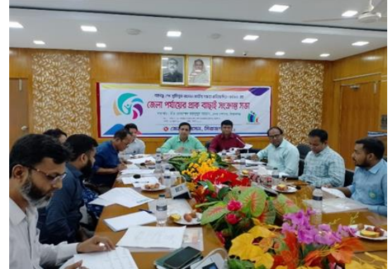
জেলাভিত্তিক প্রাক-বাছাই কার্যক্রম