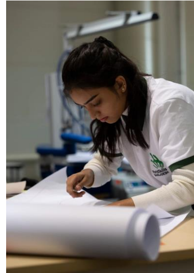
বিশ্ব দক্ষতা প্রতিযোগিতা, ২০২২-এ বাংলাদেশের দুই প্রতিযোগী