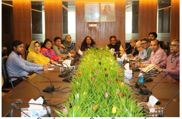
ফুড প্রিজার্ভেশন অকুপেশন সিএস ভেলিডেশন ওয়ার্কশপ

ভেলিডেশন কর্মশালায় ভেলিডেশনকৃত সিএস, সিএডি, পাঠ্যক্রম (সিবিসি), লার্নিং মেটেরিয়ালস (সিবিএলএম) কর্তৃপক্ষের সভার অনুমোদন গ্রহণ করা হয়। কর্তৃপক্ষের সভার সিদ্ধান্ত অনুযায়ী অনুমোদিত সিএস/সিএডি মুখ্য সচিবের সভাপতিত্বে কর্তৃপক্ষের কার্যনির্বাহী কমিটির সভায় অনুমোদিত হয়। ২০২২-২০২৩ অর্থ বছরে ৬৮টি কম্পিউটেন্সি স্ট্যান্ডার্ড ও কোর্স অ্যাক্রিডিটেশন ডকুমেন্ট প্রণয়ন করা হয় (পরিশিষ্ট-১)।