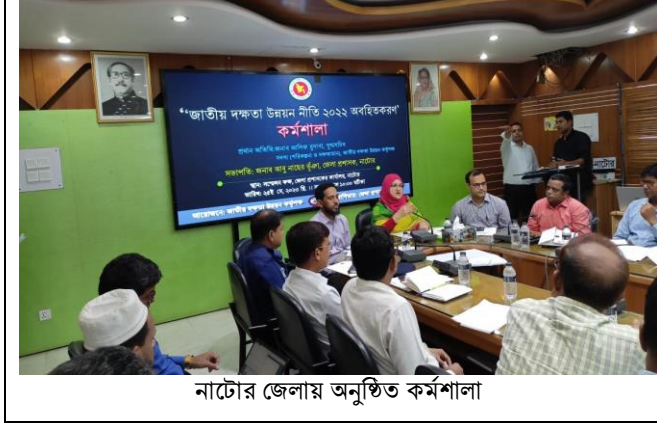
নাটোর জেলায় অনুষ্ঠিত কর্মশালা