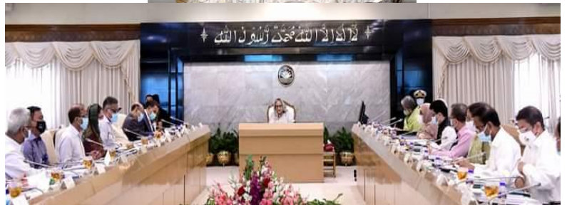
গভর্নিং বোর্ডের সভায় সভাপতিত্ব করেন মাননীয় প্রধানমন্ত্রী শেখ হাসিনা