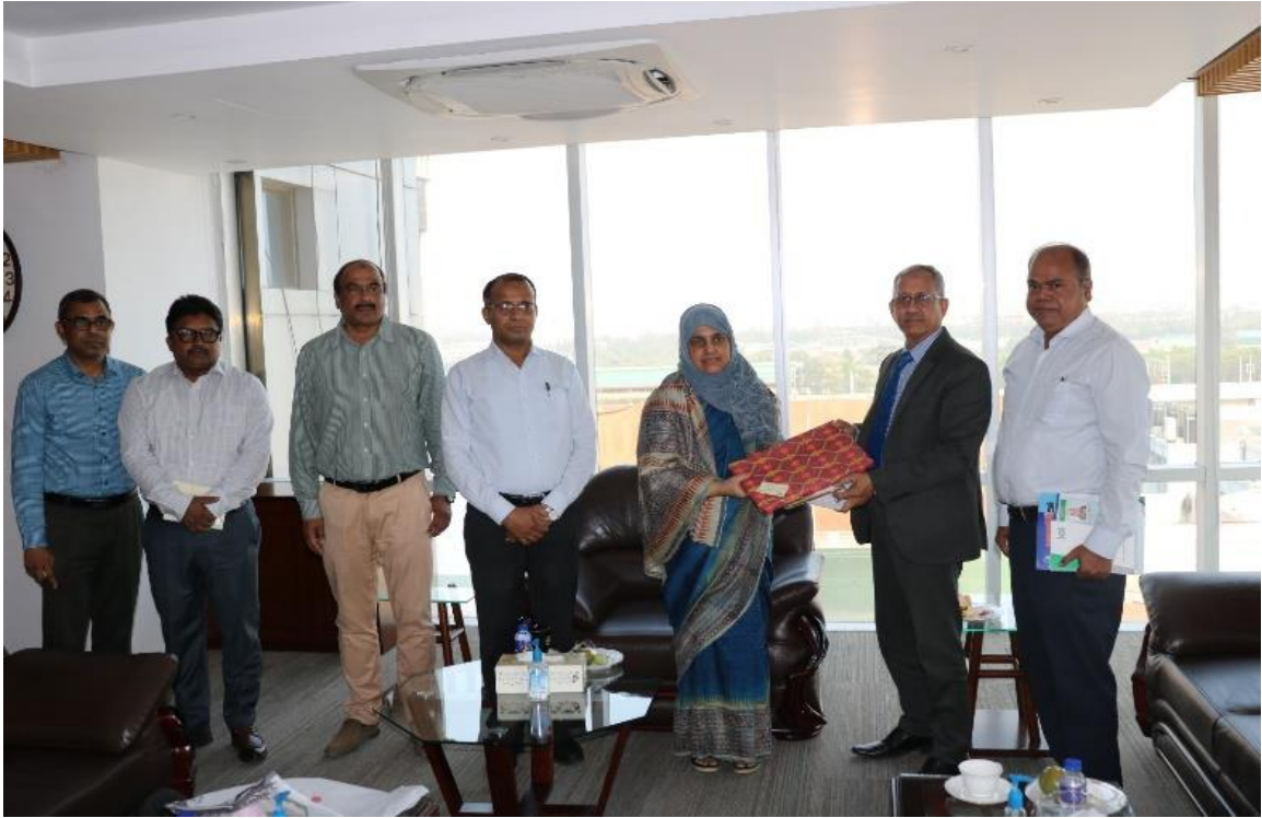
এনএসডিএ এবং ক্ষুদ্র মাঝারি শিল্প (এসএমই) ফাউন্ডেশনের মধ্যে মতবিনিময় সভা