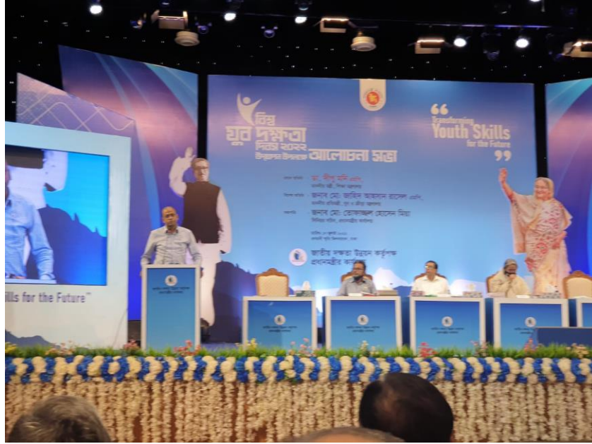
বিশ্ব যুব দক্ষতা দিবস, ২০২২

২০২২ সালে এনএসডিএ-এর আয়োজনে ১৫ জুলাই বিশ্ব যুব দক্ষতা দিবস উদযাপিত হয়। দক্ষতা উন্নয়ন ব্যবস্থার সাথে সংশ্লিষ্ট কারিগরি শিক্ষা প্রতিষ্ঠান, দক্ষতা উন্নয়ন প্রশিক্ষণ প্রদানকারী প্রতিষ্ঠান এবং অন্যান্য সরকারি ও বেসরকারি অংশীজন কর্তৃক দিবসটি উদযাপন করা হয়। বিশ্ব যুব দক্ষতা দিবস ২০২২-এ “Transforming Youth Skills for the Future” প্রতিপাদ্য নির্বাচন করা হয়।