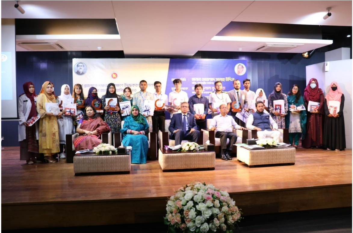
রচনা প্রতিযোগিতার পুরস্কার বিতরণ অনুষ্ঠানে বিজয়ীদের সঙ্গে অতিথিবৃন্দ