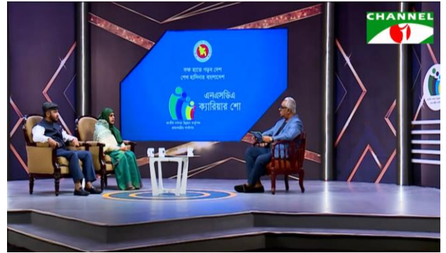
নির্মিত ও প্রচারিত টেলিভিশন কমার্সিয়াল ও ক্যারিয়ার শো