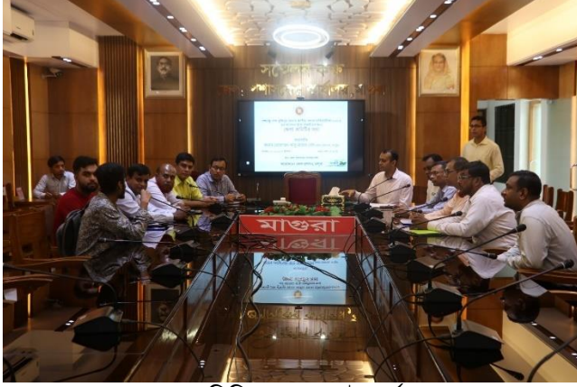
জেলাভিত্তিক প্রাক-বাছাই কার্যক্রম

আবেদন করা প্রার্থীদের জেলা পর্যায়ে বাছাই কার্যক্রম সম্পন্ন হয়েছে এবং বিভাগীয় পর্যায়ে প্রতিযোগিতা আয়োজন চূড়ান্ত করা হয়েছে। বিভাগীয় পর্যায়ের প্রতিযোগিতা থেকে বাছাইকৃত প্রতিযোগী জাতীয় পর্যায়ে অংশগ্রহণ করবেন। জাতীয় পর্যায়ের প্রতিযোগিতায় বিভিন্ন অকুপেশনে চ্যাম্পিয়নরা ২০২৪ সালে ফ্রান্সের লিওতে অনুষ্ঠেয় ৪৭তম বিশ্ব দক্ষতা প্রতিযোগিতায় অংশগ্রহণ করবেন।