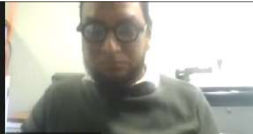
Asst. Programmer, ICT CELL