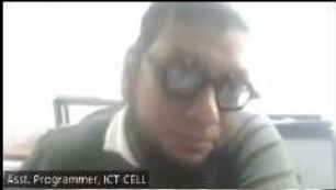
Asst. Programmer, ICT CELL