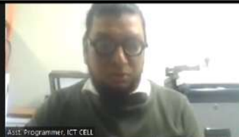
Asstt. Programmer, ICT CELL