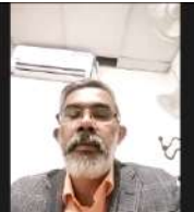
Law Officer, NSC