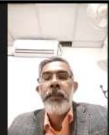
Law Officer, NSC