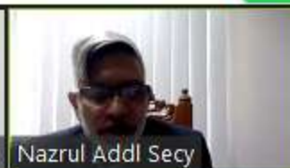
Nazrul Addl Secy