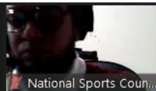
National Sports Coun...