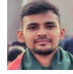
জনাব আসিম মাহমুদ সজীব ভূঁইয়া মাননীয় উপদেষ্টা যুব ও ক্রীড়া মন্ত্রণালয়