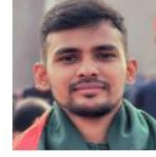
জনাব আসিফ মাহমুদ সজীব হুইয়া মাননীয় উপদেষ্টা যুব ও ক্রীড়া মন্ত্রণালয়