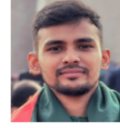
জনাব আসিফ মাহমুদ সজীব ভূইয়া মাননীয় উপদেষ্টা যুব ও ক্রীড়া মন্ত্রণালয়