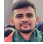
জনাব আশিফ মাহমুদ সজীব কুইয়া মাননীয় উপদেষ্টা যুব ও ক্রীড়া মন্ত্রণালয়