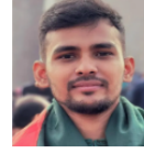
জনাব অদিত্য মহম্মদ সাকীয ভূইয়া মাননীয় উপদেষ্টা যুব ও ক্রীড়া মন্ত্রণালয়