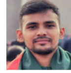
জনাব আসিক মাহমুদ সজীব ভূইয়া মাননীয় উপদেষ্টা যুব ও ক্রীড়া মন্ত্রণালয়