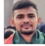
জনাব আসিফ মাহমুদ সজীব ভূঁইয়া মাননীয় উপদেষ্টা যুব ও ক্রীড়া মন্ত্রণালয়