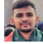
অনাব আসিক মাহমুদ সজীব হুইয়া মাননীয় উপদেষ্টা যুব ও ক্রীড়া মন্ত্রণালয়