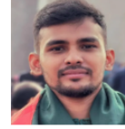
জনাব আসিম মাহমুদ সজীব ভূইয়া মাননীয় উপদেষ্টা যুব ও ক্রীড়া মন্ত্রণালয়