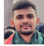
জনাব অসিফ মাহমুদ সজীব ভূইয়া মাননীয় উপদেষ্টা যুব ও ক্রীড়া মন্ত্রণালয়