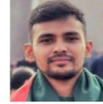
জনাব আশিফ মাহমুদ সজীব ভূঁইয়া মাননীয় উপদেষ্টা যুব ও ক্রীড়া মন্ত্রণালয়