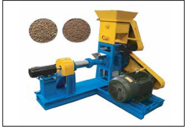
পিলেট খাদ্য তৈরীর মেশিন ক্রয়