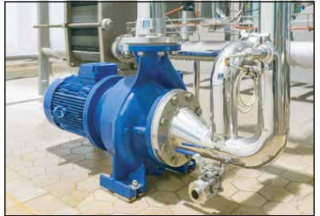
পানির পাম্প স্থাপন