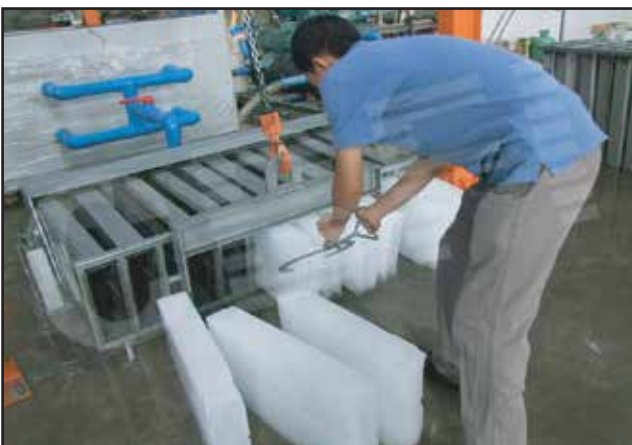
Small Ice Plant