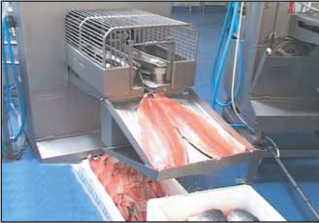
Fish Filleting Machine