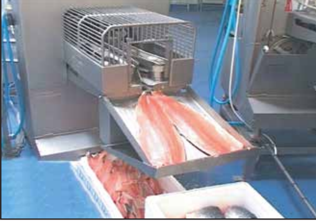
মাছের ফিলেট তৈরীর মেশিন ক্রয়