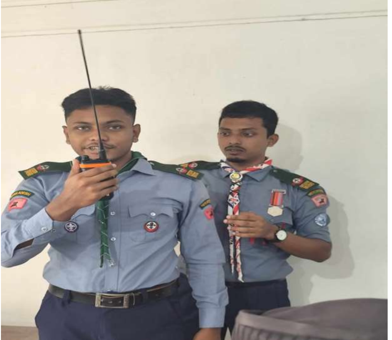
অ্যামেচার রেডিও গুর মাধ্যমে যোগাযোগ