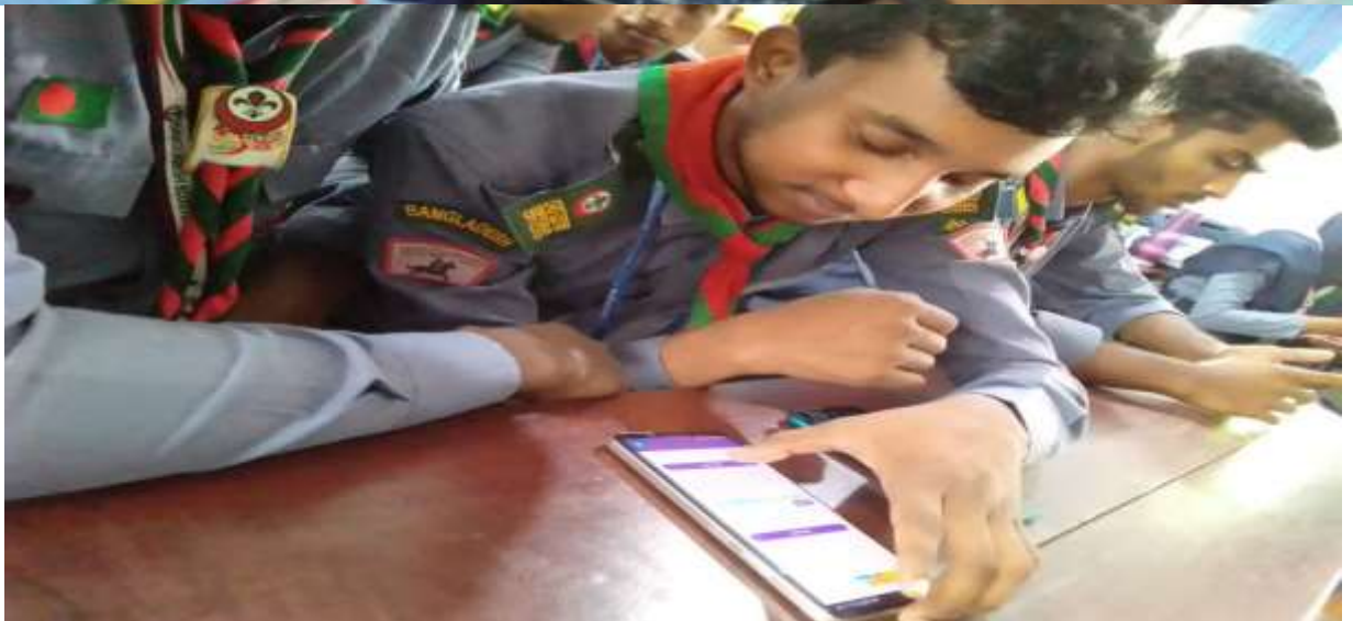
জোটি বিষয়ে হাতে কলমে প্রশিক্ষণ