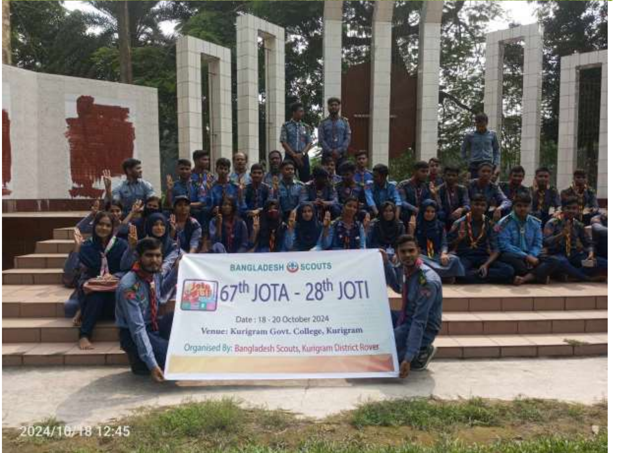
অংশগ্রহনকারীদের গ্রুপ ছবি