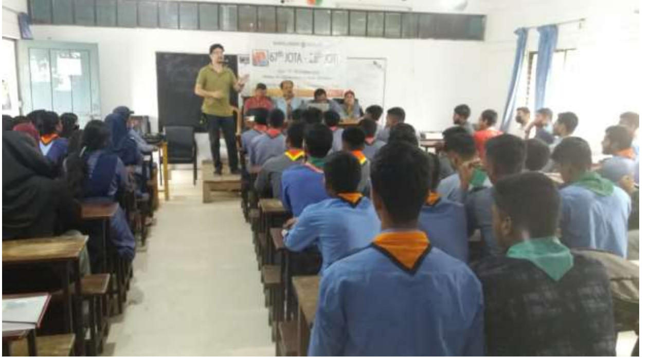
জোট বিষয়ে সেশন