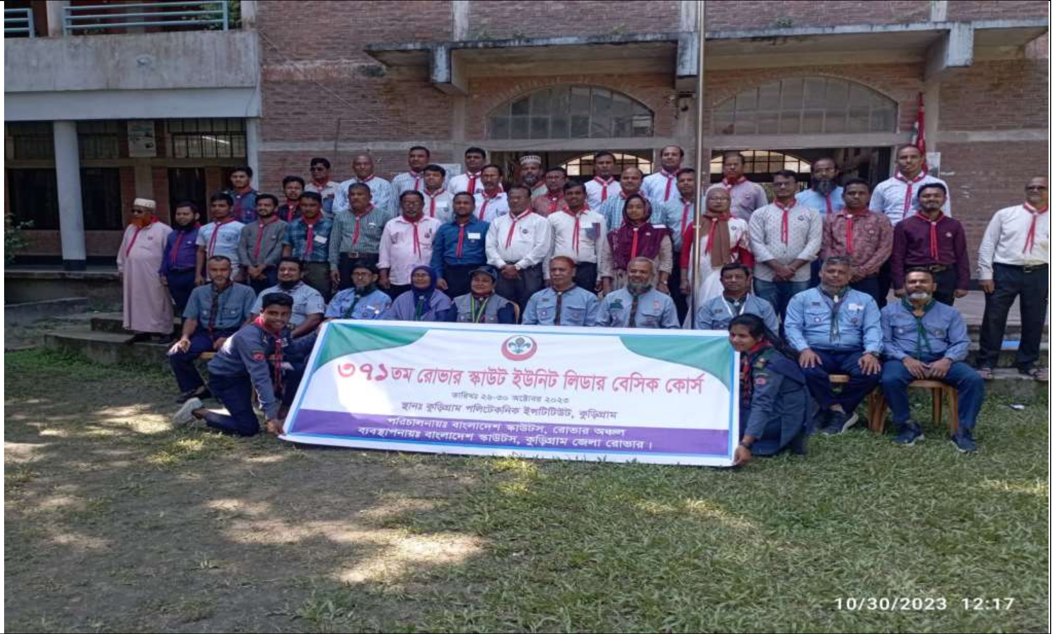
আরএসএল ইউনিট লিডার বেসিক কোর্স