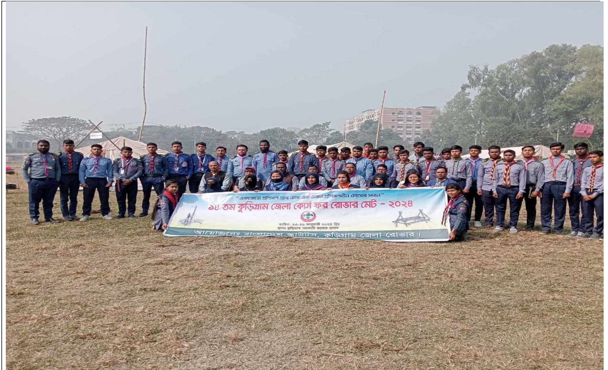
কোর্স ফর রোভার মেট