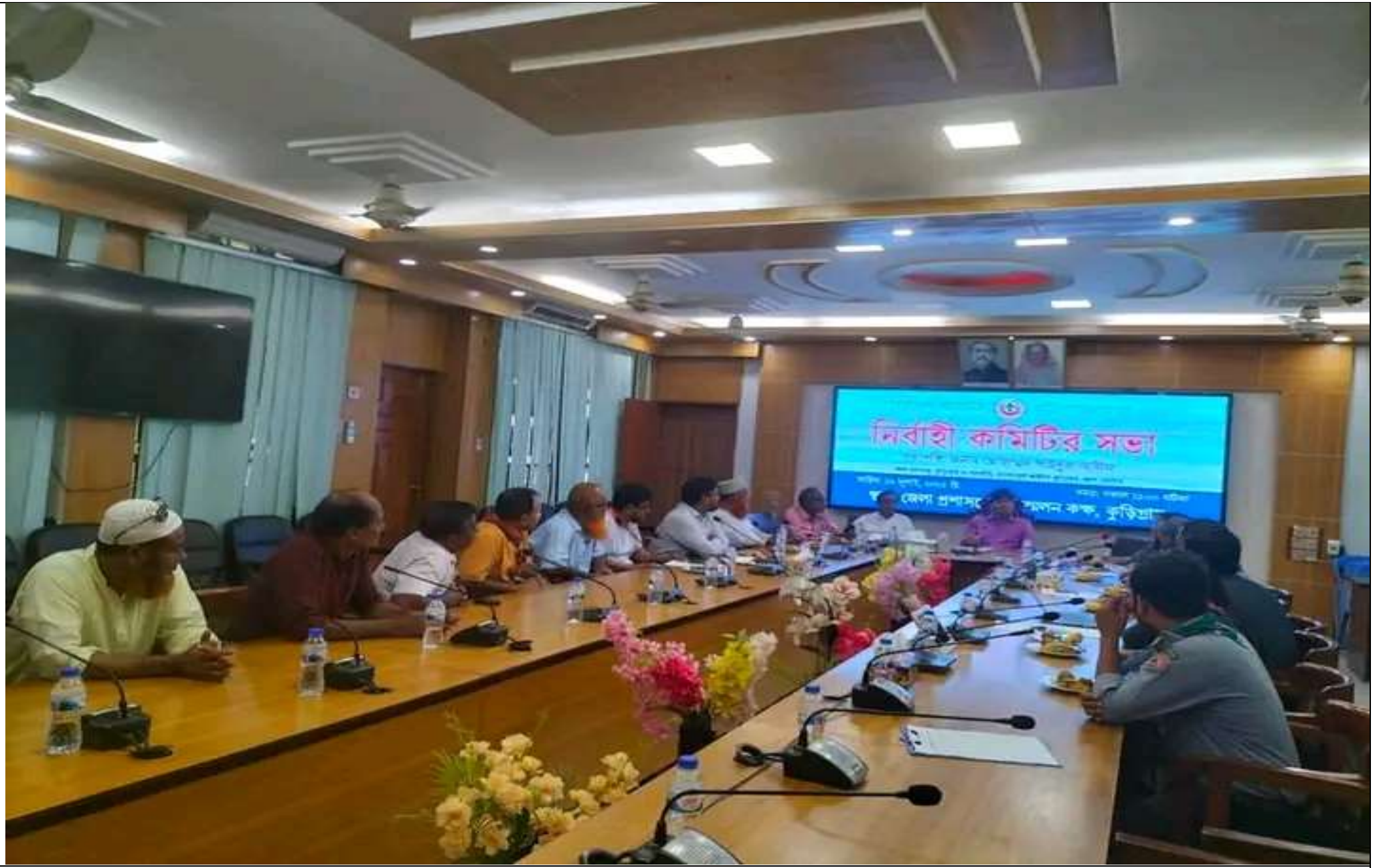
নির্বাহী কমিটির সভা