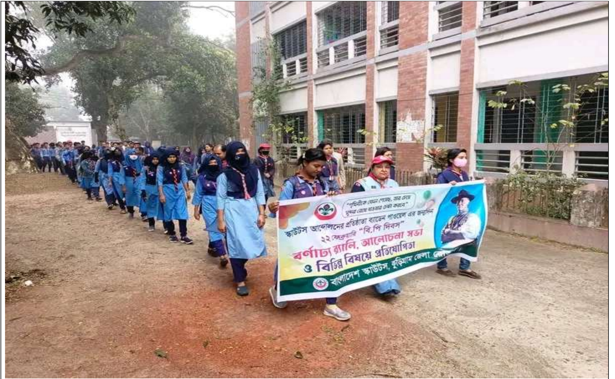
বিপি দিবস উপলক্ষ্যে র্যালী