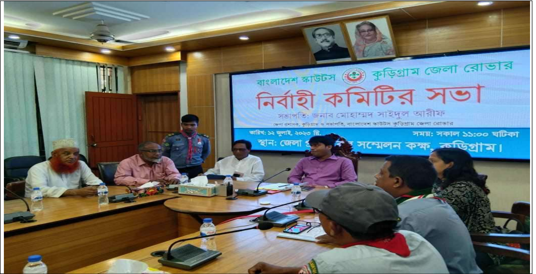
নির্বাহী কমিটির সভা