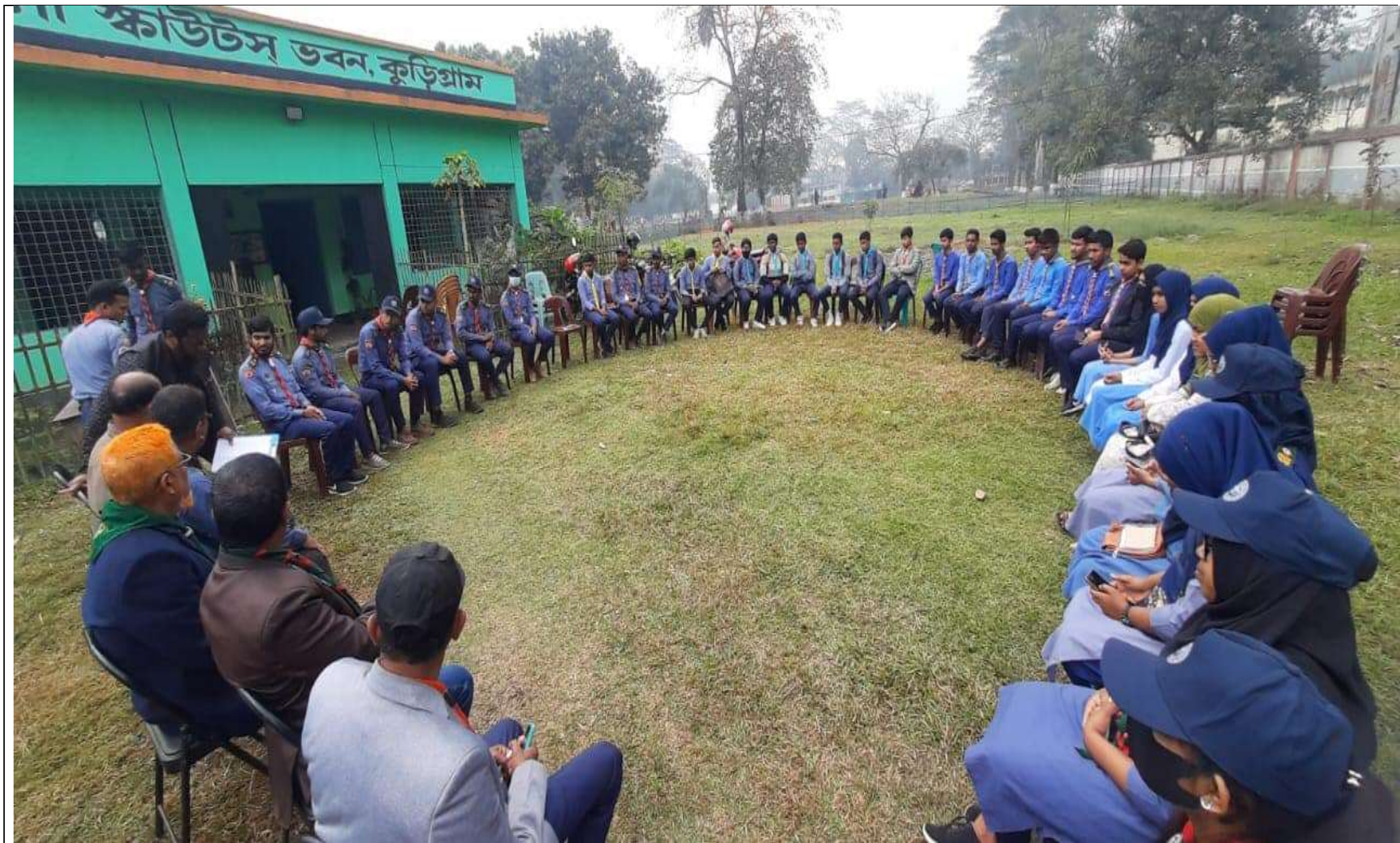
বিপি দিবস উপলক্ষ্যে আলোচনা সভা ও প্রতিযোগিতা