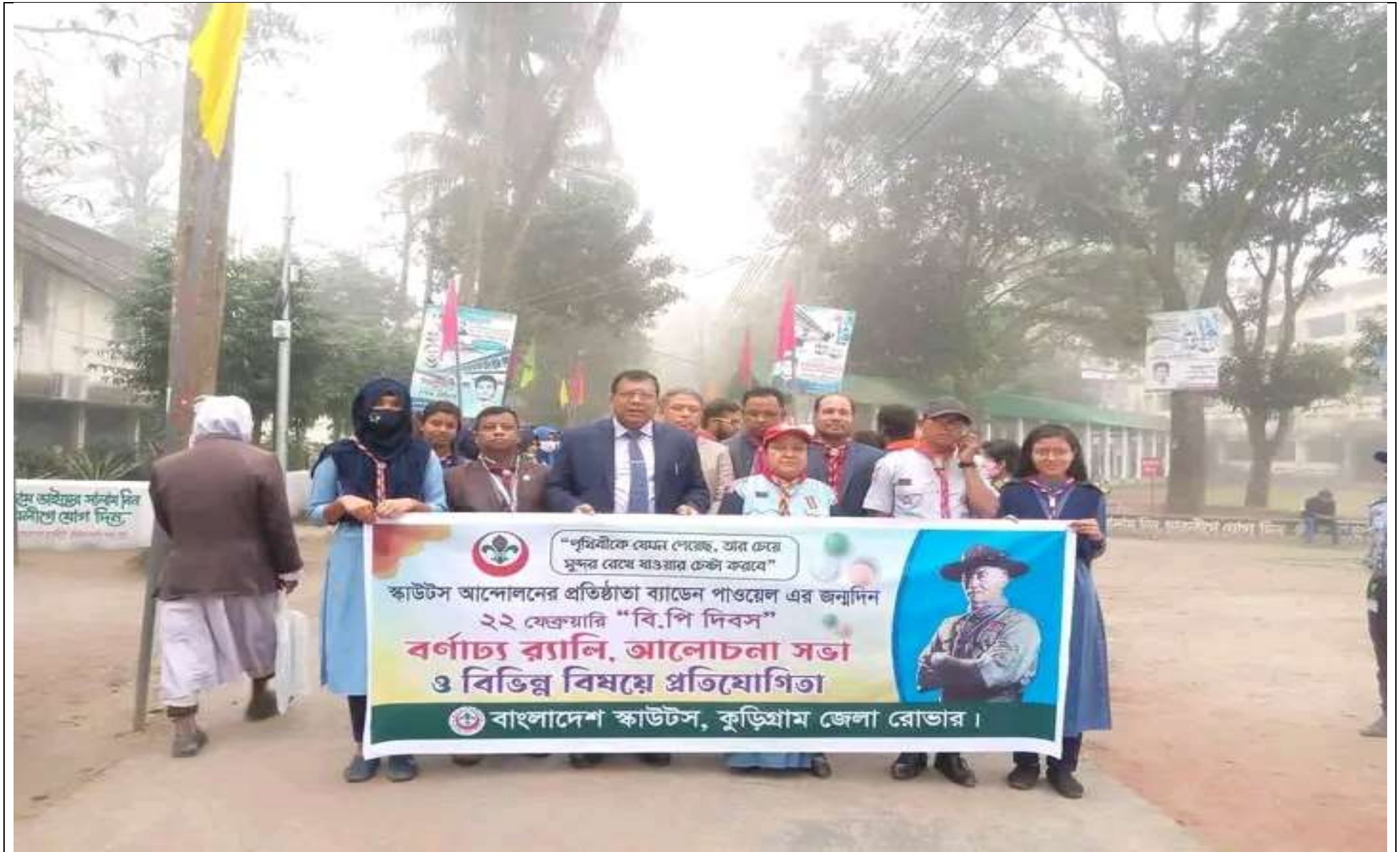
বিপি দিবস উপলক্ষ্যে র্যালী