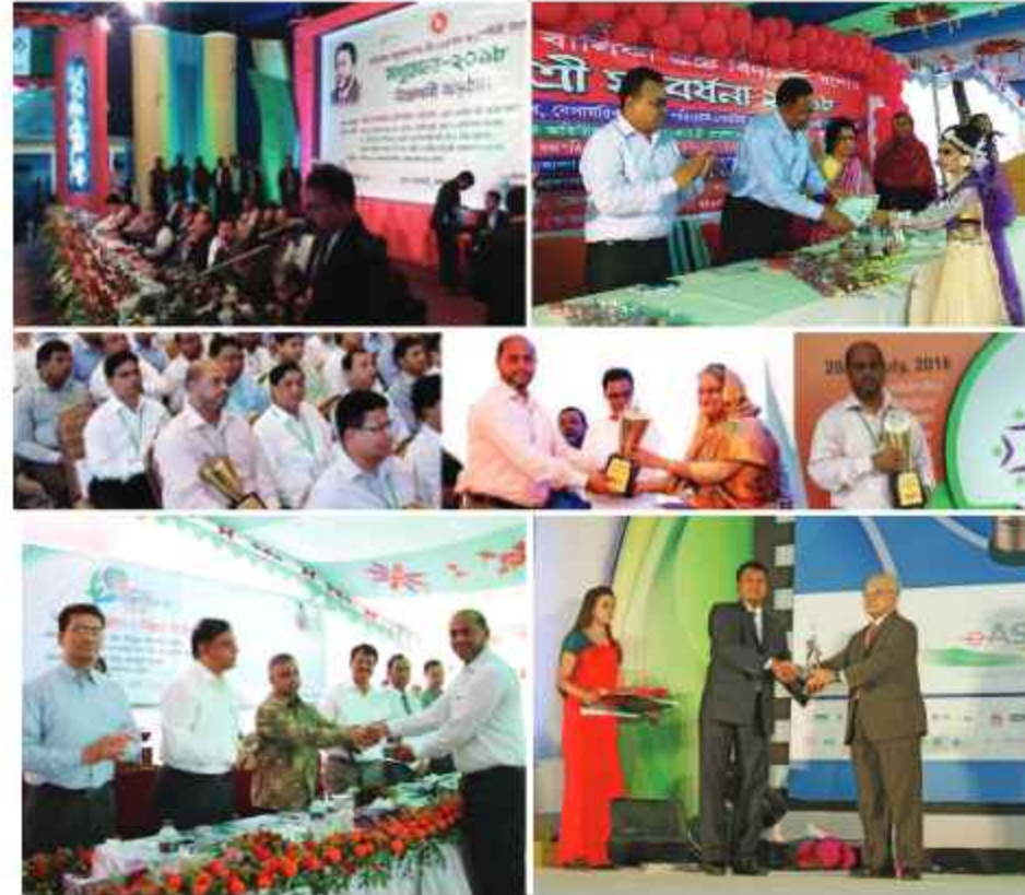
ছবিটিতে যশস্রী যশোরের কতিপয় অর্জন