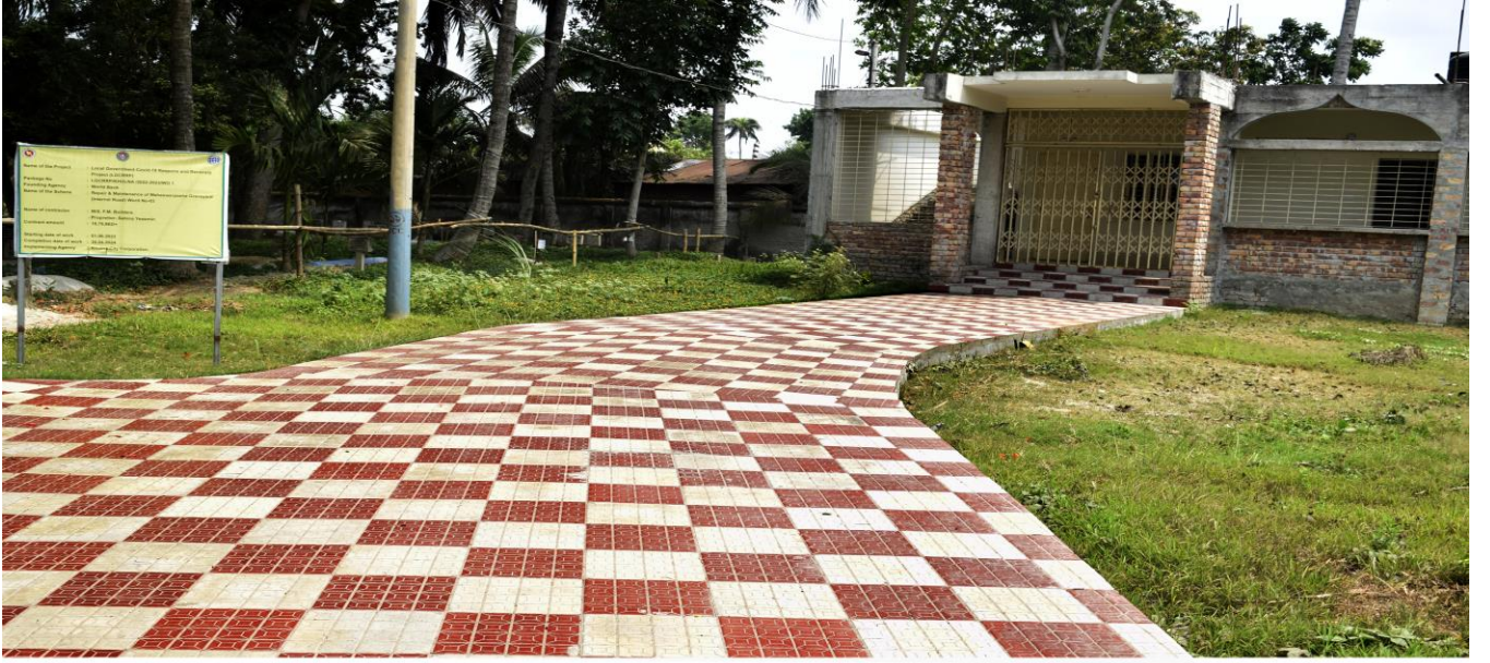
মহেশ্বরপাশা কবরখানার মুদ্রারখানা, অফিস ও অভ্যন্তরীণ রাস্তা মেরামত।