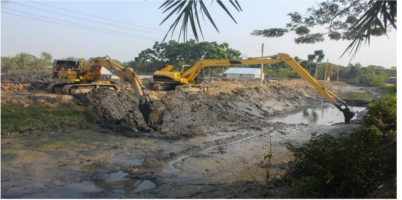
ছড়িছড়া খাল খনন