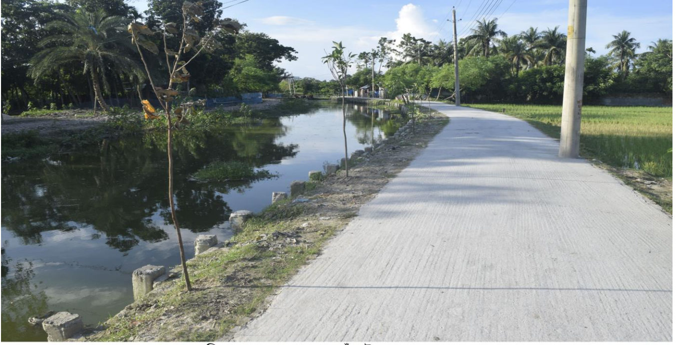
ছড়িছড়া খাল খনন ও পাড় বাঁধাই