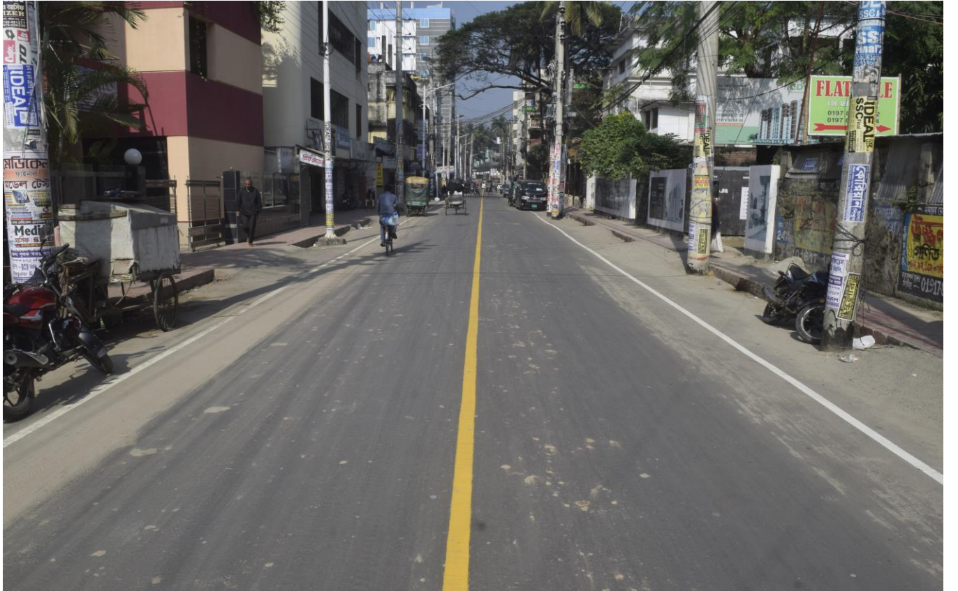
আহসান আহমেদ রোড