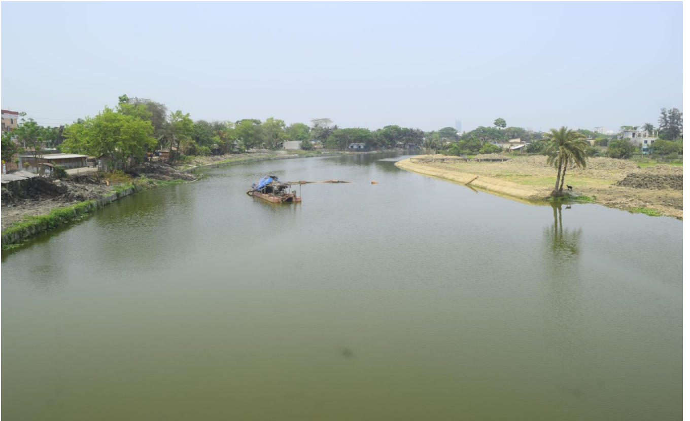
ময়ূর নদী খনন