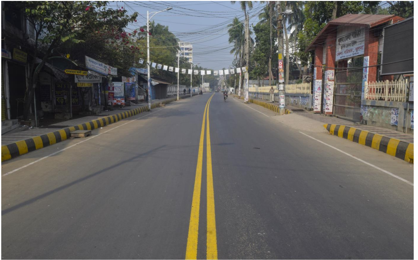
কেডি ঘোষ রোড