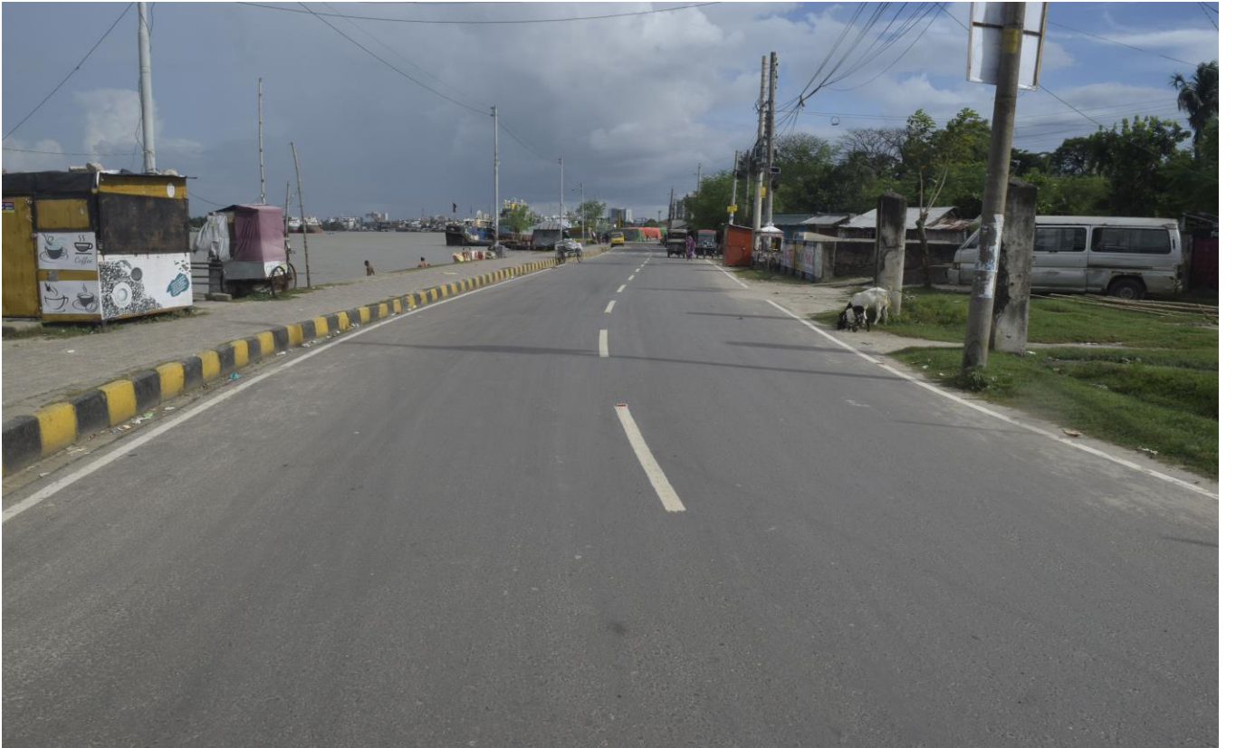
মোসলেম উদ্দিন সড়ক উন্নয়ন