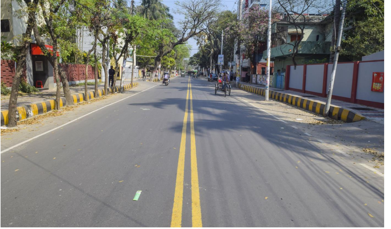
লোয়ার যশোর রোড