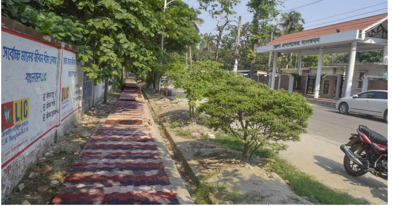
কেডি ঘোষ রোডে ড্রেন ও ফুটপাথ