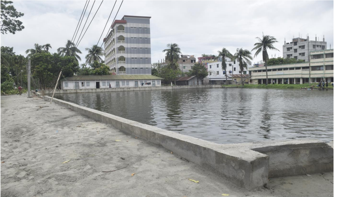
তাল্লিমুল মিল্লাত খালাসী মাদ্রাসার প্রবেশ পথে অভ্যন্তরে পুকুরের পার্শ্বে আরসিসি রিটেইনিং ওয়াল ও ড্রেনসহ রাস্তা নির্মাণ (কাজের পর)