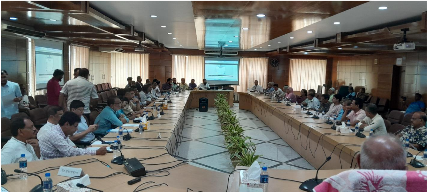
কেসিসি'র CLCC সভা