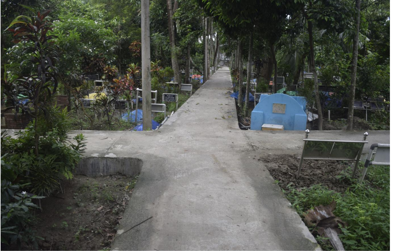
গোয়ালখালী কবরখানার সংযোগ সড়ক উন্নয়ন