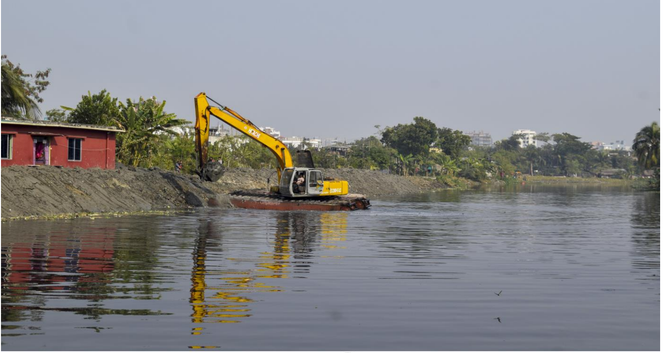
ময়ূর নদী খনন