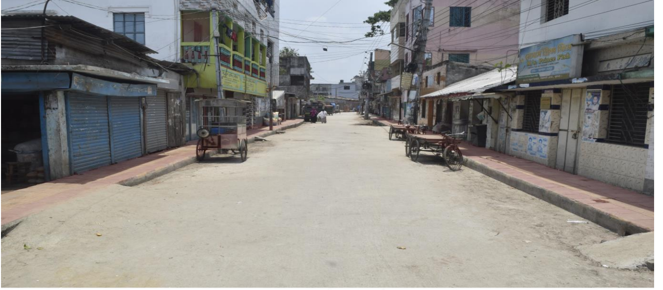
নতুন বাজার লঞ্চঘাট রোড উন্নয়ন