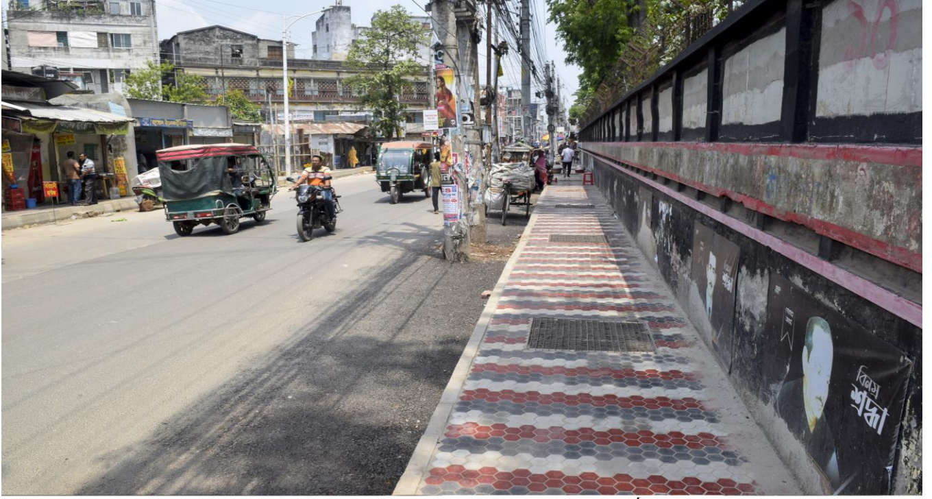
লোয়ার যশোর রোডে ড্রেন ও ফুটপাথ