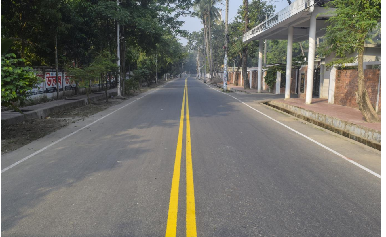
কেডি ঘোষ রোড