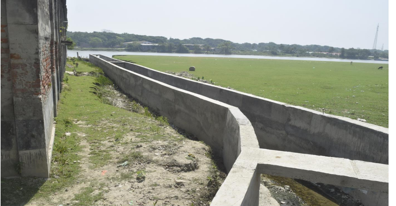
মিরের ডাঙ্গা বালির মাঠ হতে টিবি হাসপাতাল রোড পর্যন্ত ড্রেন নির্মাণ