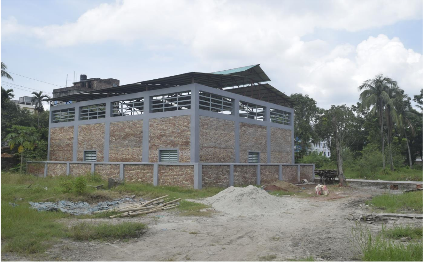
সেকেভারী ট্রান্সফার স্টেশন (এসটিএস)