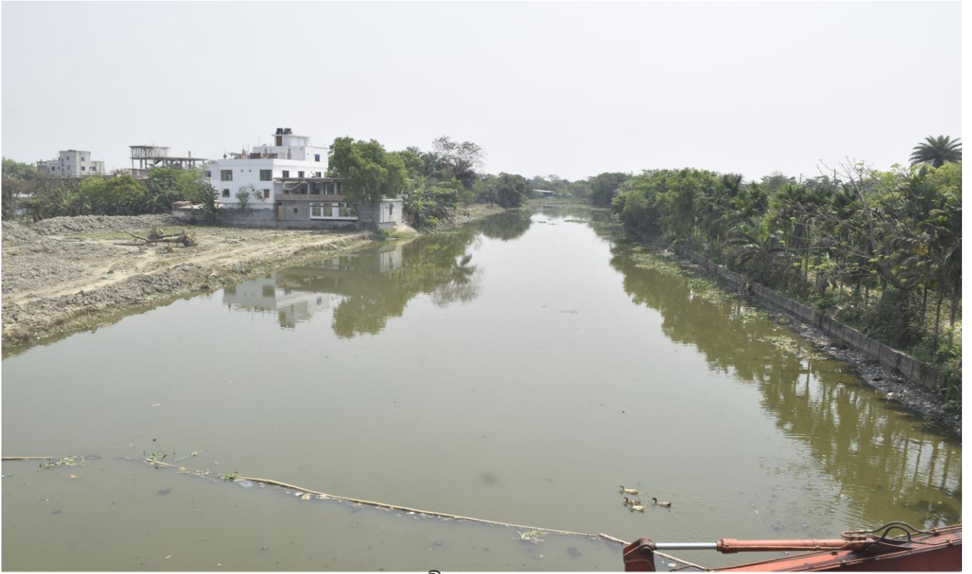
ময়ূর নদী খনন