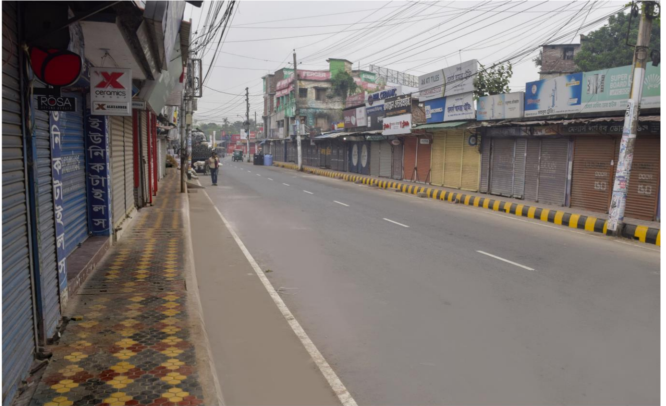
খানজাহান আলী রোডে ড্রেন ও ফুটপাথ