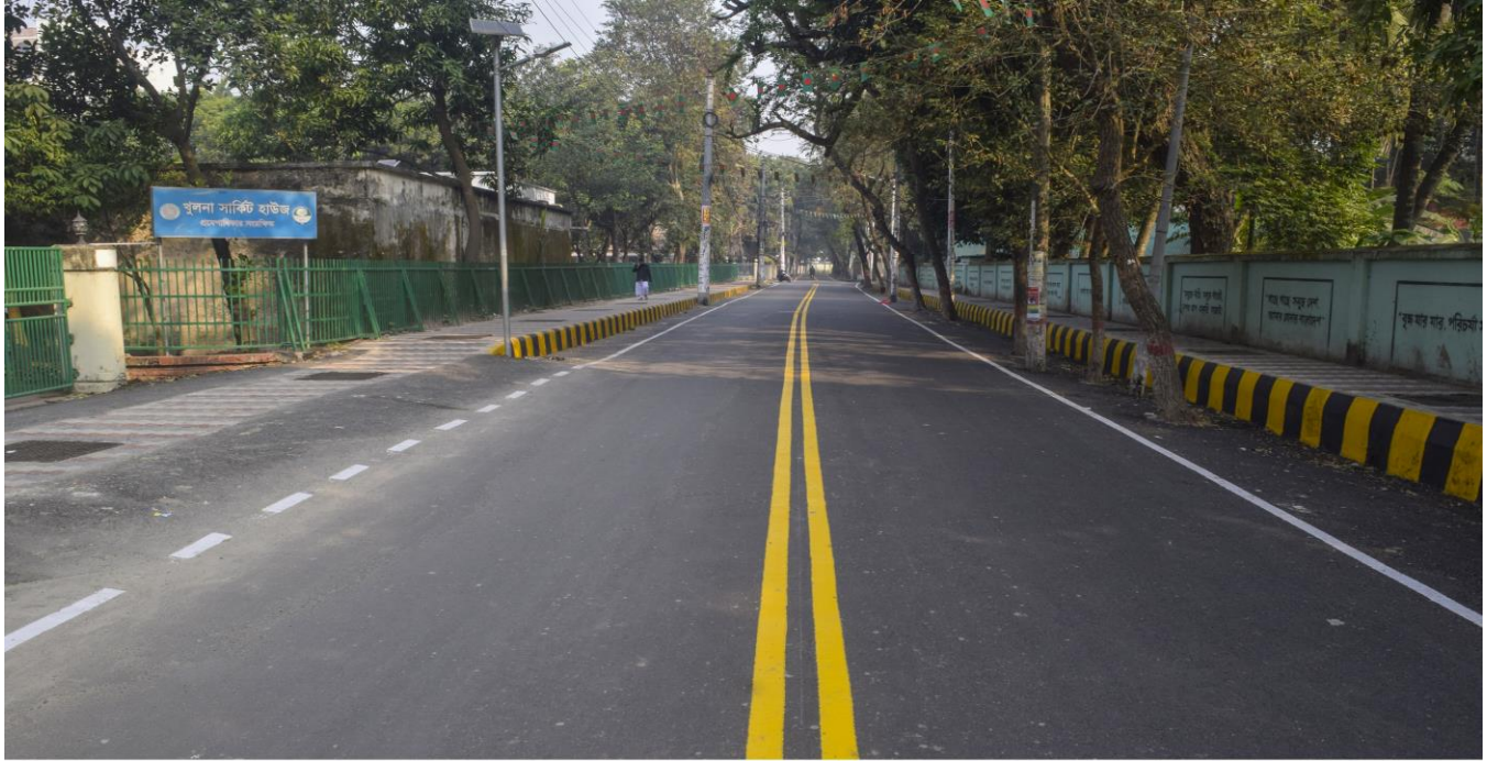
সার্কিট হাউজ রোড