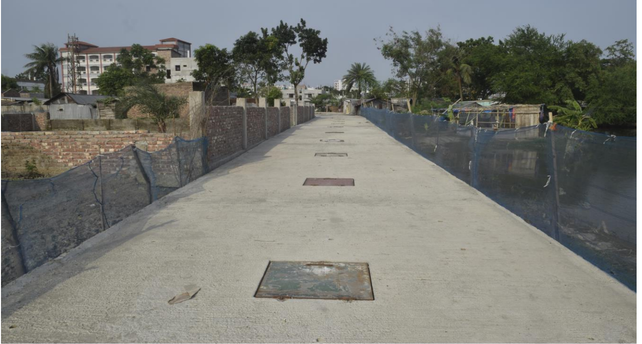
মল্লিক সড়ক আইডিয়াল কলেজের শেষাংশে ড্রেন নির্মান।