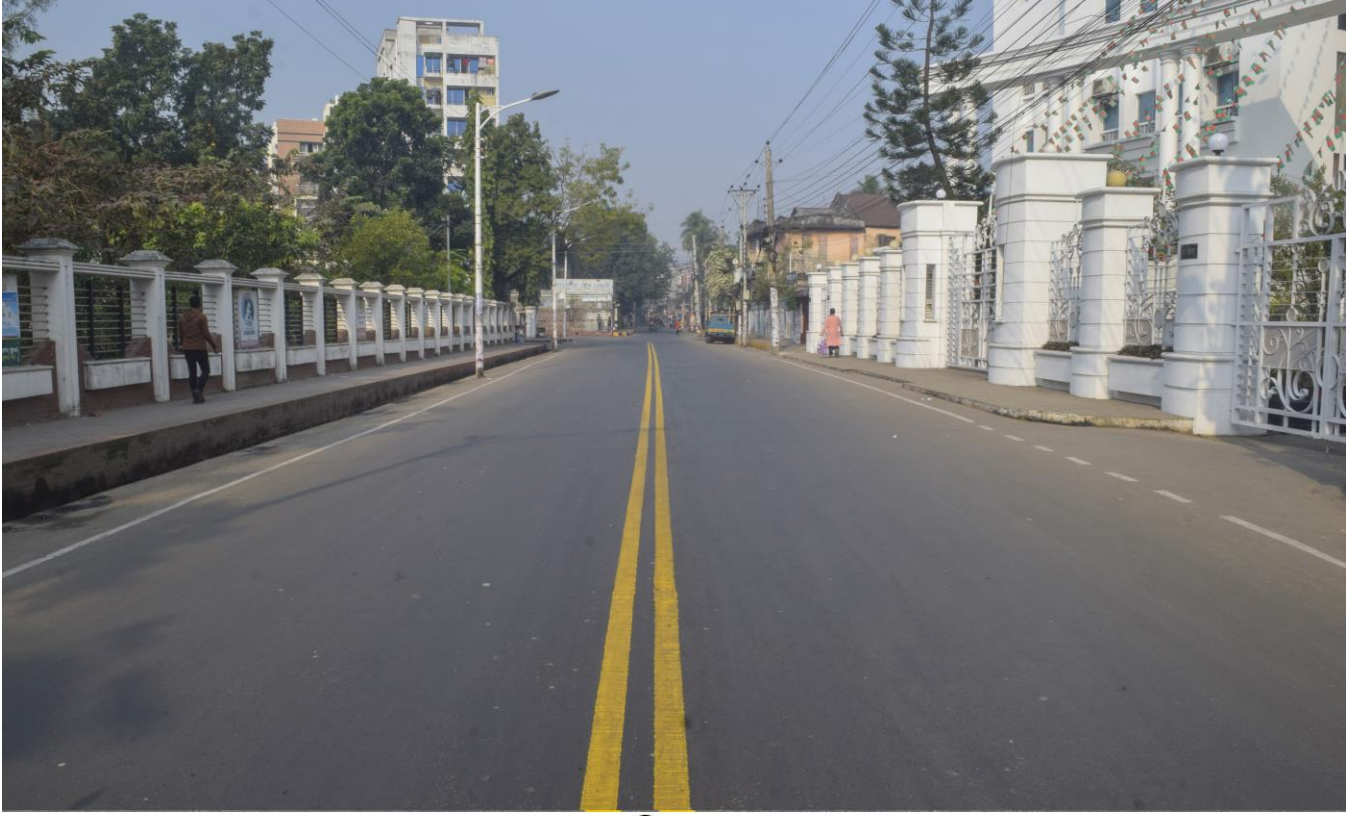
কেডি ঘোষ রোড