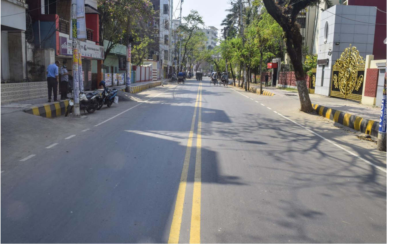
লোয়ার যশোর রোড