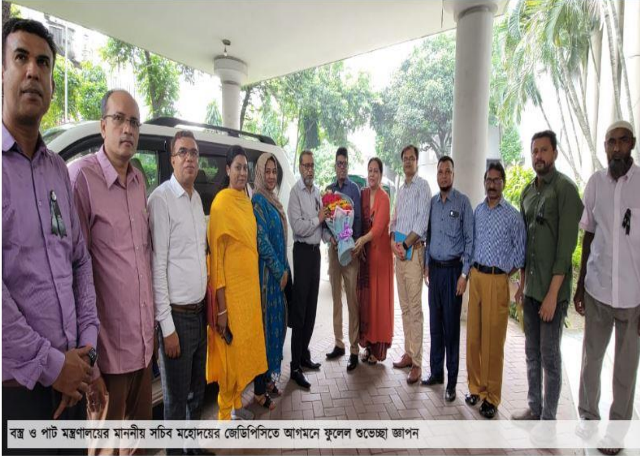
বস্ত্র ও পাট মন্ত্রণালয়ের মাননীয় সচিব মহোদয়ের জেডিপিসিতে আগমনে ফুলেল শুভেচ্ছা জ্ঞাপন