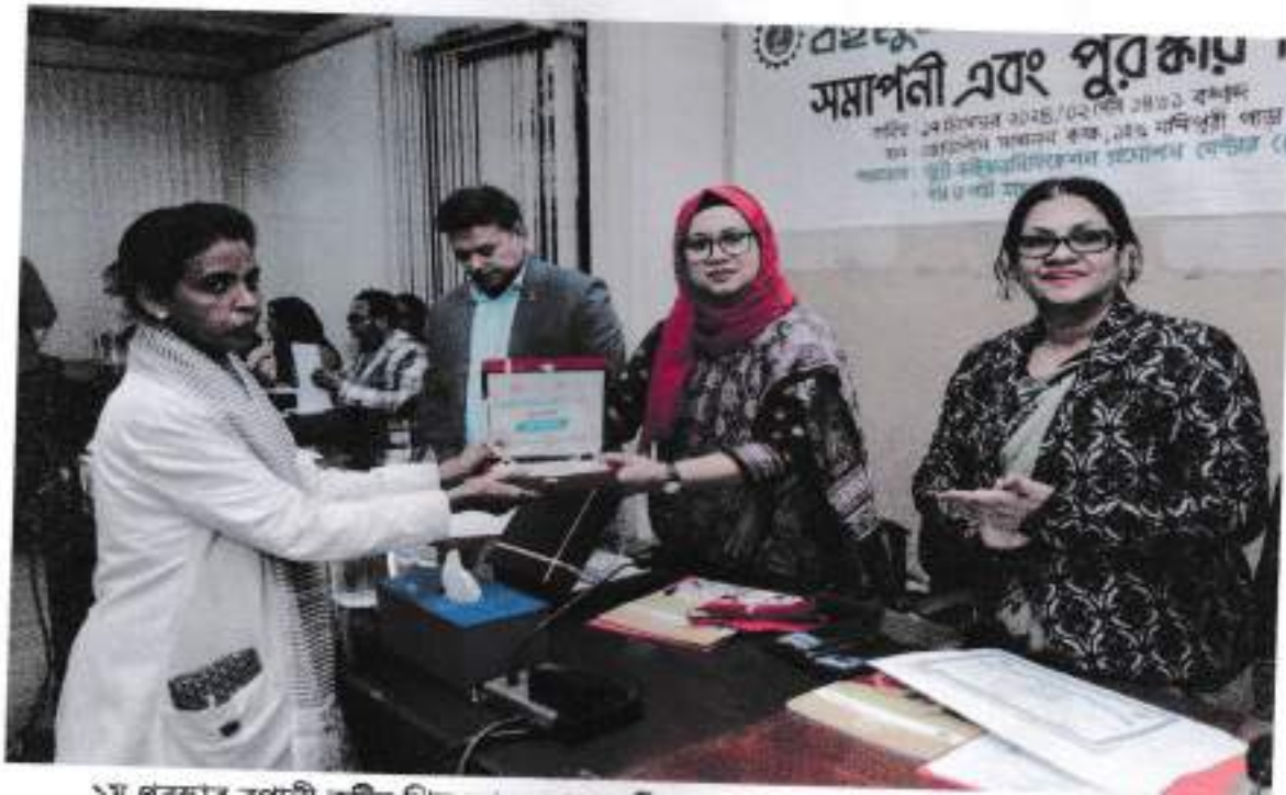
১ম পুরস্কার বহুমুখী সচিব