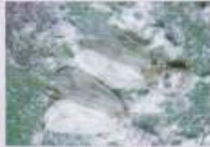
পূর্ণক সাদা মাছি পোকা