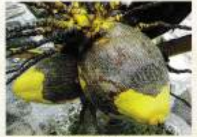
মাইট আক্রান্ত ডাব