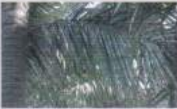
সাদা মাছি আক্রান্ত নারিকেল পাতা