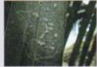
নারিকেল পাতায় সাদা মাছির ডিম, বাচ্চা ও পূর্ণক পোকা