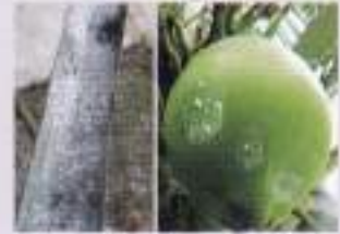
মারাত্মকভাবে আক্রান্ত নারিকেলের পাতা হাবে পোকাকার আক্রমণ চিহ্ন

প্রযুক্তির বর্ণনা: কীটতত্ত্ব বিভাগ, বিএআরআই উদ্ভাবিত আইপিএম প্রযুক্তির মাধ্যমে উক্ত সাদা মাছি পোকাটি সহজে পরিবেশসম্মত ও লাভজনক উপায়ে দমন করা যায়।