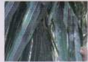
নারিকেলের পাতায় স্যুটি মোড়