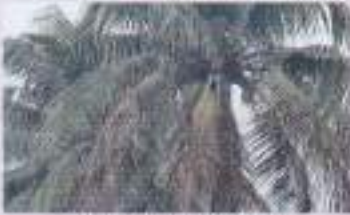
সাদা মাছি আক্রান্ত নারিকেল গাছ

এই সাদা মাছি পোকা সাধারণত নারিকেল গাছের পাতা থেকে রস শোষণ করে ক্ষতি করে থাকে। এ ছাড়া এ পোকা এক ধরনের মধুর মত রস নিঃসরণ করে যার ফলে সেখানে কালো রংয়ের স্যুটিমোড় ছত্রাক জন্মায়। ব্যাপক আক্রমণের ফলে নারিকেল গাছের সমস্ত পাতা কালচে বর্ণ ধারণ করে এবং ঝলসে যায়, এর ফলে গাছের সাণোকসংশ্লেষণ প্রক্রিয়া বাধাগ্রস্ত হয়। অনেক সময় ভাবেও এ পোকাকার আক্রমণ চিহ্ন লক্ষ্য করা যায়। এ পোকাকার আক্রমণের ফলে গাছ সাধারণত মারা যায় না কিন্তু গাছের স্বাভাবিক বৃদ্ধি এবং নারিকেলের উৎপাদন মারাত্মকভাবে ব্যহত হয়।