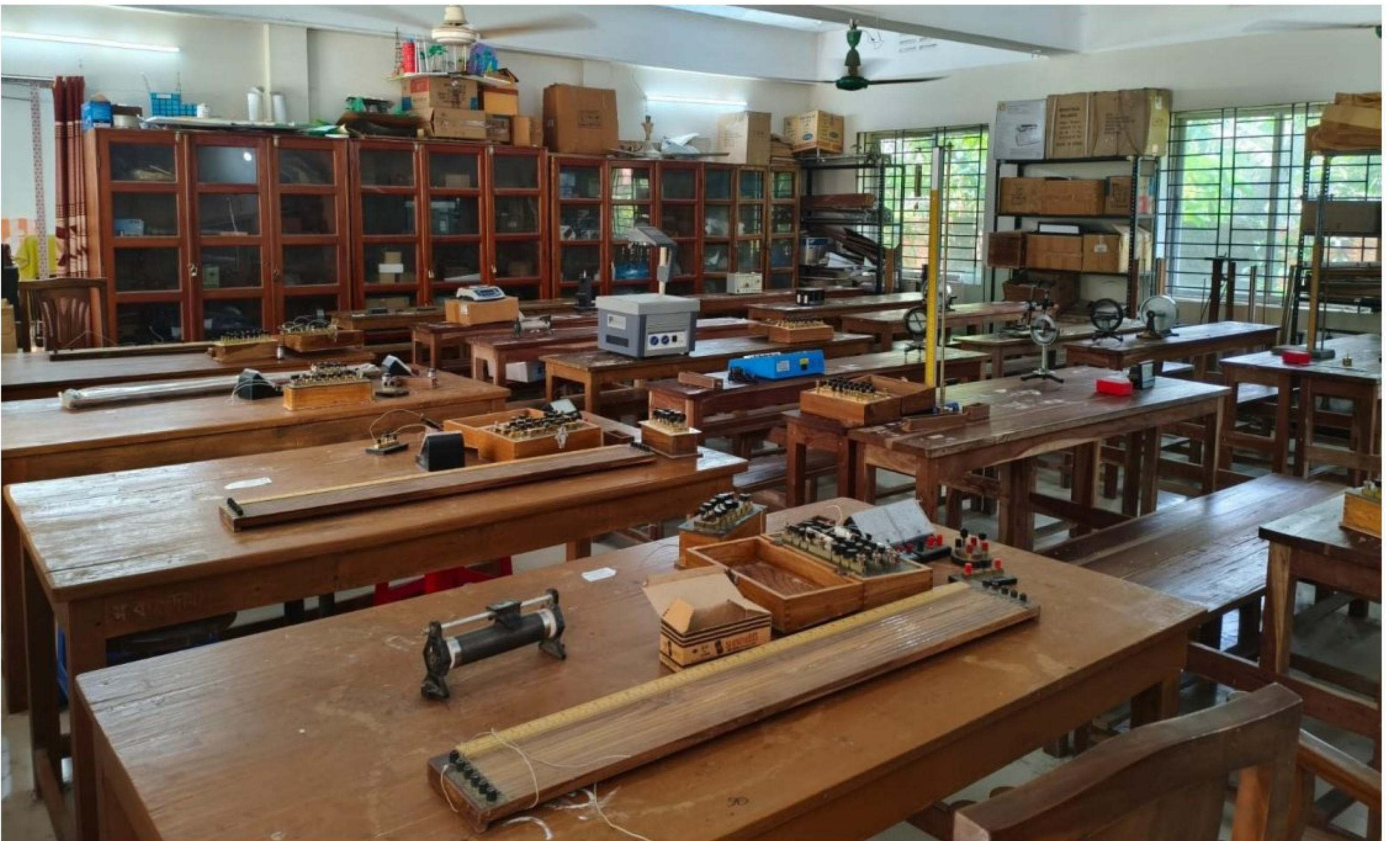
পদার্থ বিদ্যা ল্যাব (চিত্র ২)