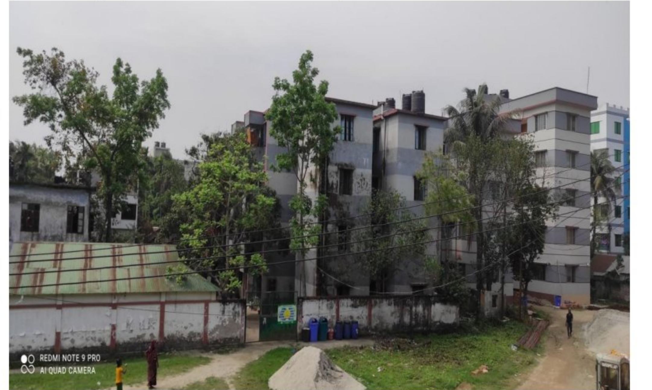
ভবন ৭, ৮, ৯ : ছাত্রী হোস্টেল, শিক্ষক ডরমিটরি (মহিলা ও পুরুষ)