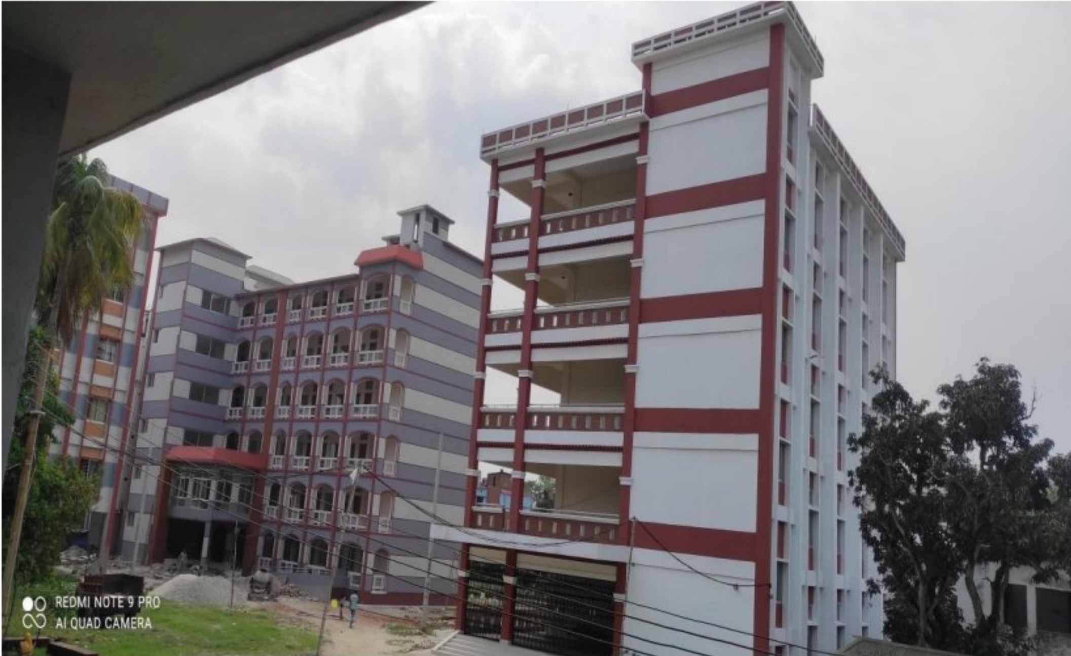
ভবন-৫,৬ : বিজ্ঞান ভবন ও মাল্টি পারপাজ ভবন