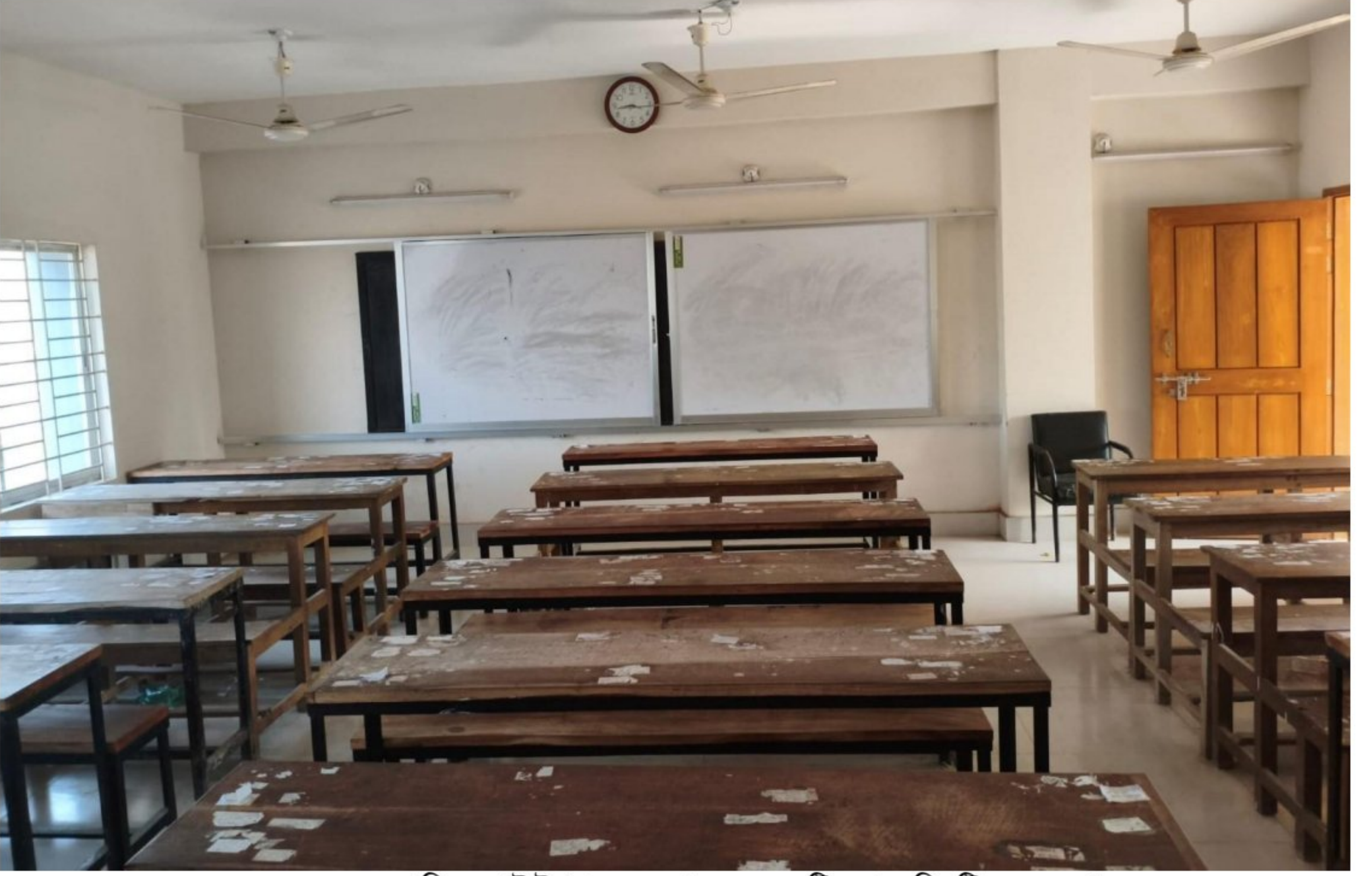
নতুন ভবনের শ্রেণিকক্ষ (টাইপ-১, ৬ তলা ভবনের ৫টি ফ্লোরে তিনটি করে কক্ষ)