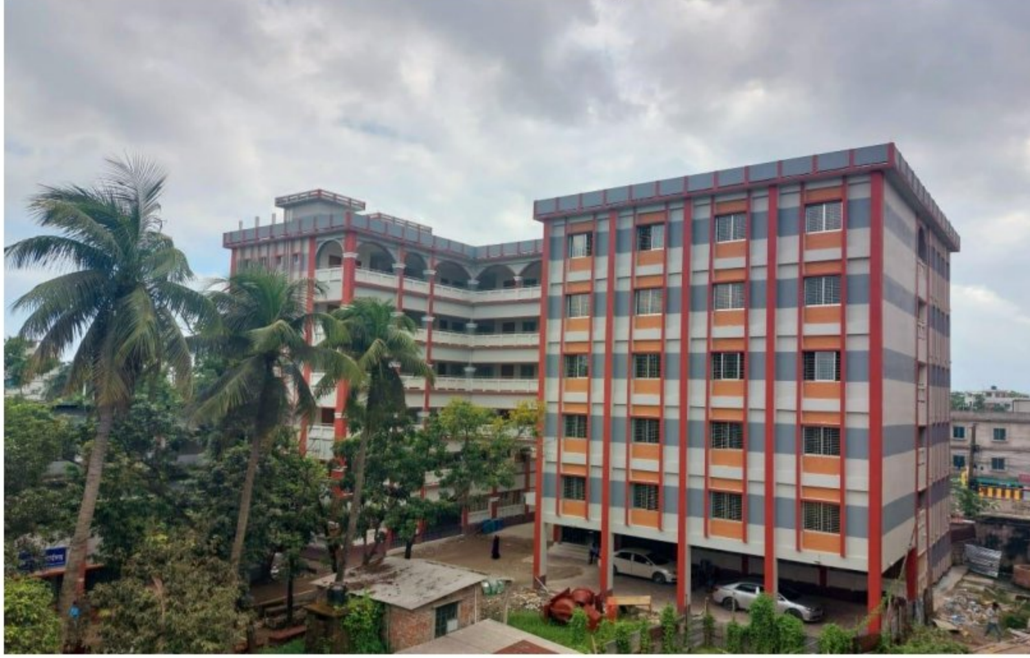
ভবন-১ : ৬ তলা বিশিষ্ট একাডেমিক কাম প্রশাসনিক ভবন