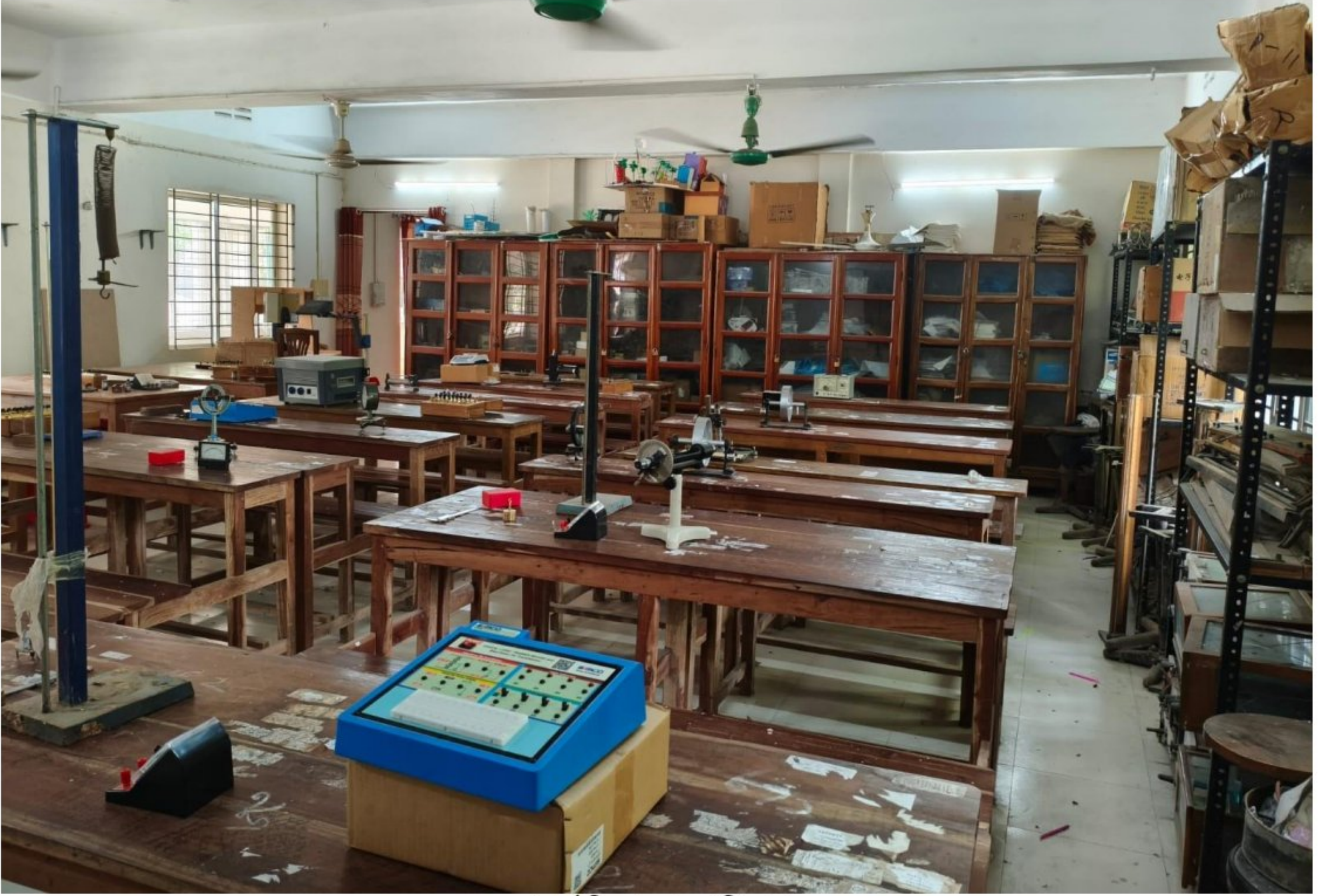
পদার্থ বিদ্যা ল্যাব (চিত্র ১)