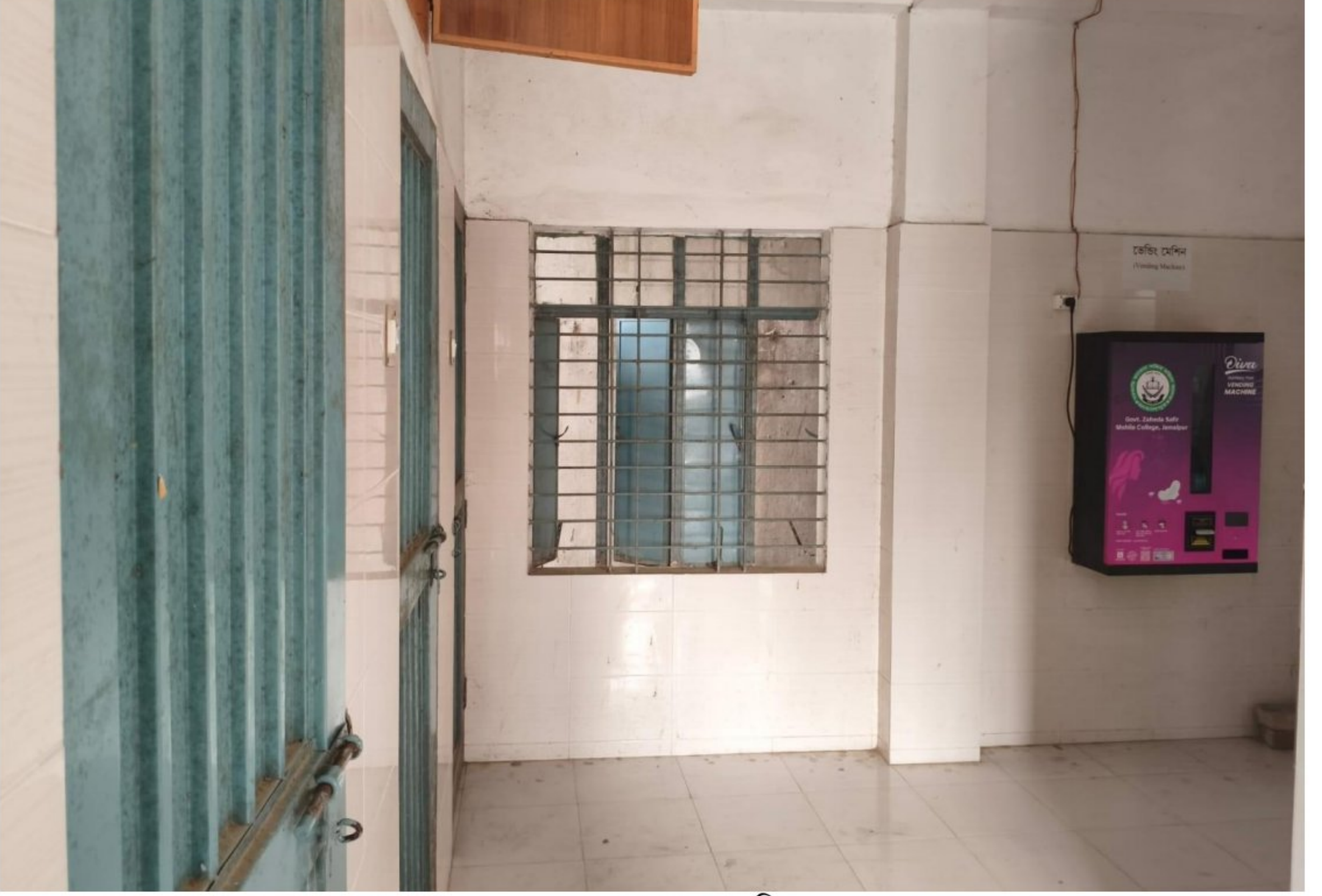
পুরাতন ভবনের ওয়াশরুম (চিত্র-১)