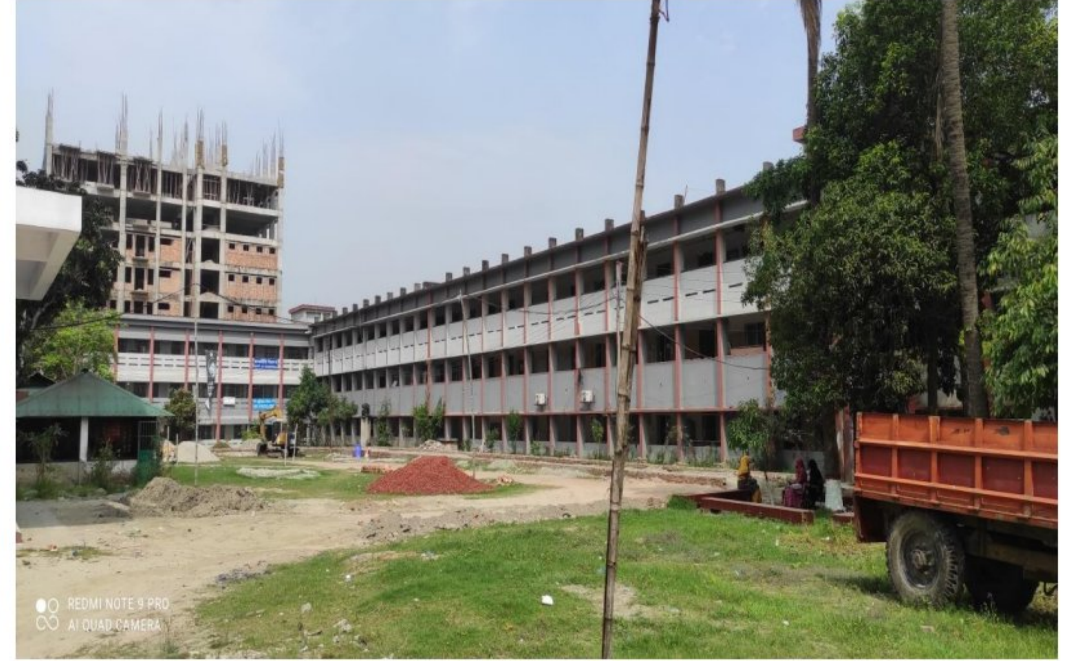
ভবন ২,৩,৪ : ৩ তলা বিশিষ্ট একাডেমিক ভবন, ১০তলা বিশিষ্ট নির্মাণাধীন ছাত্রী হোস্টেল