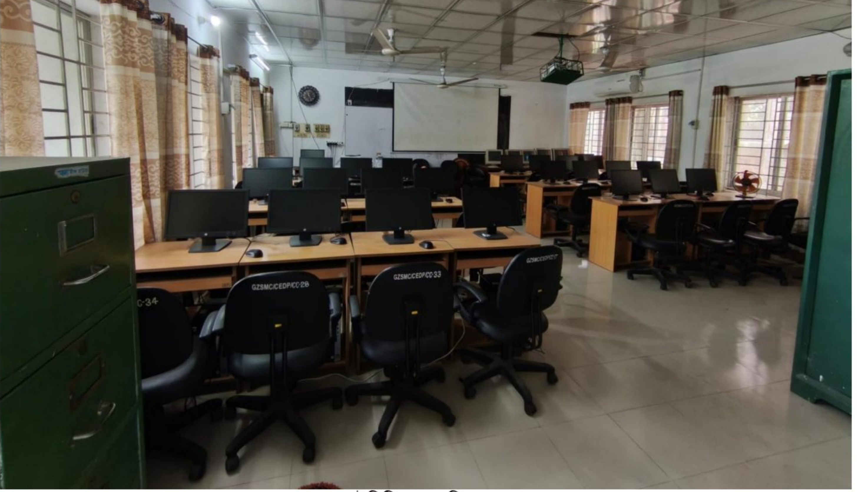
আইসিটি কাম গণিত ল্যাব