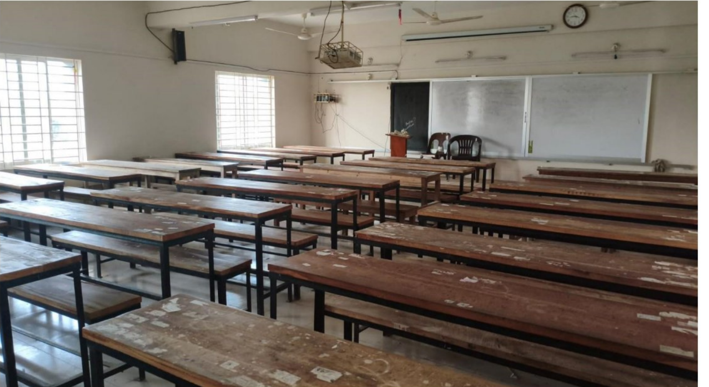
নতুন ভবনের শ্রেণিকক্ষ (টাইপ-২, ৬ তলা ভবনের ৫ টি ফ্লোরে একটি করে কক্ষ)