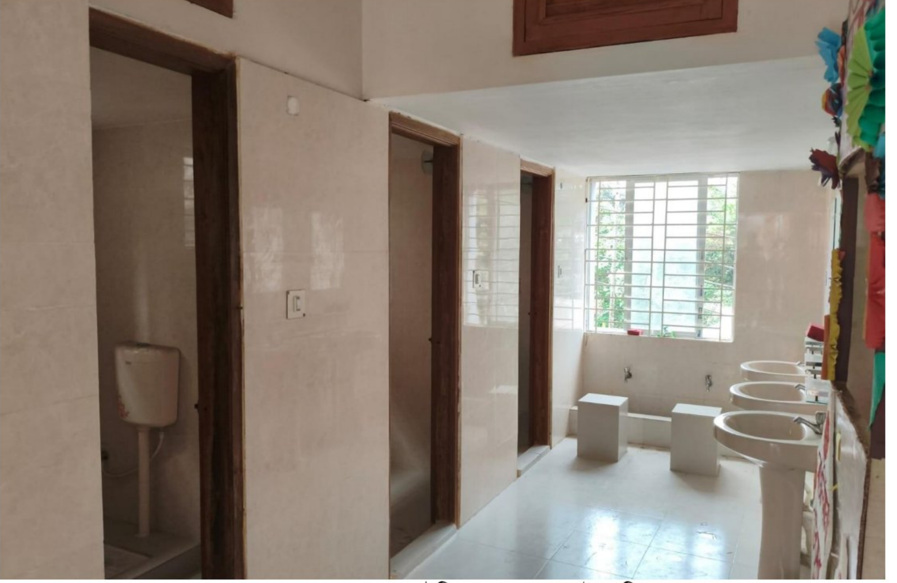
নতুন ভবনের ওয়াশরুম (দুইটি ৬ তলা ভবনে মোট ১৮টি)