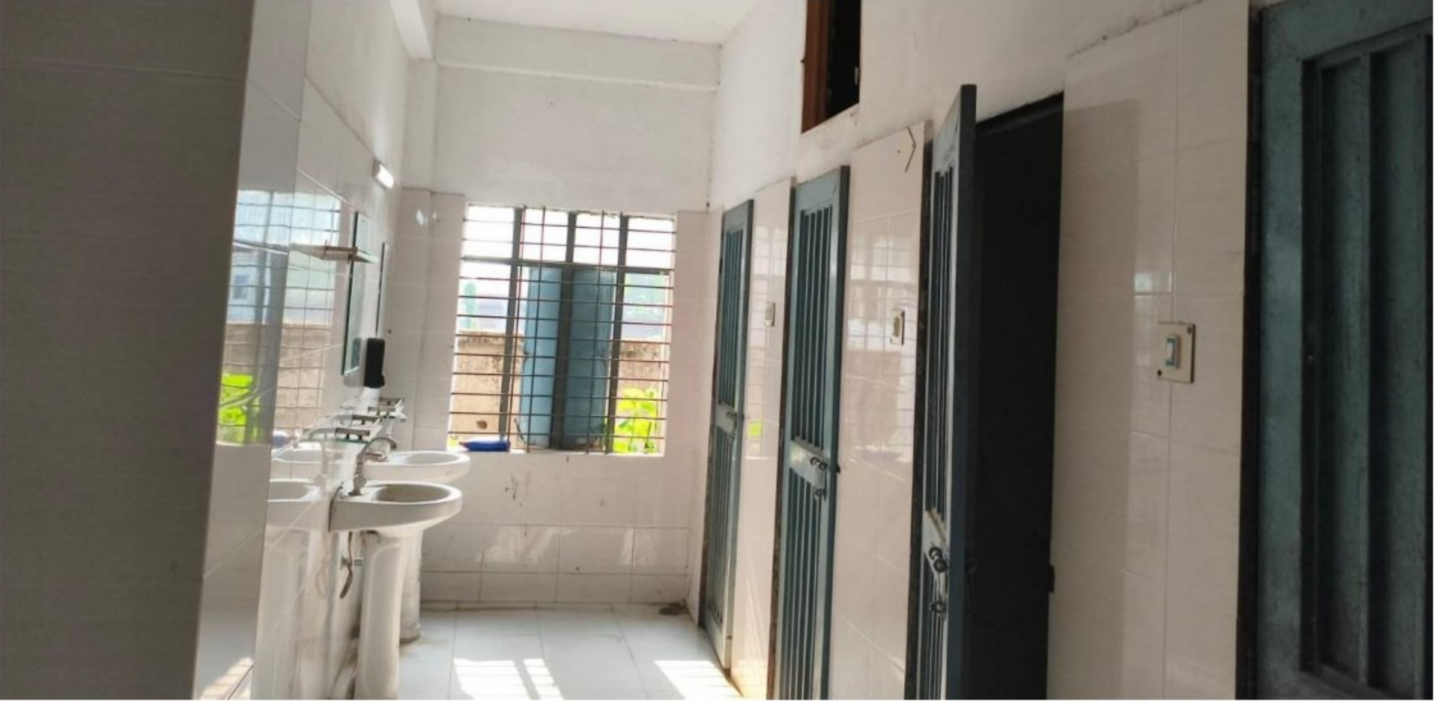
পুরাতন ভবনের ওয়াশরুম (চিত্র-২) (তিন তলা ভবনে মোট ৫টি)