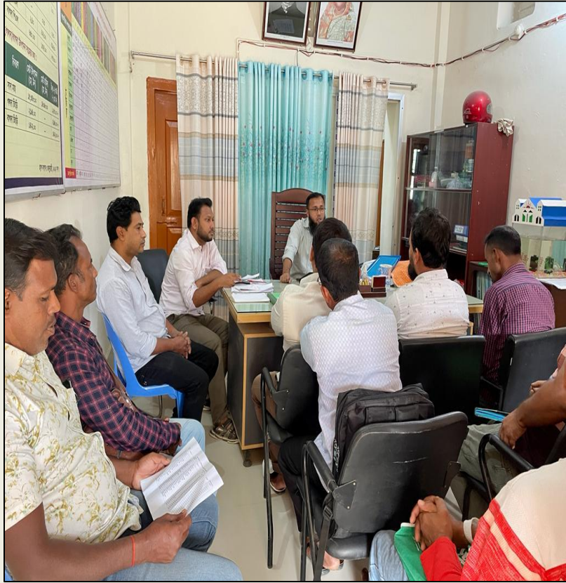
লিফ মাসিক সভা