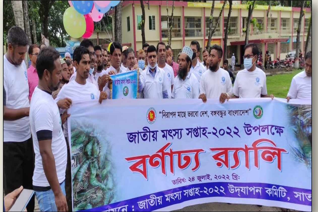
মৎস্য মেলা ও মৎস্যচাষি র্যালি