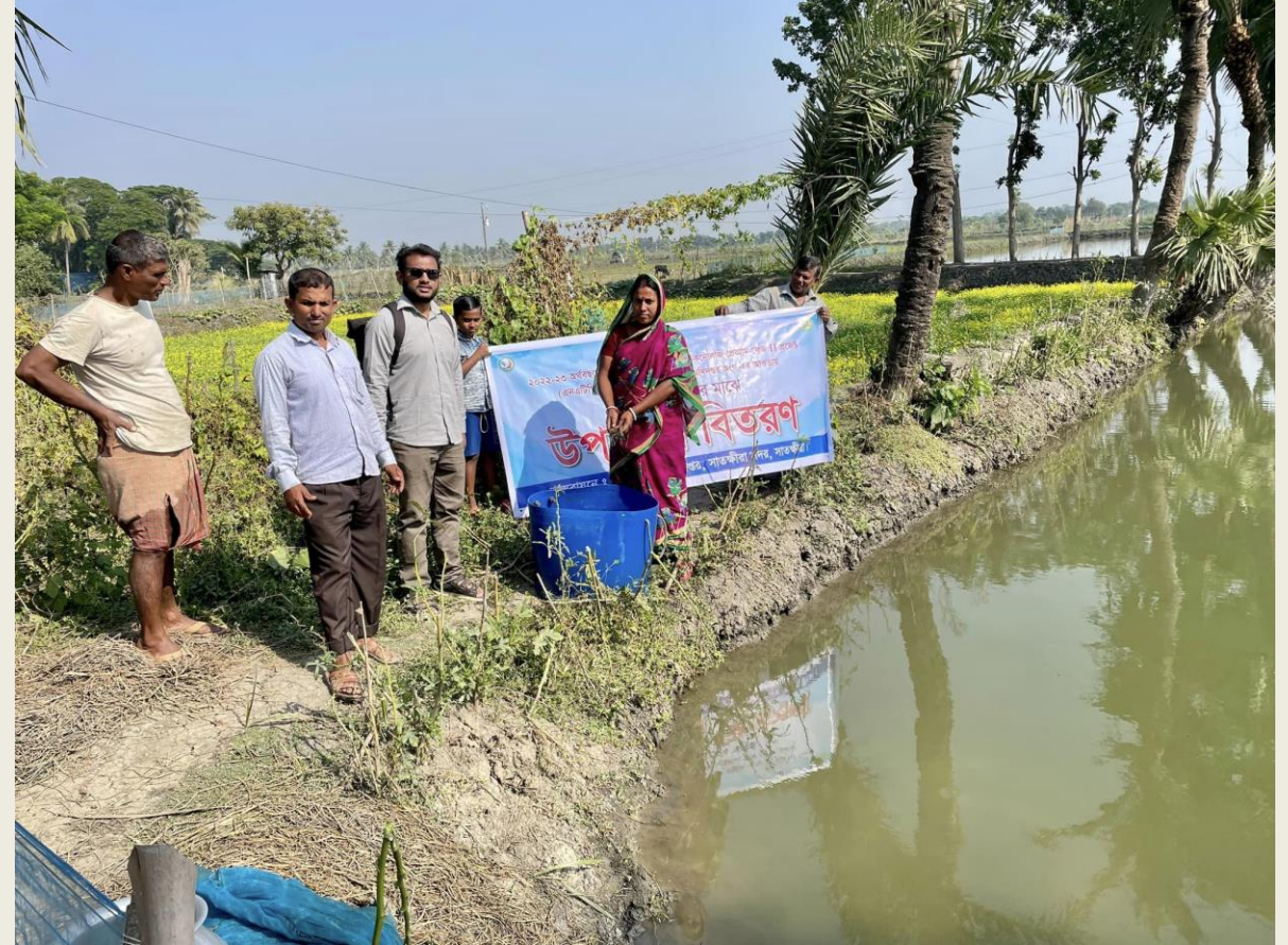
প্রদর্শনী বাস্তবায়ন (পোনা বিতরণ)