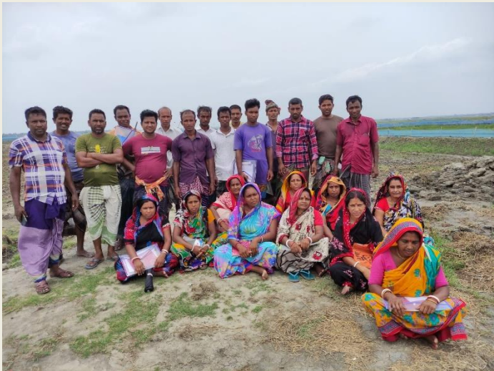
ক্লাস্টার চাষিদের 'Advance Technical Training' বিষয়ক প্রশিক্ষণ