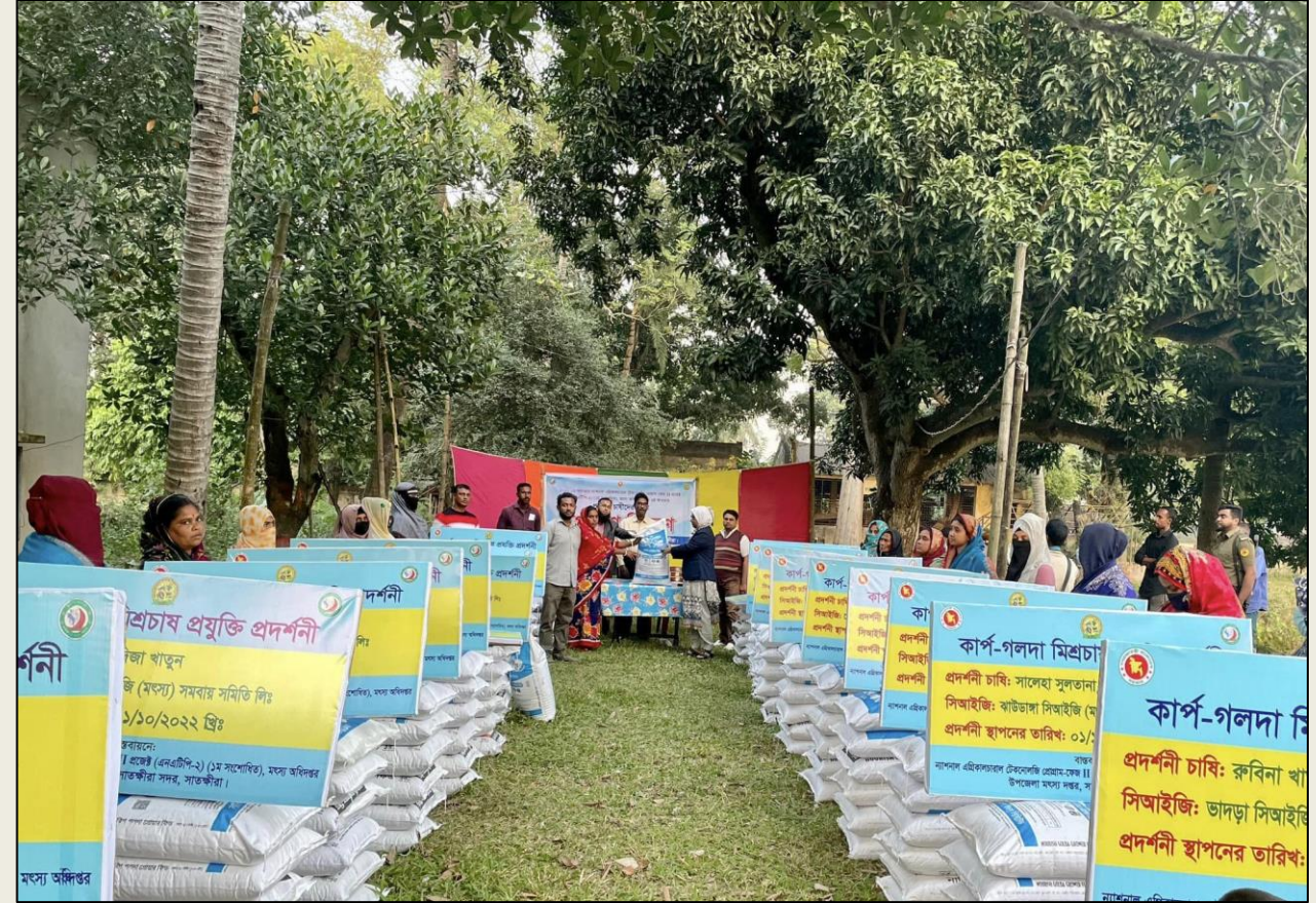
প্রদর্শনী বাস্তুবায়ন (মৎস্য খাদ্য ও প্রদর্শনী সাইনবোর্ড বিতরণ)