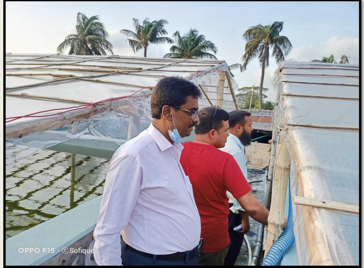
নগ্নী রেয়ারিং সেন্টার পরিদর্শন