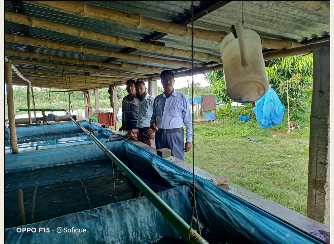
মৎস্য হ্যাচারি পরিদর্শন