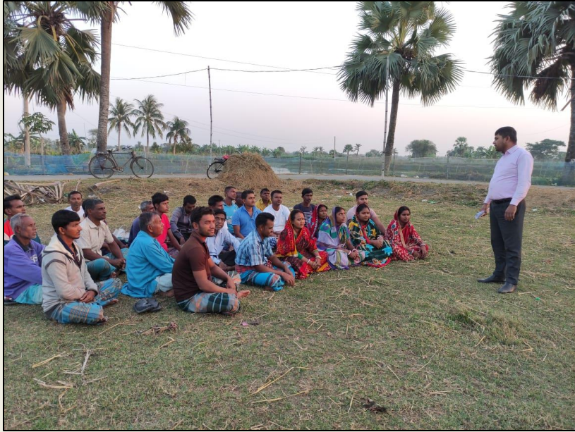
ক্লাস্টার চাষিদের সাথে মতবিনিময়