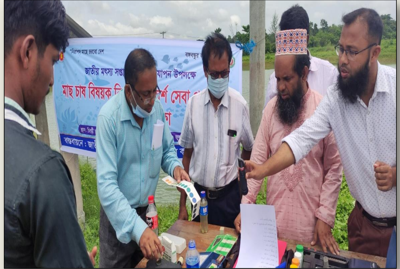
মাটি ও পানি পরীক্ষা