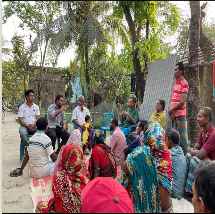
সিআইজি মাসিক সভা