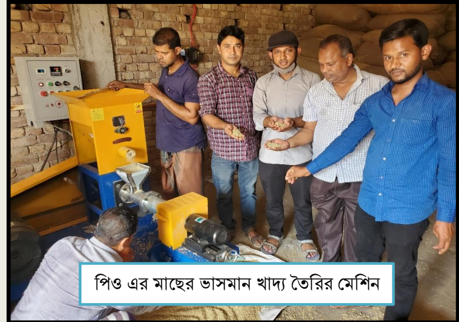
পিও এর মাছের ভাসমান খাদ্য তৈরির মেশিন