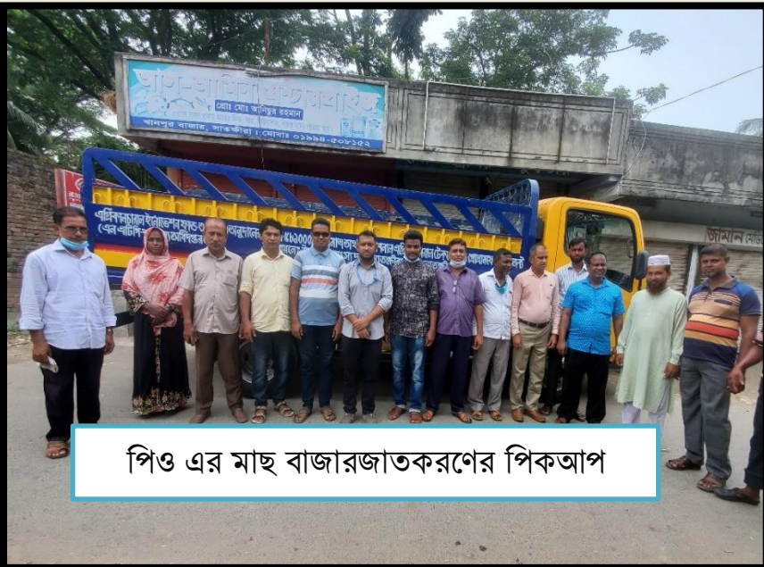
পিও এর মাছ বাজারজাতকরণের পিকআপ