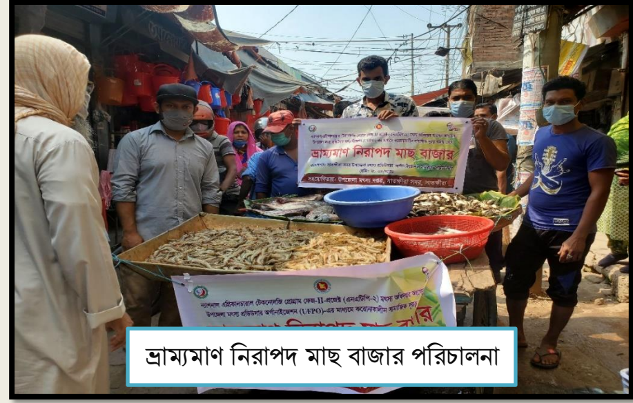
ভ্রাম্যমাণ নিরাপদ মাছ বাজার পরিচালনা