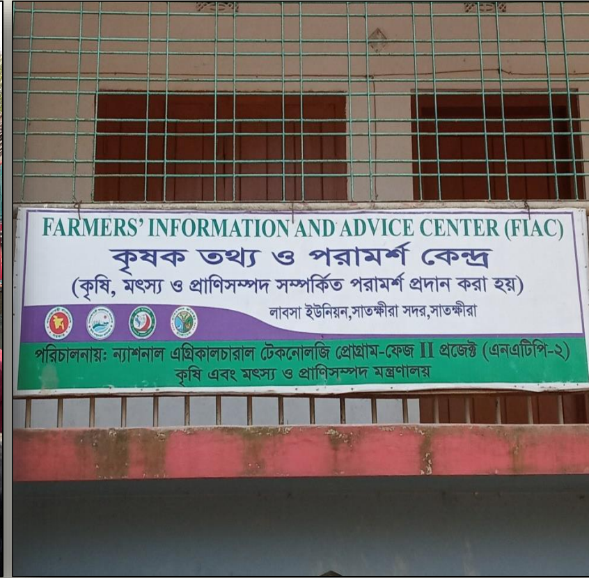
Farmers Information and Advice Center (FIAC)