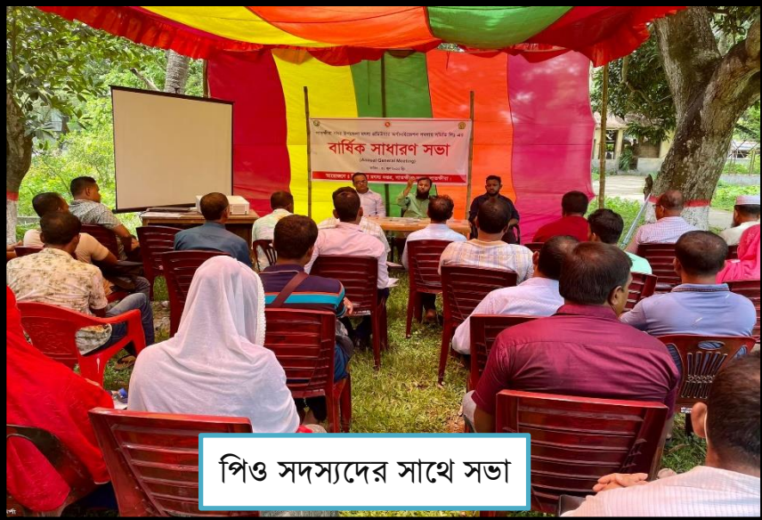
পিও সদস্যদের সাথে সভা