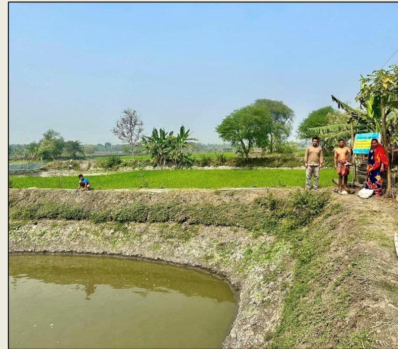
প্রদর্শনী বাস্তবায়ন (নমুনা য়ন ও পরামর্শ প্রদান)