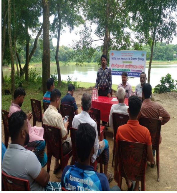
প্রান্তিক পহ@v†q মৎস্যচাষি ও মৎস্যজীবীদের সাথে মতবিনিময়

জাতীয় মৎস্য সপ্তাহ ২০২৩ উদযাপন উপলক্ষে প্রান্তিক পহ@vয়ে মৎস্যচাষি ও মৎস্যজীবীদের সাথে মতবিনিময় সভা: