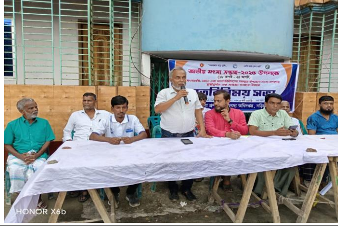
চিত্র: মতবিনিময় সভায় বক্তব্য রাখছেন উপজেলা মৎস্য কর্মকর্তা।

জাতীয় মৎস্য সপ্তাহ-২০২৫ উপলক্ষ্যে ২য় দিন সকাল ১০.০০ ঘটিকায় মৎস্যচাষি, জেলে এবং মৎস্যজীবীদের সমন্বয়ে উপজেলা মৎস্য সম্পদের স্থায়ী ত্বশীল এবং সার্বোত্তম ব্যবহার বিষয়ে মতবিনিময় সভা অনুষ্ঠিত হয়। কলারগাও জেলেপল্লী, ডিংগামানিক, নড়িয়া, শরীয়তপুর।