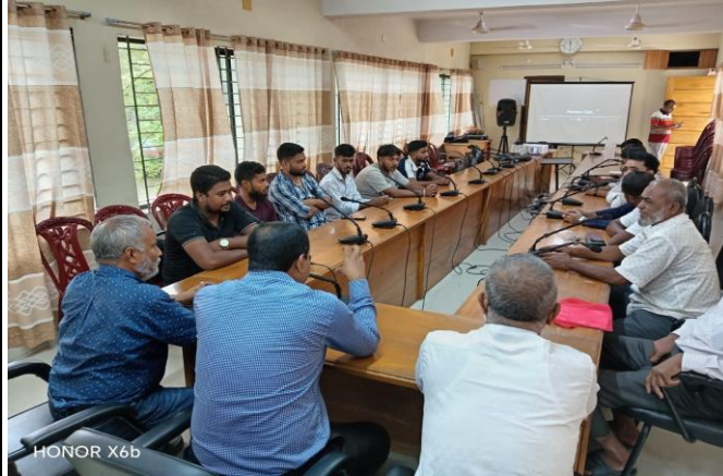
চিত্র: সামপনী অনুষ্ঠানে উপজেলার বিভিন্ন আড়ৎদারদের সাথে আলোচনা অনুষ্ঠিত হয়।

জাতীয় মৎস্য সপ্তাহ-২০২৫ উপলক্ষে ৭ম জাতীয় মৎস্য সপ্তাহের মূল্যায়ন ও সমাপনি অনুষ্ঠান এবং সাংস্কৃতিক অনুষ্ঠানের আয়োজন করা হয় উপজেলা পরিষদ হলরুম, নড়িয়া, শরীয়তপুর।