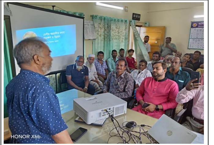
চিত্র: জাতীয় মৎস্য সপ্তাহ ২০২৫ উপলক্ষ্যে মতবিনিময় সভা চলছে।