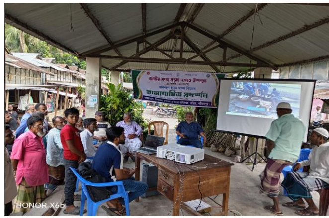
চিত্র: প্রামাণ্যচিত্র প্রদর্শনী ঘড়িষার, বাংলাবাজার।

জাতীয় মৎস্য সপ্তাহ-২০২৫ উপলক্ষ্যে ৩য় দিন জনবহুল স্থানে মৎস্য বিষয়ক প্রামাণ্যচিত্র প্রদর্শনীর আয়োজন করা হয় বাংলাবাজার, ঘড়িষার, নড়িয়া, শরীয়তপুর।