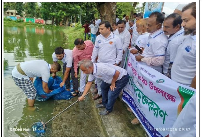
চিত্র: পোনা মাছ অবমুক্তকরণ করেন উপজেলা নির্বাহী অফিসার।