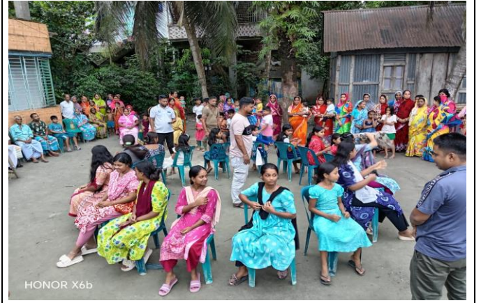
চিত্র: বালিশ খেলায় অংশগ্রহন করে প্রতিযোগিরা খুবই আনন্দিত।