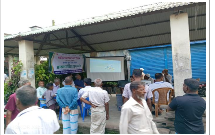
চিত্র: সাধারণ মানুষের সরব উপস্থিতিতে চলছে প্রামাণ্যচিত্র প্রদর্শনী।