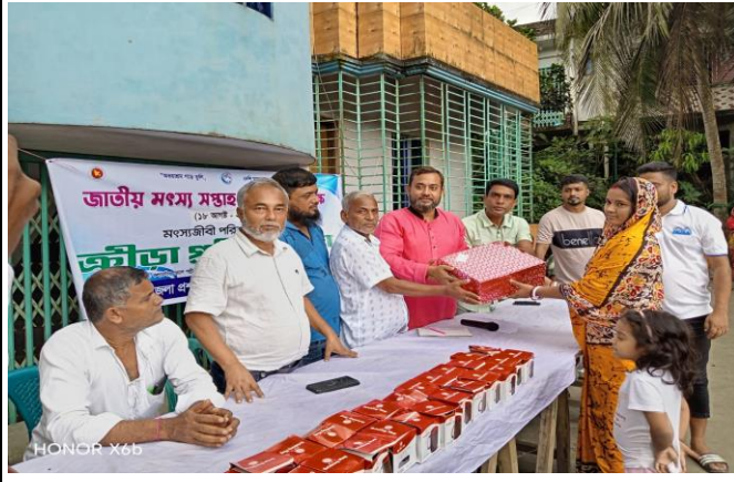
চিত্র: বালিশ খেলায় অংশগ্রহন করে বিজয়ীর হাতে পুরস্কার তুলে দিচ্ছেন স্থানীয় ইউপি মেম্বার।

জাতীয় মৎস্য সপ্তাহ-২০২৫ উপলক্ষ্যে ৪র্থ দিন মিংস্যাজীবি পরিবারের মধ্যে ক্রীড়া প্রতিযোগিতার আয়োজন করা হয় কলারগাও জেলে পল্লী ডিঙামানিক, নড়িয়া, শরীয়তপুর।