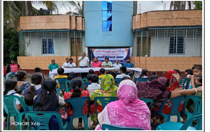
চিত্র: মতবিনিময় সভায় উপস্থিত ছিলেন স্থানীয় গন্যমান্য ব্যক্তিবর্গ ও সাধারণ জেলে পরিবারের সদস্য।