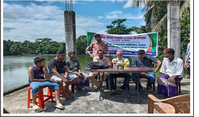
চিত্র: পানির গুণাগুণ পরীক্ষা শেষে চাষীদের দিকনির্দেশনা প্রদান।