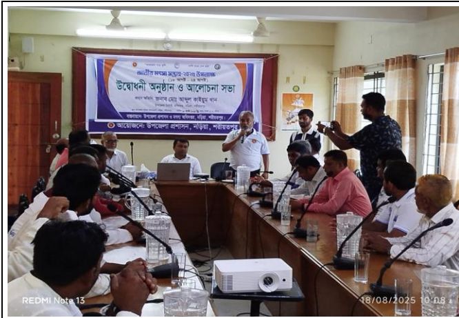
চিত্র: উদ্বোধনী অনুষ্ঠান ও আলোচনা সভা।