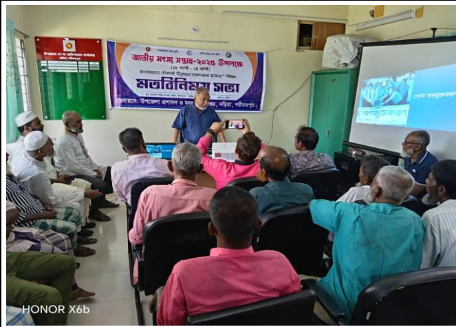
চিত্র: তরুনদের ভাবনায় বক্তব্য রাখছেন উপজেলা মৎস্য কর্মকর্তা।

জাতীয় মৎস্য সপ্তাহ-২০২৫ উপলক্ষ্যে ৫ম দিন মৎস্যখাতে টেকসই উন্নয়নে তরুনদের ভাবনা শীর্ষক মতবিনিময় সভার আয়োজন করা হয় উপজেলা পরিষদ হলরুমে, নড়িয়া, শরীয়তপুর।