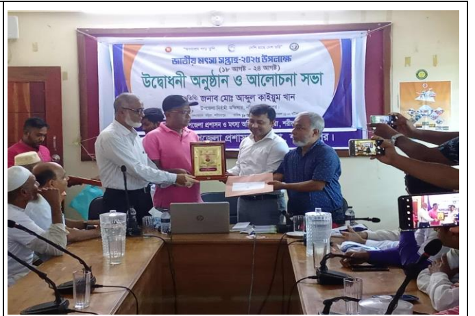
চিত্র: উপজেলা জেলার সেরা চাষিদের মাঝে পুরস্কার বিতরণ।