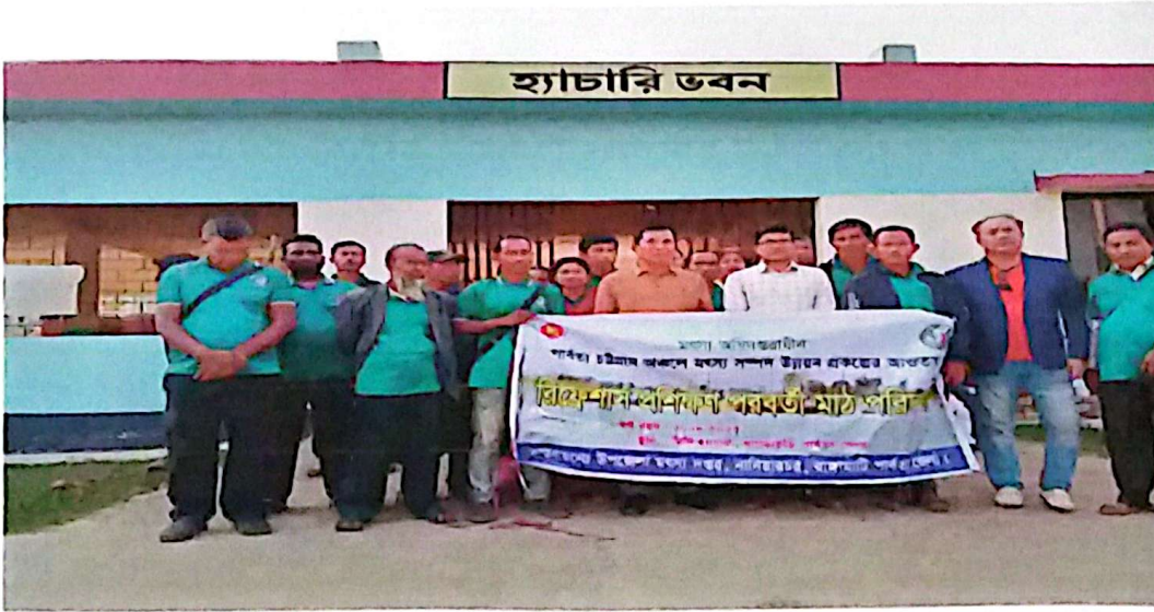
চিত্র: মাঠ পরিদর্শনের স্থিরচিত্র