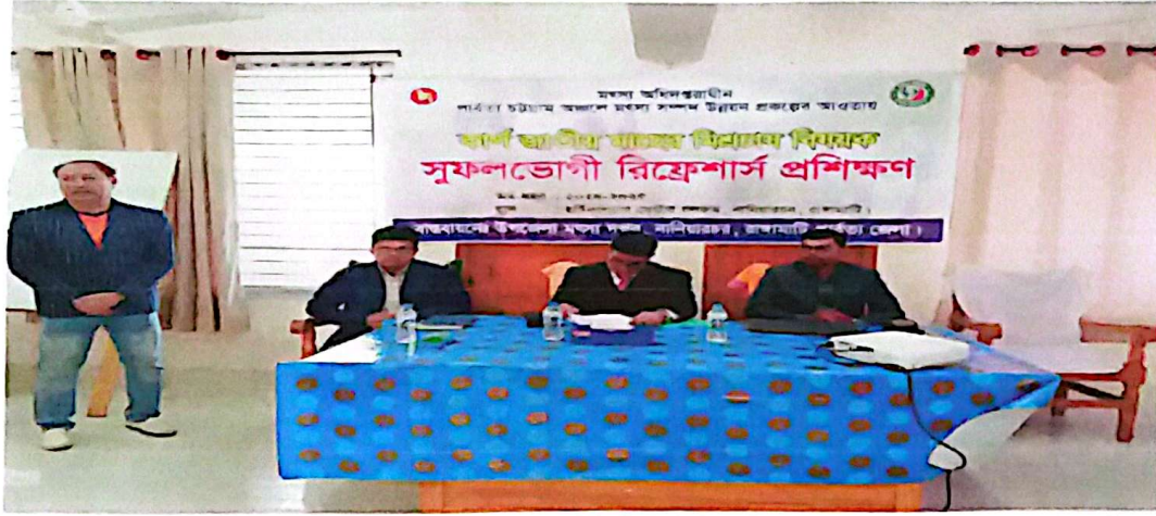
চিত্র: কার্যক্রমের স্থিরচিত্র