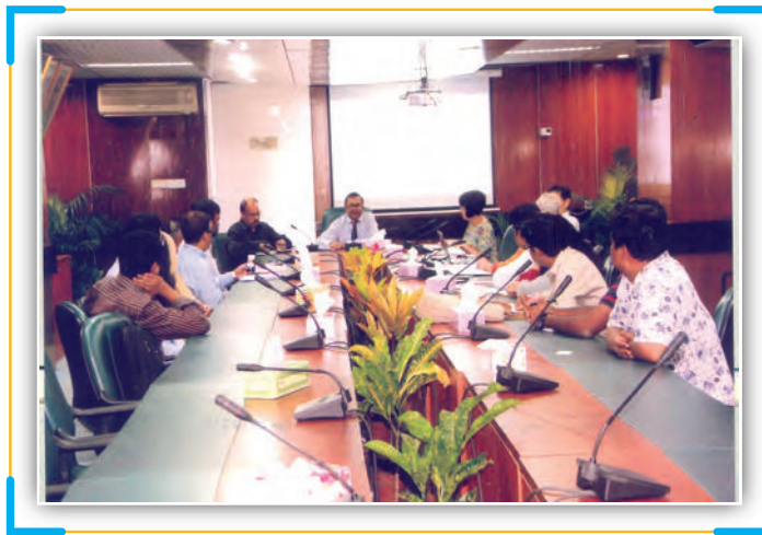
Vice Chairman of EPB Presiding over the Meeting With Japanese Trade Delegation at EPB

In export trade of Bangladesh petroleum by product is considered as a potential sector. Furnace Oil and Nafta is the main two sub items of this sector. During 2007-08 to 2014-16 export earnings from this sector were 185.11, 185.55, 301.15, 260.68, 275.44, 313.95, 162.34, 77.55, 297.01 and 243.77 million dollar respectively and at the same time the rate of export growth of petroleum by product was 120.63%, (-)23.27%, 62.30%, (-)13.44%, 5.66%, (-)23.27%, (-)48.29%, 52.23%, 282.99% and (-)17.92% respectively. The leading five markets of petroleum by product are Korea Republic, Singapore, India, Taiwan, Philippines and Sri Lanka.