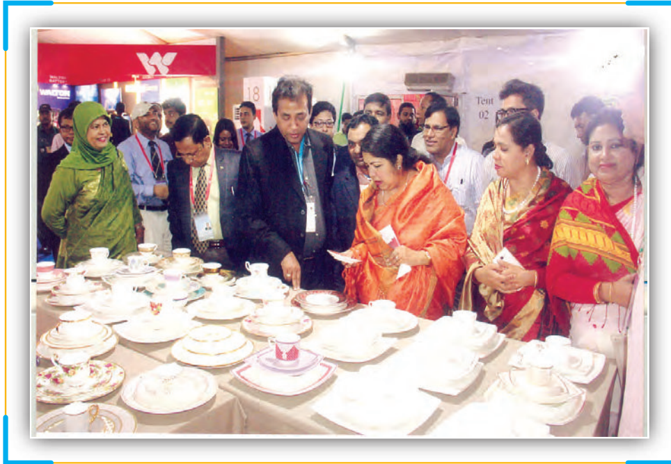
Hon'ble Speaker of Bangladesh Parliament Visiting Inter Parliamentary Union Fair in Dhaka

On the other hand, the commodities which registered decrease in export earnings are: Frozen and Live Fish 1.74%, Shrimp 0.56%, Crafts 21.14%, Tobacco 15.21%, Fruits 86.70%, Petroleum by Products 17.93%, Cosmetics 47.79%, Leather 16.30%, Agricultural Products 7.20%, Special Textile 2.37%, Vegetables 22.34%, Bicycle 16.83%, Woven Garments 2.35%, Terry Towels 7.32%, Raw Jute 3.08%, Carpets 2.45% and Wood and Wood Products 2.53%.