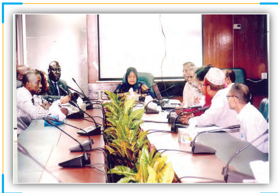
Meeting With Syrian Trade Delegation at EPB