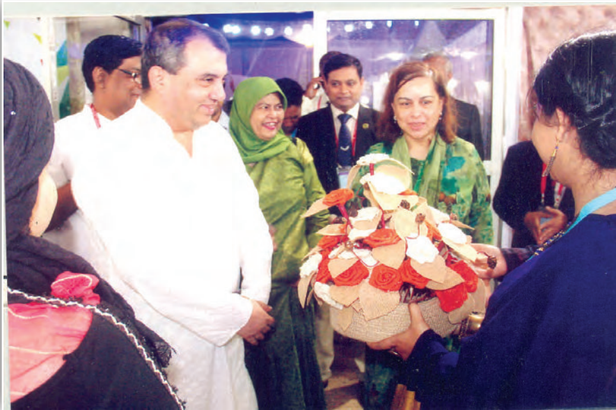
Hon'ble Chairman (Inter Parliamentary Union) Visiting The IPU Fair in Dhaka

15. As per demand of Bangladesh Bank opinion on Annual Report on Exchange Arrangement and Exchange Restrictions (AREAER) was sent to the Bangladesh Bank for taking necessary action at their end.