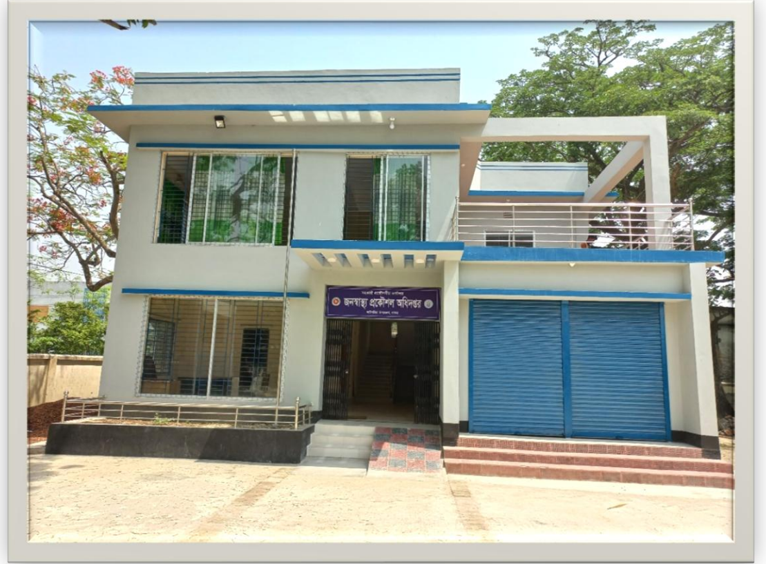
পাবনা সদর উপজেলায় নির্মিত উপজেলা অফিস ভবন