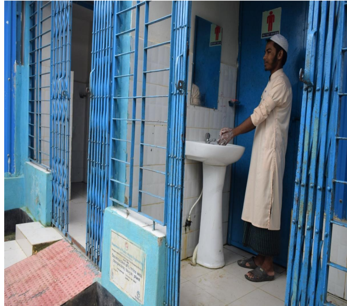
রোহিঙ্গা ক্যাম্পে নির্মিত কমিউনিটি ল্যাট্রিন