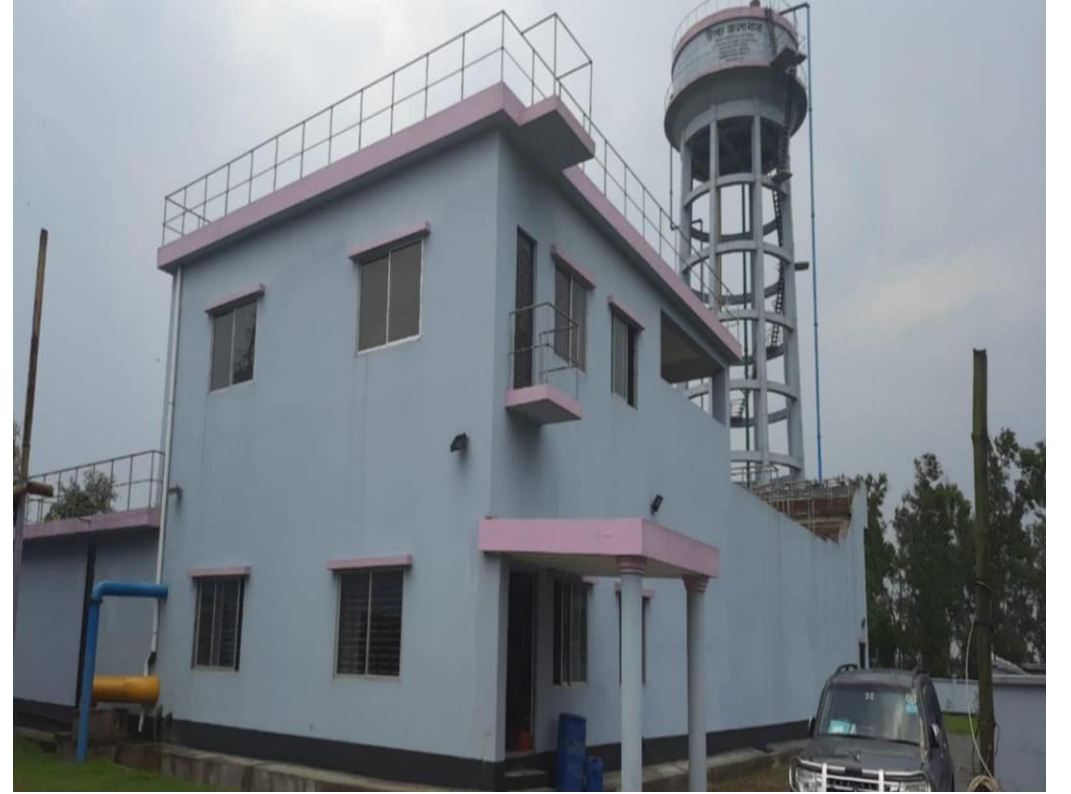
শায়েস্তাগঞ্জ পৌরসভায় নির্মিত গ্রাউন্ড ওয়াটার ট্রিটমেন্ট প্লান্ট