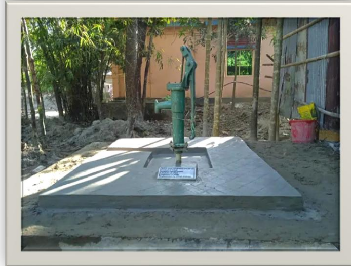
নাটোর জেলার সদর উপজেলার ৬নং পাম্পযুক্ত নলকূপ