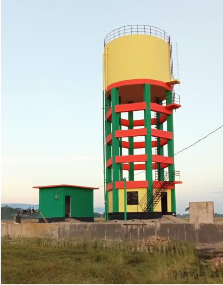
সুনামগঞ্জ জেলার বিশ্বম্ভরপুর উপজেলার রুরাল পাইপড ওয়াটার সাপ্লাই স্কিম