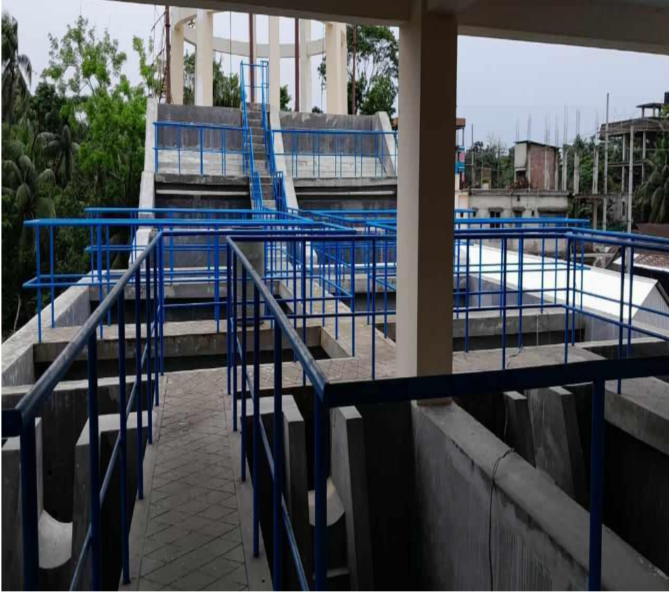
বসুরহাট পৌরসভায় নির্মিত গ্রাউন্ড ওয়াটার ট্রিটমেন্ট প্লান্ট