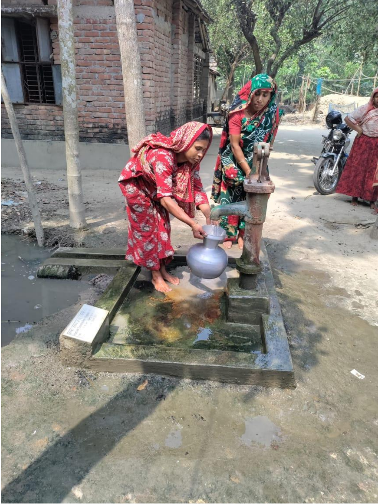
মনিরামপুর পৌরসভায় নির্মিত ওয়াটার পয়েন্ট