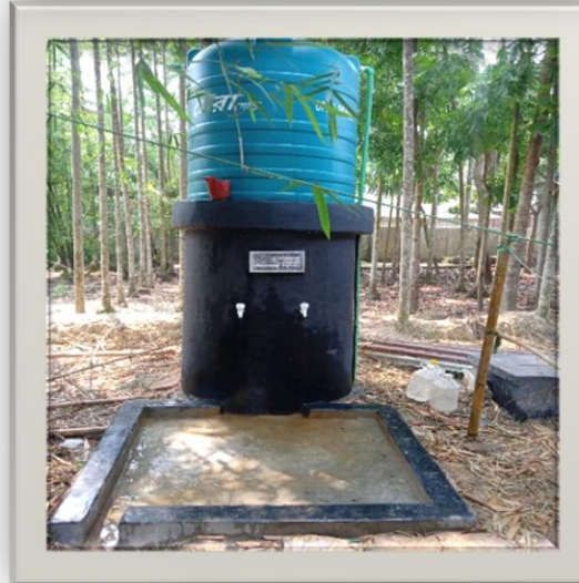
রংপুর জেলার তারাগঞ্জ উপজেলার সাবমার্সিবল পাম্প যুক্ত নলকূপ