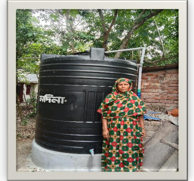
সাতক্ষীরা জেলার কালীগঞ্জ উপজেলার রেইন ওয়াটার হারভেস্টিং ইউনিট