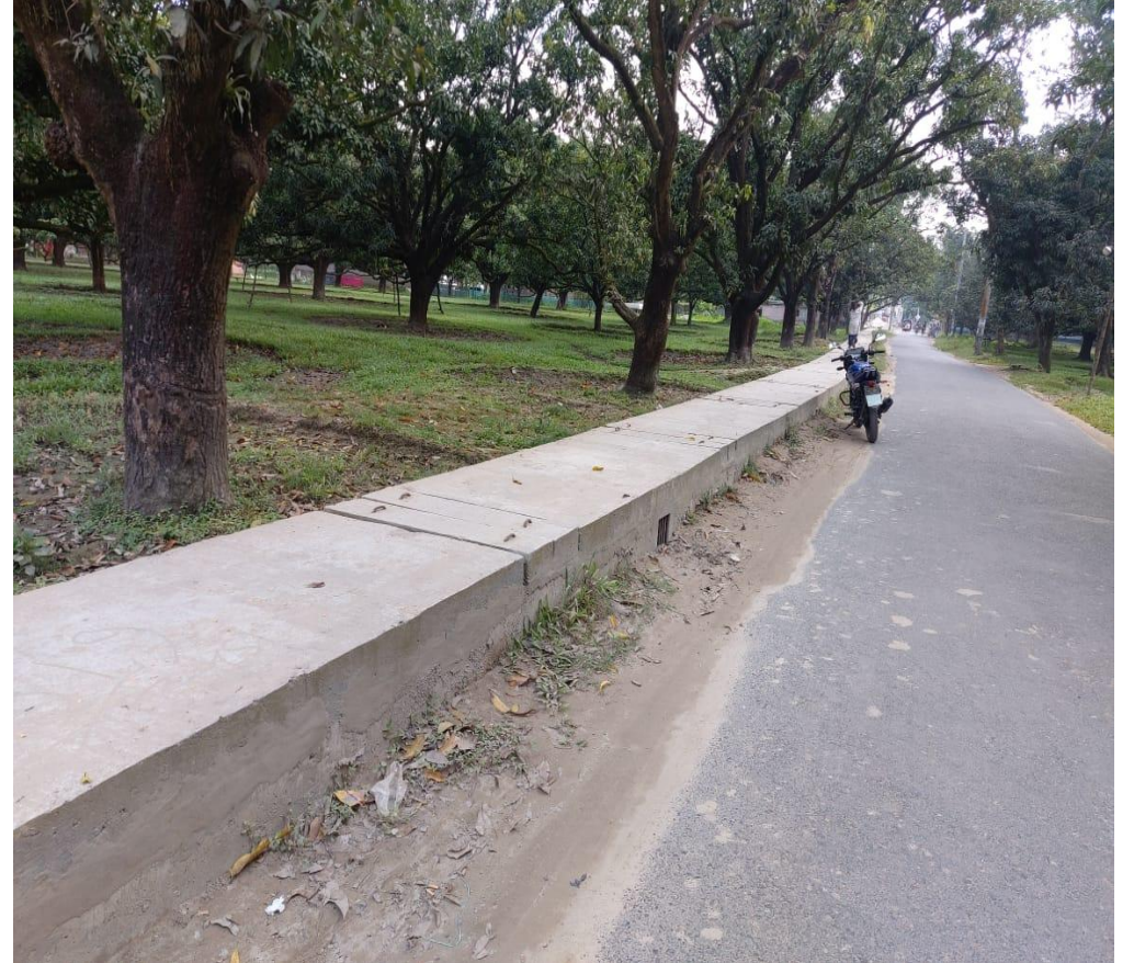
শিবগঞ্জ পৌরসভায় প্রাইমারী ড্রেন নির্মাণ কাজ