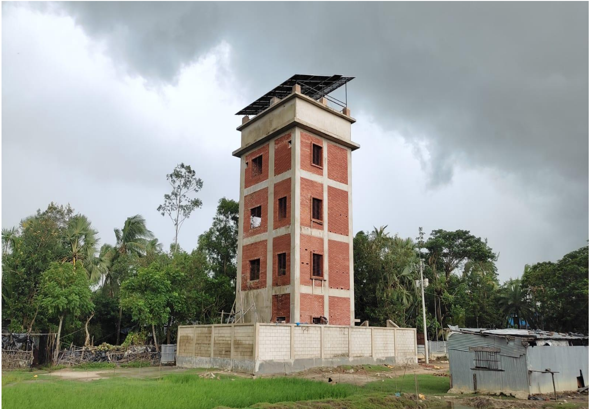
সৌর বিদ্যুৎ চালিত পাইপড ওয়াটার সাপ্লাই স্কীম ভবন