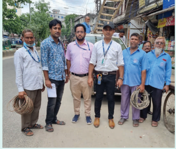
এনওসিএস স্বামীবাগ, ডিপিডিসি আওতাধীন দয়গঞ্জ ও মুরগিটোলা এলাকায় অবৈধ বিদ্যুৎ সংযোগ উচ্ছেদ অভিযান পরিচালনা করা হয়। অভিযানকালে বিপুলসংখ্যক তার জব্দ করা হয়