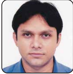
ড. আসিফ ইকবাল উপসচিব, অর্থ বিভাগ, অর্থ মন্ত্রণালয়