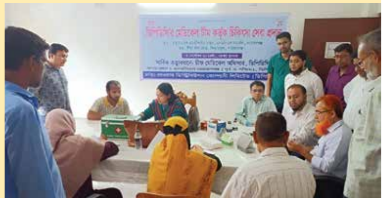
ডিপিডিসি মেডিকেল টিম কর্তৃক চিকিৎসা সেবা প্রদান