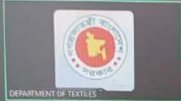
DEPARTMENT OF TEXTILES