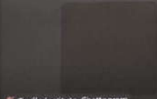
Textile Institute, Chattogram