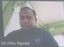
DD Office, Rajshahi