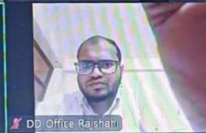
DD Office Rajshahi