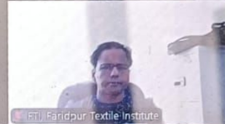
FTI, Faridpur Textile Institute