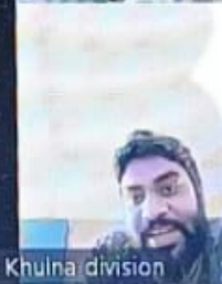
Parvina Khulna division