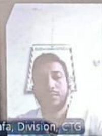
Nurussafa, Division, CTG