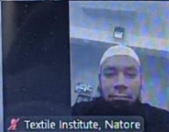
Textile Institute, Natore