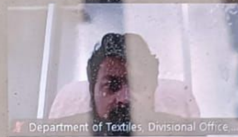
Department of Textiles, Divisional Office, ...