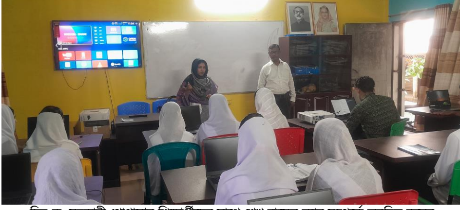
চিত্র-ক: সহকারী প্রোগ্রামার শিক্ষার্থীদের সাথে শেখ রাসেল ল্যাব সম্পর্কে অবহিত করেন