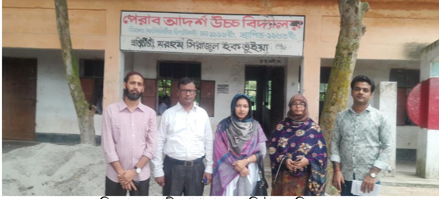
চিত্র-খ: সহকারী প্রোগ্রামার ও প্রতিষ্ঠানের শিক্ষকবৃন্দ