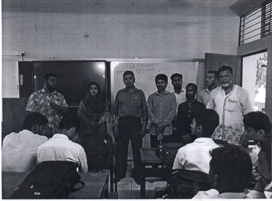
চিত্র-ক: সহকারী প্রোগ্রামার স্কুল অফ ফিউচারের কার্যক্রম পরিদর্শন করেন এবং শিক্ষক ও শিক্ষার্থীদের সাথে কথা বলেন