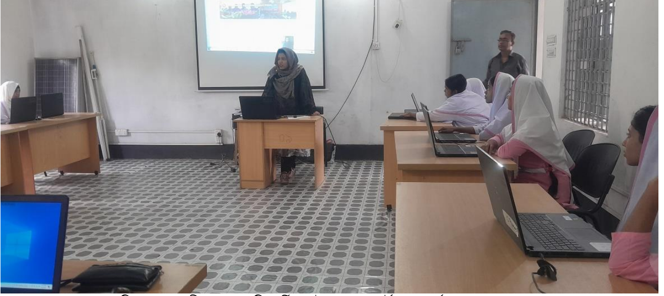
চিত্র-ক: সহকারী প্রোগ্রামার শিক্ষার্থীদের উপজেলার পোর্টাল সম্পর্কে ধারণা প্রদান করেন