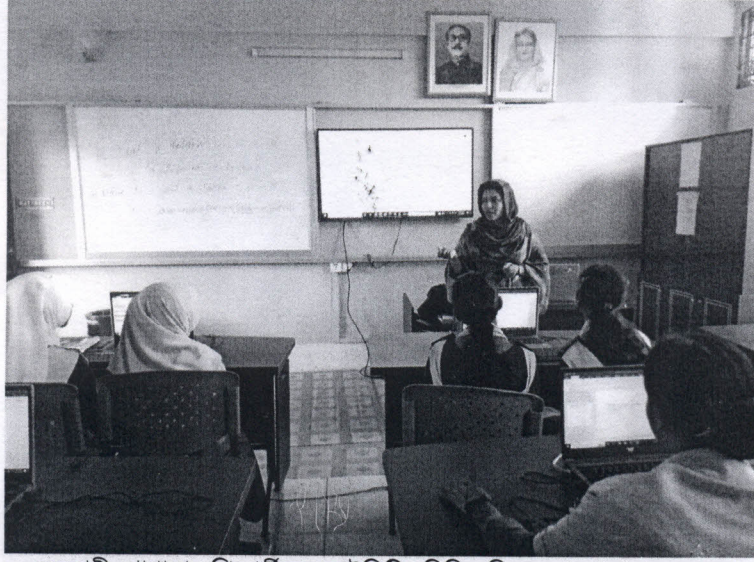
সহকারী প্রোগ্রামার শিক্ষার্থীদের আইসিটির বিভিন্ন বিষয়ে ধারণা প্রদান করেন