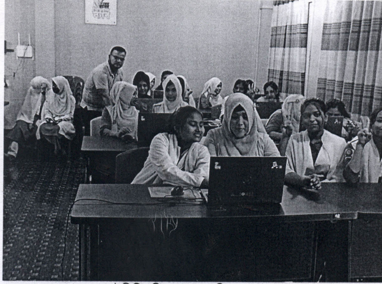
আইসিটির শিক্ষক ক্লাস পরিচালনা করেন