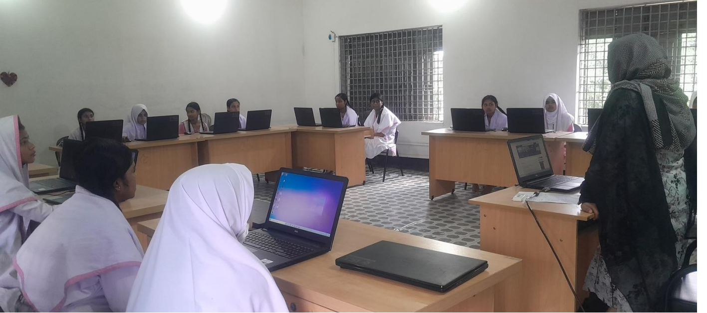
চিত্র-খ: সোনারগাঁ পাইলট বালিকা উচ্চ বিদ্যালয়ের ৮ম শ্রেণীর শিক্ষার্থীদের সাথে সহকারী প্রোগ্রামার তথ্য প্রযুক্তির বিভিন্ন বিষয়ে আলোচনা করেন