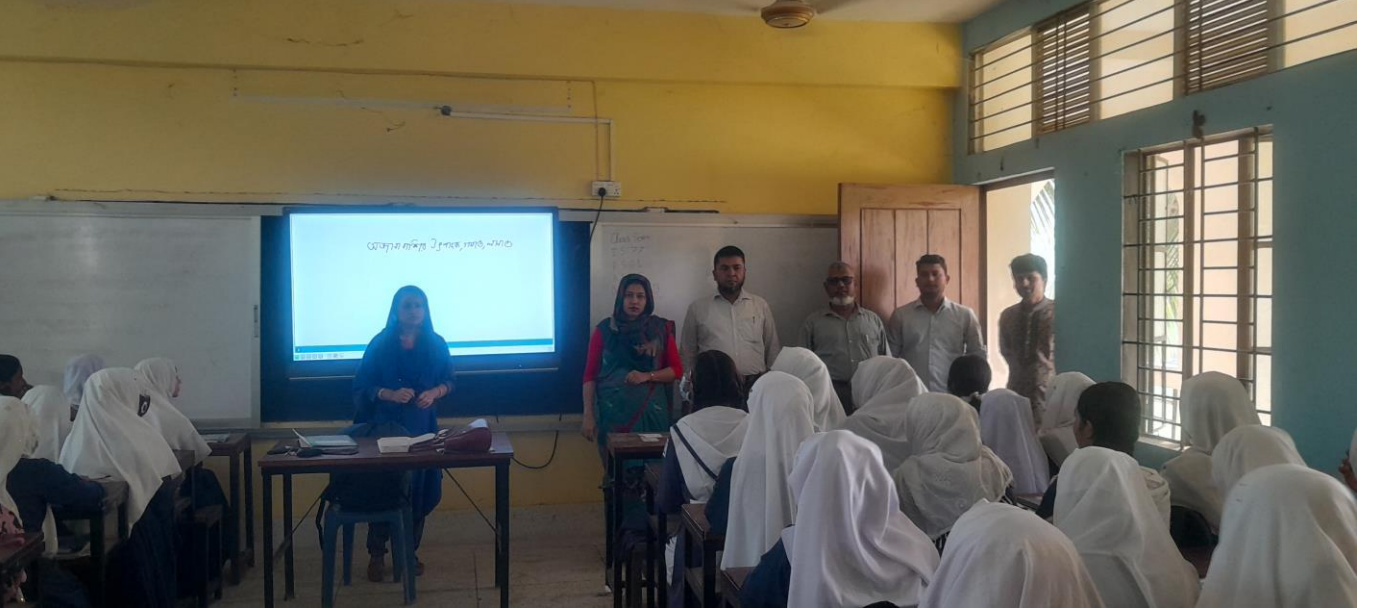
চিত্র-ক : স্মার্ট বোর্ড ব্যবহার করে শ্রেণী কক্ষে পাঠ দান পরিদর্শন করেন সহকারী প্রোগ্রামার