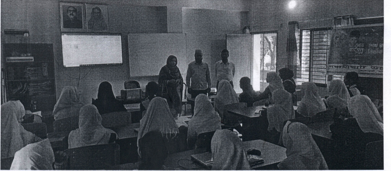
চিত্র-খ: আইসিটি শিক্ষক ক্লাস পরিচালনা করেন