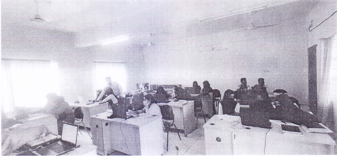
চিত্র-খ: আইসিটি শিক্ষক ক্লাস পরিচালনা করেন