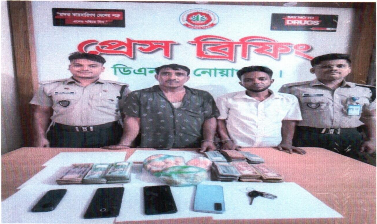
২৫ সেপ্টেম্বর ২০২৫ তারিখ জেলা কার্যালয়, নোয়াখালী কর্তৃক অভিযান পরিচালনা করে ১১,০০০ ইয়াবাসহ ২ জন আসামী গ্রেফতার