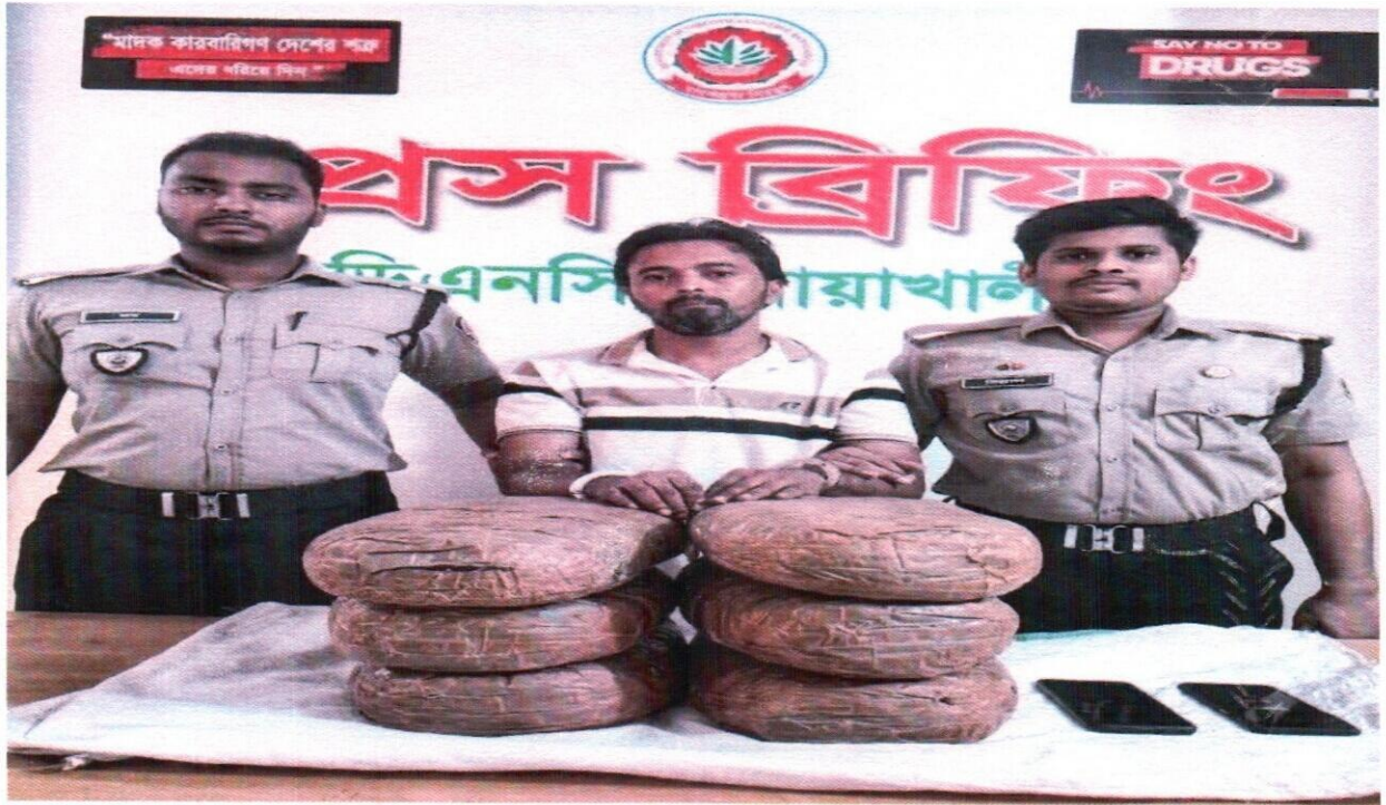
১৭ সেপ্টেম্বর ২০২৫ তারিখ জেলা কার্যালয়, নোয়াখালী কর্তৃক অভিযান পরিচালনা করে ১২ কেজি গাঁজাসহ ১ জন আসামী গ্রেফতার