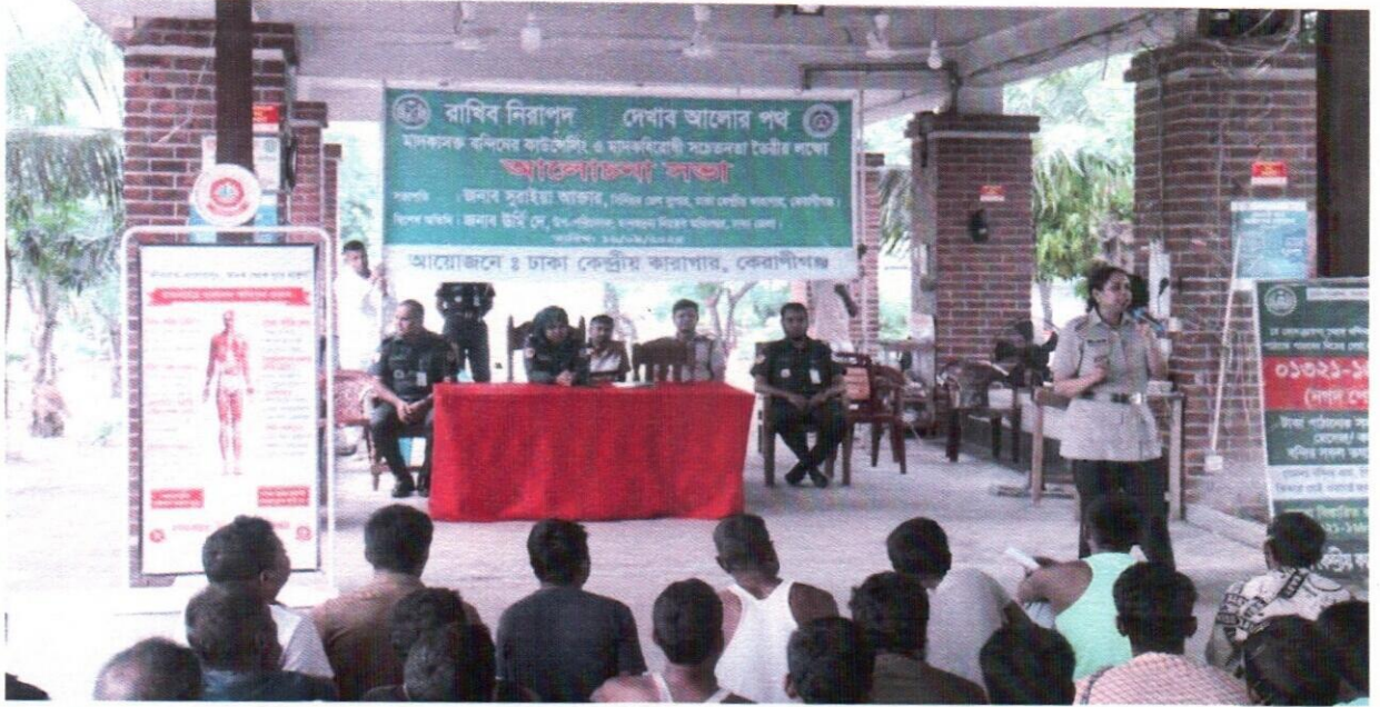
১৬ সেপ্টেম্বর ২০২৫ তারিখ জেলা কার্যালয় ঢাকা কর্তৃক মাদকাসক্ত বন্দিদের কাউন্সেলিং ও মাদকবিরোধী সচেতনতা তৈরীর লক্ষ্যে ঢাকা কেন্দ্রীয় কারাগার করোনীগঞ্জ আলোচনা সভা অনুষ্ঠিত হয়