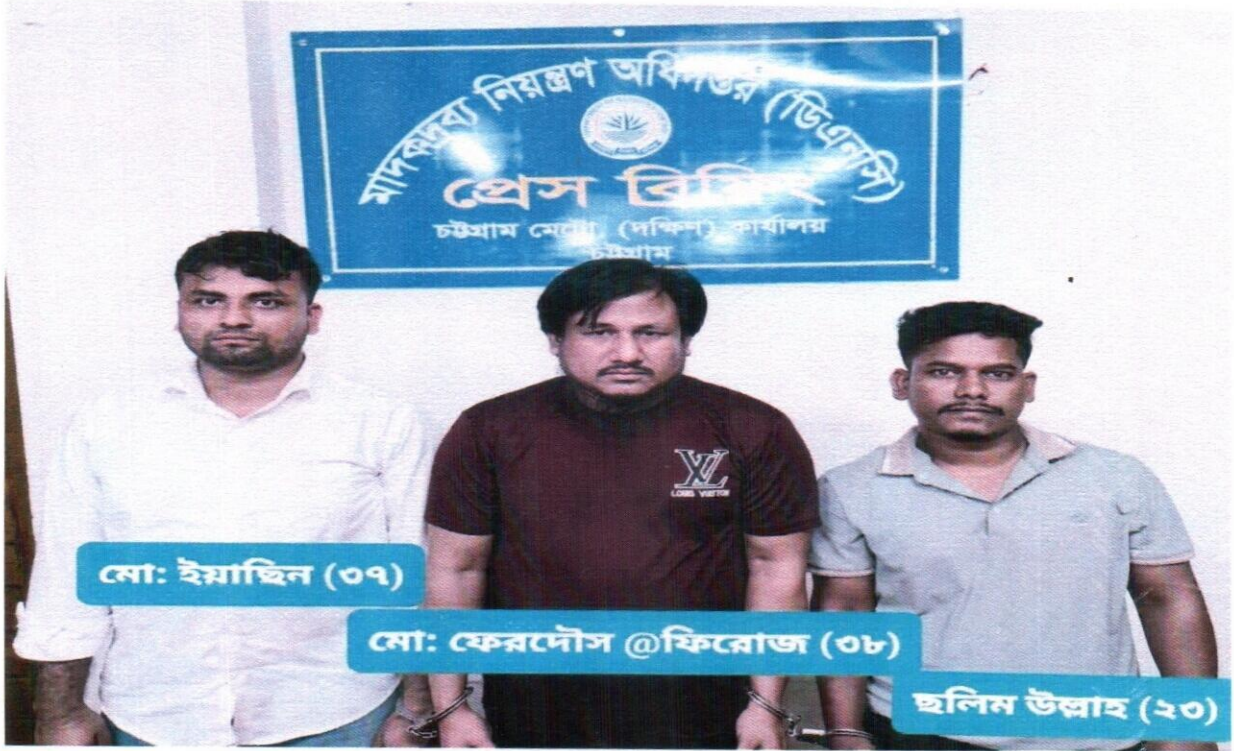
২৭ সেপ্টেম্বর ২০২৫ তারিখ চট্টগ্রাম মেট্রো কার্যালয় (দক্ষিণ) কর্তৃক অভিযান পরিচালনা করে ৪৫,০০০ হাজার পিস ইয়াবাসহ ৩ জন আসামী গ্রেফতার