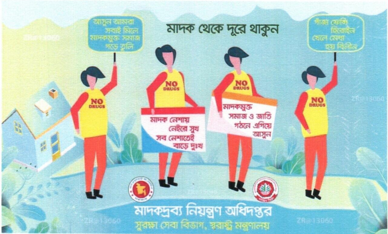
সূত্র: জনসংযোগ শাখা, ডিএনসি