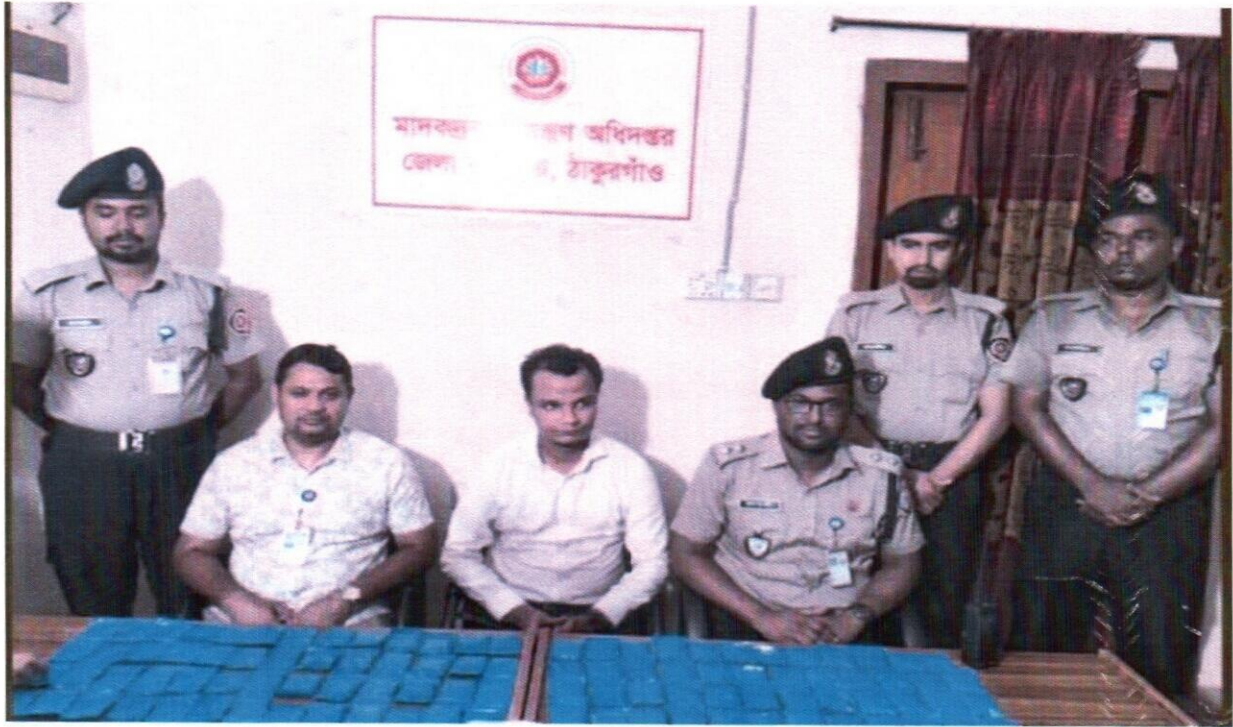
২৩ সেপ্টেম্বর ২০২৫ তারিখ জেলা কার্যালয়, ঠাকুরগাঁও কর্তৃক অভিযান পরিচালনা করে ২০ হাজার পিস ইয়াবাসহ ১ জন আসামী গ্রেফতার