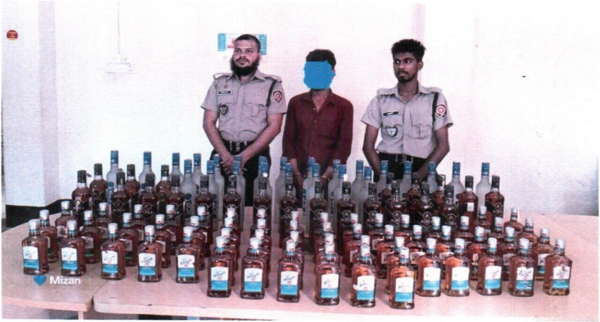
২৫ সেপ্টেম্বর ২০২৫ তারিখ জেলা কার্যালয়, নেত্রকোনা কর্তৃক অভিযান পরিচালনা করে Ice Vodka ২৪টি, Ac black ২২টি এবং McDowell's No-1 Luxury WHISKY ৫৬ টি নামীয় বোতল বিলাতি মদসহ ১ জন আসামী গ্রেফতার