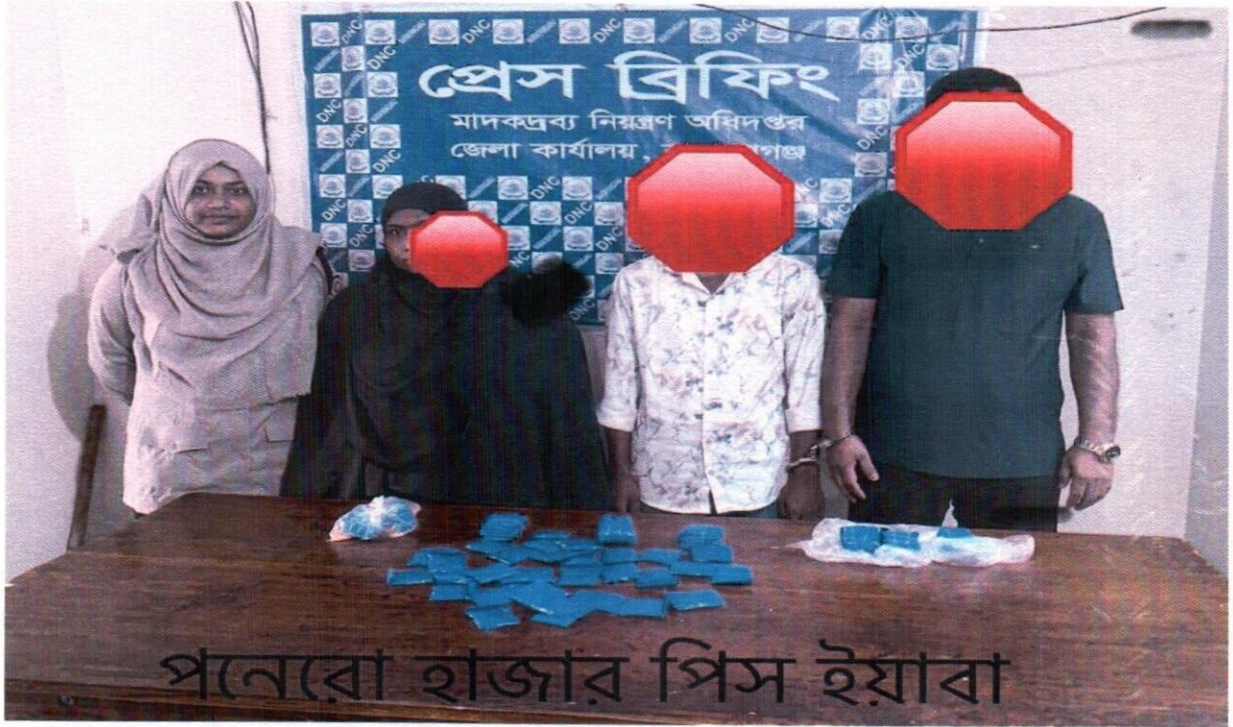
১৪ সেপ্টেম্বর ২০২৫ তারিখ জেলা কার্যালয়, নারায়ণগঞ্জ কর্তৃক অভিযান পরিচালনা করে ১৫ হাজার ইয়াবাসহ ৩ জন আসামী গ্রেফতার