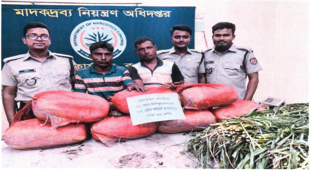
২৬ সেপ্টেম্বর ২০২৫ তারিখ জেলা কার্যালয় বগুড়া কর্তৃক অভিযান পরিচালনা করে ৩৫ কেজি গাঁজাসহ ২ জন আসামী গ্রেফতার