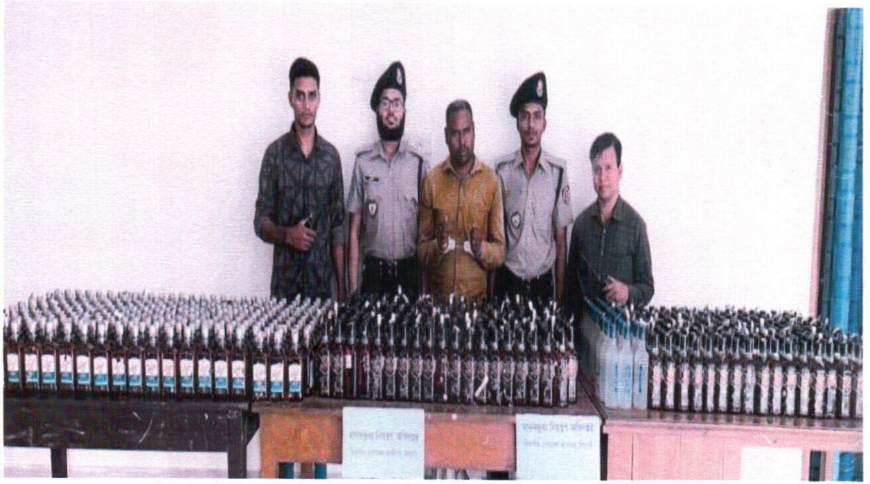
১৯ সেপ্টেম্বর ২০২৫ তারিখ বিভাগীয় গোয়েন্দা কার্যালয়, সিলেট কর্তৃক অভিযান পরিচালনা করে Ac Black নামীয় বিদেশি মদ ৪১০ বোতল, Mc Dowells নামীয় বিদেশি মদ ২৭২ বোতল, Ice Vodka নামীয় বিদেশি মদ ৩০ বোতল এবং officer's choice নামীয় বিদেশি মদ ৮৮ বোতল সর্বমোট ৮০০ বোতল বিদেশি মদ সহ মোট আসামী ০২ জন তার মধ্যে ০১ জন গ্রেফতার এবং (০১ জন পলাতক)