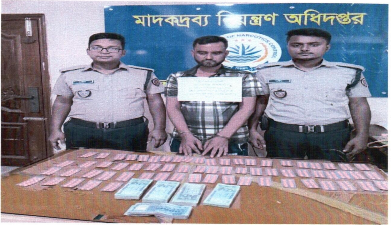
১৫ সেপ্টেম্বর ২০২৫ তারিখ জেলা কার্যালয়, বগুড়া কর্তৃক অভিযান পরিচালনা করে ৬৬০ পিস Tapal নামীয় ট্যাপেন্টাডল ট্যাবলেটসহ ১ জন আসামী গ্রেফতার