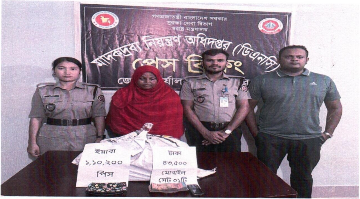
১১ সেপ্টেম্বর ২০২৫ তারিখ জেলা কার্যালয়, বান্দরবন কর্তৃক অভিযান পরিচালনা করে ১,১০,২০০ হাজার ইয়াবাসহ ১ জন আসামী গ্রেফতার