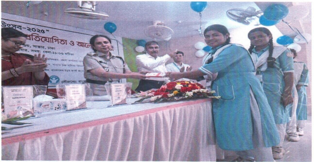
১৭ সেপ্টেম্বর ২০২৫ তারিখ জেলা কার্যালয় ঢাকা কর্তৃক সাভার উচ্চ বালিকা বিদ্যালয়, সাভার, ঢাকা আয়োজিত মাদকবিরোধী সচেতনতামূলক কুইজ প্রতিযোগিতা ও আলোচনা সভা অনুষ্ঠিত হয়