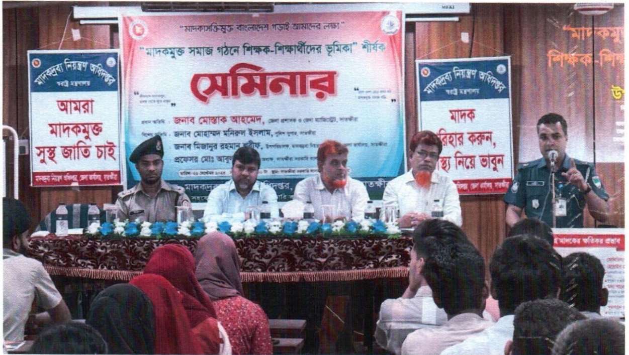
২৩ সেপ্টেম্বর ২০২৫ তারিখ জেলা কার্যালয়, সাতক্ষীরা কর্তৃক “মাদকমুক্ত সমাজ গঠনে শিক্ষক-শিক্ষার্থীদের ভূমিকা” শীর্ষক সেমিনার অনুষ্ঠিত হয়