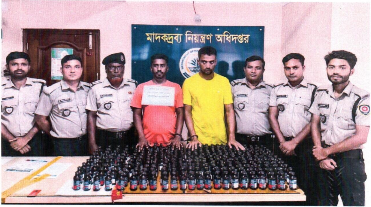
২০ সেপ্টেম্বর ২০২৫ তারিখ জেলা কার্যালয়, বগুড়া কর্তৃক অভিযান পরিচালনা করে ২৬২ বোতল ফেন্সিডিলসহ ২ জন আসামী গ্রেফতার