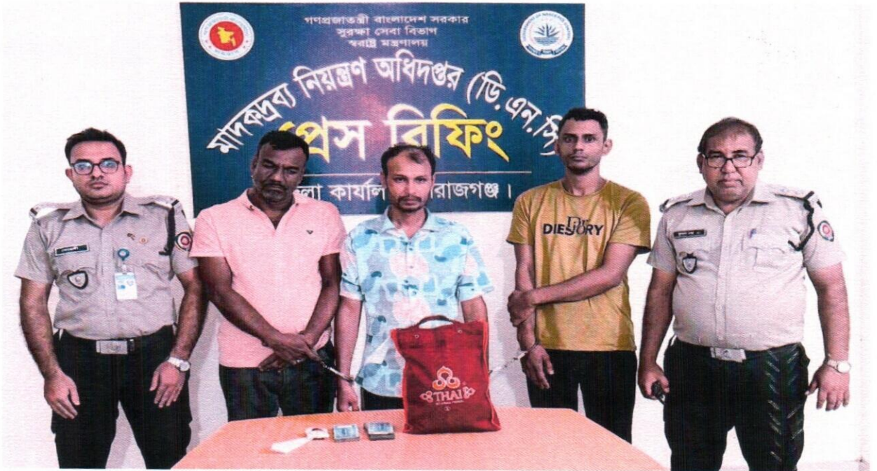
১৭ সেপ্টেম্বর ২০২৫ তারিখ জেলা কার্যালয়, সিরাজগঞ্জ কর্তৃক অভিযান পরিচালনা করে ২০ হাজার ইয়াবাসহ ৩ জন আসামী গ্রেফতার