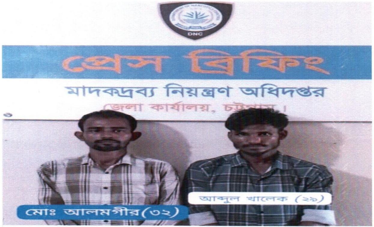
২৬ সেপ্টেম্বর ২০২৫ তারিখ জেলা কার্যালয় চট্টগ্রাম "খ" সার্কেল কর্তৃক অভিযান পরিচালনা করে ৬,৮৭০ পিস ইয়াবাসহ ২ জন আসামী গ্রেফতার