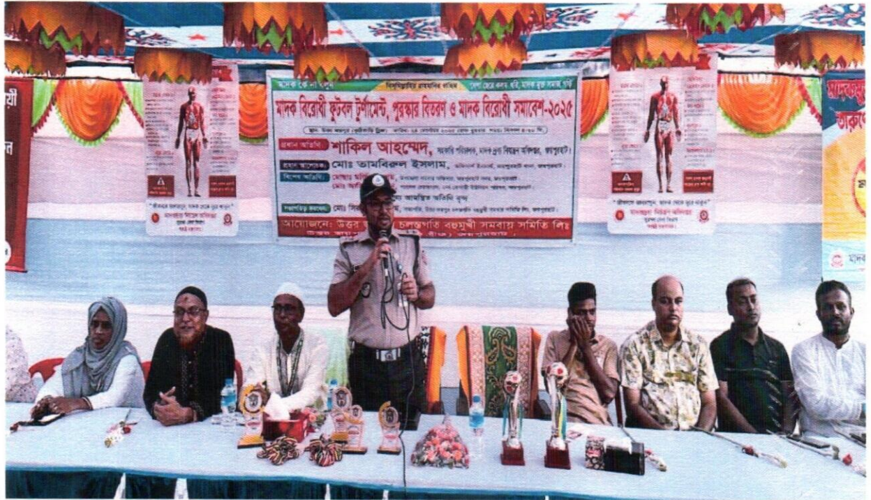
১৫ সেপ্টেম্বর ২০২৫ তারিখ জেলা কার্যালয় জয়পুরহাট কর্তৃক মাদকবিরোধী ফুটবল টুর্নামেন্ট, পুরস্কার বিতরণ ও মাদকবিরোধী সমাবেশ-২০২৫ অনুষ্ঠিত হয়

Jannat (signature) (signature) (signature) (signature)