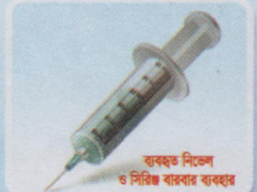
ব্যবহৃত নিভেল ও সিরিঞ্জ ব্যবহার

রোগটি হলে গবাদি পশুর কি কি সমস্যা হতে পারে?