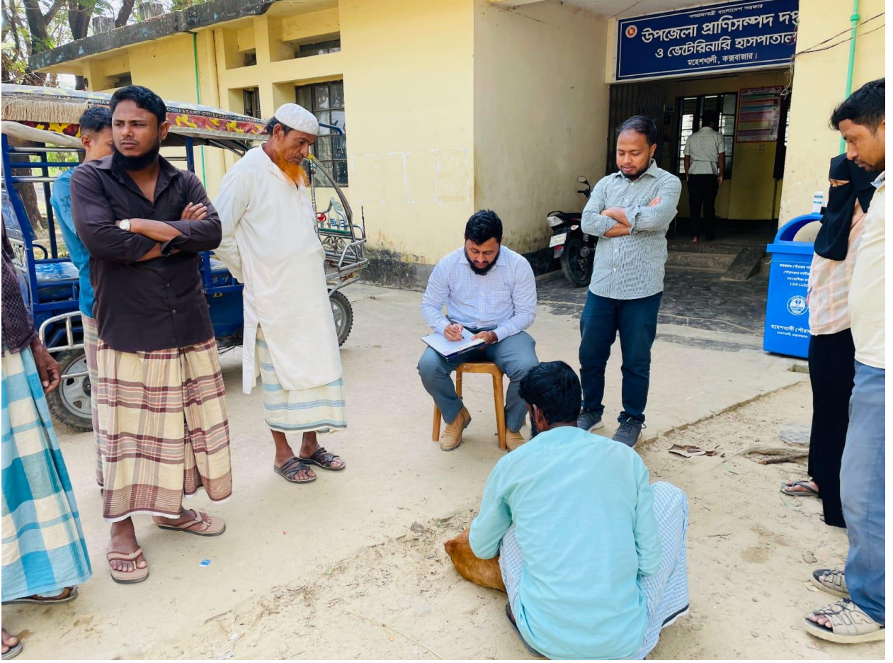
চিত্রঃ উপজেলা প্রাণিসম্পদ অফিস ও ভেটেরিনারি হাসপাতাল, মহেশখালী, কক্সবাজার