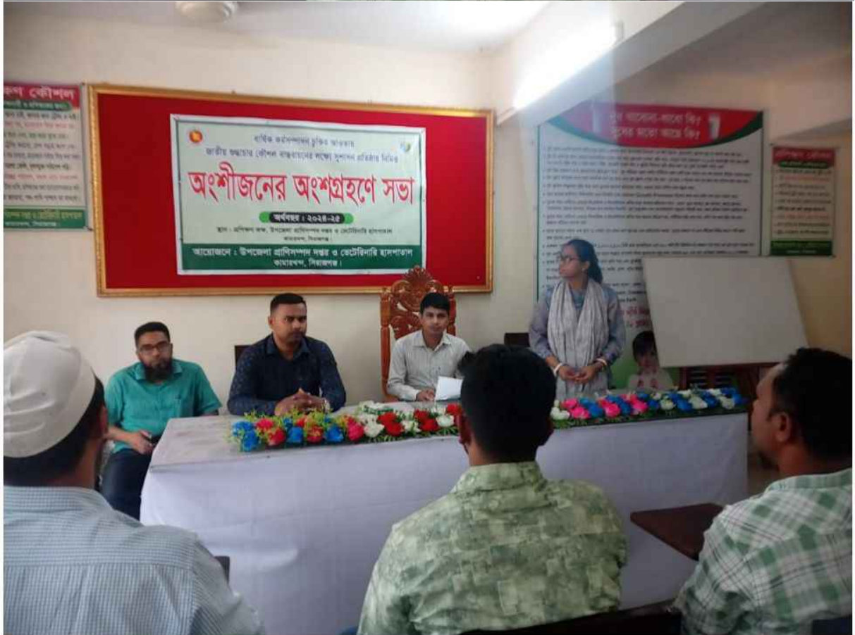
৩য় ত্রৈমাসিক এ শুদ্ধাচার কৌশল বাস্তবায়নে অংশীজনের অংশগ্রহণে সভা