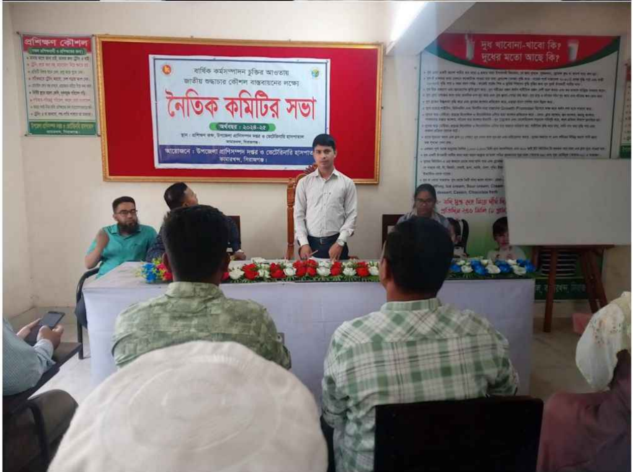
৩য় ত্রৈমাসিক এ শুদ্ধাচার কৌশল বাস্তবায়নে নৈতিকতা কমিটির সভা