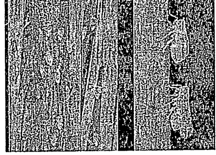
পূর্ণাঙ্গ বাদামী গাছ ফড়িং