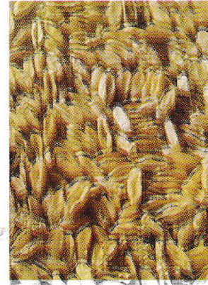
চিত্র-২: ব্লাস্ট রোগে আক্রান্ত কুঁচকানো দানা

বিস্তারিত তথ্যের জন্য নিকটস্থ কৃষি সম্প্রসারণ অফিস/বাংলাদেশ গম ও ভুট্টা গবেষণা ইনস্টিটিউট/বাংলাদেশ কৃষি উন্নয়ন কর্পোরেশন/সিমিট কার্যালয়/ডিলার পয়েন্টে যোগাযোগ করুন।