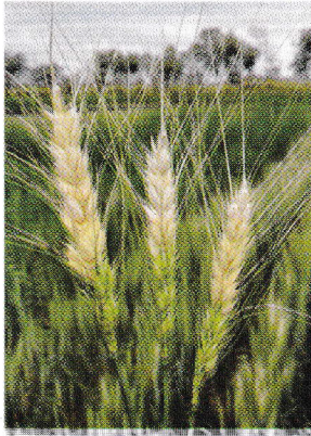
চিত্র-১: (বাম) ব্লাস্ট রোগে আক্রান্ত শীষ এবং (ডান) আক্রান্ত স্থানে কালচে ধূসর দাগ