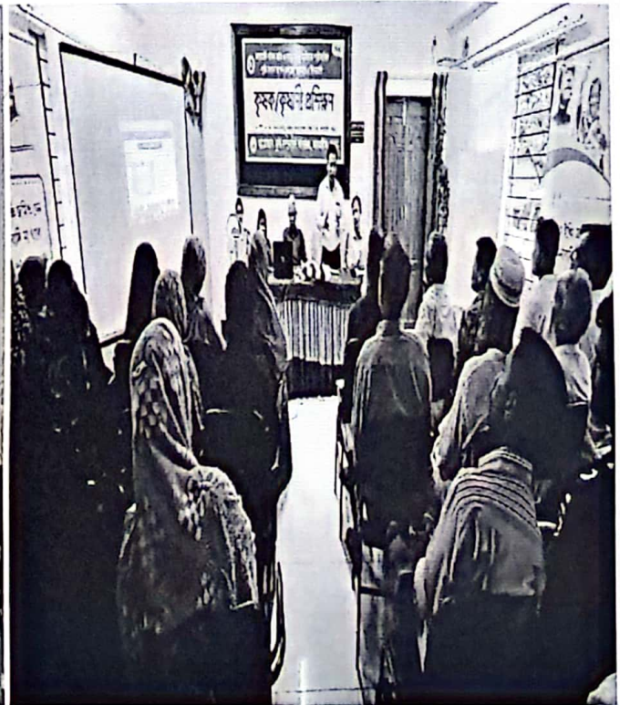
চিত্র: ২.৩.১ বিভিন্ন প্রকল্পের আওতায় প্রশিক্ষিত কৃষক