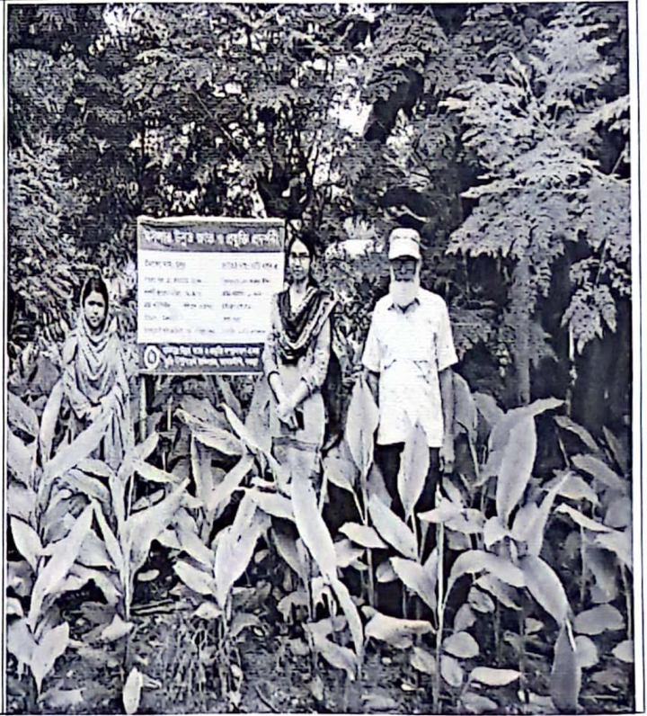
চিত্র: ১.৩.১ মাঠ কার্যক্রম পরিদর্শন