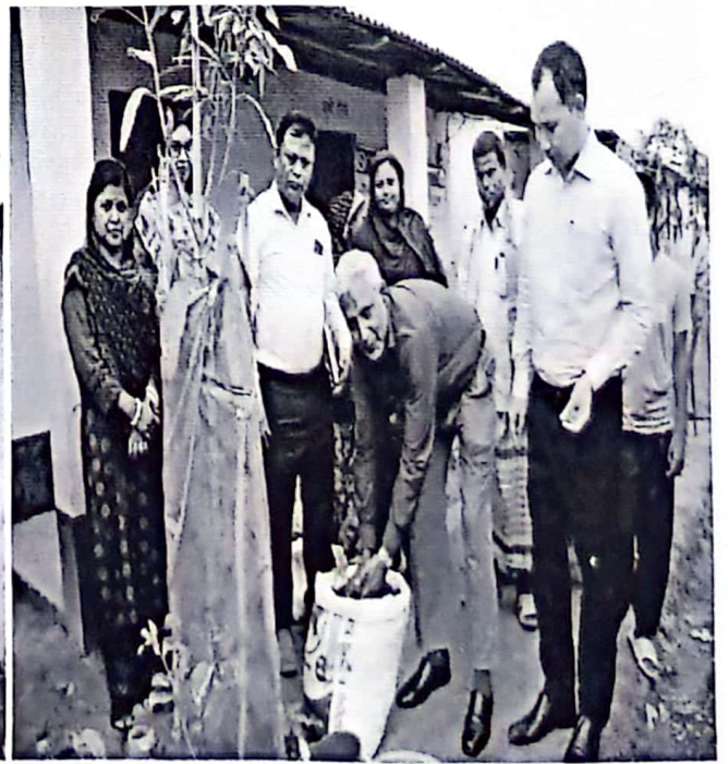
চিত্র: ১.৩.২ উদ্বর্তন কতৃপক্ষের বিভিন্ন কার্যক্রম পরিদর্শন